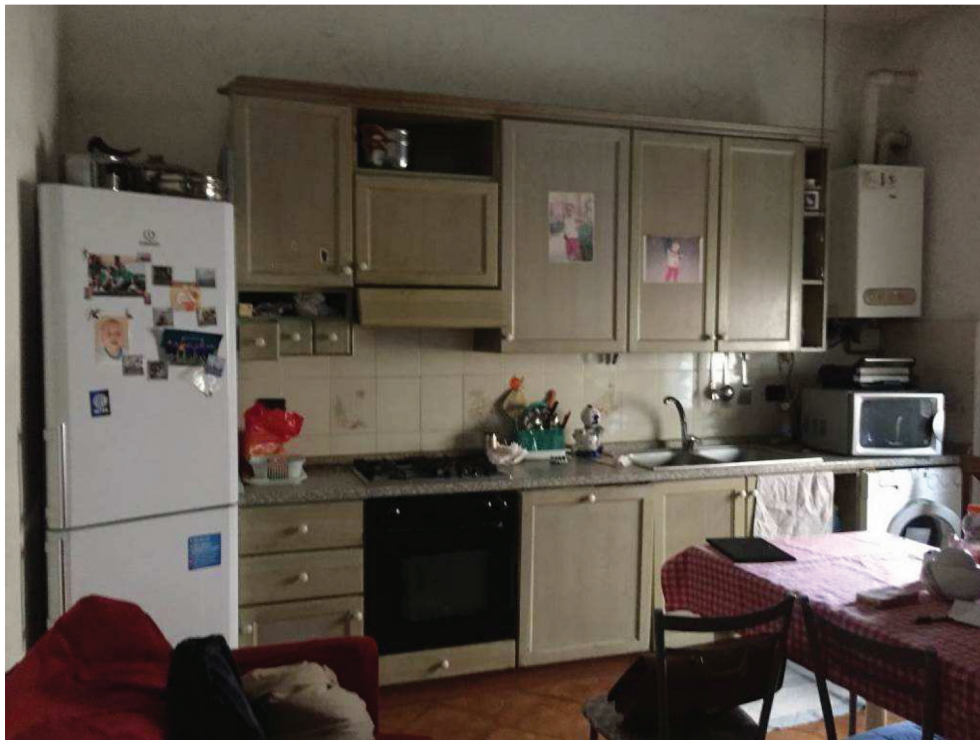
Fotografie n. 9 – Vista del locale angolo cottura/soggiorno/pranzo