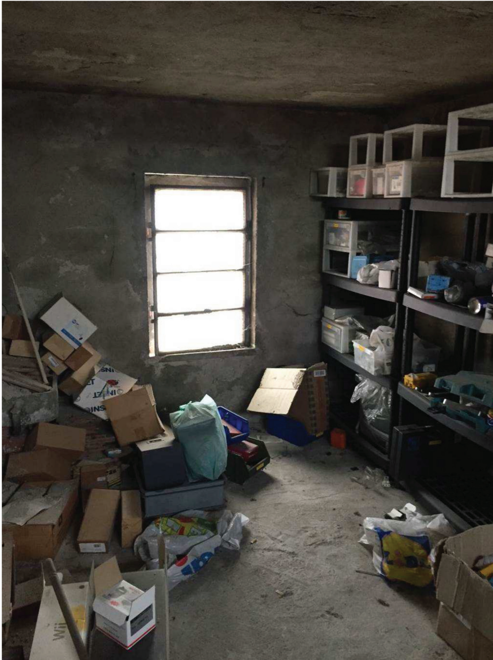
Fotografia n. 12 – Vista del locale deposito, al piano secondo sottotetto

Giudice: Dott. Giuseppe Fiengo Custode Giudiziario: SIVAG S.P.A. Perito: Dott. Arch. Mariangela Sirena