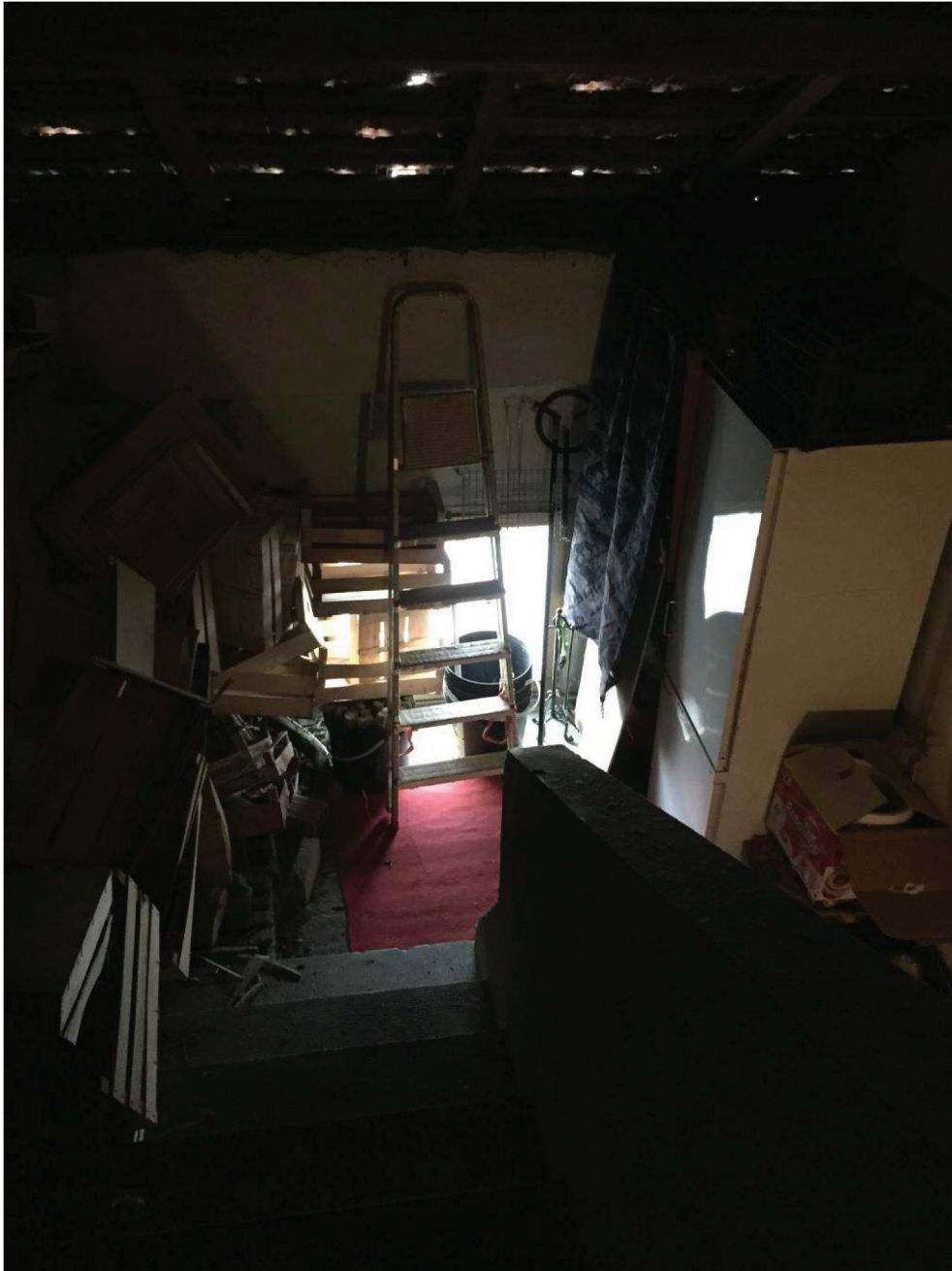
Fotografia n. 11 – Vista, dal vano scala, del locale sottotetto aperto

Giudice: Dott. Giuseppe Fiengo Custode Giudiziario: SIVAG S.P.A. Perito: Dott. Arch. Mariangela Sirena