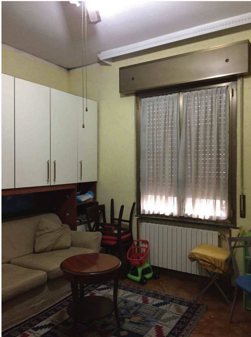
Fotografia n. 7 – Vista del locale camera da letto