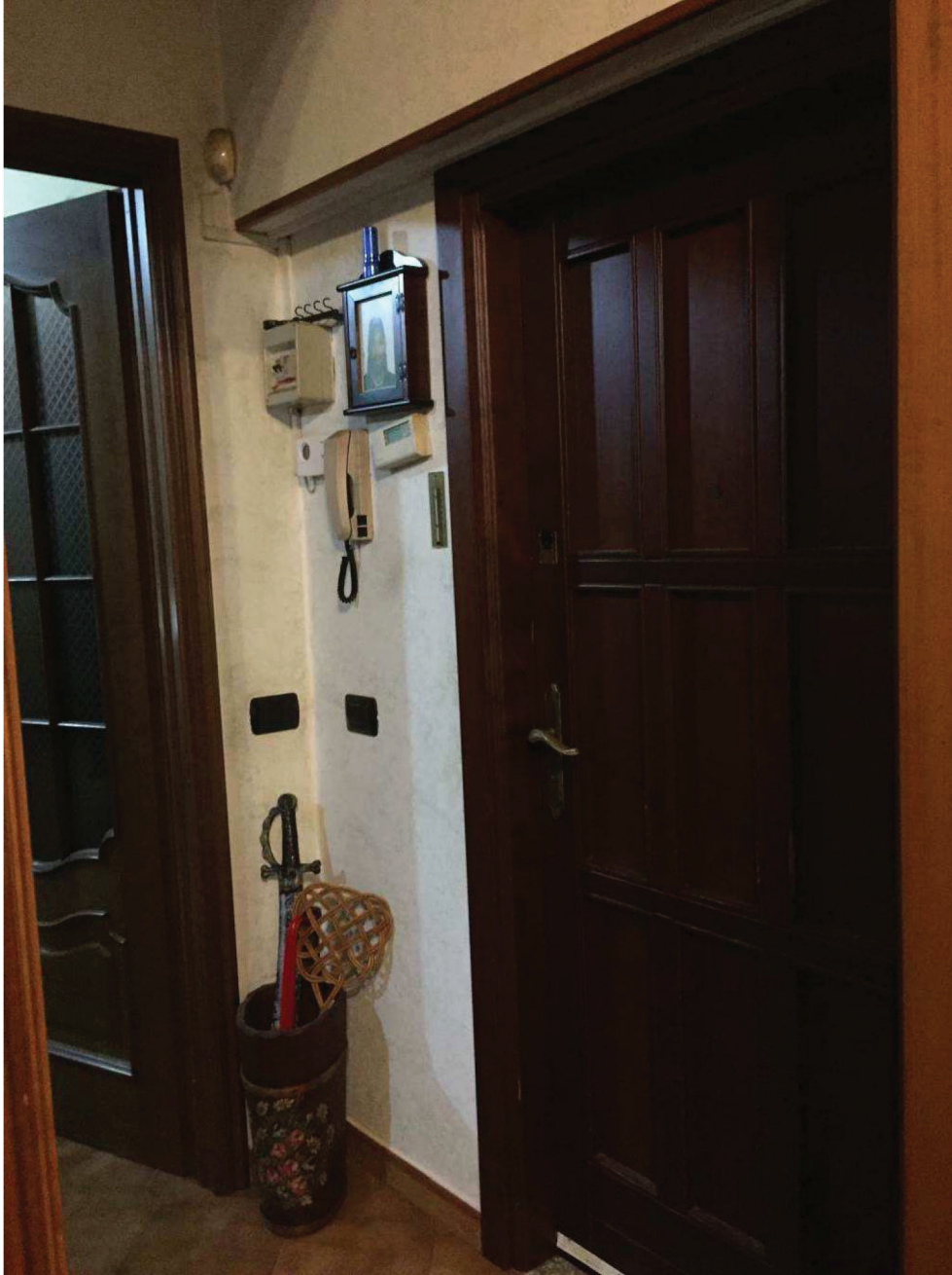
Fotografia n. 6 – Vista dell'ingresso dall'interno dell'appartamento pignorato