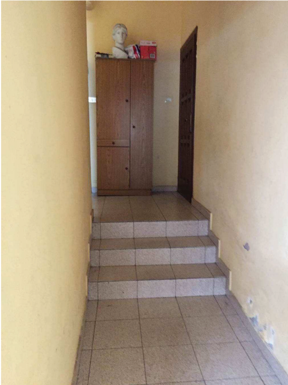
Fotografia n. 5 – Vista, dall' ingresso del vano scale, della rampa che conduce sulla destra all'appartamento pignorato