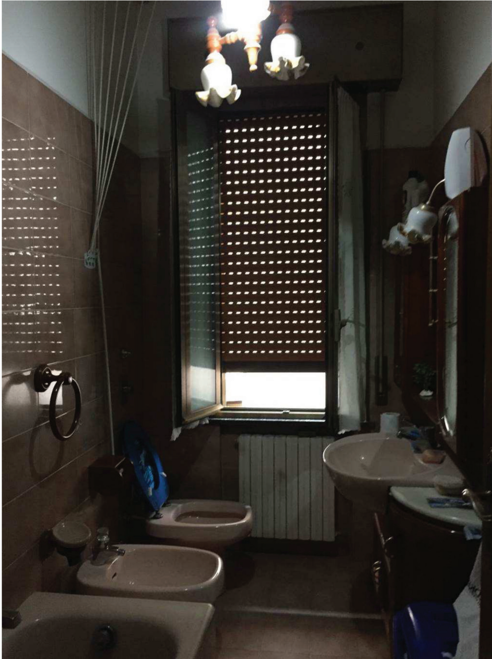
Fotografia n. 8 – Vista del locale bagno