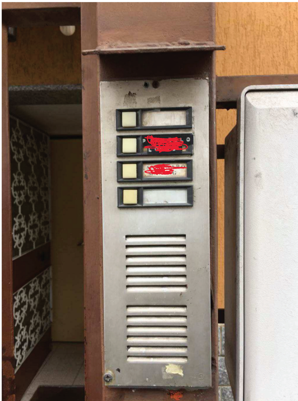
Fotografia n. 4 – Vista del citofono, posto sul cancello pedonale, su cui è presente anche il nome del debitore