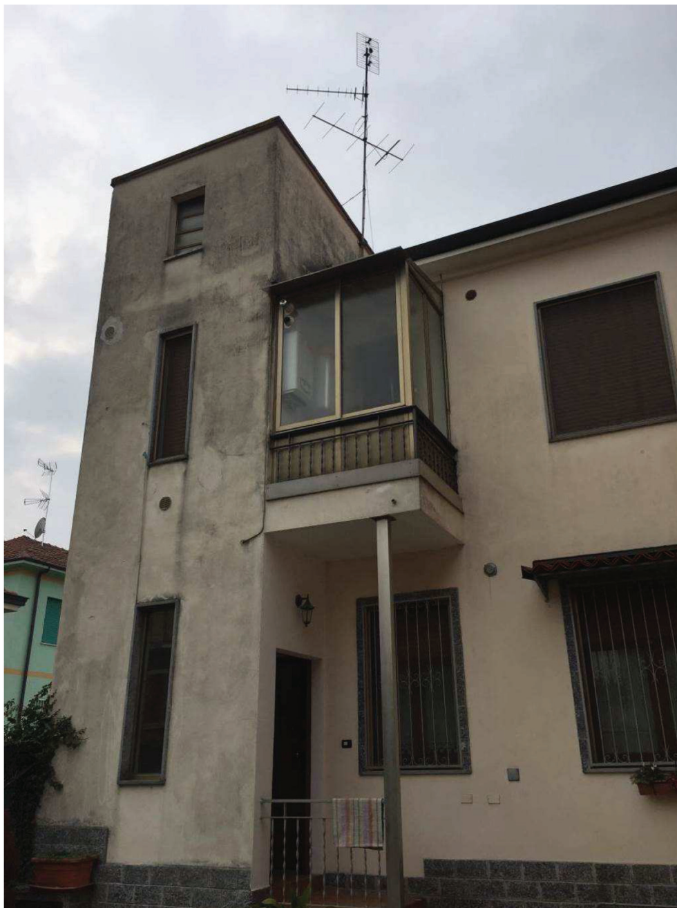
Fotografia n. 3 – Vista dal cortile comune del secondo fabbricato, con accesso dalla Via Carducci, ed in particolare del locale deposito, localizzato in alto a sinistra

Giudice: Dott. Giuseppe Fiengo Custode Giudiziario: SIVAG S.P.A. Perito: Dott. Arch. Mariangela Sirena