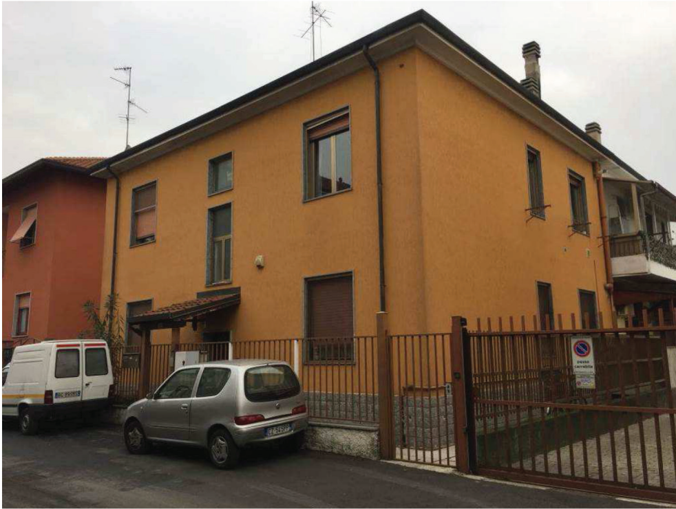
Fotografie n. 1/2 – Vista del primo fabbricato, su Via Carducci n. 31, e dell'ingresso pedonale che conduce anche all'appartamento pignorato