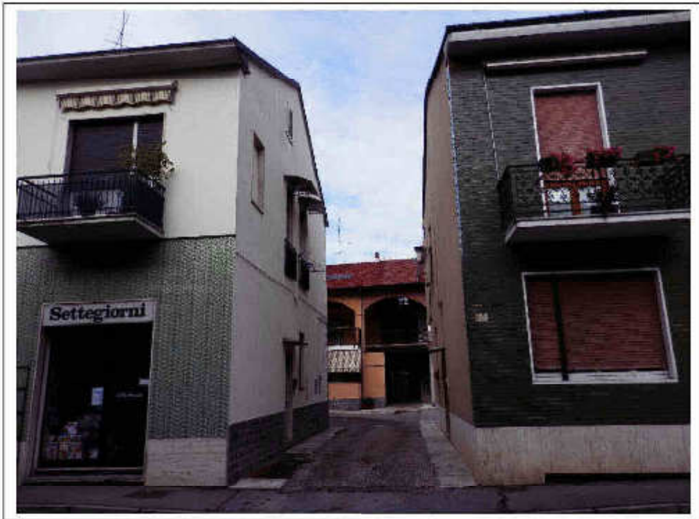
Fotografia n°1 – Vista dell'accesso alla corte interna del complesso edilizio.