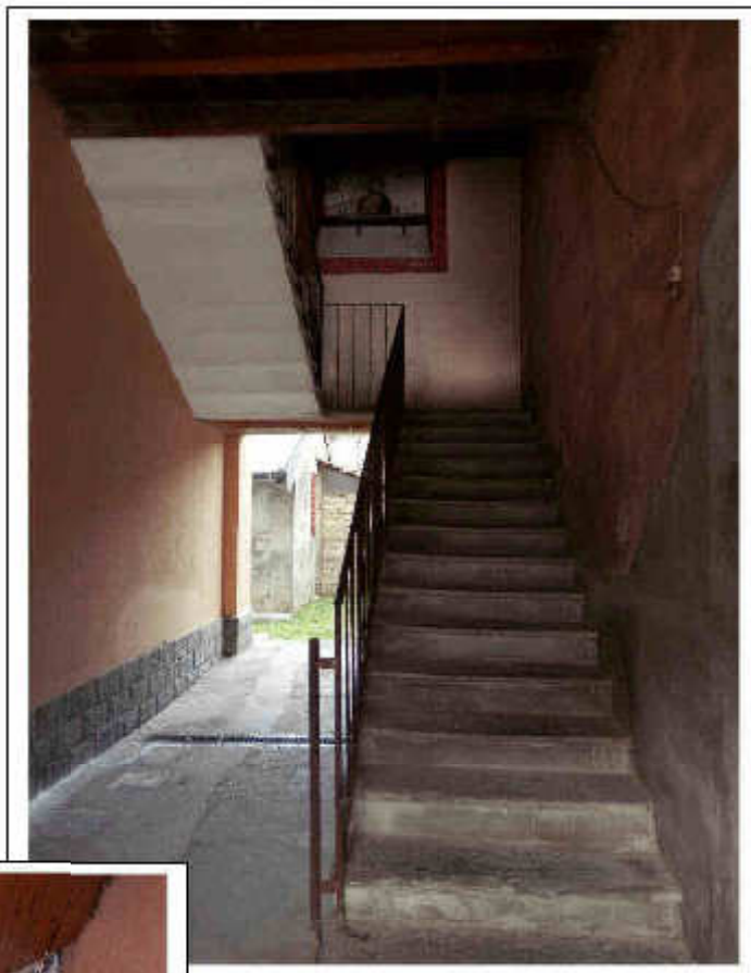
Fotografia n°3 – Vista del vano scala condominiale.