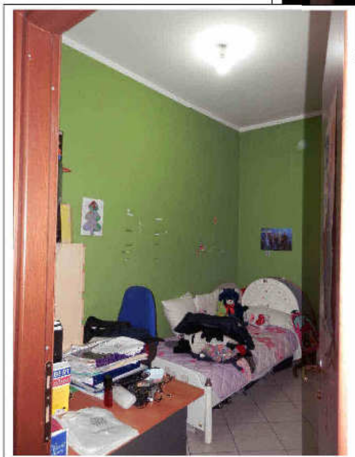
Fotografia n°8 – Vista della camera singola.