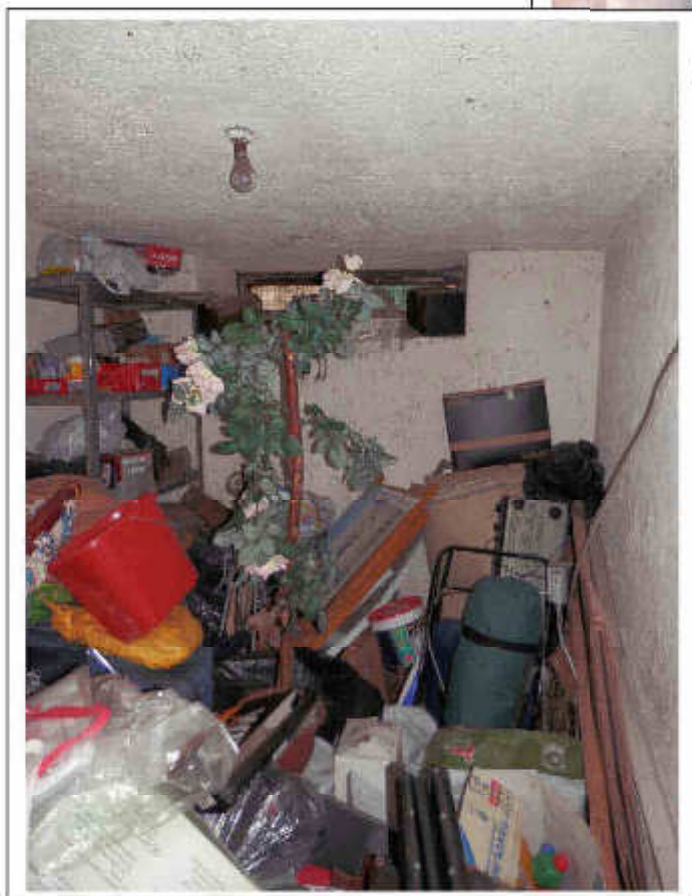
Fotografia n°12 – Vista della cantina di pertinenza dell'immobile.