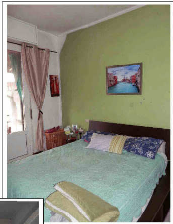
Fotografia n°9 – Vista della camera matrimoniale.