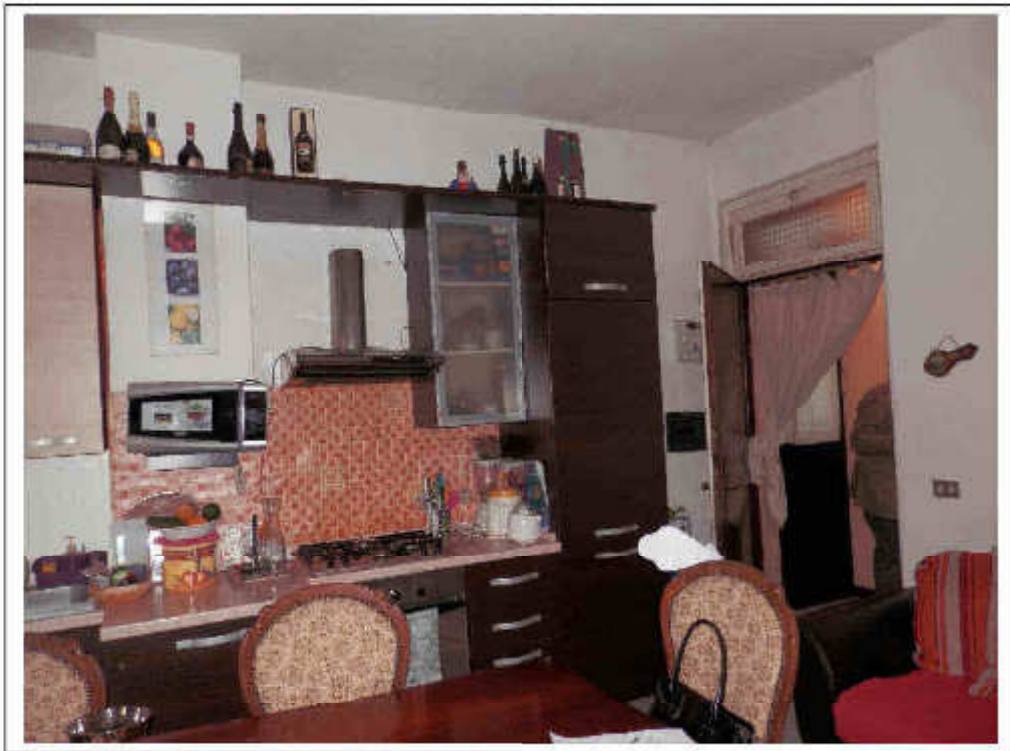
Fotografia n°5 – Vista della cucina e della porta d'accesso al locale dal passaggio comune.