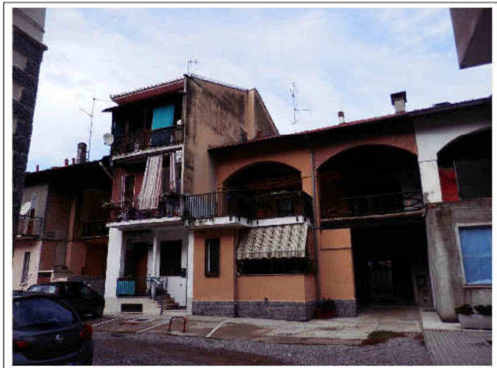
Fotografia n°2 – Vista della facciata del fabbricato rivolta su cortile interno.