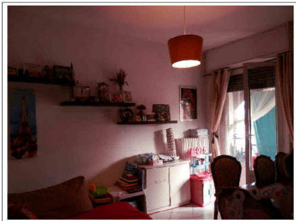
Fotografia n°6 – Vista del locale cucina.