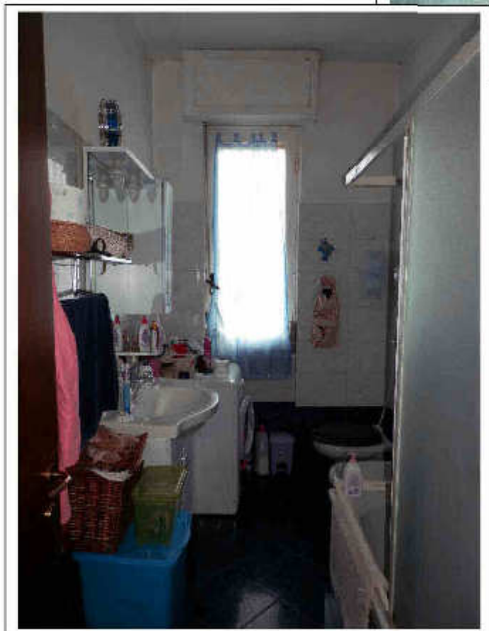
Fotografia n°10 – Vista del bagno.