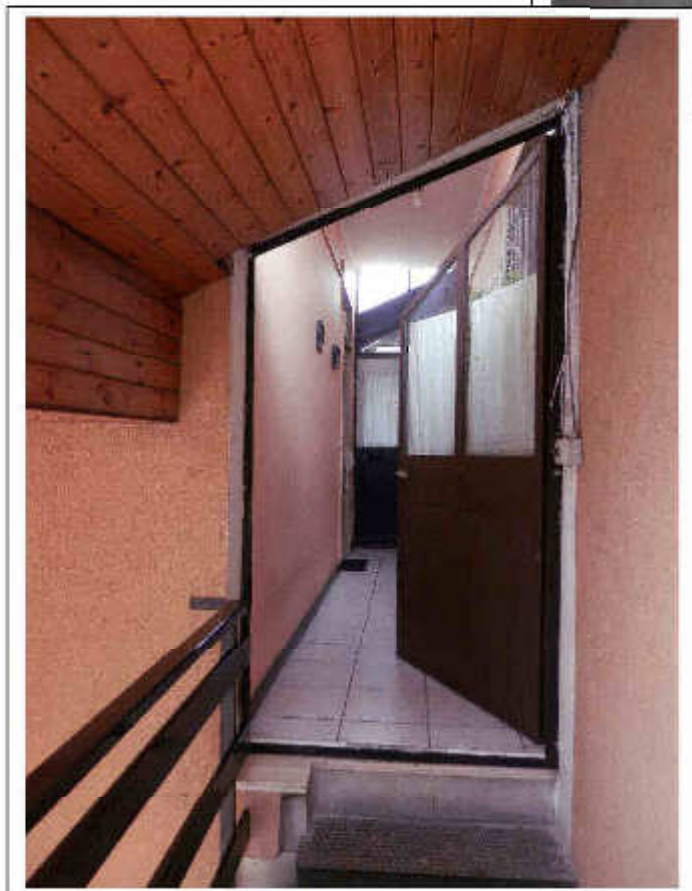
Fotografia n°4 – Vista della porta d'accesso al passaggio comune che consente di raggiungere l'unità immobiliare.