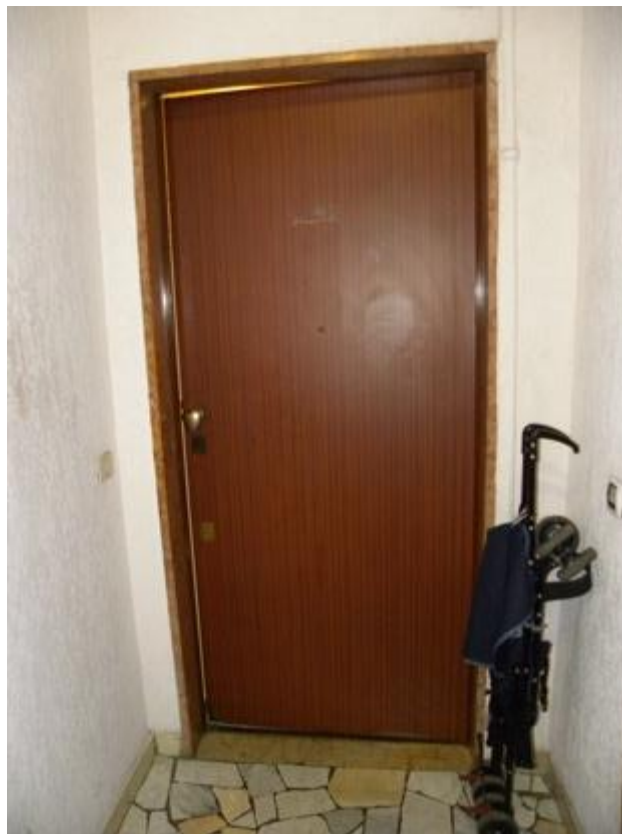
Porta di Ingresso dell'Appartamento