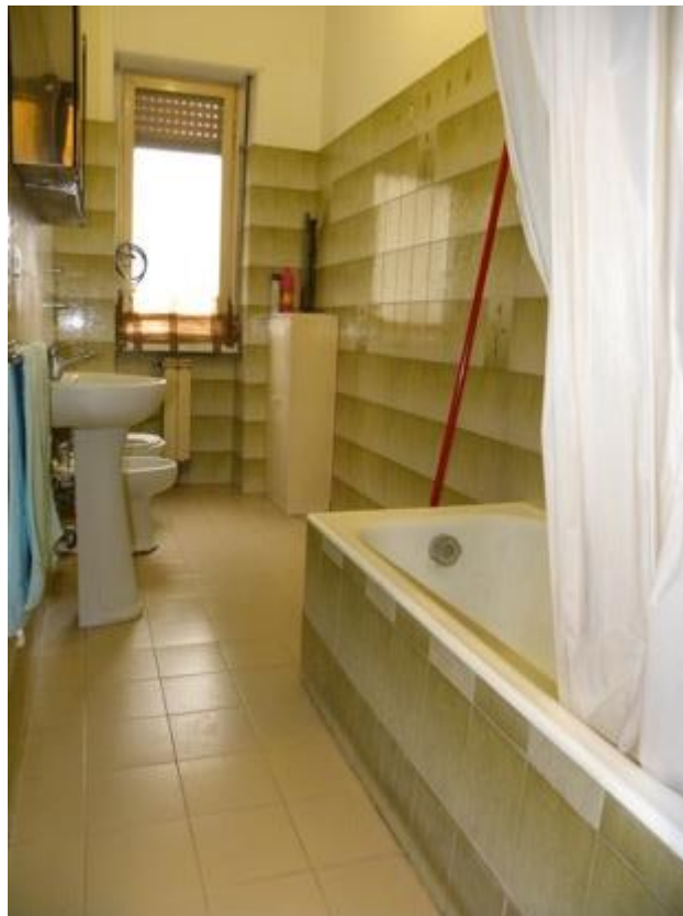
Bagno – Foto 1