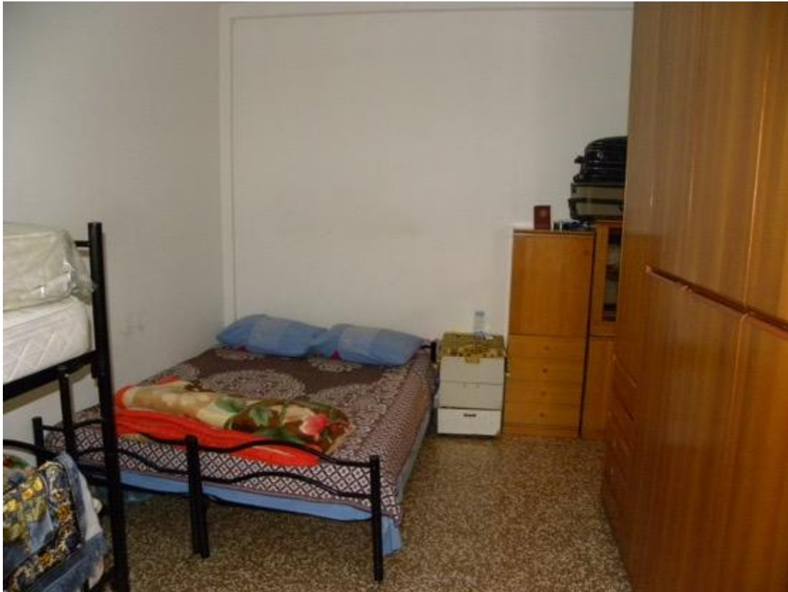
Camera – Foto 1