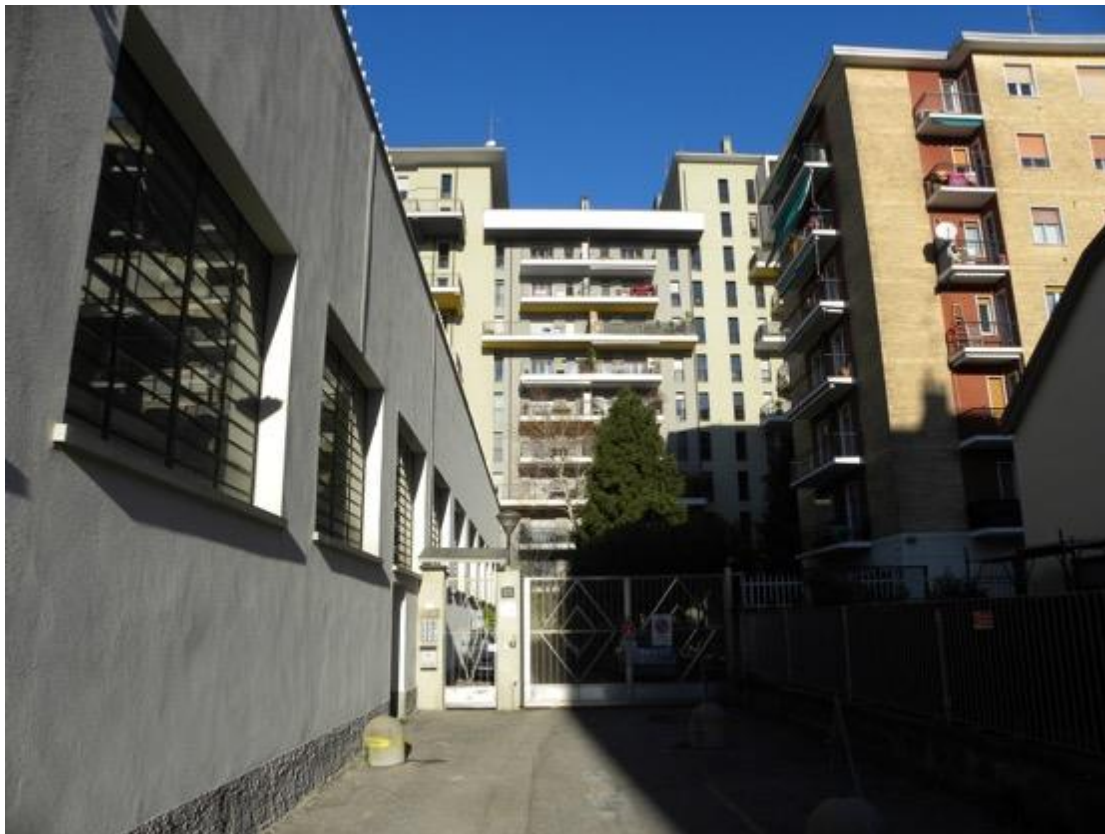
Vista Esterna del Fabbricato – Foto 1