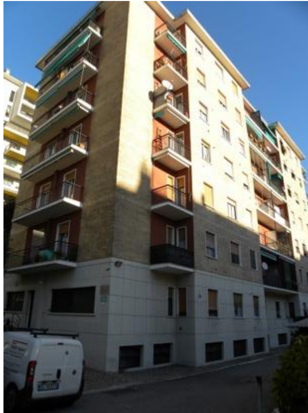
Vista Esterna del Fabbricato – Foto 2