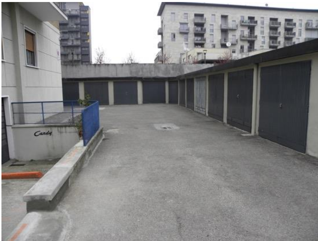
Parti Comuni – Zona di Accesso ai Box