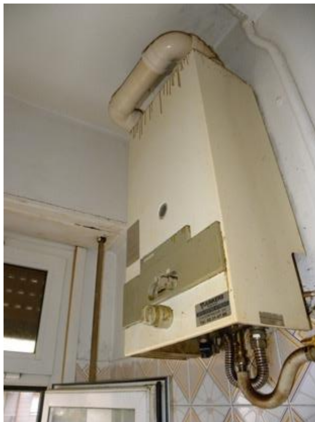
Dettaglio Caldaia per ACS