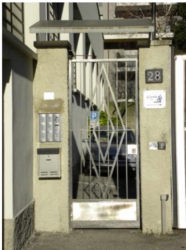
Cancello di Accesso al Fabbricato