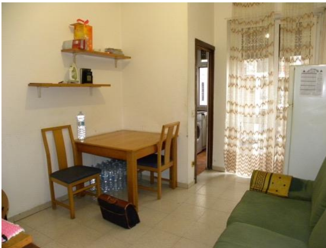
Sala – Foto 1

Cel. 349/84.33.115 – mail: ing.maurizio.nobile@tiscali.it Ordine degli Ingegneri della provincia di Milano n° A 24088 Albo Certificatori Energetici regione Lombardia n° 8083 Albo CTU Tribunale di Milano n° 12298