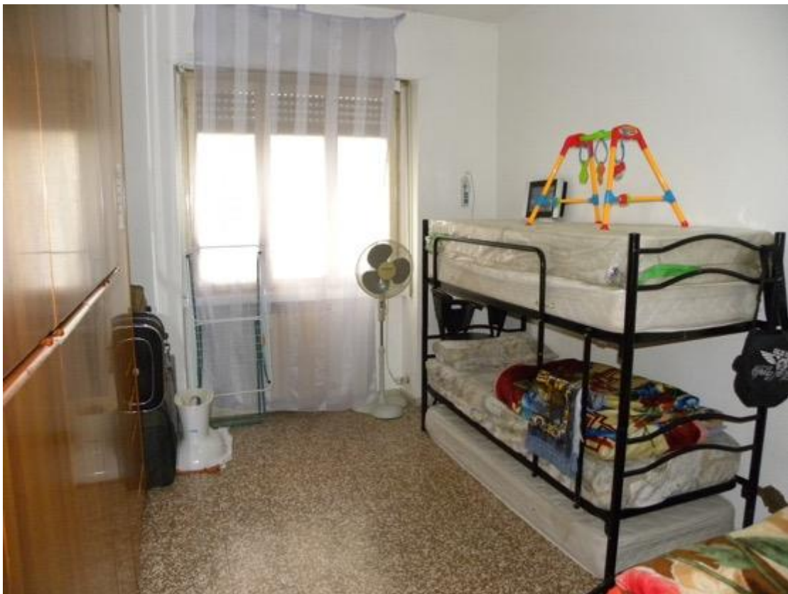
Camera – Foto 2