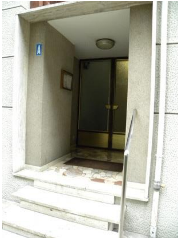
Portone di Ingresso al Fabbricato