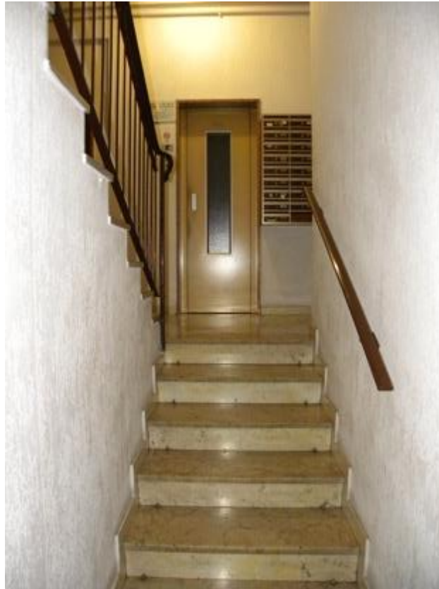
Parti Comuni – Scale e Ascensore