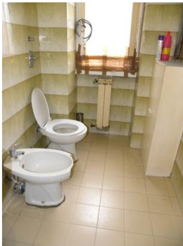
Bagno – Foto 2

Cel. 349/84.33.115 – mail: ing.maurizio.nobile@tiscali.it Ordine degli Ingegneri della provincia di Milano n° A 24088 Albo Certificatori Energetici regione Lombardia n° 8083 Albo CTU Tribunale di Milano n° 12298