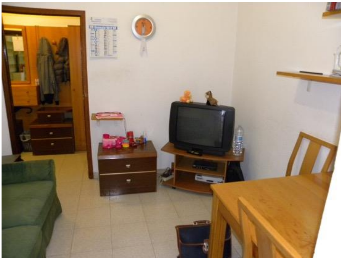
Sala – Foto 2