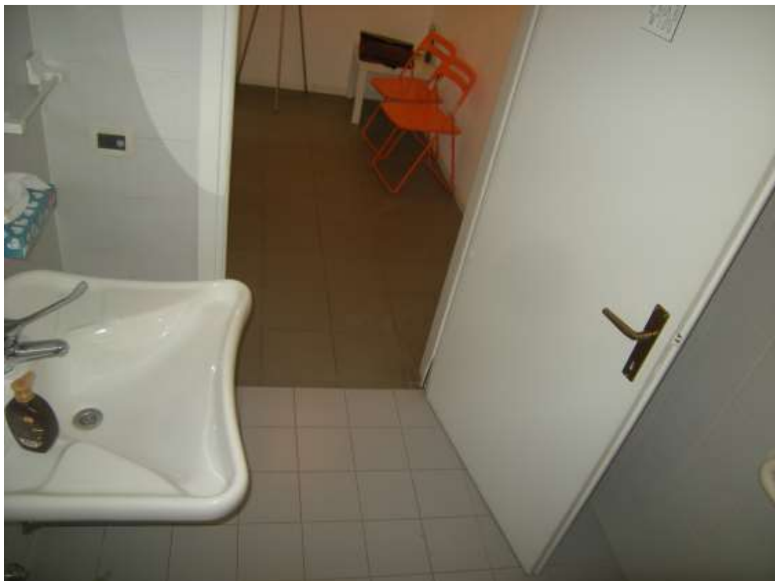
Sacile, viale della Repubblica n°9 – Il bagno 1.