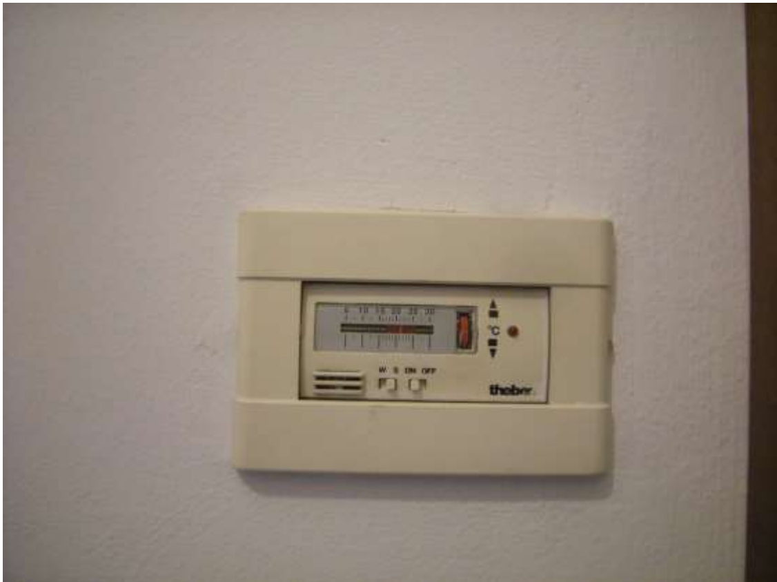
Sacile, viale della Repubblica n°9 – In alto un particolare del condizionatore, in basso il termostato ambiente.