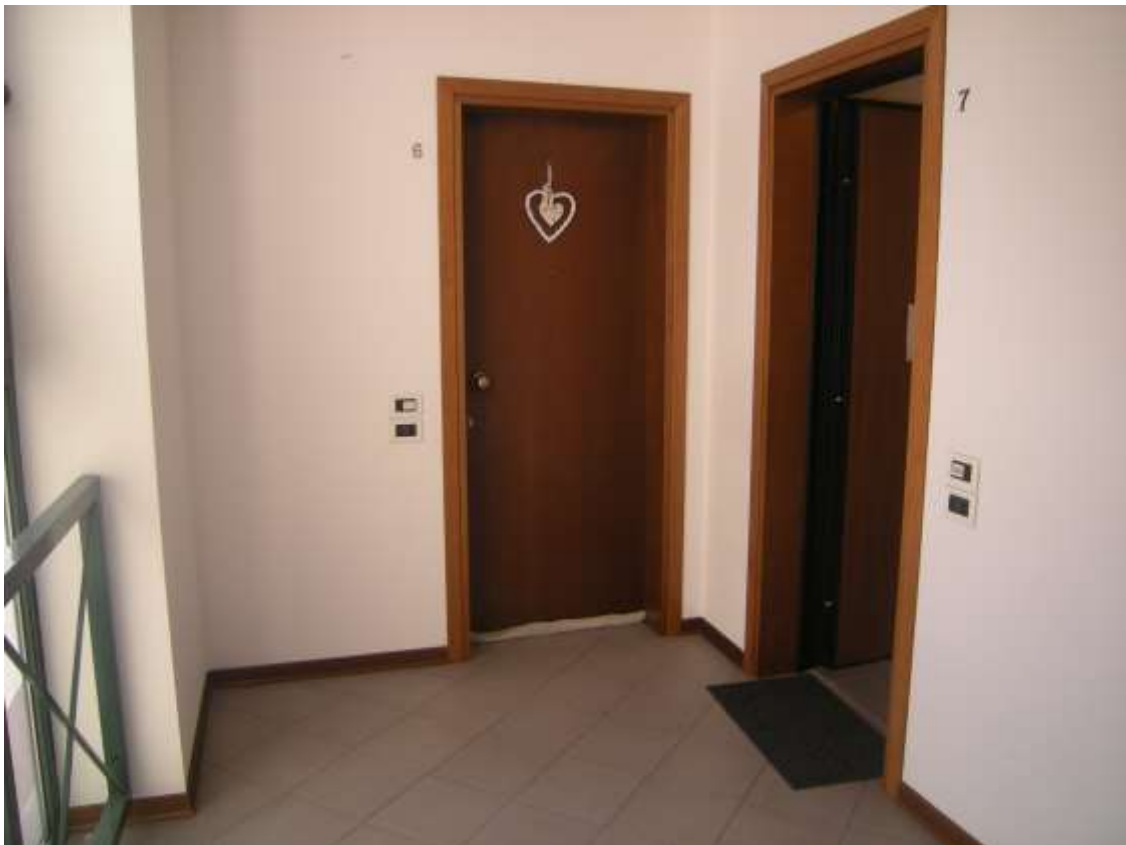
Sacile, viale della Repubblica n°9 – Il pianerottolo di arrivo al piano primo e l'ingresso all'appartamento.