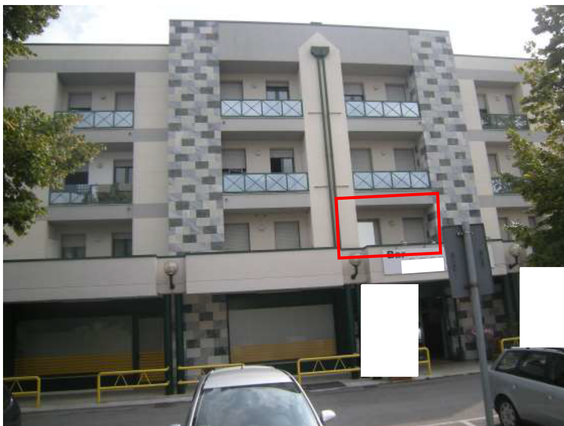
Sacile, viale della Repubblica - Il prospetto a nord della palazzina, in basso il prospetto dell'immobile oggetto della procedura.