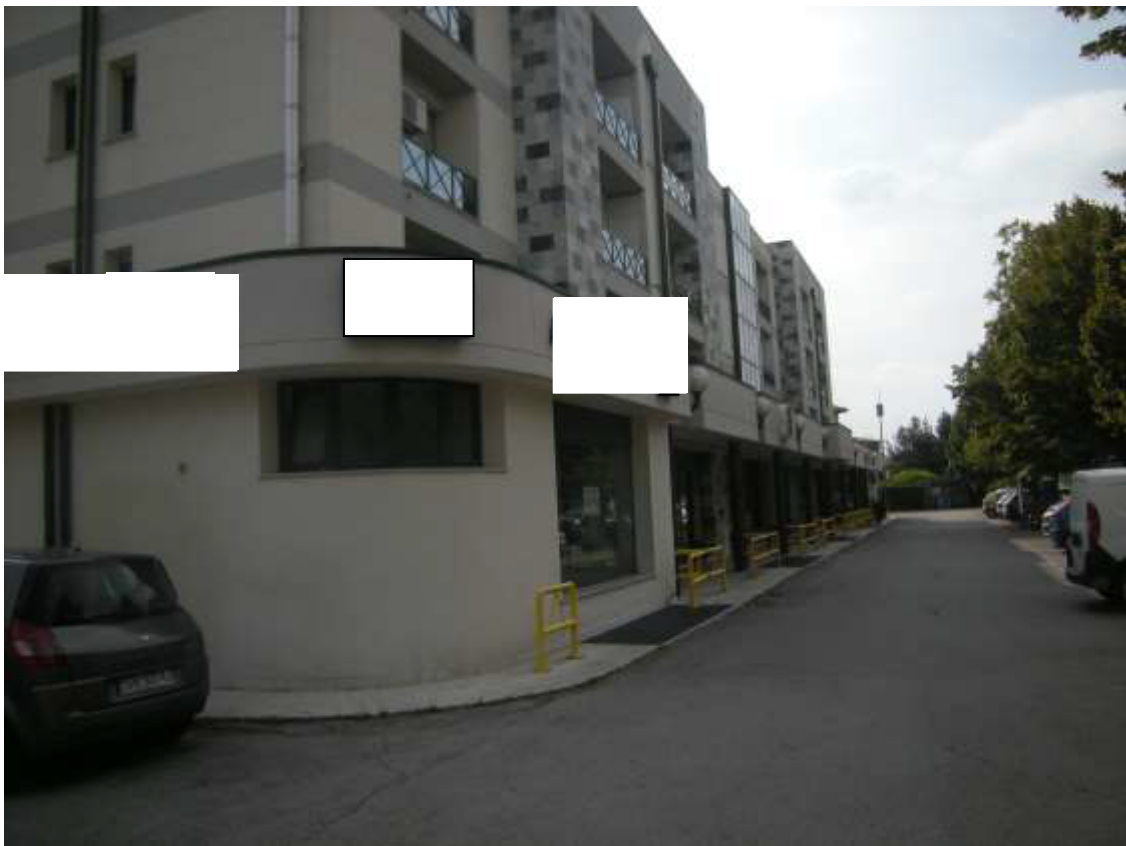
Sacile, viale della Repubblica - Il prospetto a ovest ed a est della palazzina.