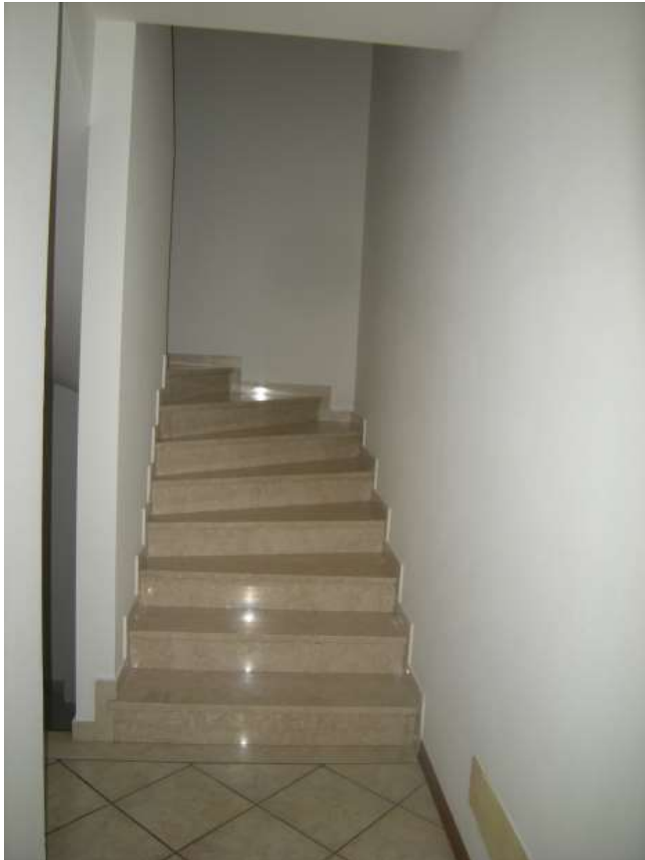
Brugnera, via della Fratta n. 29 - Il vano scala.