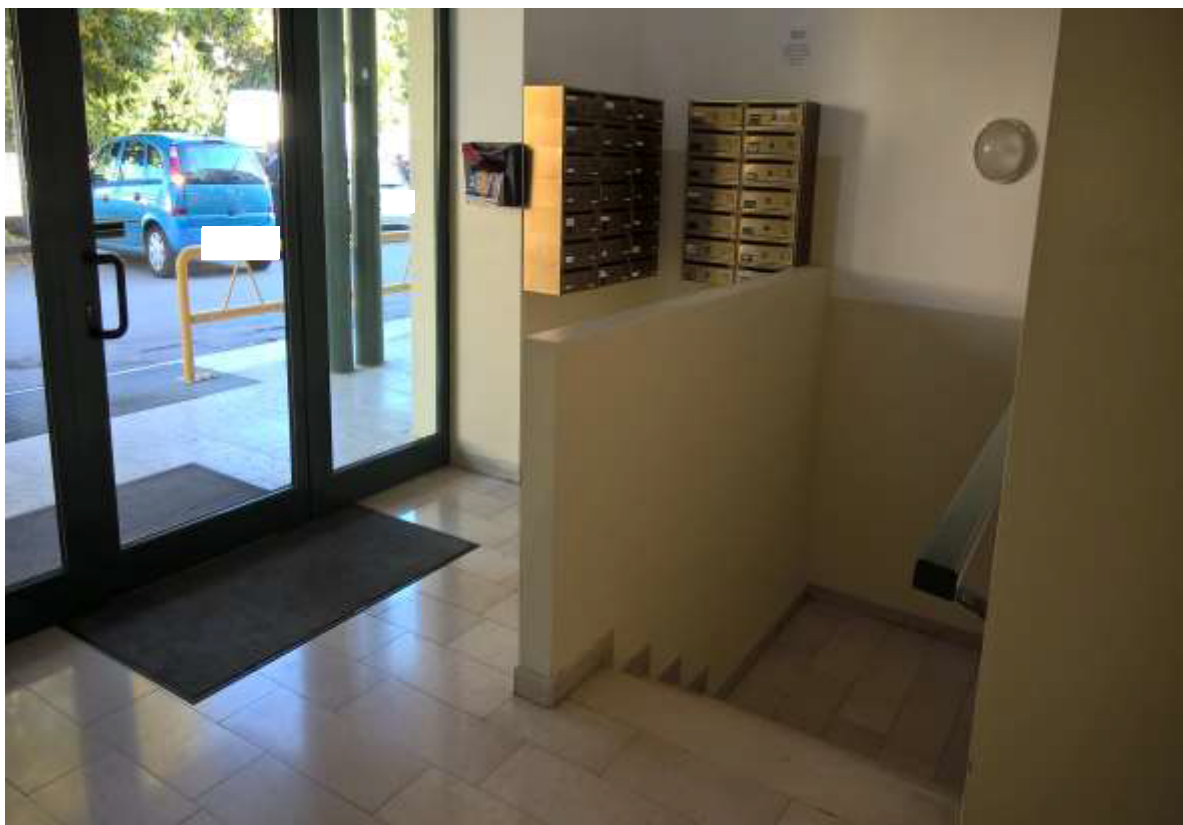
Sacile, viale della Repubblica n° 9 - L'ingresso dell'edificio e il vano scala.