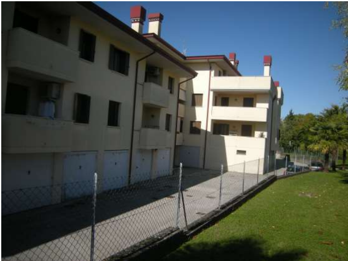
Brugnera, via della Fratta n. 29 – Le parti comuni.