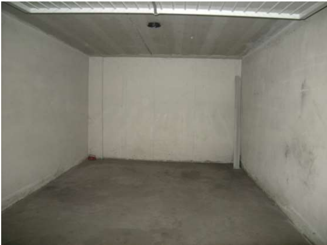
Sacile, viale della Repubblica n°9 – Il garage.