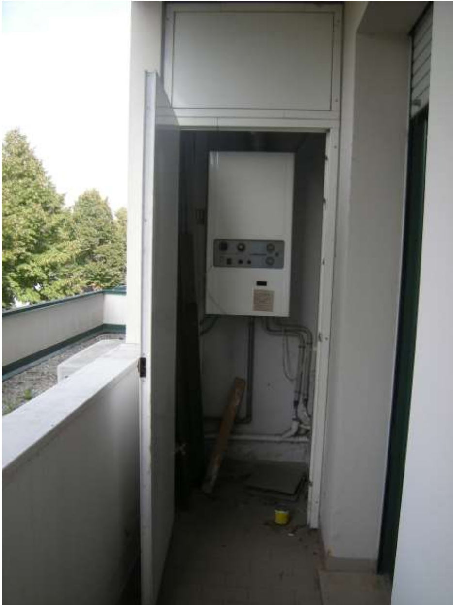
Sacile, viale della Repubblica n°9 - Il terrazzo a livello.