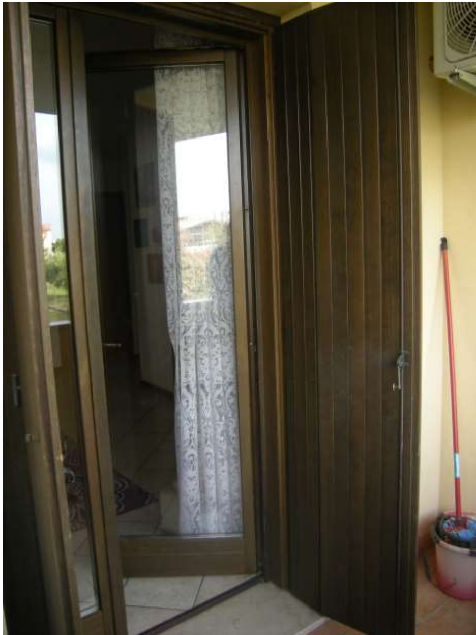
Brugnera, via della Fratta n. 29 - L'infisso esterno.