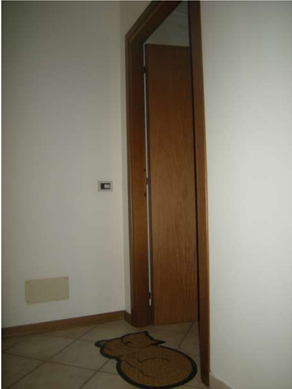
Brugnera, via della Fratta n. 29 - L'ingresso all'appartamento.