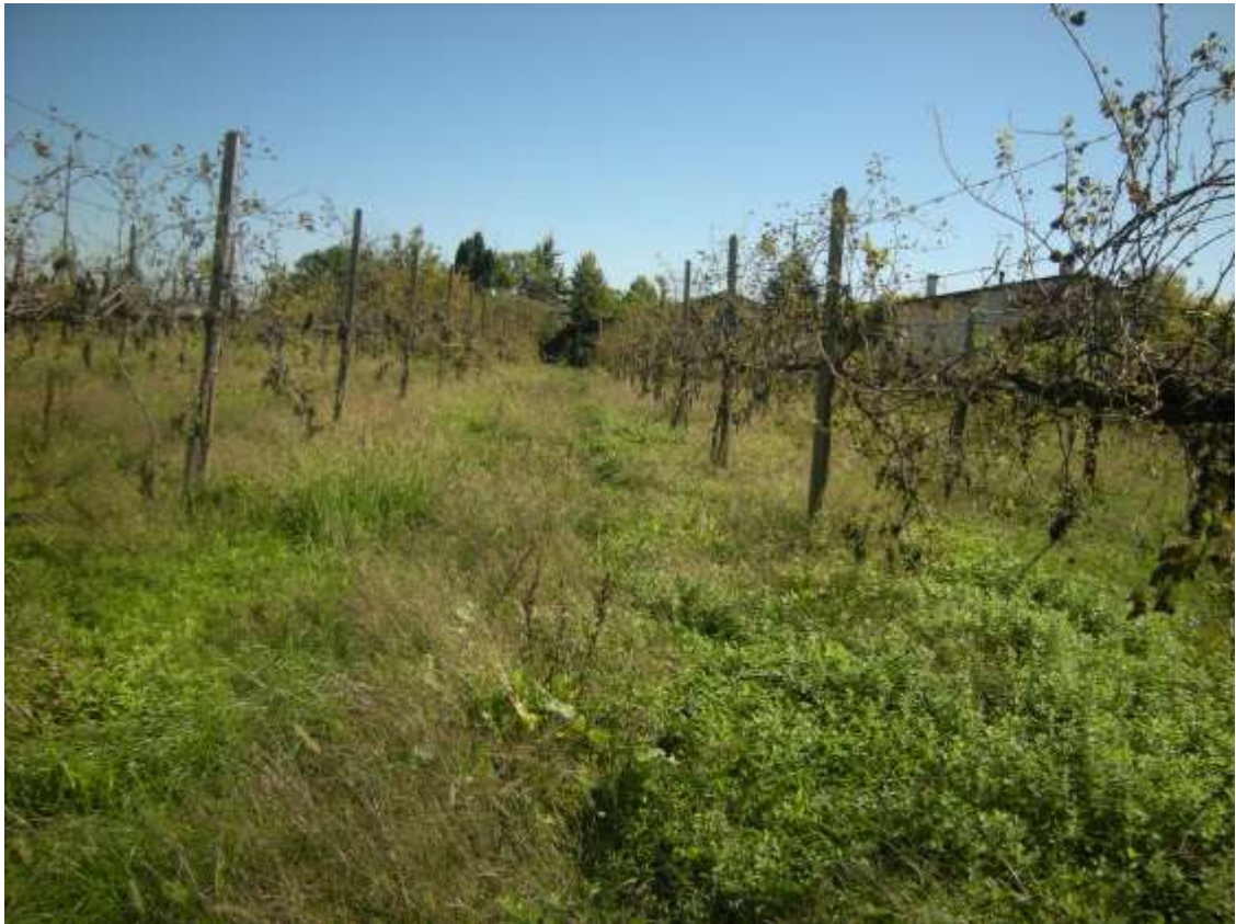
Brugnera, via Levada n. 23 – Il terreno al foglio 3, part. 182.