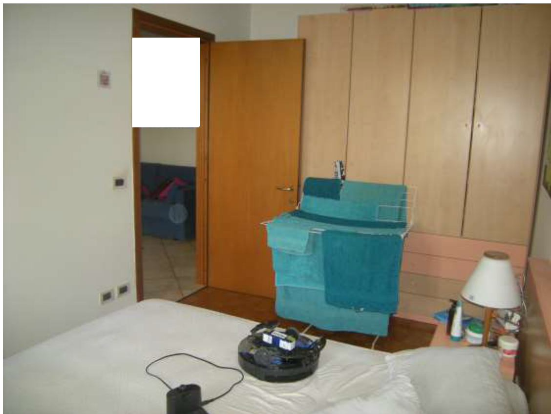
Brugnera, via della Fratta n. 29 - Il vano 2.