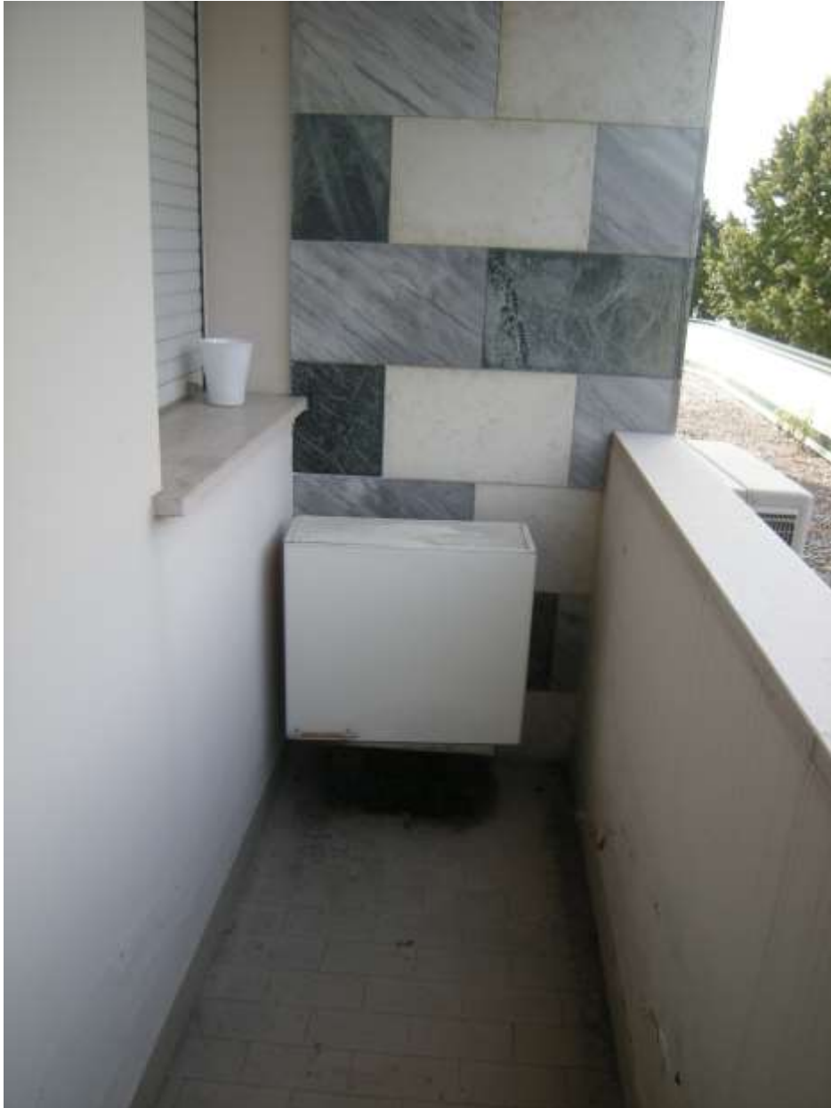
Sacile, viale della Repubblica n°9 – Il terrazzo a livello.