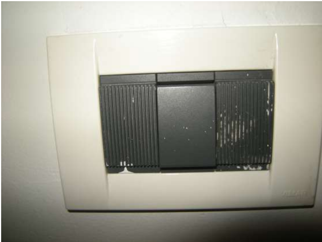
Sacile, viale della Repubblica n°9 – Particolari dell'impianto elettrico dell'appartamento.