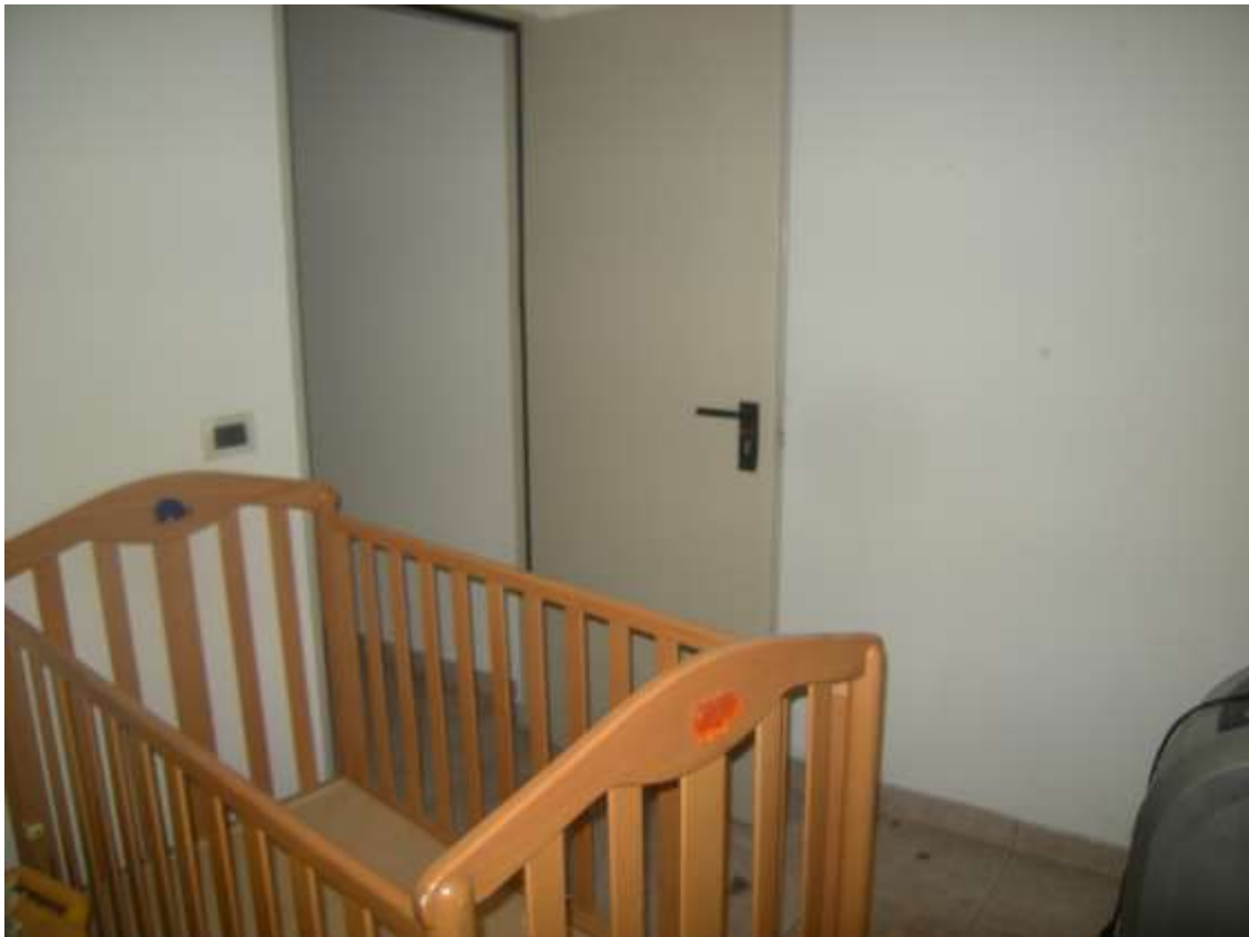
Brugnera, via della Fratta n. 29 – La cantina.