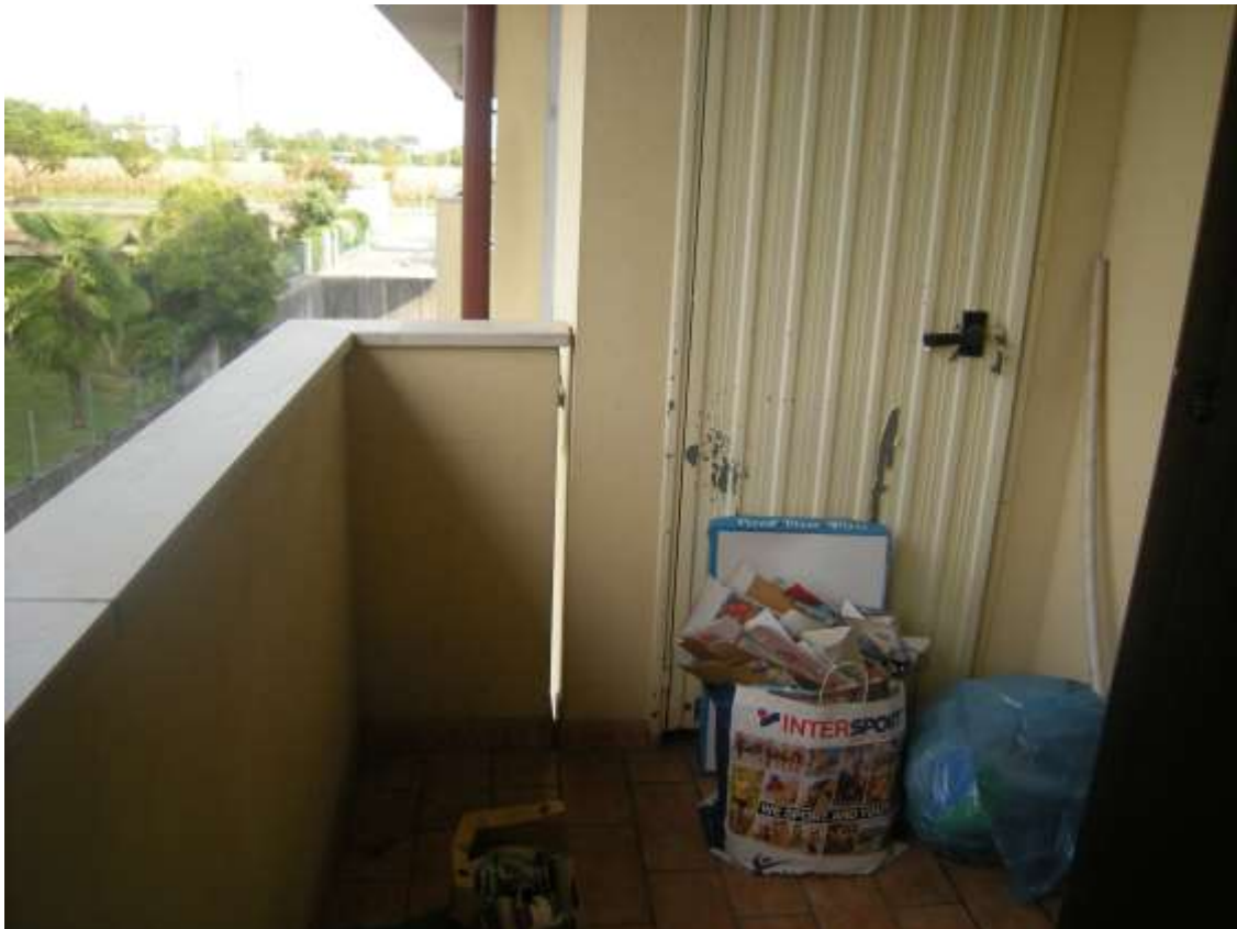
Brugnera, via della Fratta n. 29 - Il terrazzo a livello.