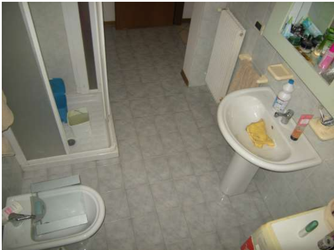
Brugnera, via della Fratta n. 29 - Il bagno 1.