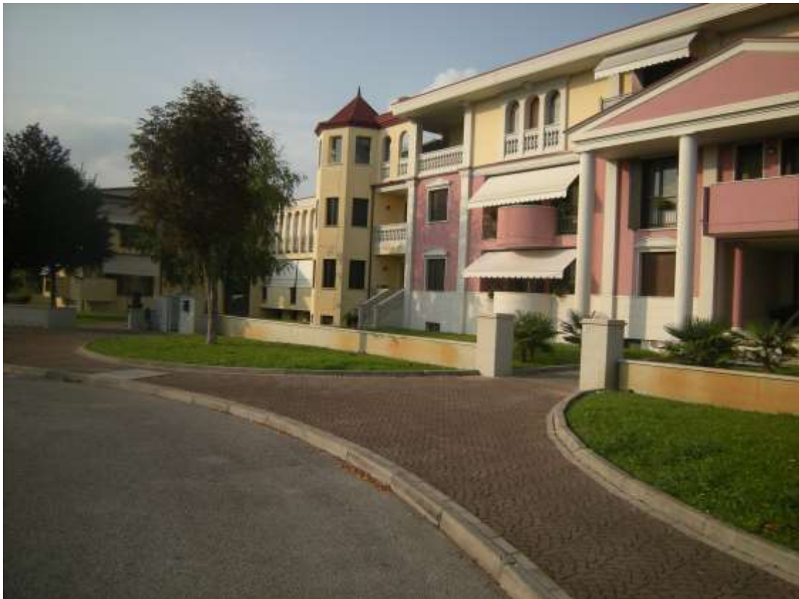
Brugnera, via della Fratta n. 29 - Il prospetto a nord est della complesso residenziale.