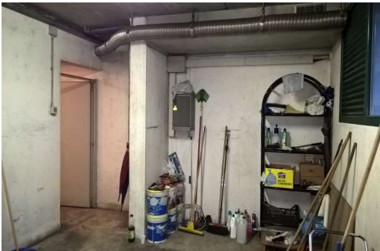
Sacile, viale della Repubblica n°9 – Le parti comune dell'immobile: il deposito.