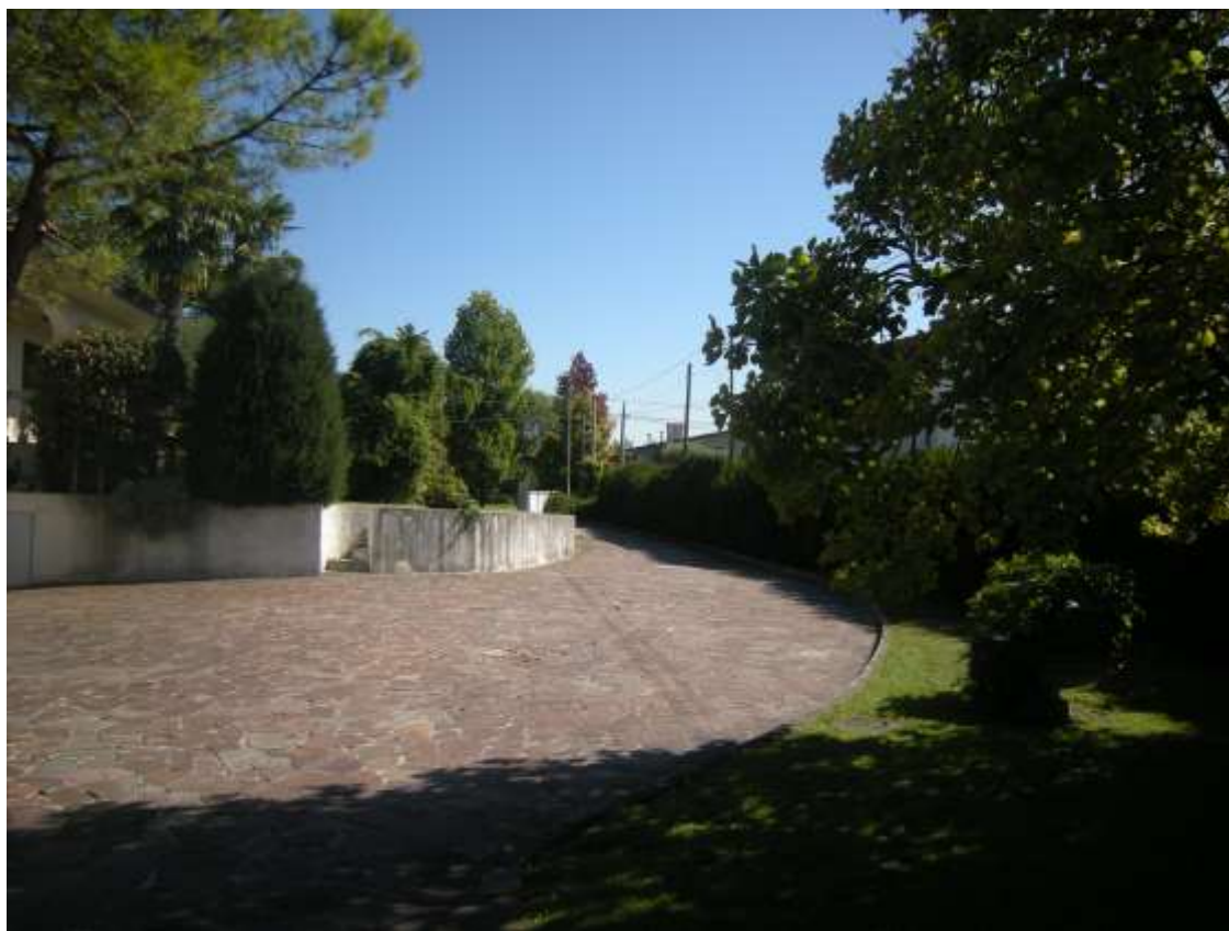
Brugnera, via Levada n. 23 – La strada d'accesso al terreno al foglio 3, part. 182.