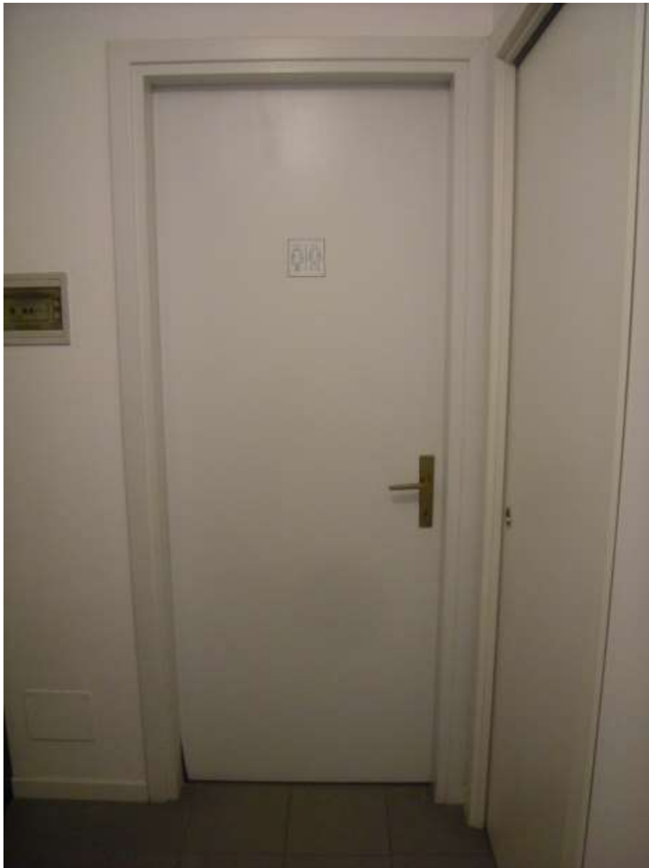
Sacile, viale della Repubblica n°9 - Le porte interne.