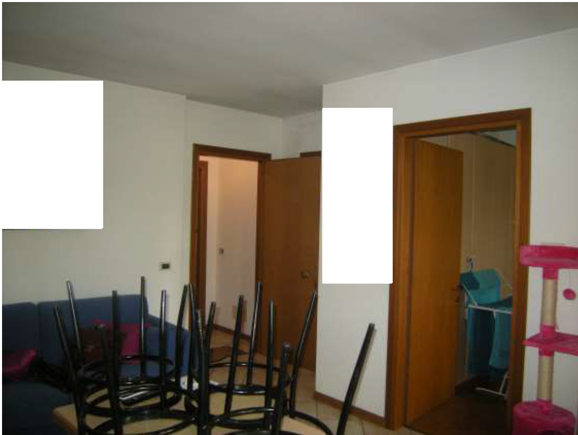
Brugnera, via della Fratta n. 29 - Il vano 1.