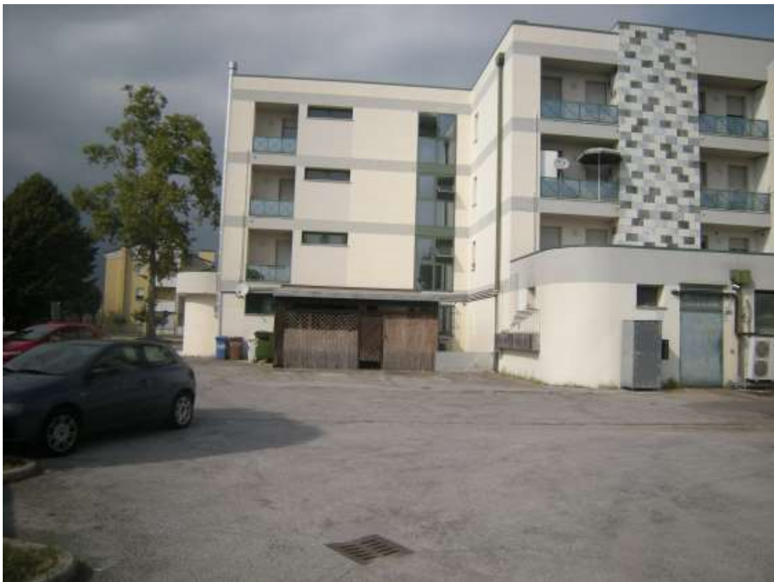
Sacile, viale della Repubblica - Il prospetto sud della palazzina.