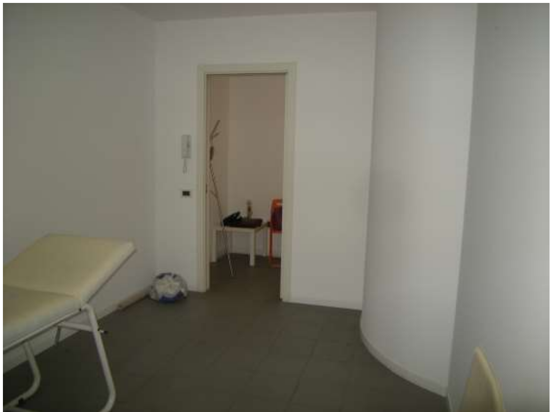
Sacile, viale della Repubblica n°9 – Il vano 1.