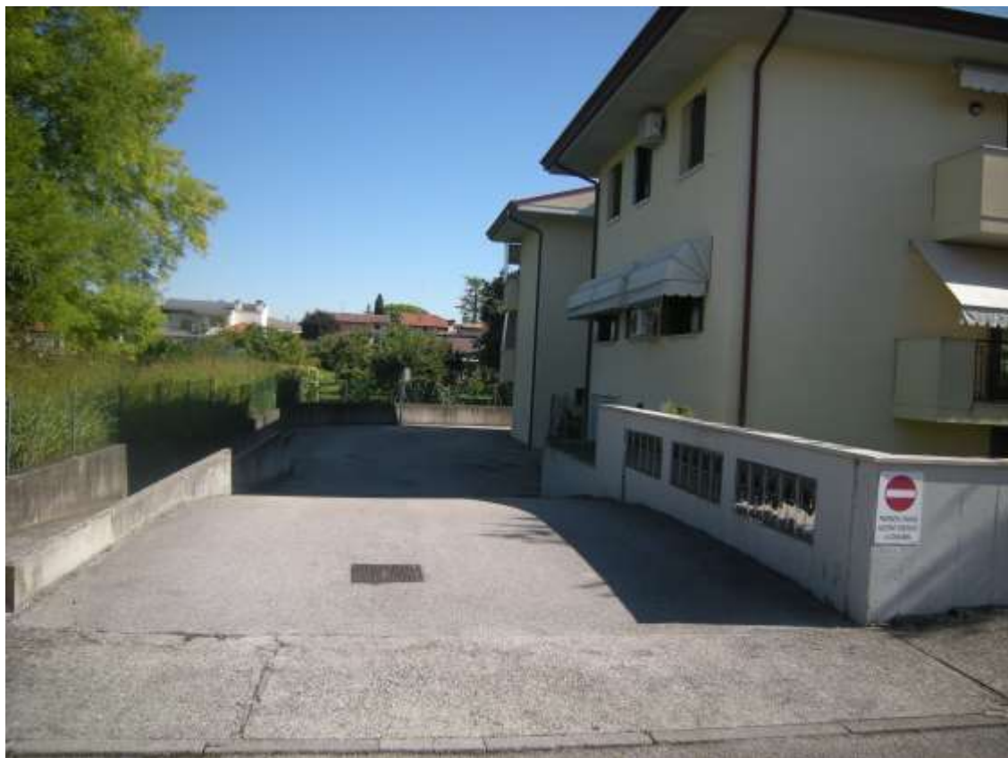
Brugnera, via della Fratta n. 29 – Le parti comuni.