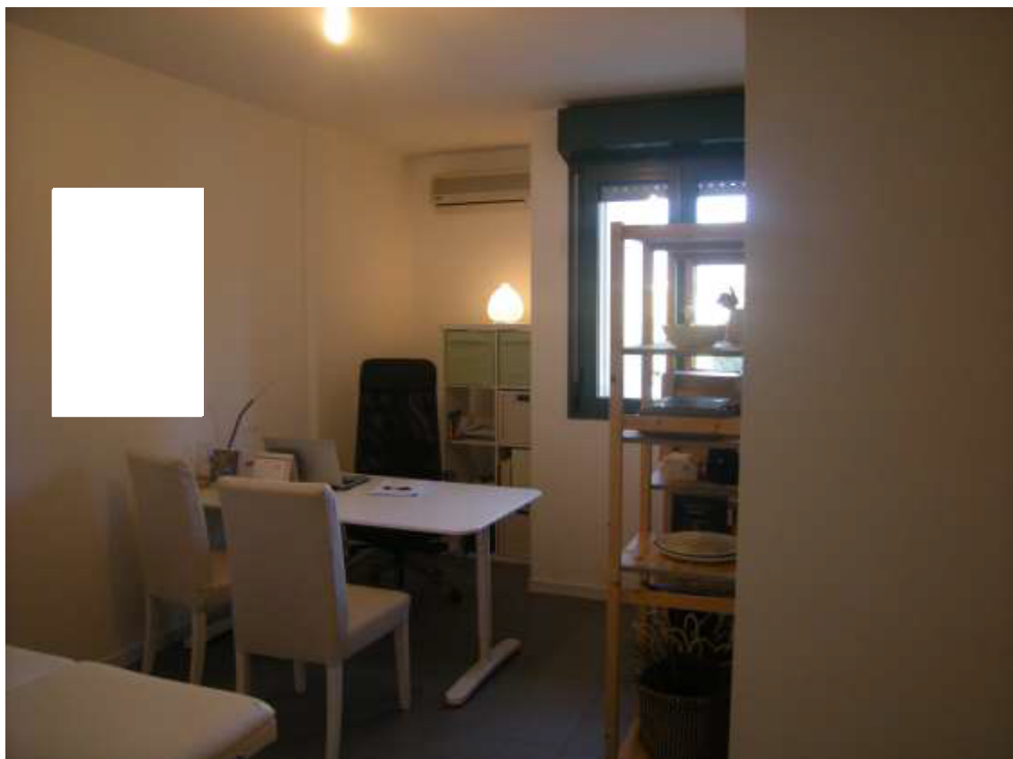
Sacile, viale della Repubblica n°9 – Il vano 2.