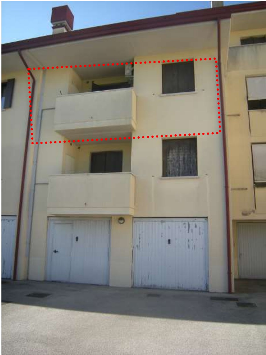
Brugnera, via della Fratta n. 29 - L'appartamento oggetto dell'esecuzione.