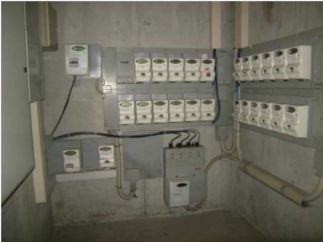
Sacile, viale della Repubblica n°9 – il vano scala ed il vano contatori.