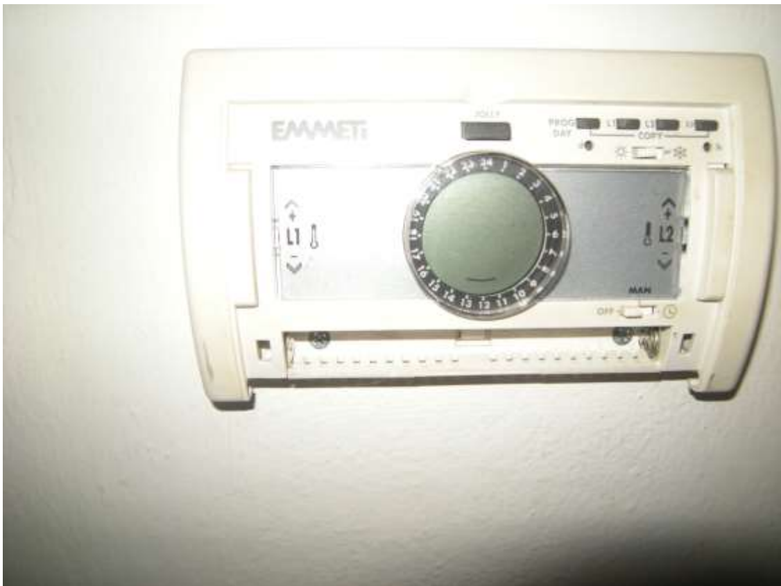
Brugnera, via della Fratta n. 29 - In alto un particolare del condizionatore, in basso il termostato ambiente.