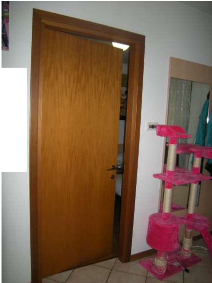
Brugnera, via della Fratta n. 29 - Le porte interne.