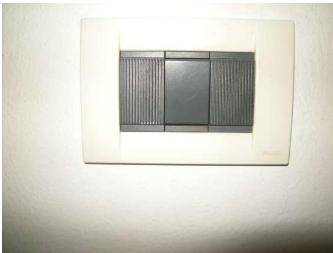
Brugnera, via della Fratta n. 29 - Particolari dell'impianto elettrico dell'appartamento.