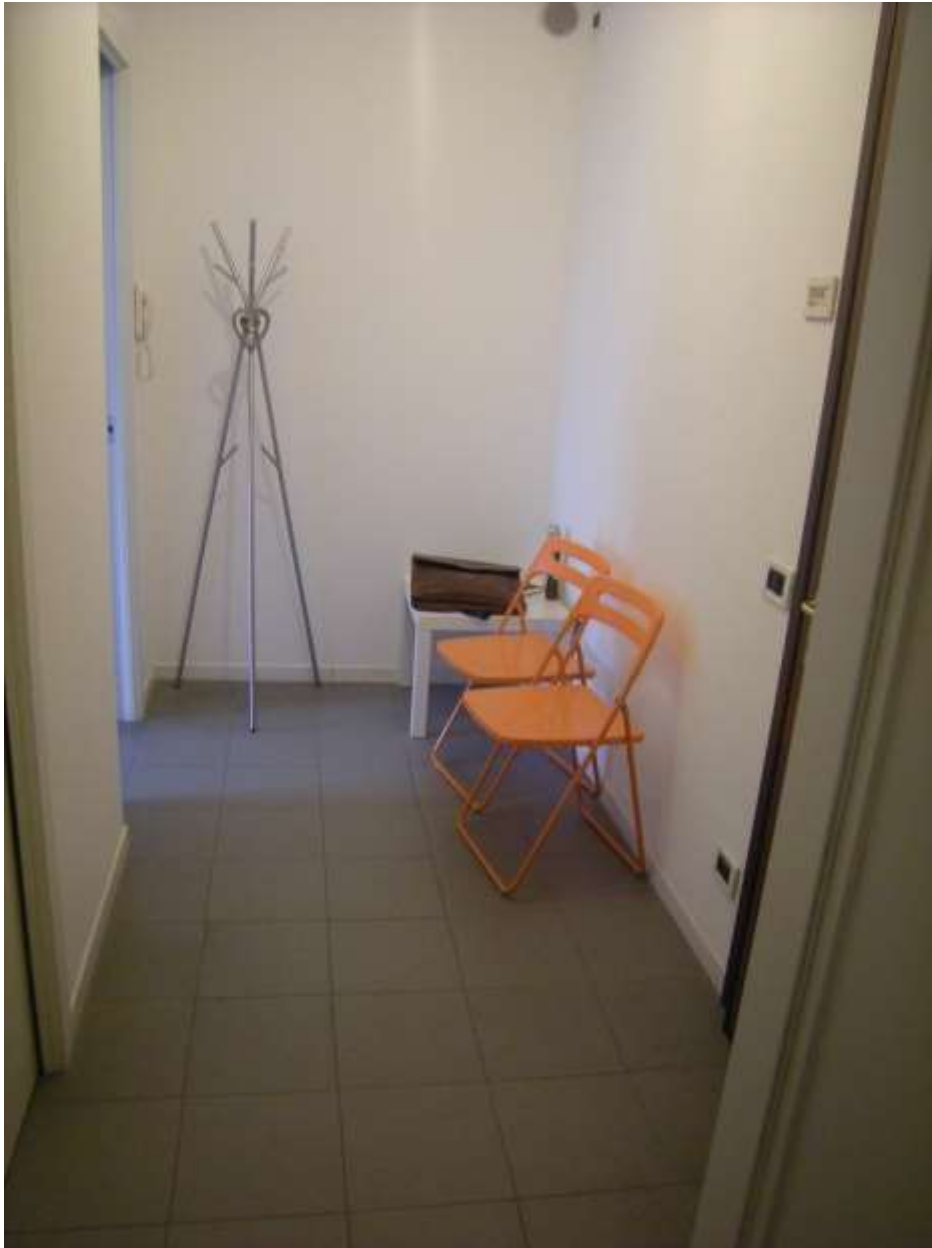
Sacile, viale della Repubblica n°9 – Il disimpegno.