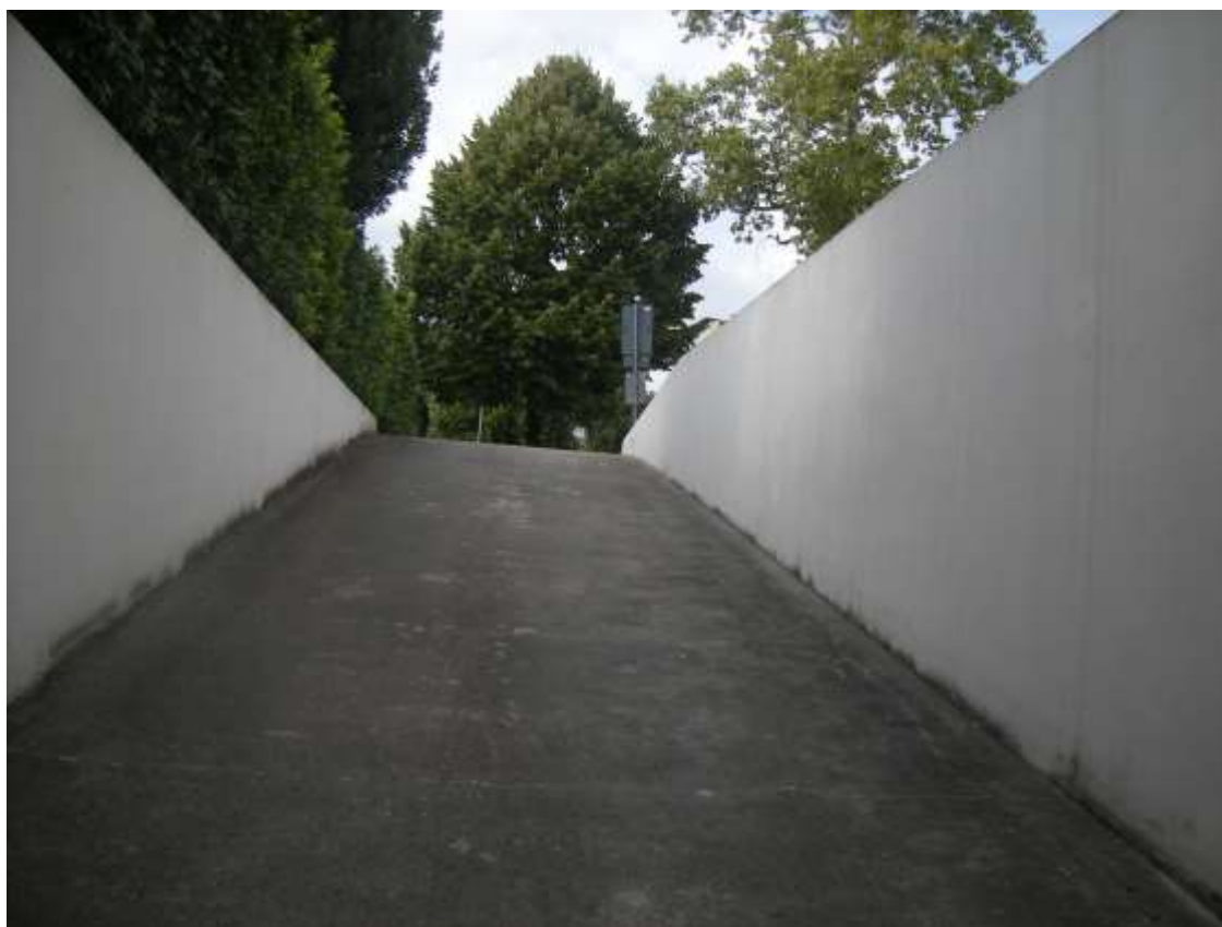
Sacile, viale della Repubblica n°9 – L'ingresso al garage.