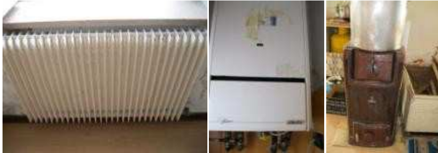
Foto 29-30-31 Dettaglio sistemi di riscaldamento