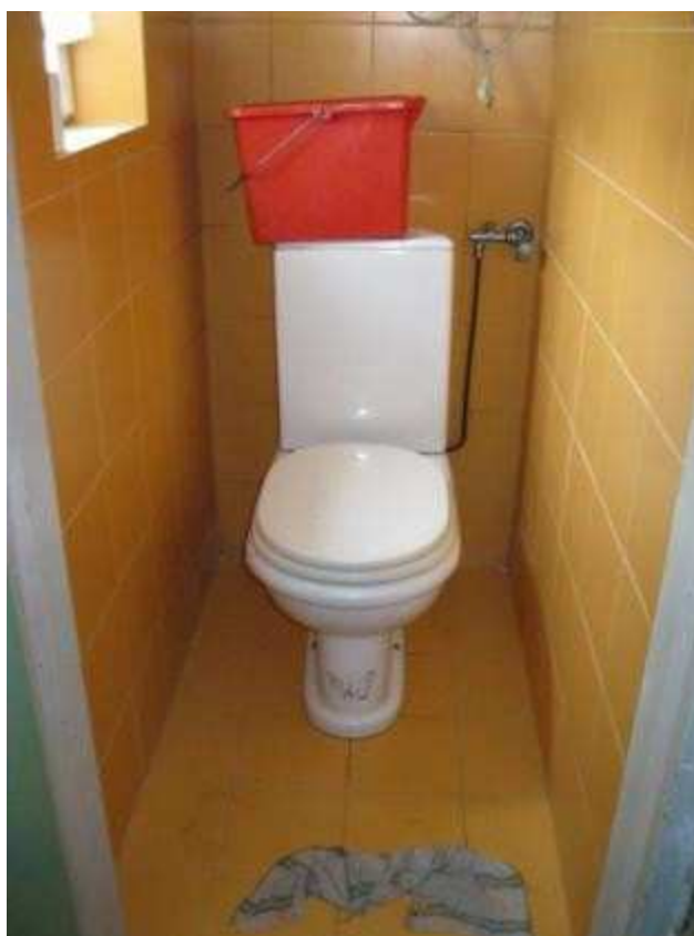
Foto 16 WC