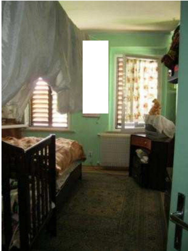
Foto 17 Camera