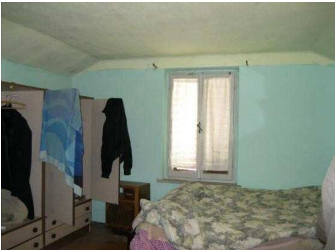
Foto 24 Camera secondo piano