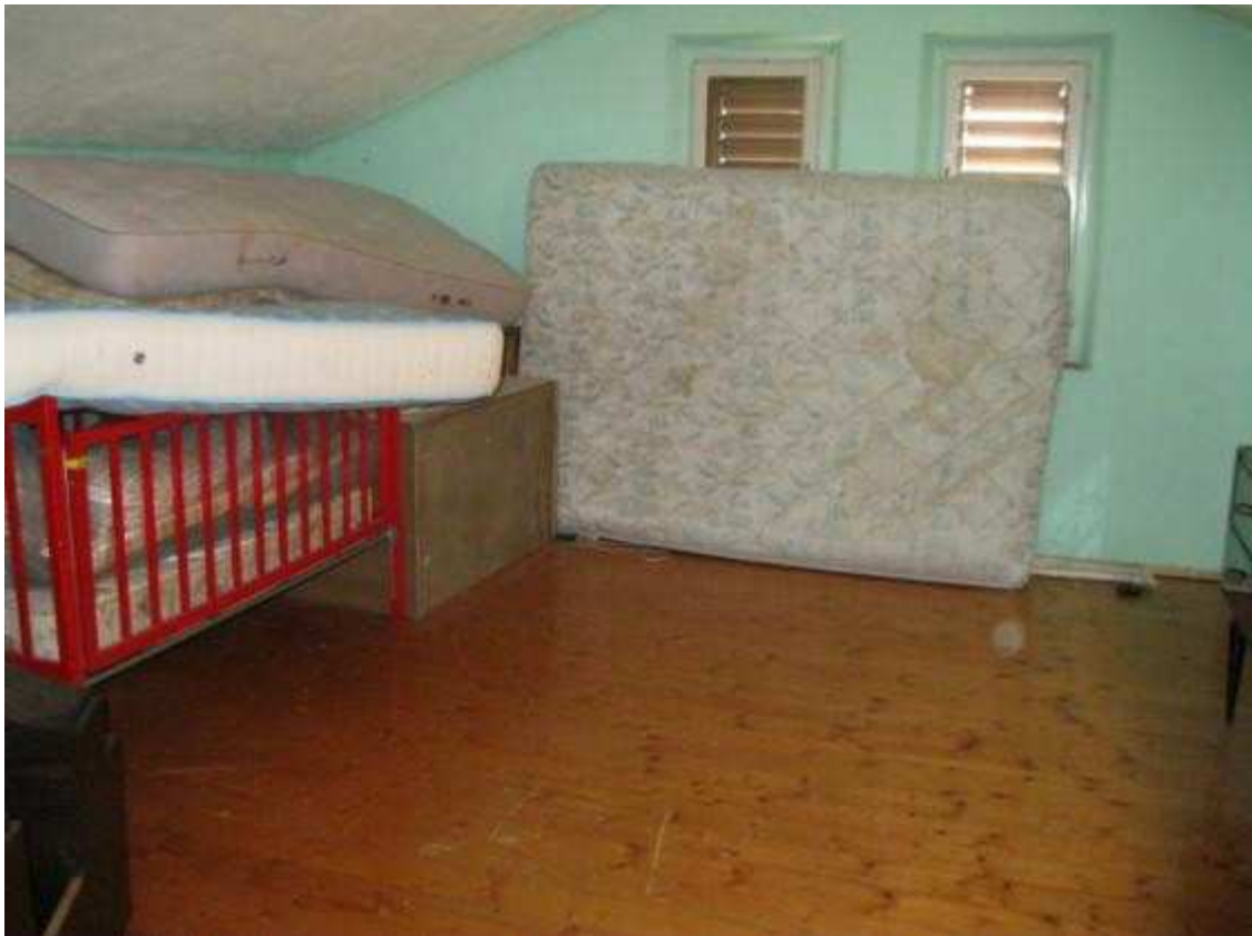
Foto 23 Camera secondo piano