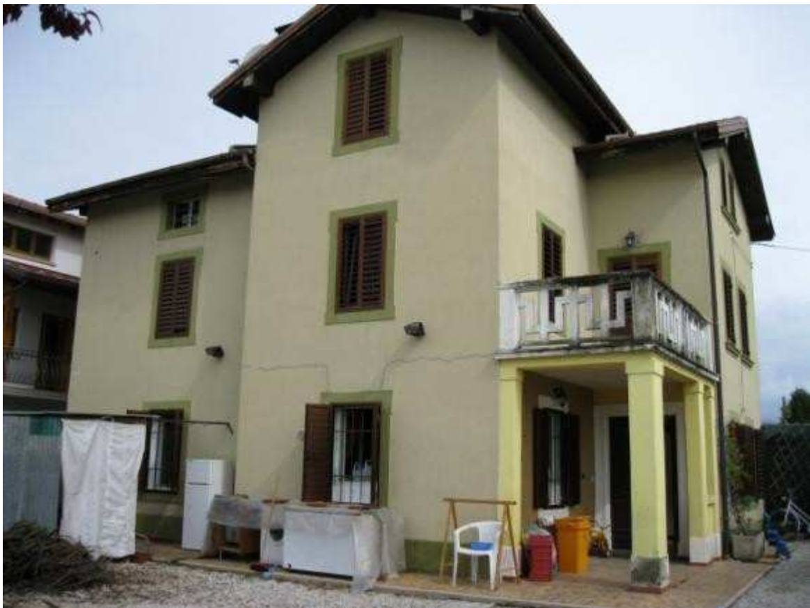
Foto 2 Vista esterna laterale