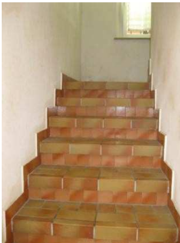
Foto 15 Scala da piano terra a primo piano