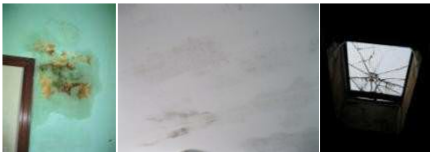
Foto 36-37-38 Interventi di manutenzione urgenti