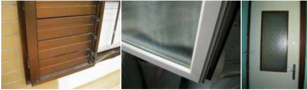
Foto 26-27-28 Dettaglio serramenti