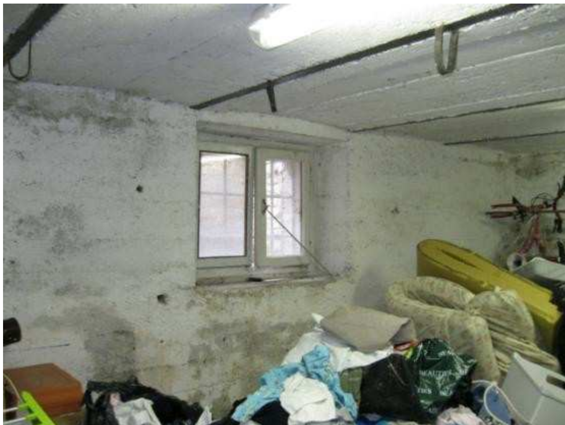
Foto 14 Cantina