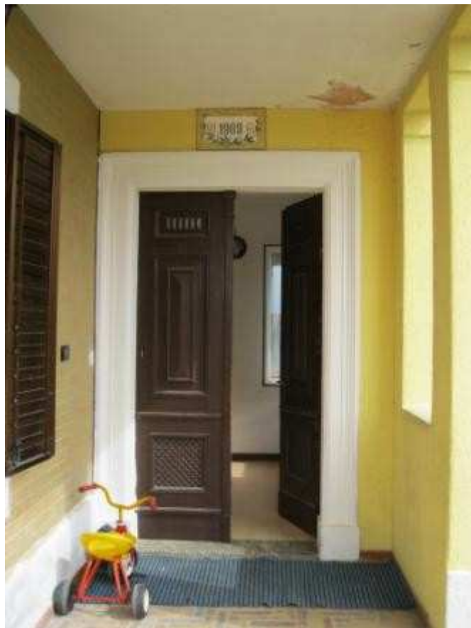
Foto 6 Porta accesso immobile esecutato