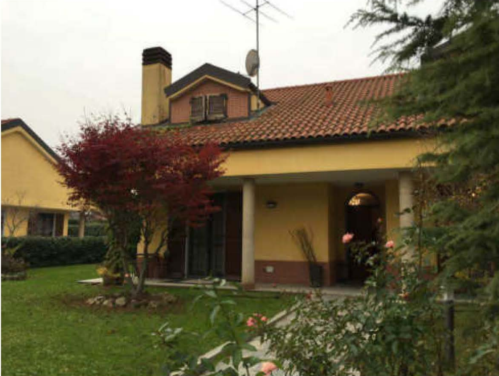
Fotografia n. 3 – Vista del prospetto principale, verso Via Privata Mattei n.2, dell'immobile pignorato