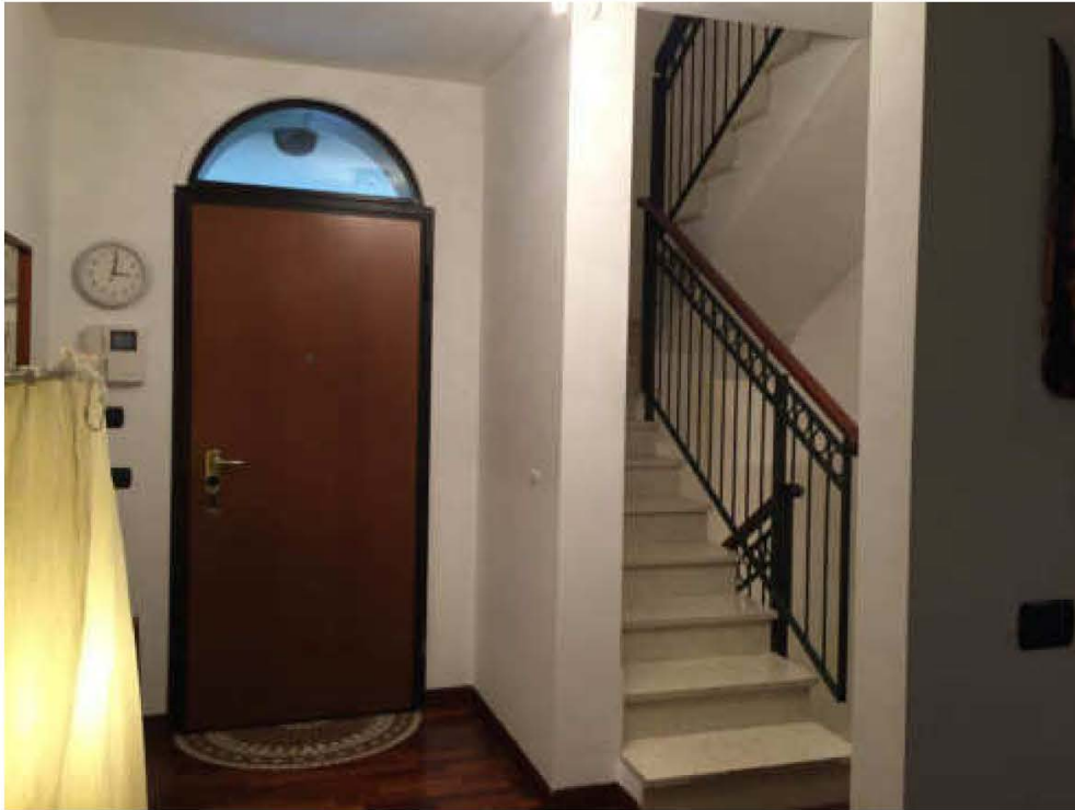
Fotografia n. 7 – Vista dell'ingresso all'immobile e del vano scale Che conduce sia al piano primo sia al piano interrato