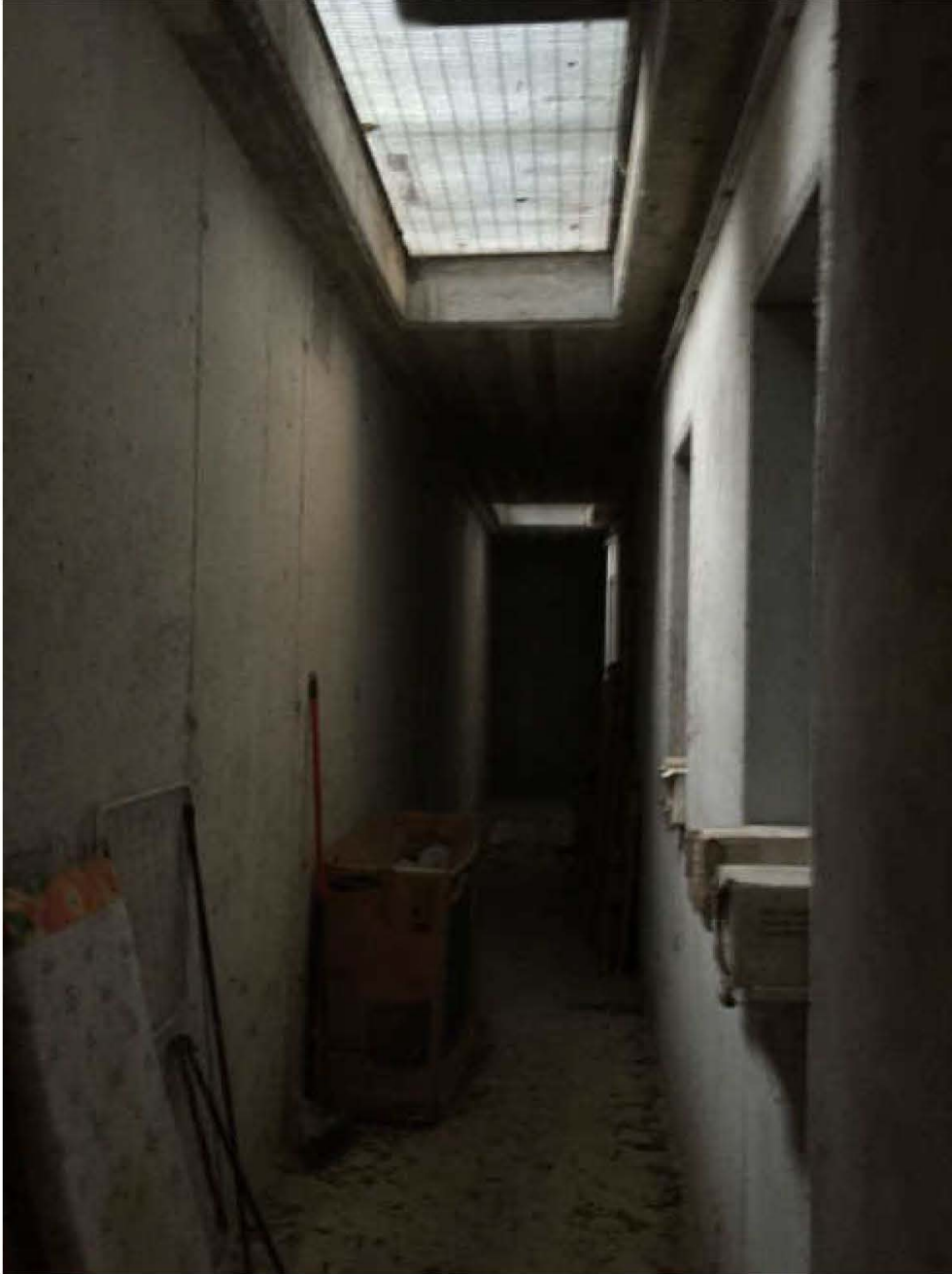
Fotografia n. 19 – Vista del cavedio, sito al piano interrato