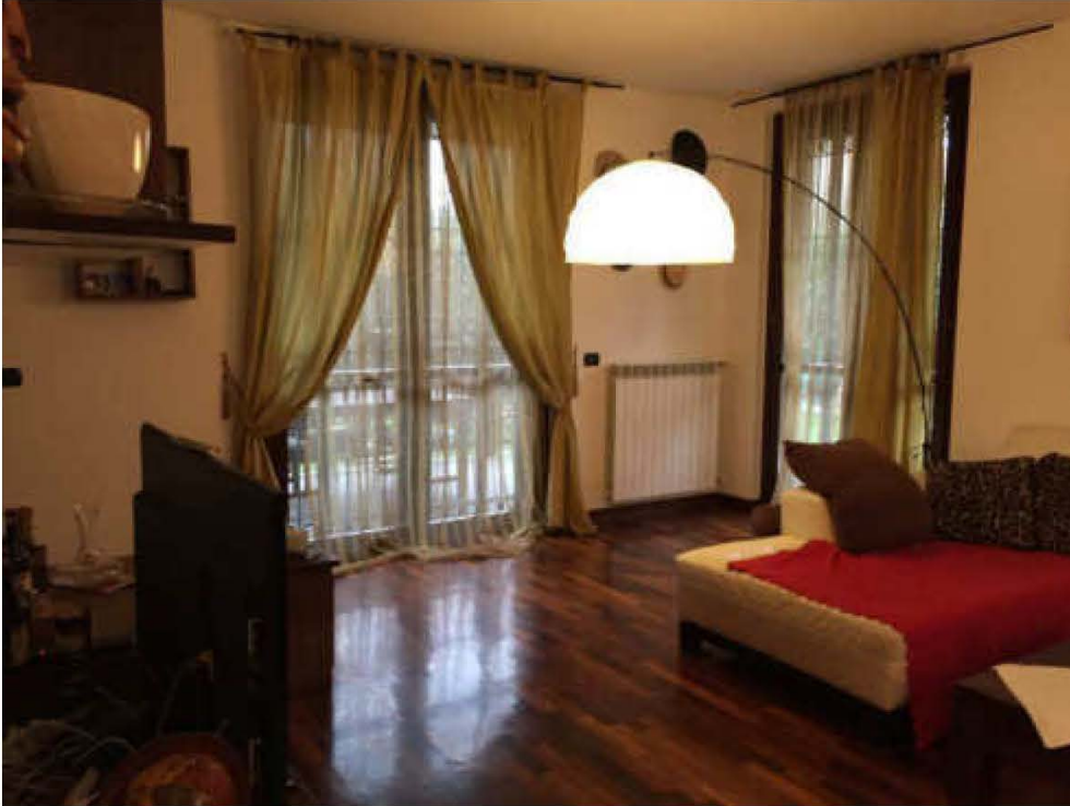
Fotografia n. 9 – Vista del locale soggiorno/pranzo