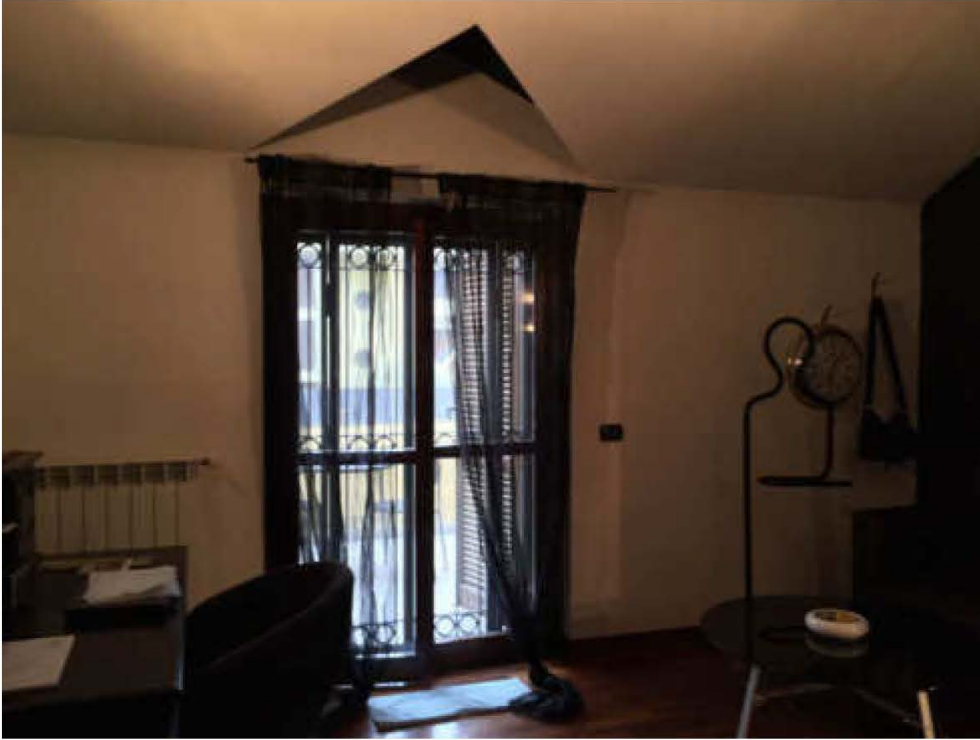
Fotografie n. 11/12 – Vista del locale di sgombero, adibito a camera da letto, sito al piano primo