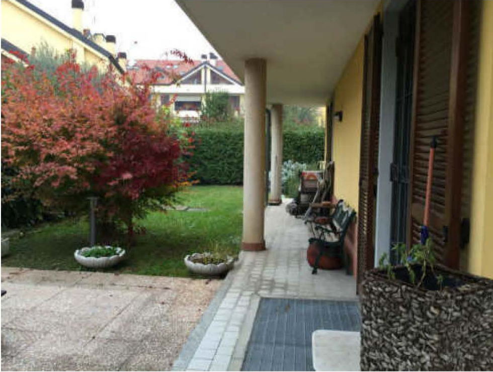
Fotografia n. 5 – Vista del prospetto secondario dell'immobile pignorato