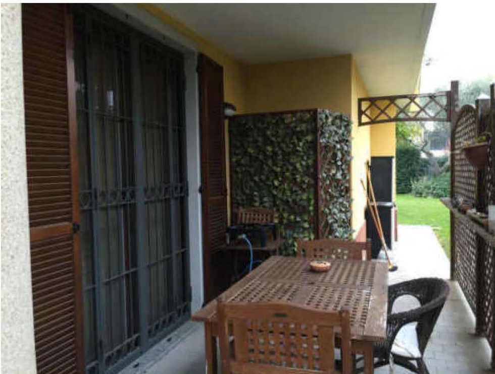
Fotografia n. 4 – Vista del prospetto laterale sinistro dell'immobile pignorato