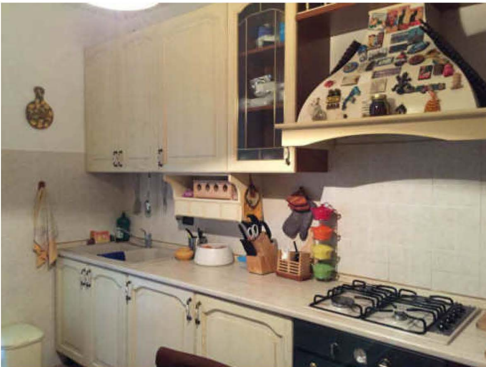
Fotografie n. 10 – Vista del locale cucina

Giudice: Dott. Giuseppe Fiengo Custode Giudiziario: SIVAG S.P.A. Perito: Dott. Arch. Mariangela Sirena