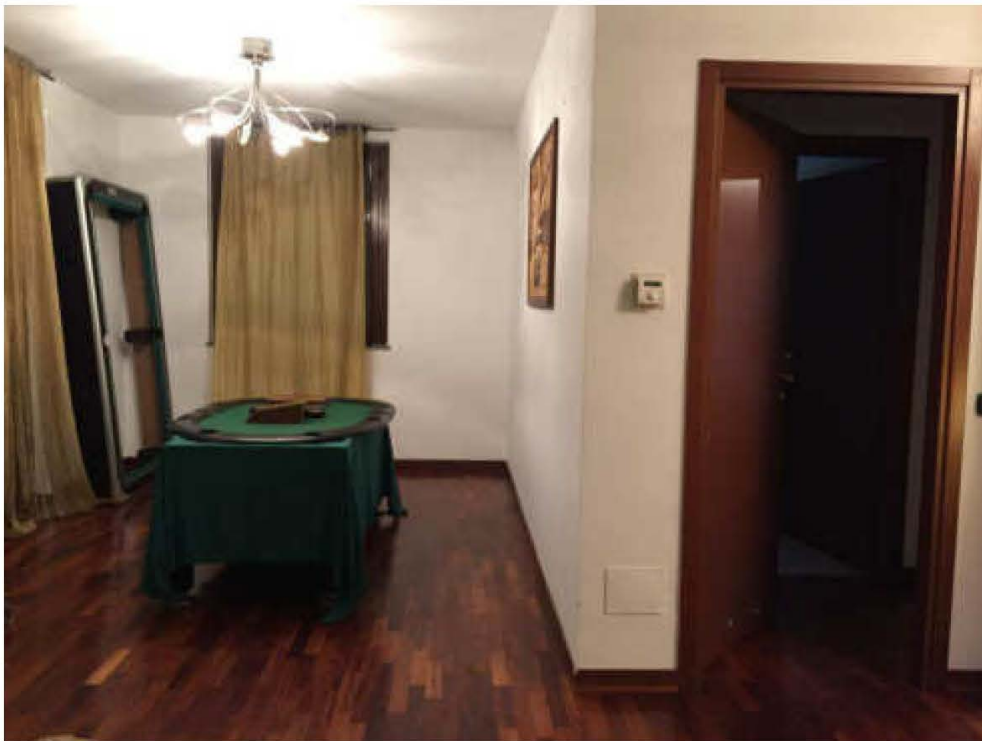
Fotografia n. 8 – Vista del locale soggiorno/pranzo e del disimpegno, che conduce alla camera e bagno

Giudice: Dott. Giuseppe Fiengo Custode Giudiziario: SIVAG S.P.A. Perito: Dott. Arch. Mariangela Sirena