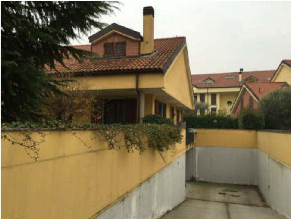
Fotografia n. 6 – Vista del prospetto laterale destro dell'immobile pignorato

Giudice: Dott. Giuseppe Fiengo Custode Giudiziario: SIVAG S.P.A. Perito: Dott. Arch. Mariangela Sirena