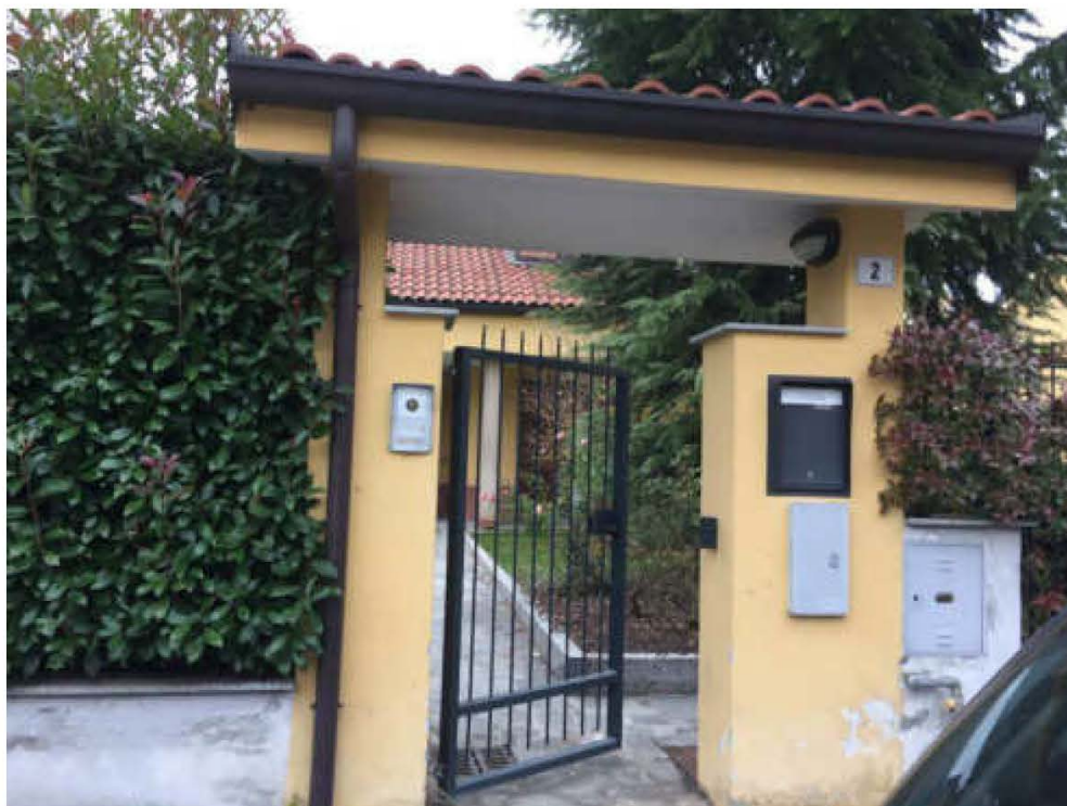
Fotografie n. 1/2 – Vista, dalla Via Privata Mattei n.2, del cancelletto pedonale e dell'immobile pignorato