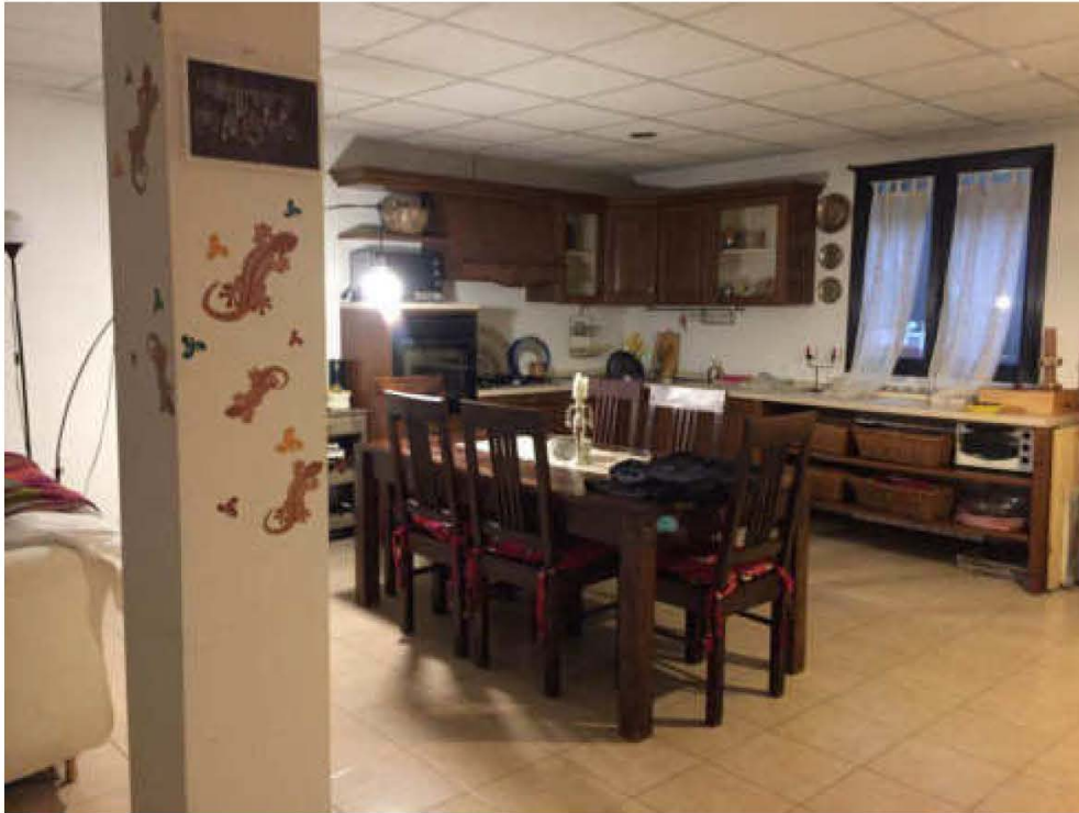
Fotografie n. 13/14 – Viste del locale cantina, adibito a cucina e soggiorno/pranzo, sita al piano interrato