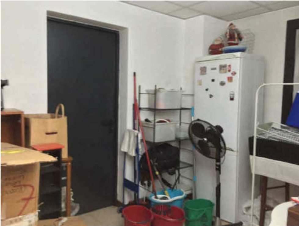
Fotografia n. 17 – Vista del locale ripostiglio, sito al piano interrato, e della porta di accesso al caveau