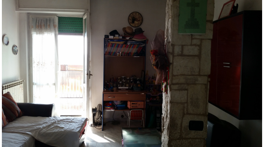
Appartamento oggetto di pignamento - soggiorno