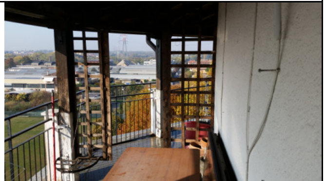
Appartamento oggetto di pignoramento - balcone