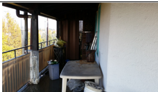
Appartamento oggetto di pignoramento - balcone