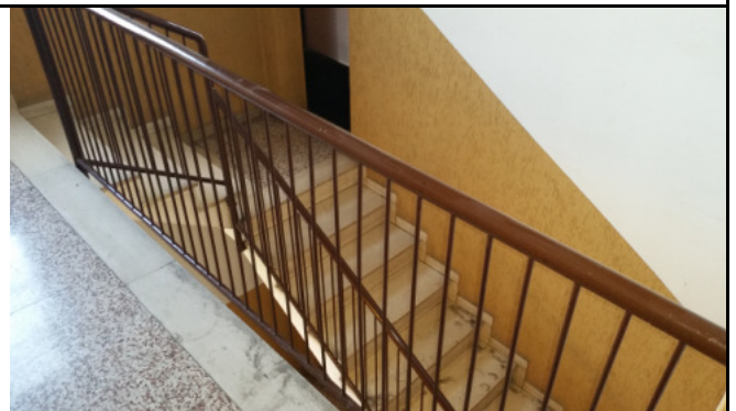
Immobilie di via VIII marzo Limbiate (MB) - vano scala "A"