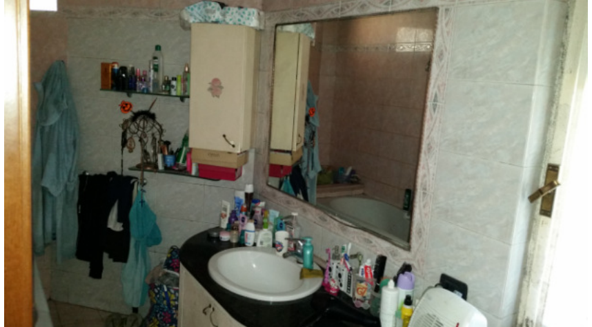
Appartamento oggetto di pignamento - bagno altra foto