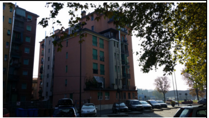
Immobilie di via VIII marzo Limbiate (MB)