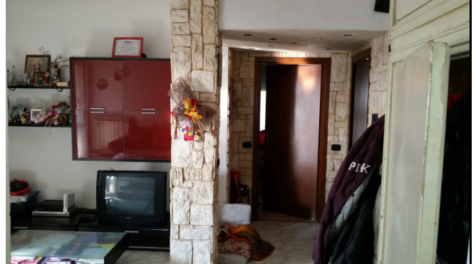
Appartamento oggetto di pignamento - soggiorno altra foto