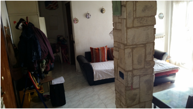
Appartamento oggetto di pignamento - soggiorno altra foto