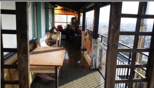
Appartamento oggetto di pignoramento - balcone