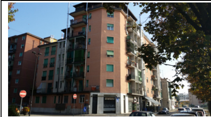
Immobilie di via VIII marzo Limbiate (MB)