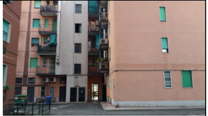
Immobilie di via VIII marzo Limbiate (MB) - portone di ingresso dal cortile interno