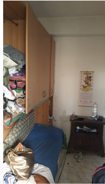
Appartamento oggetto di pignoramento - cameretta