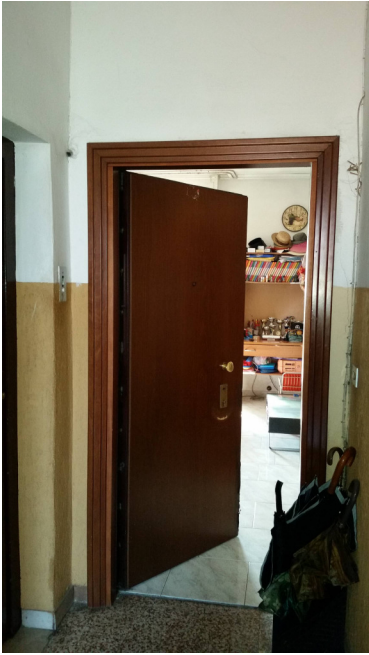
Appartamento oggetto di pignamento - porta di ingresso