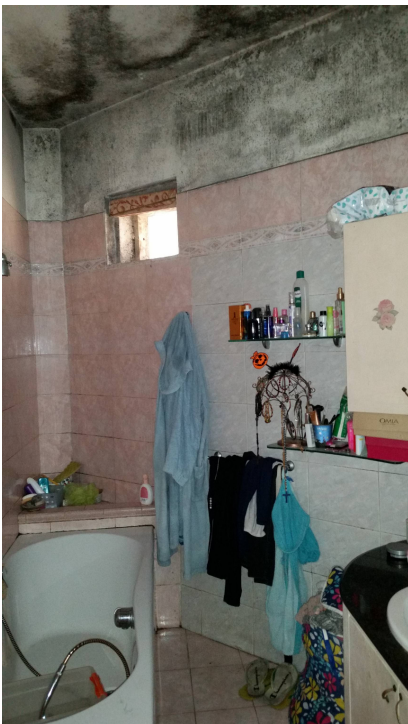
Appartamento oggetto di pignamento - bagno