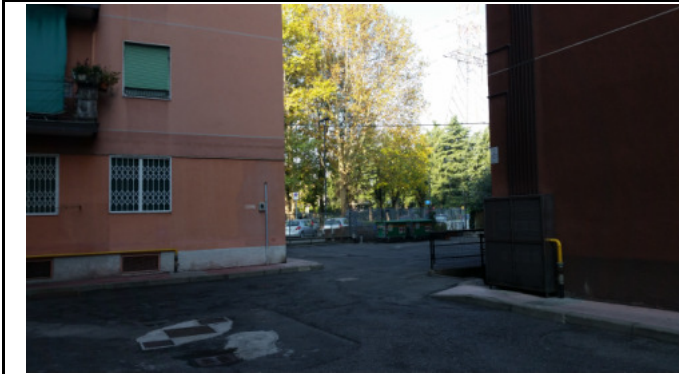
Immobilie di via VIII marzo Limbiate (MB) - cortile interno