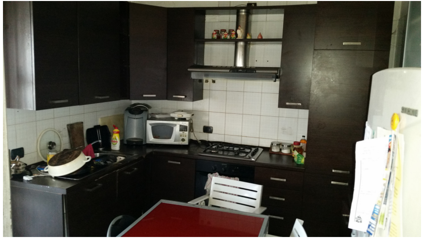
Appartamento oggetto di pignoramento - cucina altra foto