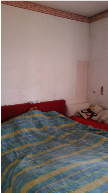
Appartamento oggetto di pignoramento - camera matrimoniale