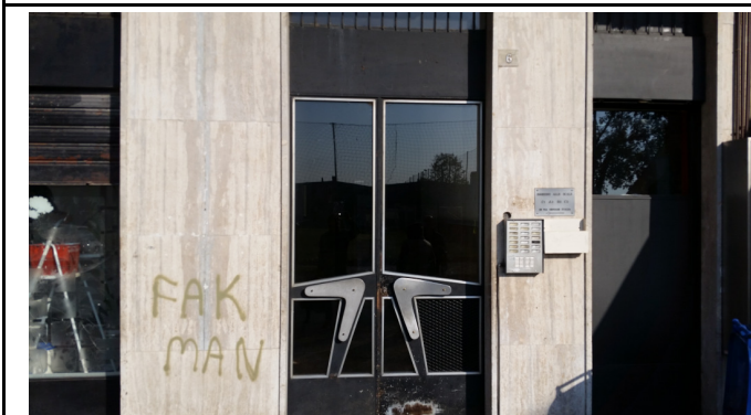
Immobilie di via VIII marzo Limbiate (MB) - ingresso principale allo stabile