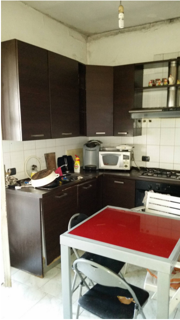
Appartamento oggetto di pignoramento - cucina