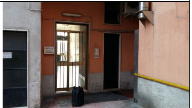
Immobilie di via VIII marzo Limbiate (MB) - ingresso secondario allo stabile dal portone del cortile interno