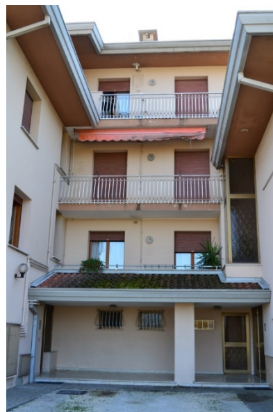
foto n. 6 – prospetto nord – portico condominiale con ingresso Scala A Scala B