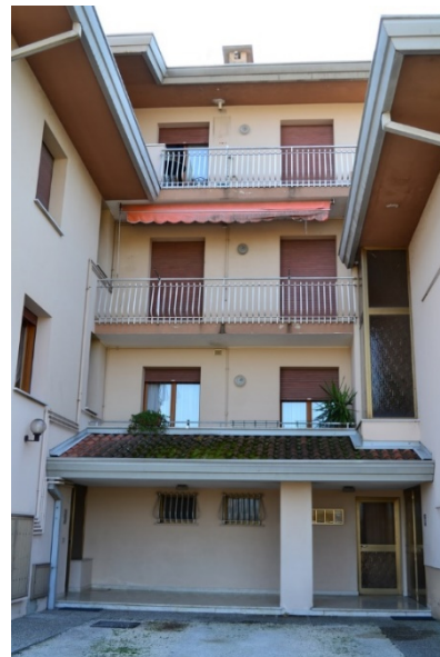
foto n. 6 – prospetto nord – portico condominiale con ingresso Scala A Scala B