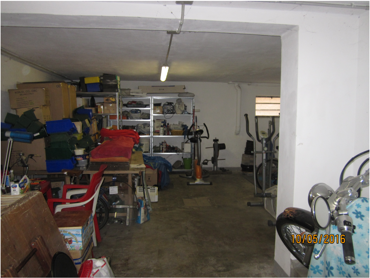
FOTO N. 2 INTERNO BOX