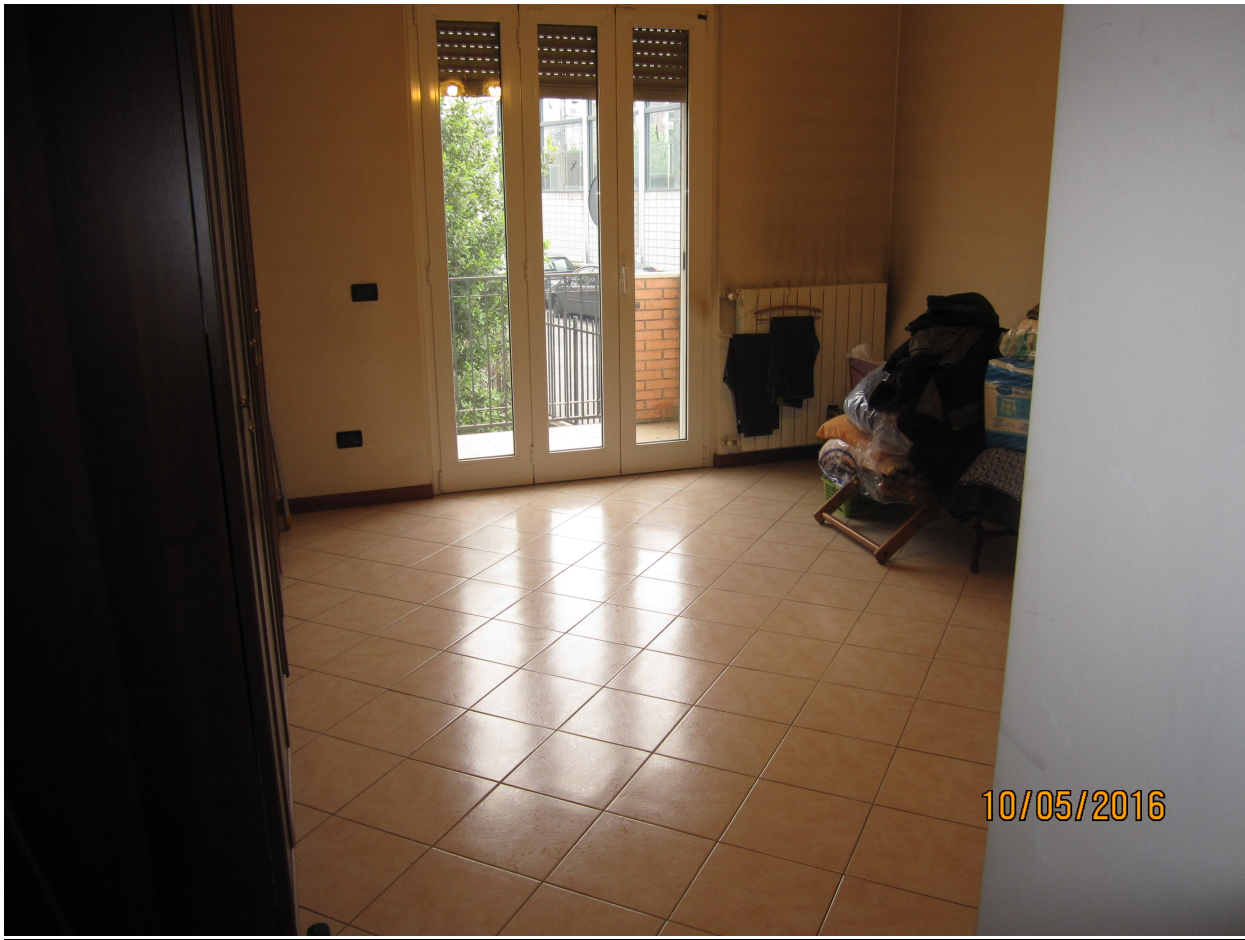
FOTO N. 4 CAMERA MATRIMONIALE CON BALCONE