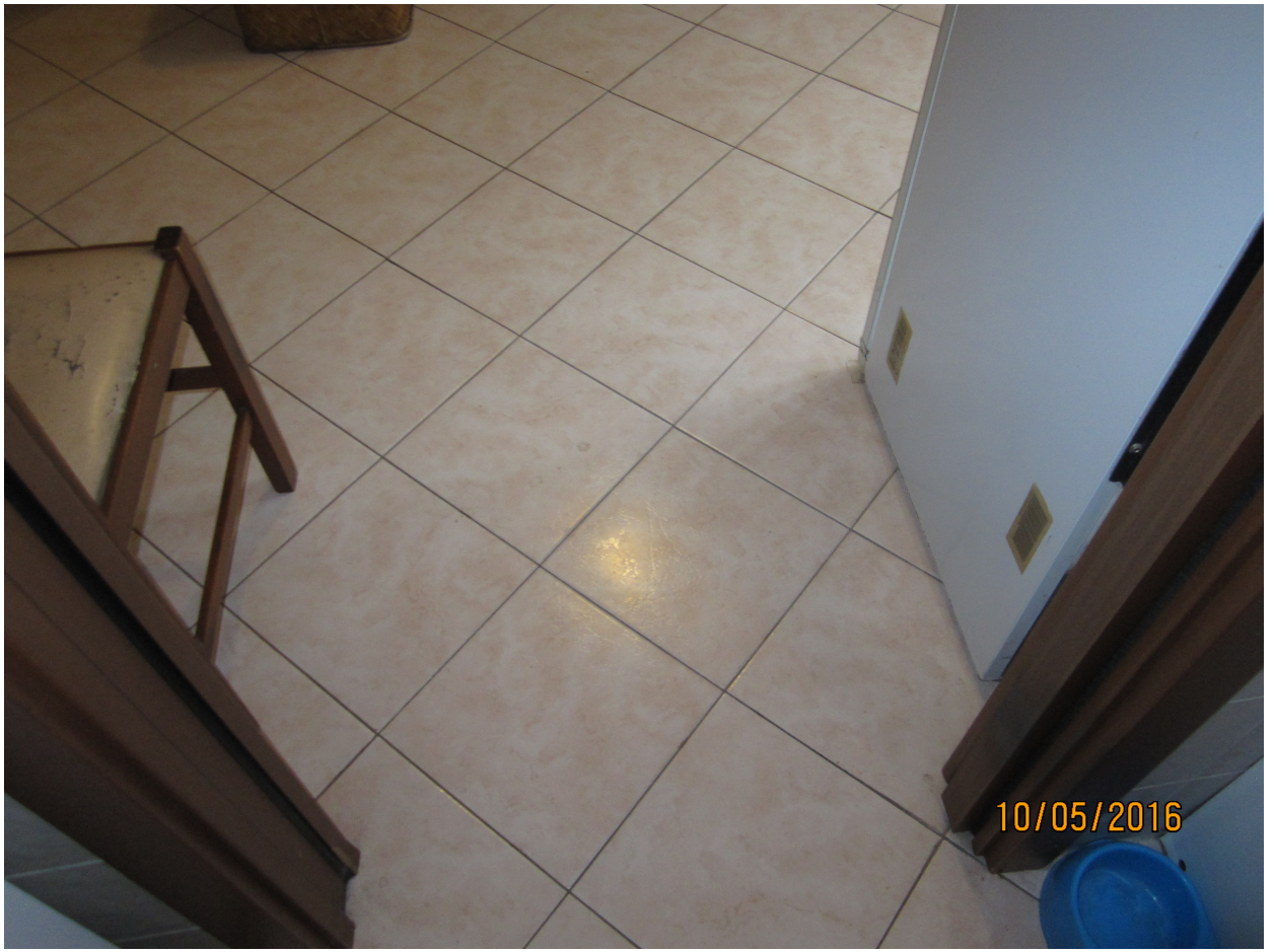
FOTO N. 3 ZONA PRANZO CON PARTICOLARE PAVIMENTAZIONE