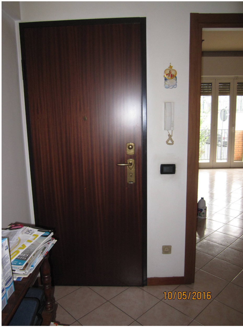
FOTO N. 1 ACCESSO APPARTAMENTO