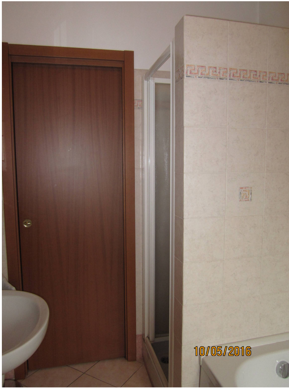
FOTO N. 6 BAGNO CON DOCCIA