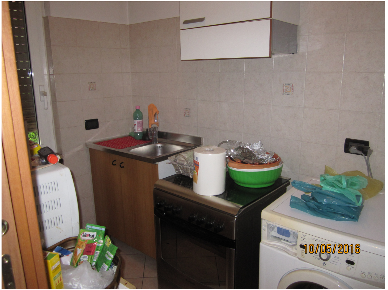
FOTO N. 2 ZONA COTTURA CIBI