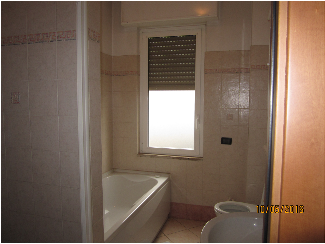
FOTO N. 5 BAGNO