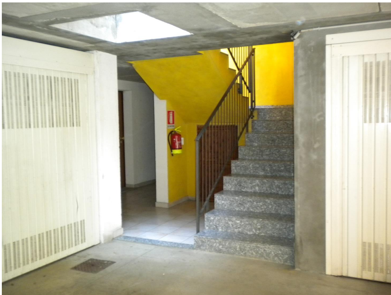
Foto 4 - Scala condominiale di accesso al piano interrato