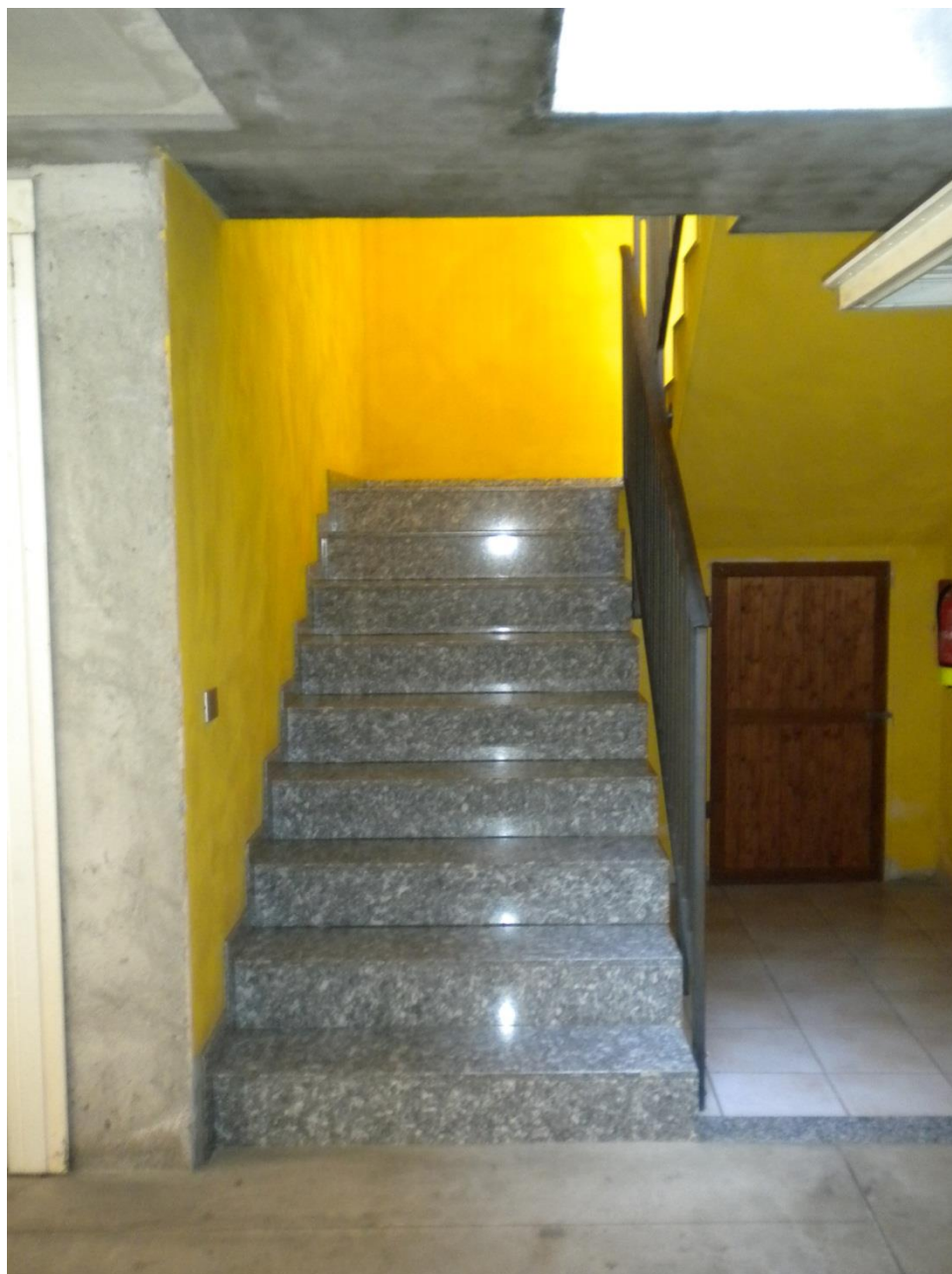
Scala condominiale di accesso a piano interrato