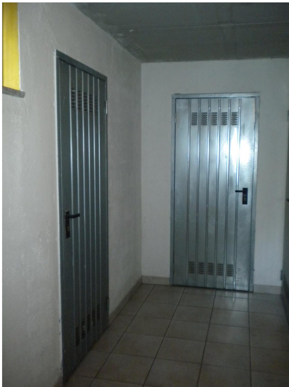
Foto 5 - Corridoio di accesso a cantine