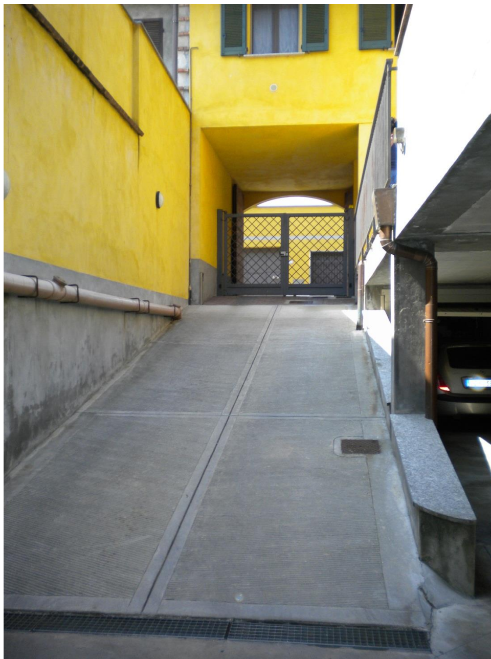
Foto 3 - Rampa di accesso al piano interrato