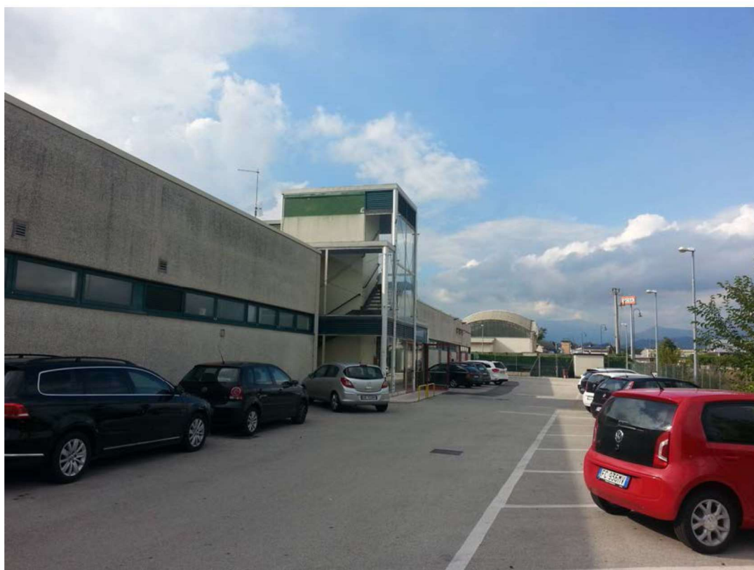
Vista Est – ingresso secondario