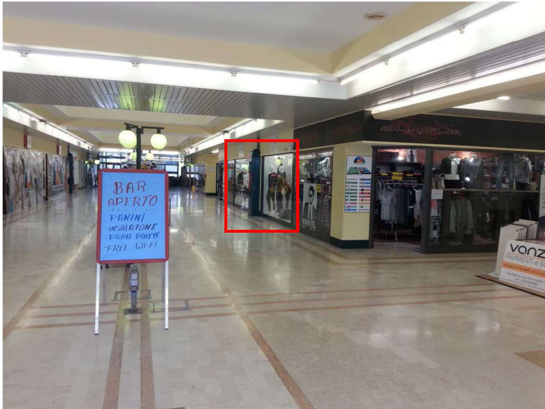
Vista interna dall'ingresso principale