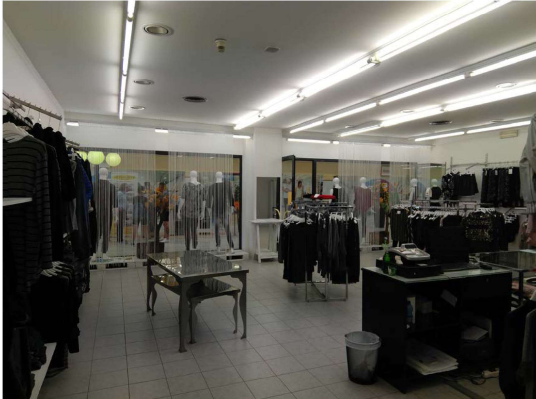
Vista interna del negozio