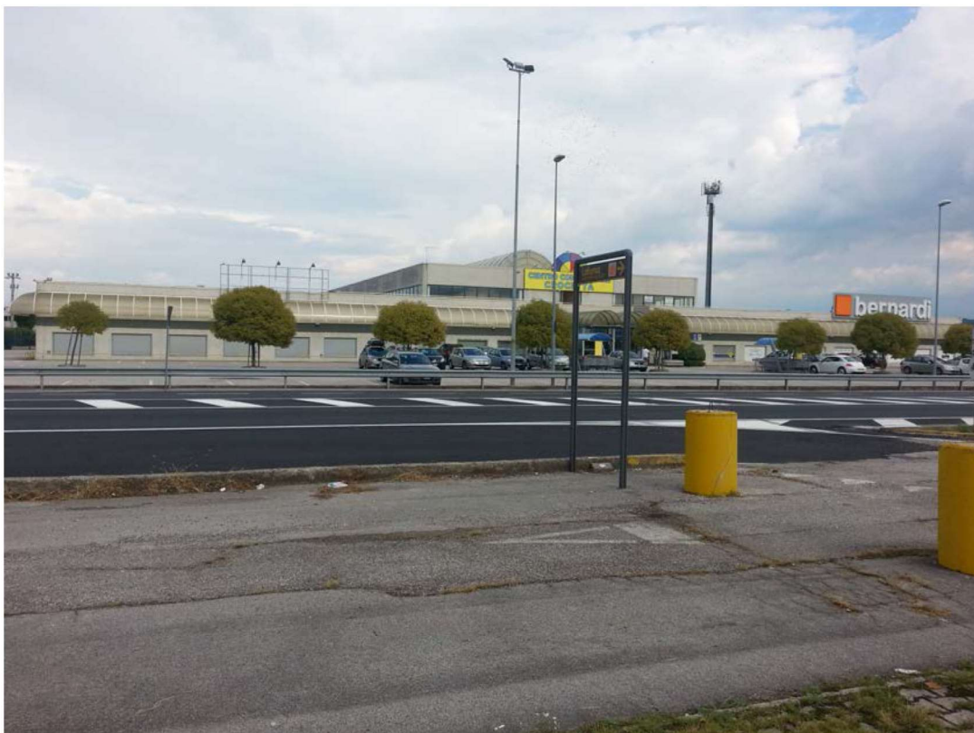
Vista dalla Strada Feltrina Centro Commerciale Crocetta – ingresso principale