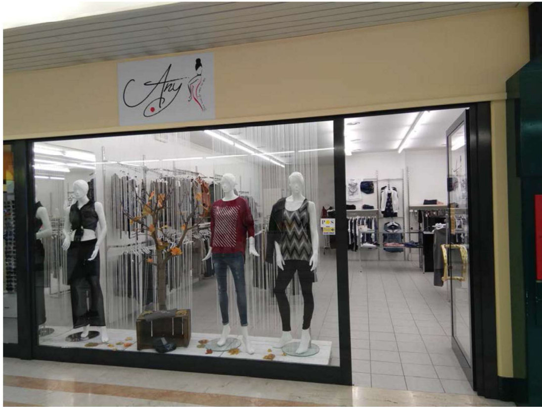
Vista ingresso negozio