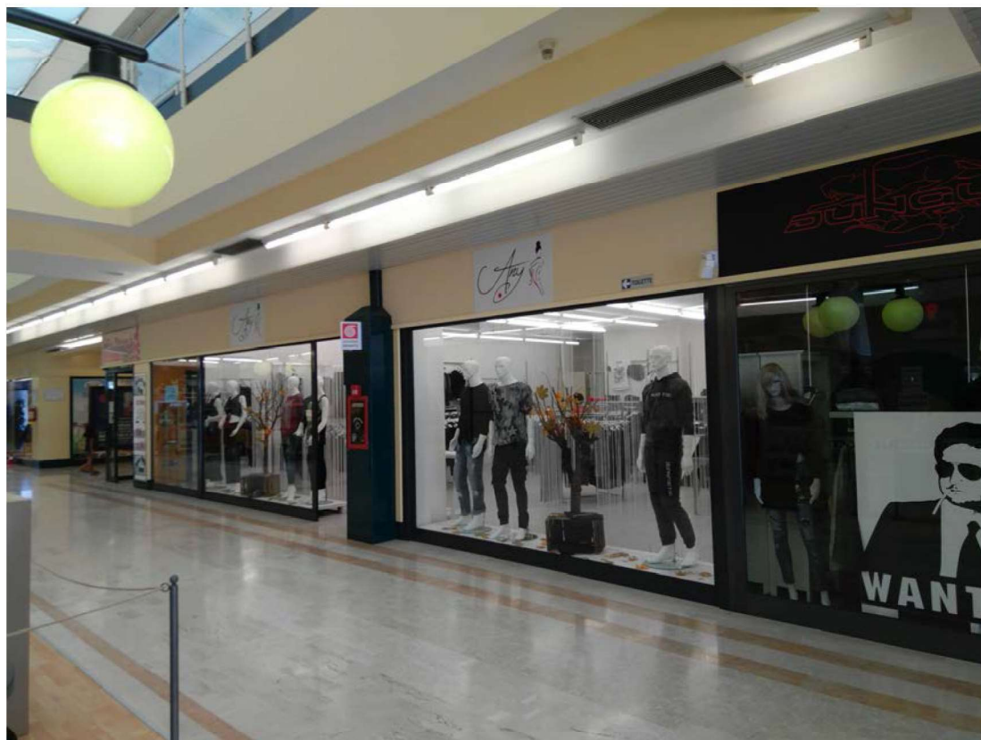
Vista interna dall'ingresso principale