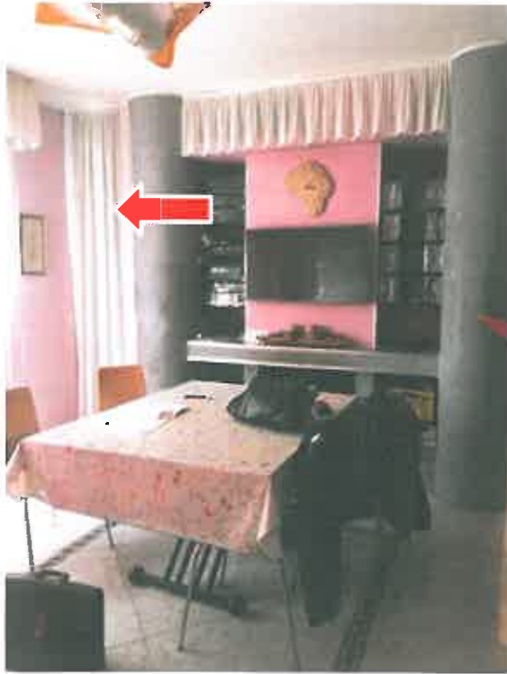
Foto n. 14 bis- locale soggiorno con indicazione della nicchia che racchiude il vano finestra (mascherato dalla tenda)