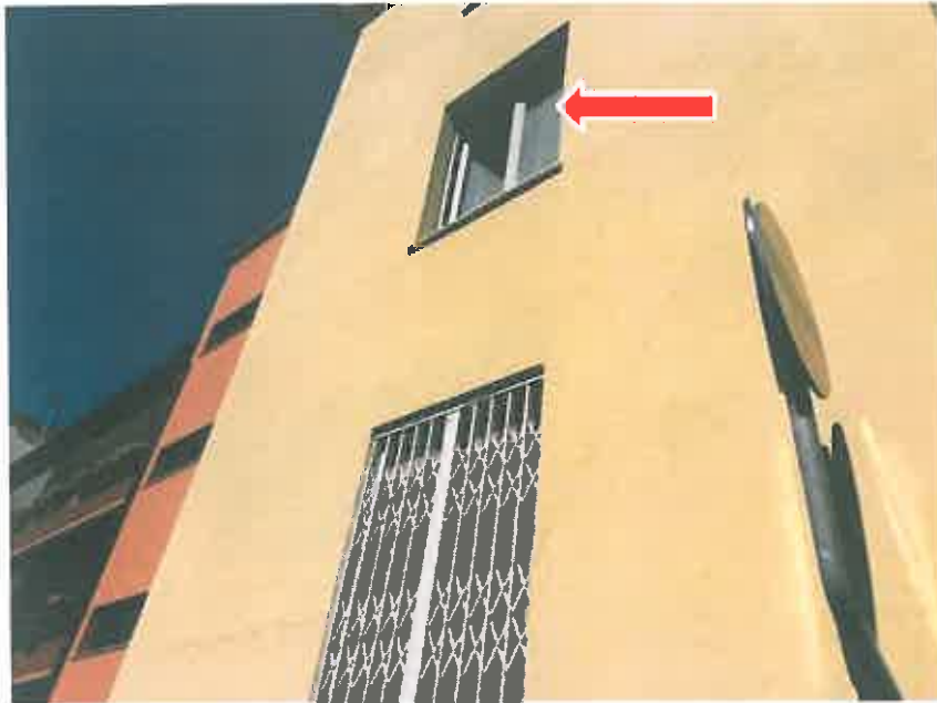
Foto n. 8 —fronte Ovest su Via Ugo Foscolo (finestra piano primo , camera da letto)

L'appartamento in oggetto si sviluppa lungo due fronti : fronte Sud con affaccio sulla Via Parini (foto n. 7) e fronte Ovest con affaccio su Via Ugo Foscolo (foto n. 8 ) ed è così composto: un lungo corridoio di ingresso dal quale si accede a tutti i locali; un locale soggiorno , un locale cucina abitabile , n. 2 camere da letto ; un locale servizio igienico .