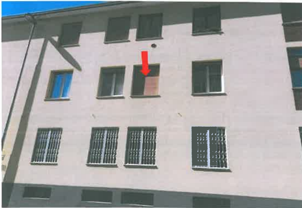
Foto n. 7 fronte Sud Via Parini – vano finestra corrispondente alla nicchia posta a lato del camino: si vedano fotografie n. 14 bis e 14 ter ( pag. 10 bis )