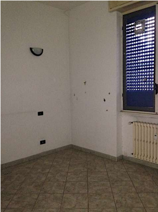
Foto: 08, disimpegno d'ingresso