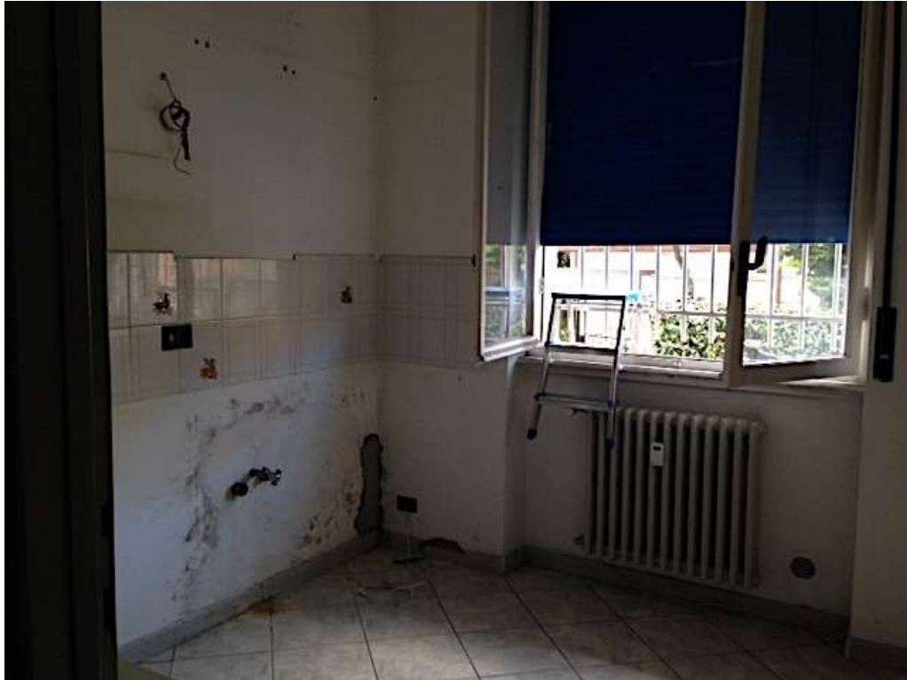
Foto: 12, dettaglio inferiate