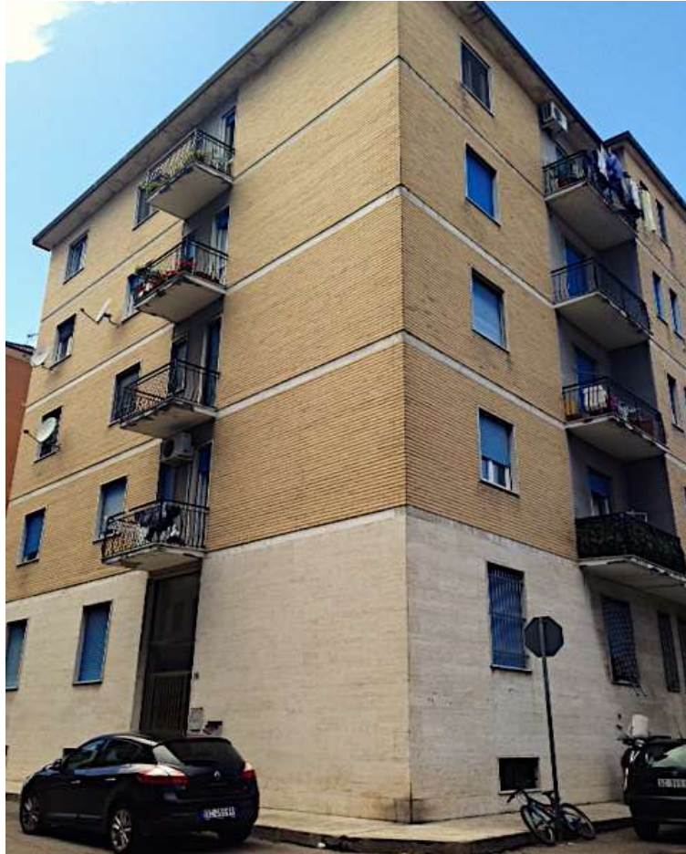
Foto: 02, ingresso dell'edificio

Foto: 03, corridoio d'accesso all'appartamento