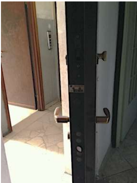
Foto: 06, dettaglio porte interne