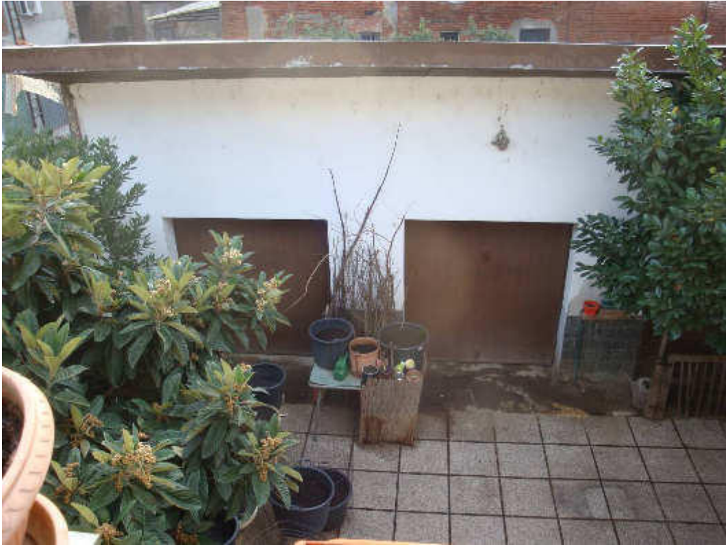
FOTO 5 – Il corpo box con in evidenza l'unità immobiliare oggetto di esecuzione