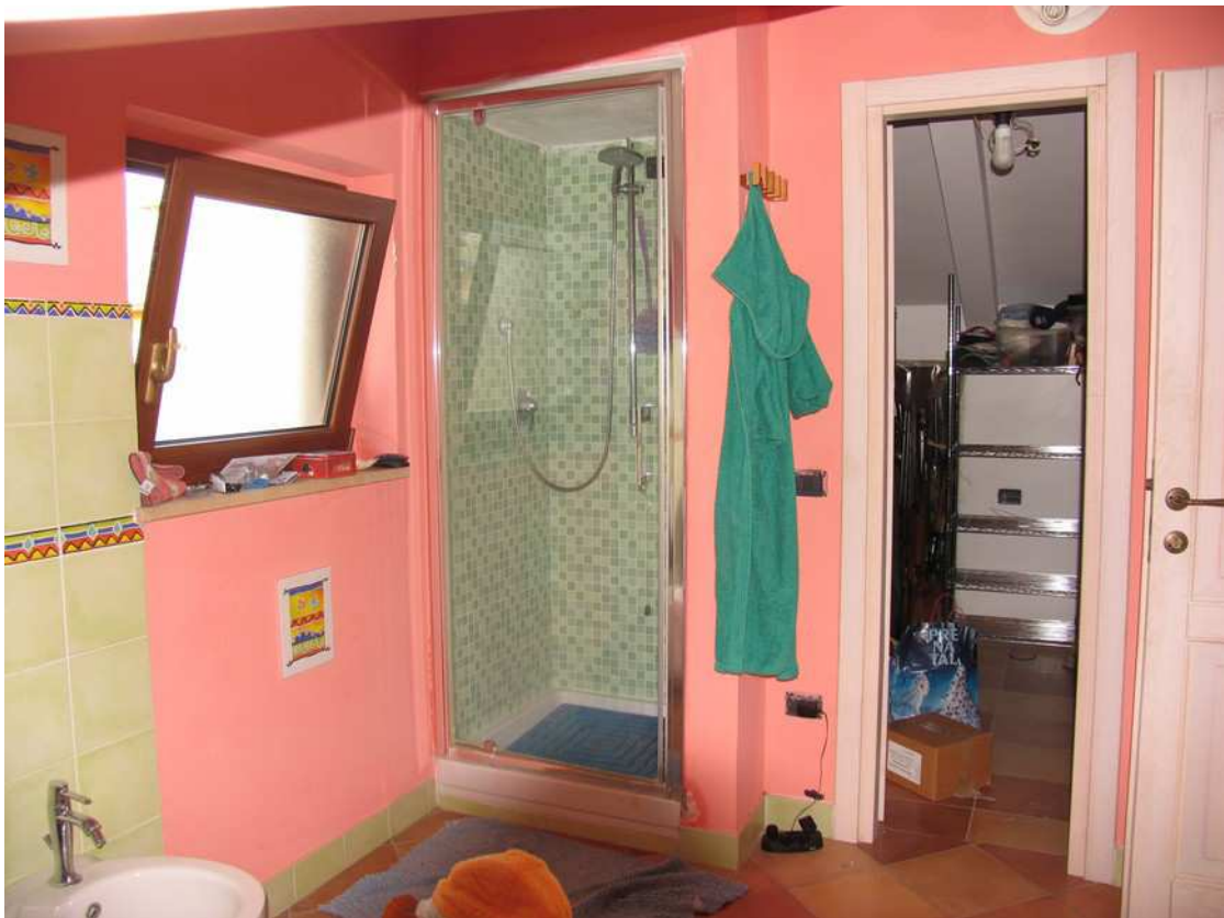
BAGNO - SOTTOTETTO