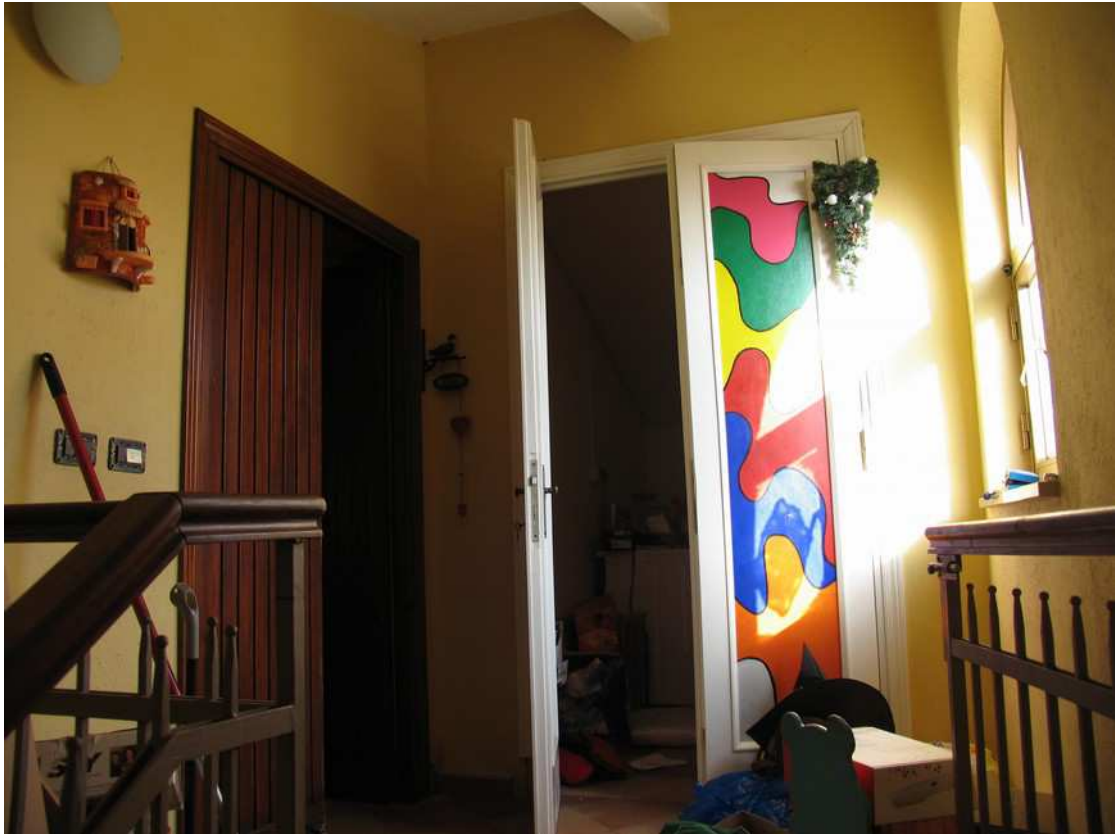
INGRESSO - RIPOSTIGLIO