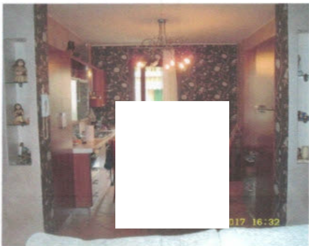
APPARTAMENTO - F. 11, Mapp.797, Sub.27