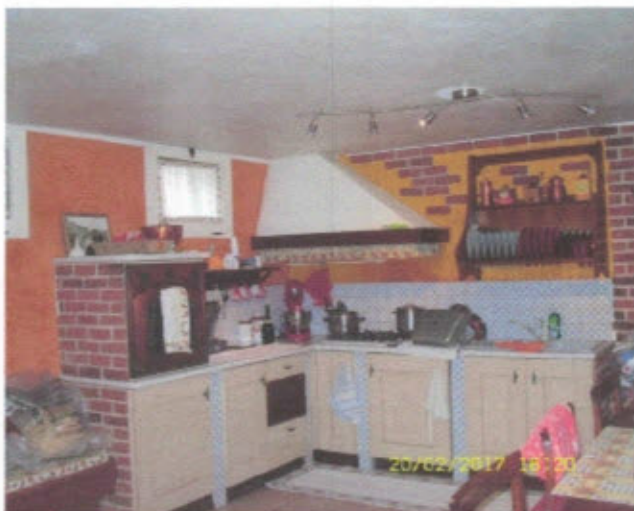
APPARTAMENTO - F. 11, Mapp.797, Sub.27