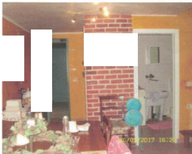
APPARTAMENTO - F. 11, Mapp.797, Sub.27