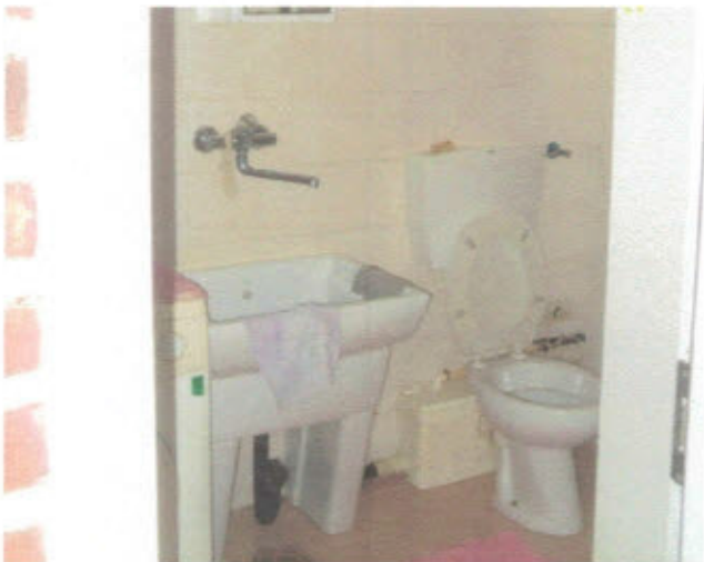
APPARTAMENTO - F. 11, Mapp.797, Sub.27