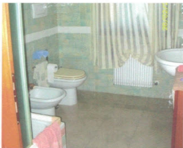
APPARTAMENTO - F. 11, Mapp.797, Sub.27