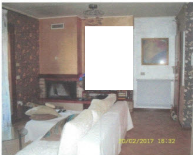
APPARTAMENTO - F. 11, Mapp.797, Sub.27