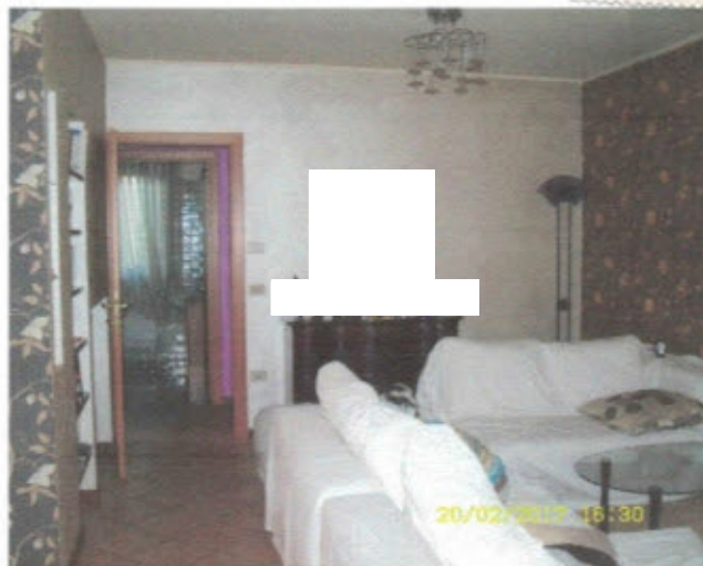
APPARTAMENTO - F. 11, Mapp.797, Sub.27