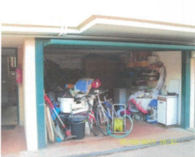
AUTORIMESSA - F. 11, Mapp.797, Sub.24