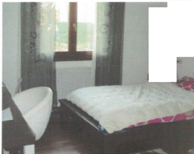
APPARTAMENTO - F. 11, Mapp.797, Sub.27