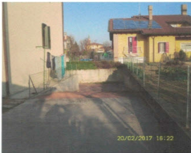
AUTORIMESSA - F. 11, Mapp.797, Sub.24