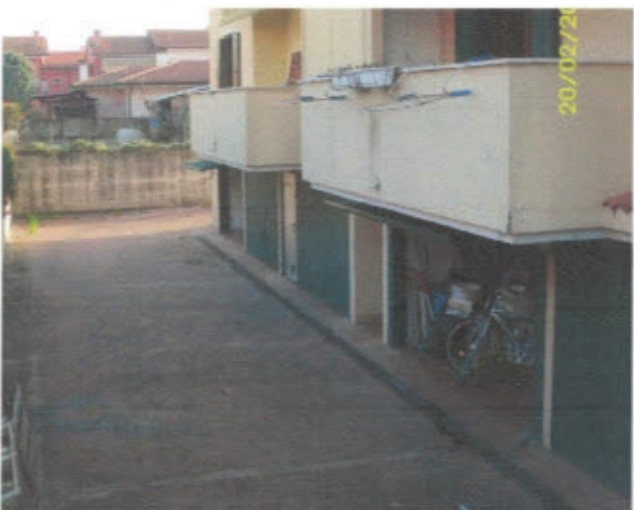
AUTORIMESSA - F. 11, Mapp.797, Sub.24