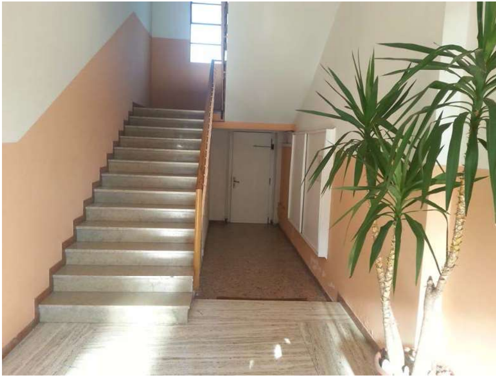
VISTA VANO SCALE COMUNE INGRESSO