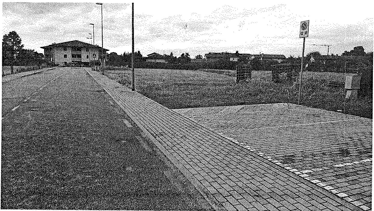
Localizzazione: v. allegati n. 2 e 9 (estratto di mappa e localizzazione GIS)