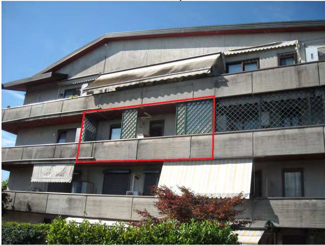
Foto 2 – vista sud-est dell'edificio da Via Pordenone lato Nord - Ovest