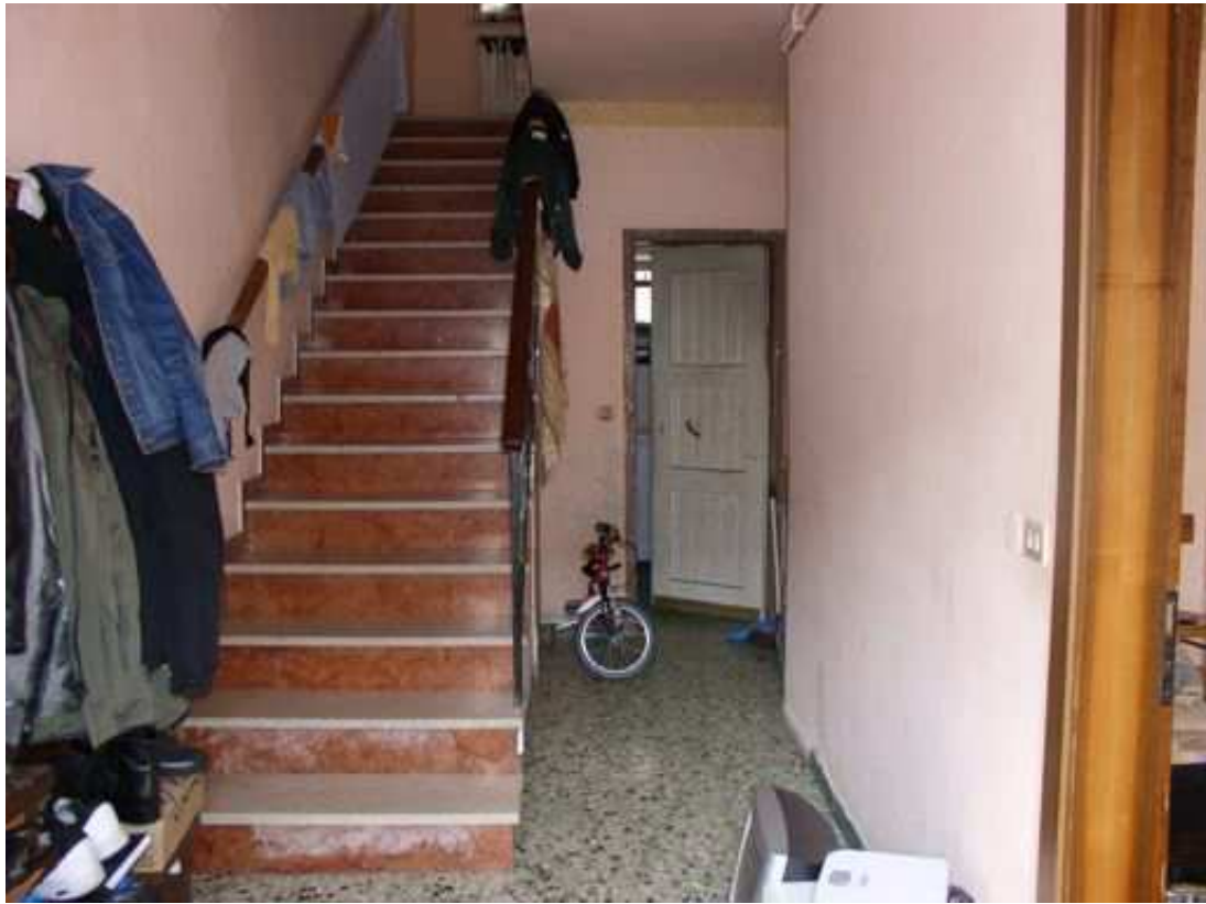
ingresso piano terra