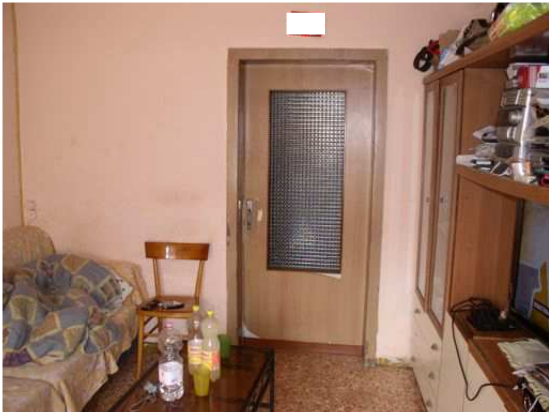
soggiorno piano terra