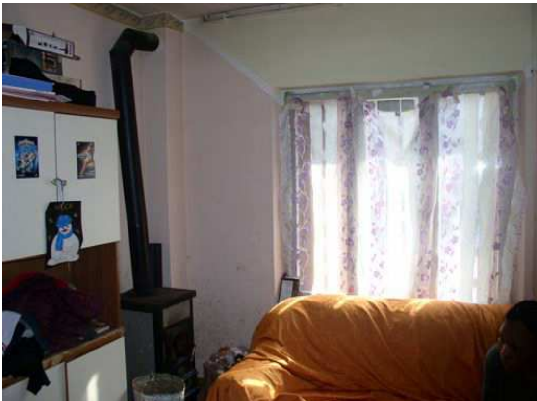
soggiorno piano terra