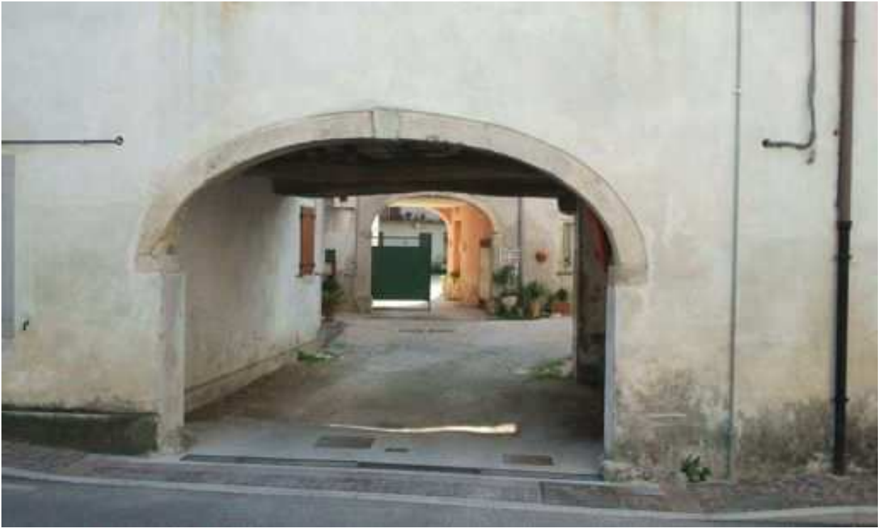
portico di accesso su via Roma