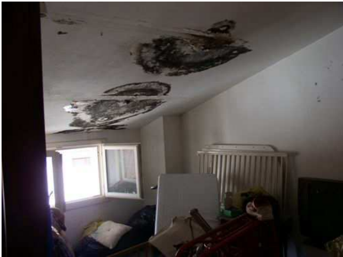
locaie deposito piano secondo