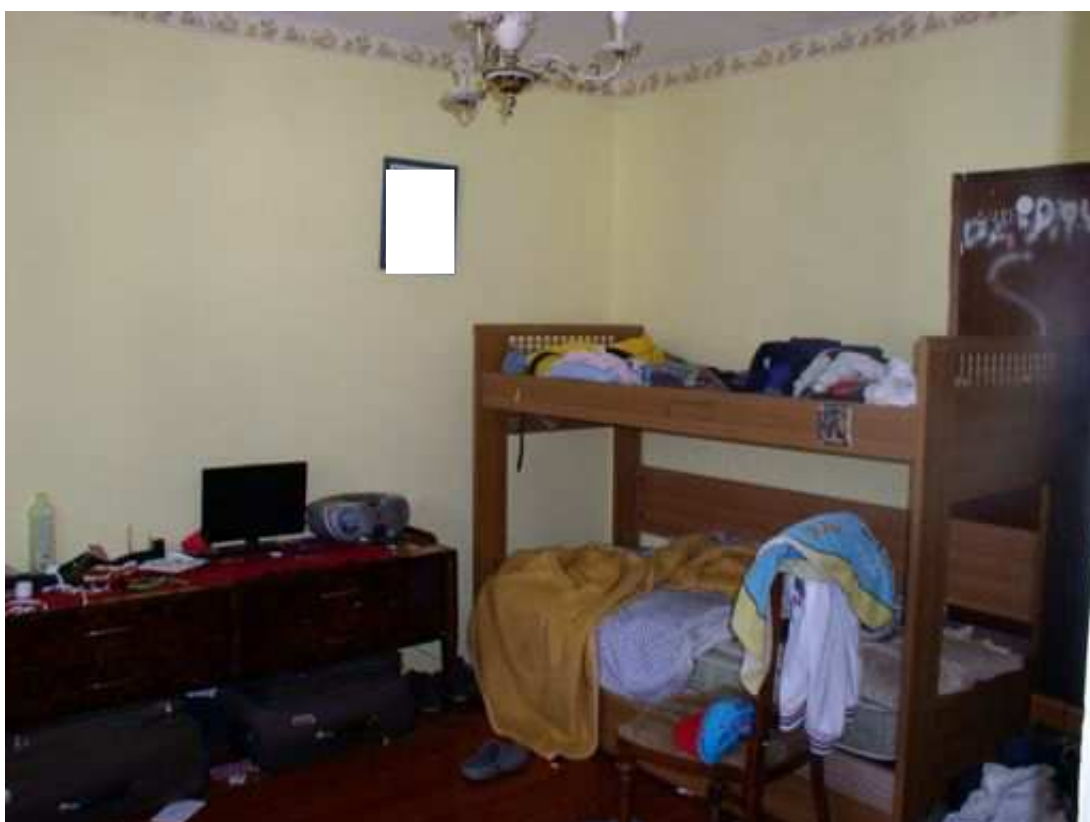
camera piano primo