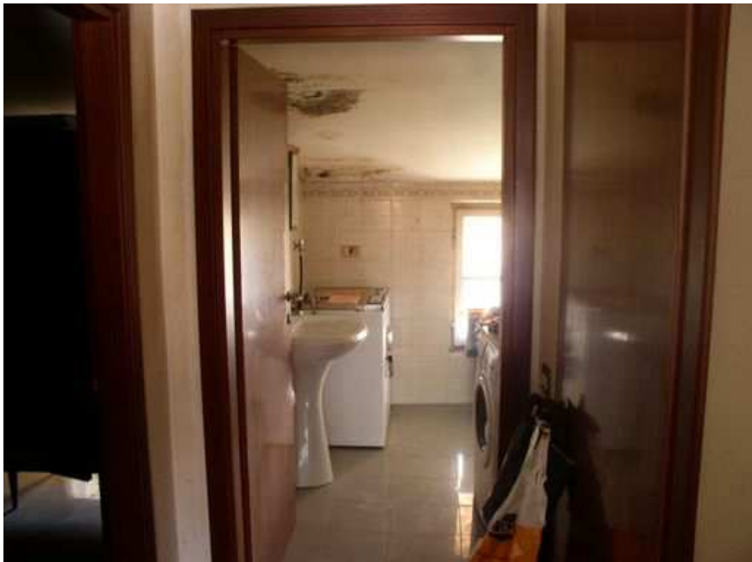
bagno piano secondo