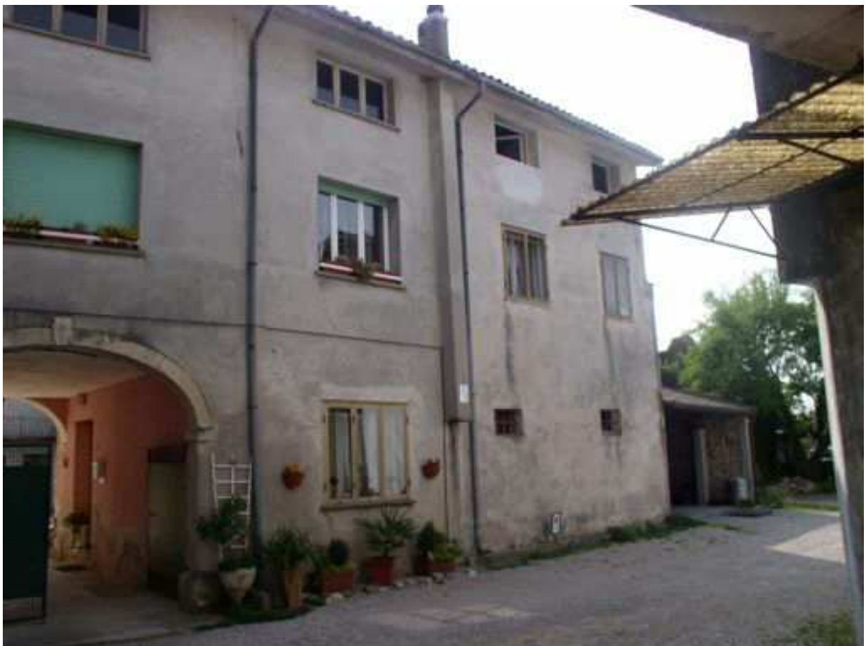
vista sul retro fronte ovest