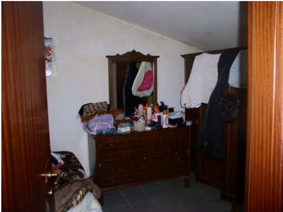
camera piano secondo