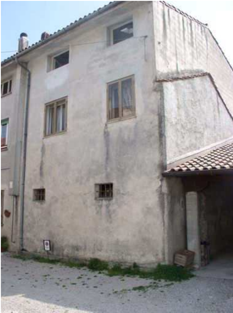
vista sul retro fronte ovest