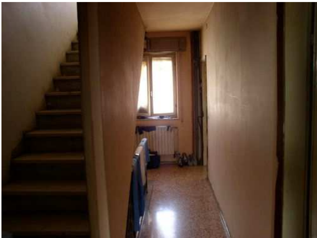
distribuzione-scala piano primo