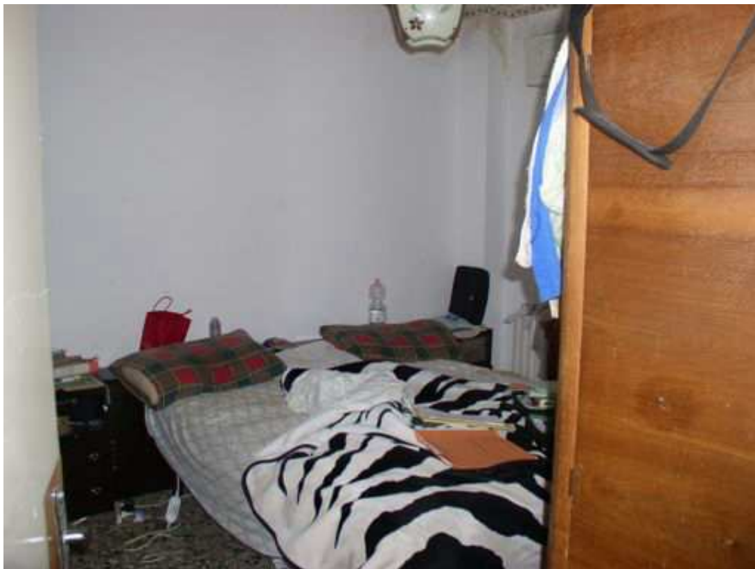
camera piano primo