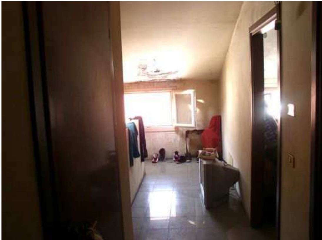
distribuzione piano secondo