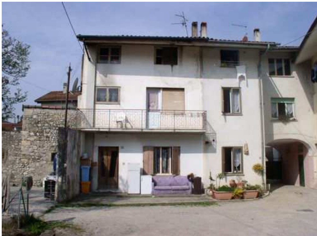
vista sulla corte interna fronte est