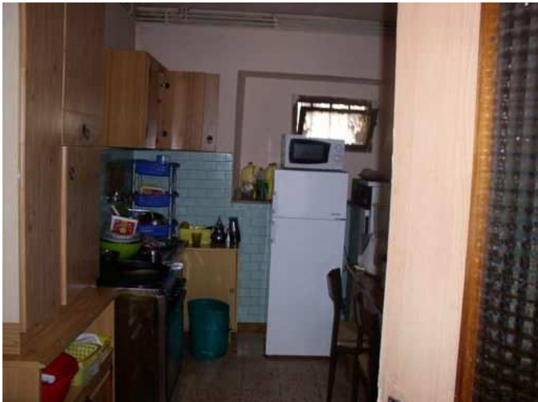
cucina piano terra