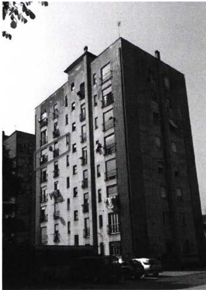
Viste retro edificio