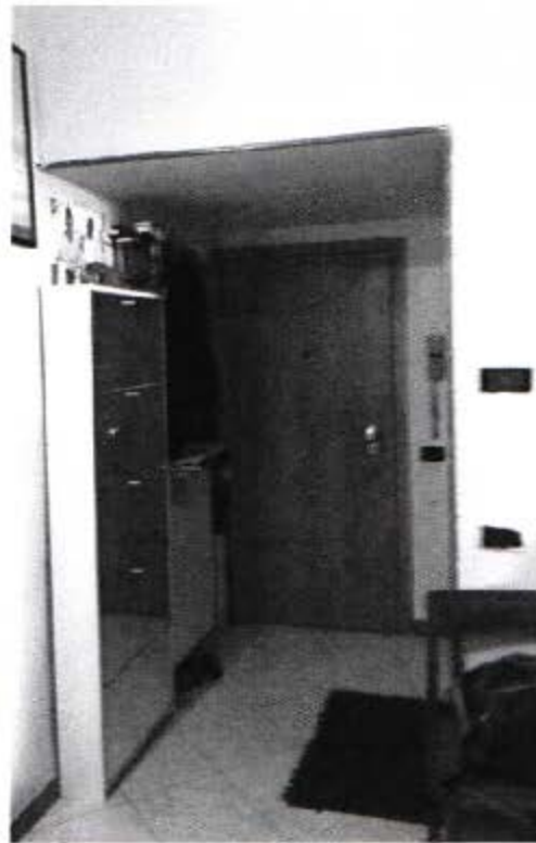
vista zona ingresso