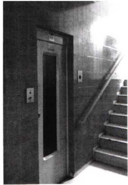
Viste atrio d'ingresso e vano scale