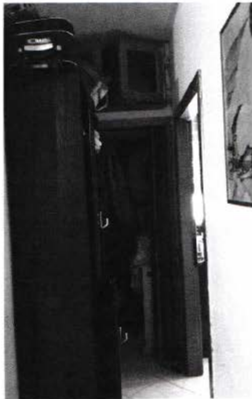
Vista disimpegno notte e ripostiglio soppalcato