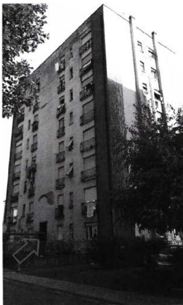
Vista fronte edificio da via Curiel