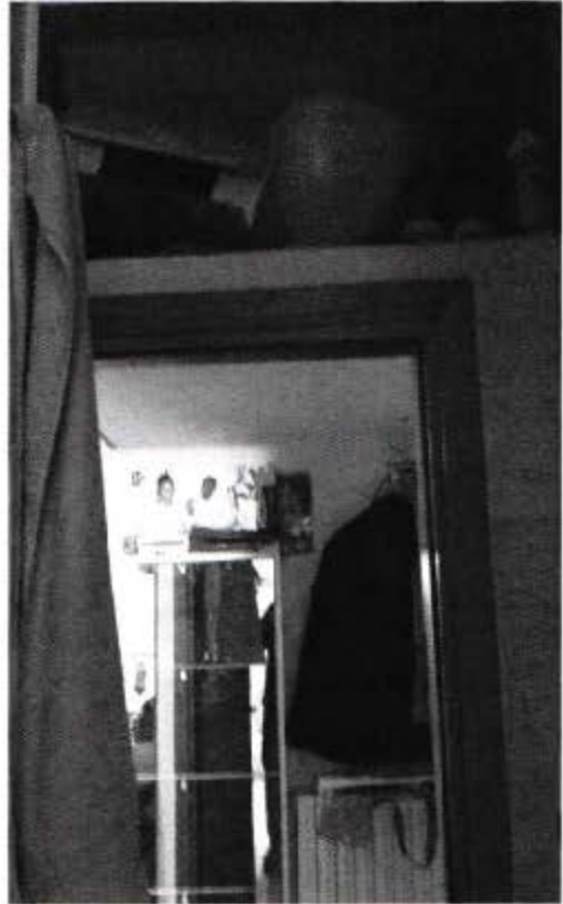
Viste antibagno e soppalco