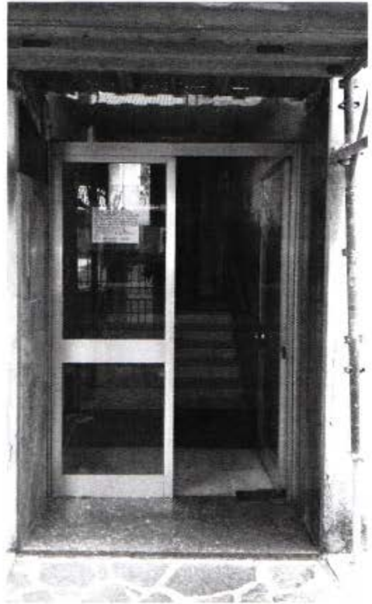
Viste accesso pedonale da via Curiel