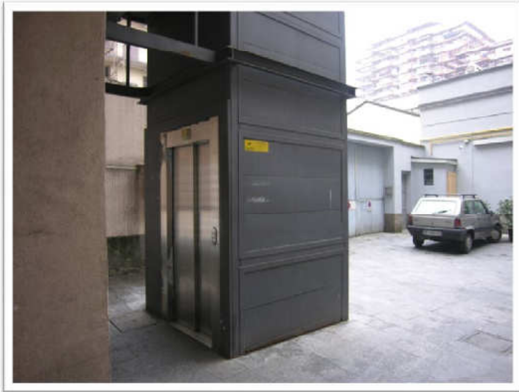
L'ascensore ed il cortile.