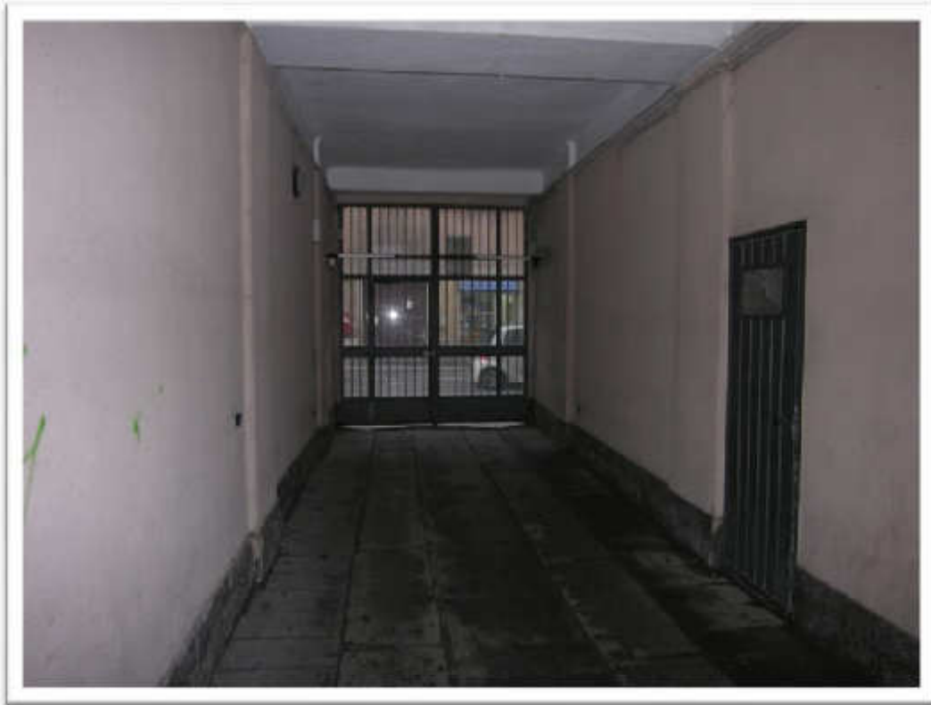
L'androne e la scala.