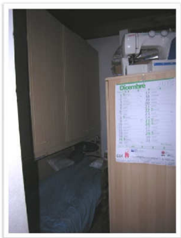
Il ripostiglio e parte della parete nord con presenza di muffe.