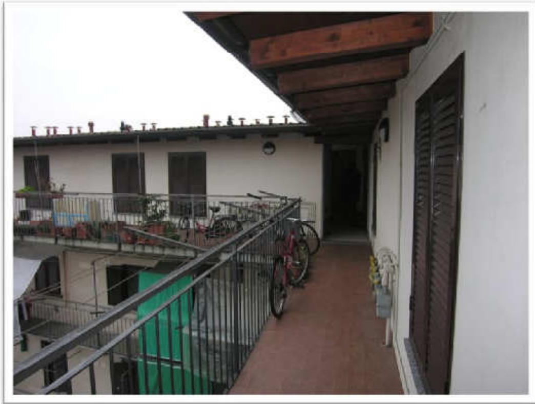
Il ballatoio verso il lato Nord e particolare dell'ingresso all'appartamento.