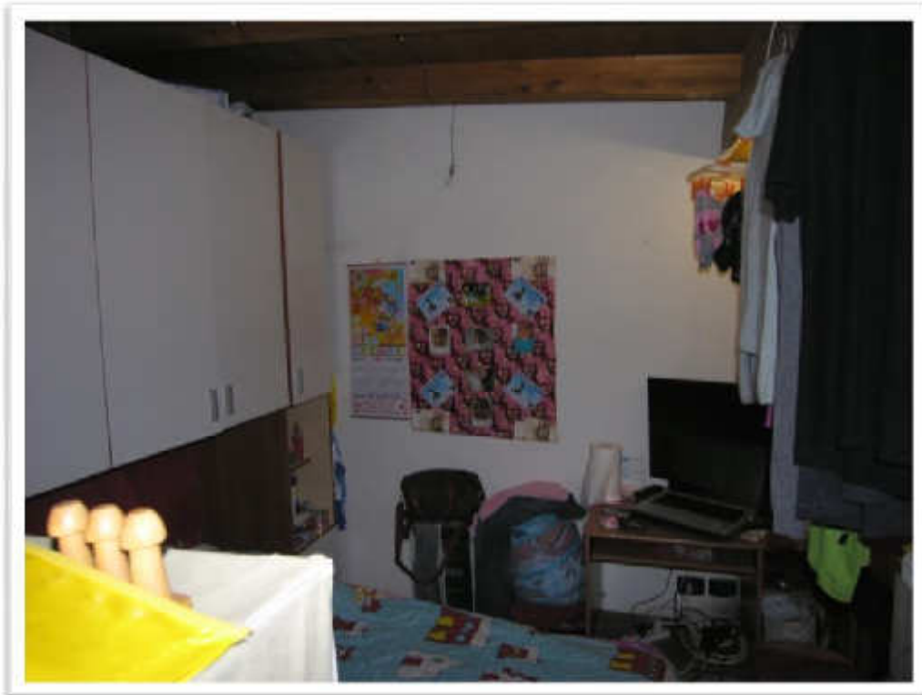
La camera da letto.