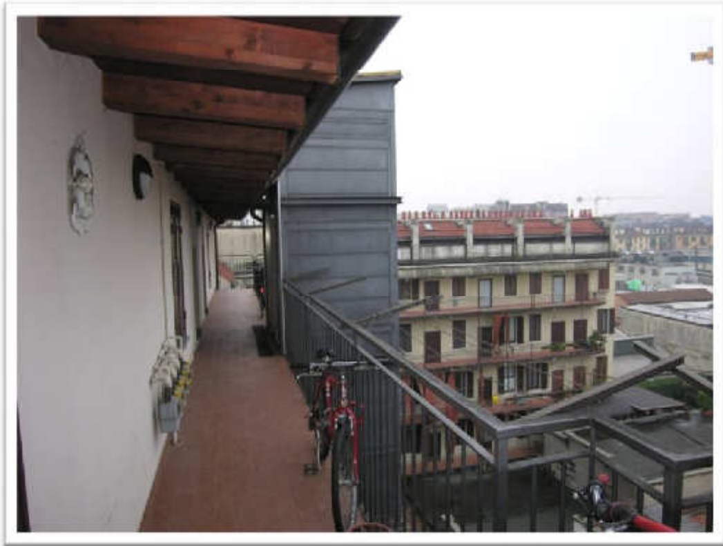
L'ascensore al 6° piano (settimo fuori terra).