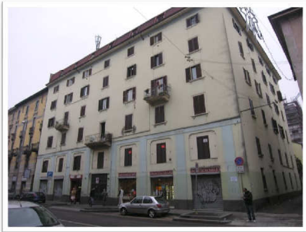
Vista del palazzo condominiale da via Imbonati e particolare dell'ingresso condominiale.