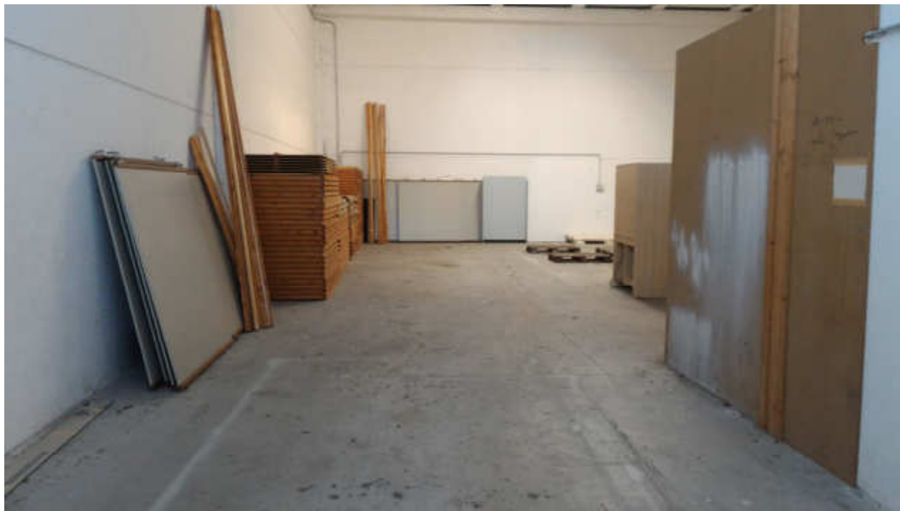
FOTO N.12 FOGLIO 15, MAPPALE 629 COMUNE DI FOSSALTA DI PORTOGRUARO (VE)