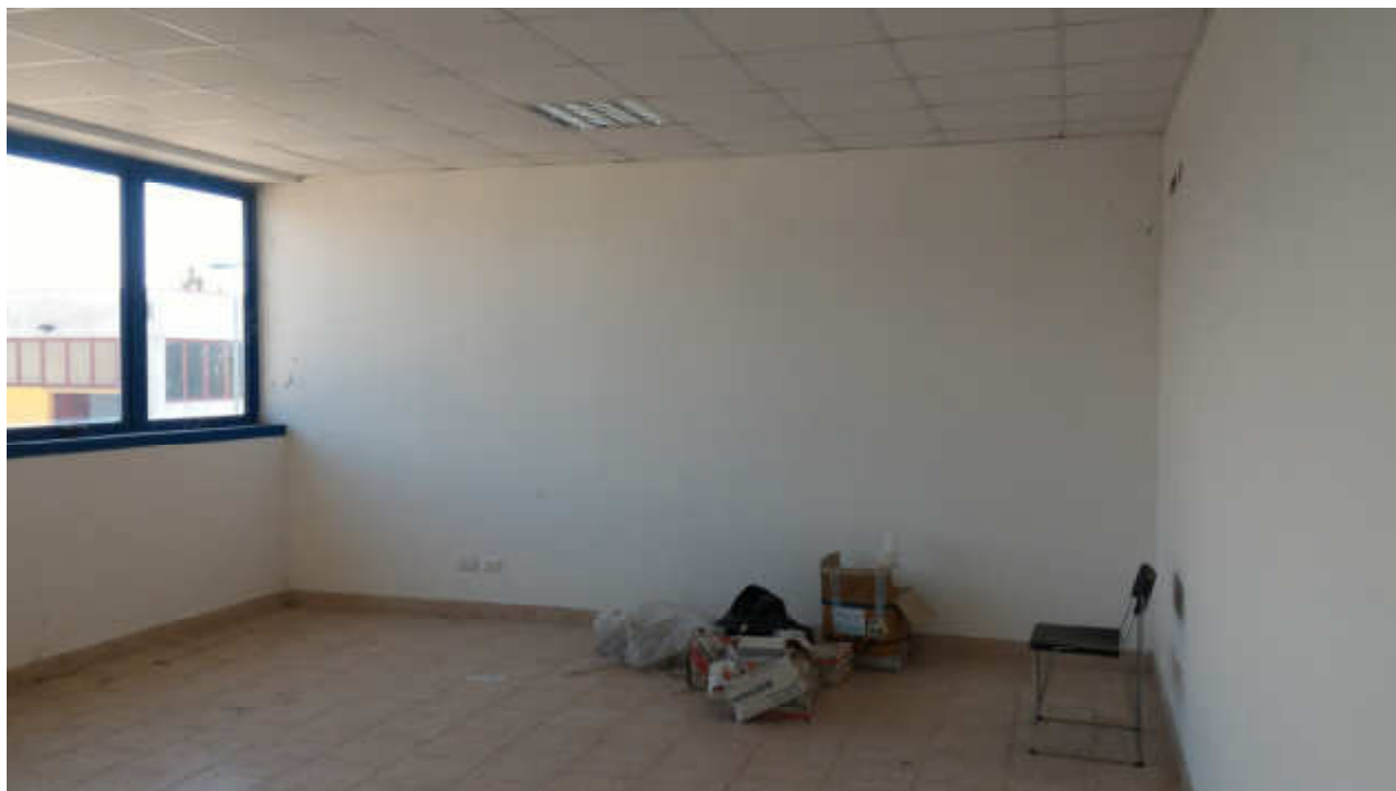
FOTO N.16 FOGLIO 15, MAPPALE 629 COMUNE DI FOSSALTA DI PORTOGRUARO (VE)