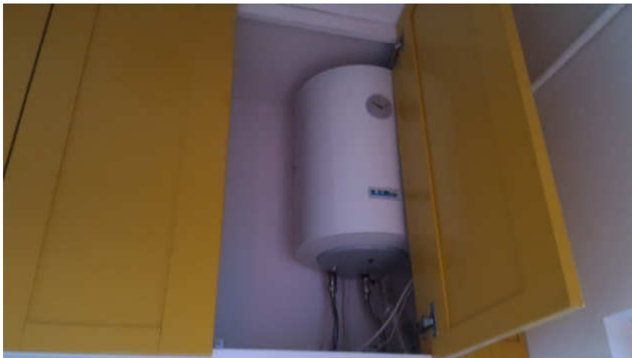
FOTO N.10 FOGLIO 15, MAPPALE 629 COMUNE DI FOSSALTA DI PORTOGRUARO (VE)