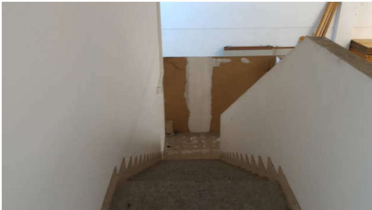
FOTO N.14 FOGLIO 15, MAPPALE 629 COMUNE DI FOSSALTA DI PORTOGRUARO (VE)