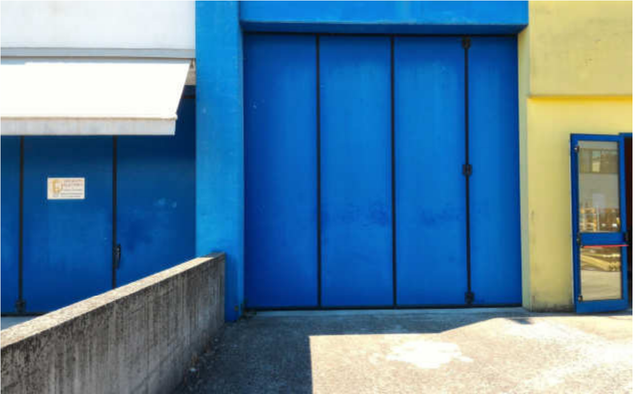
FOTO N.04 FOGLIO 15, MAPPALE 629 COMUNE DI FOSSALTA DI PORTOGRUARO (VE)