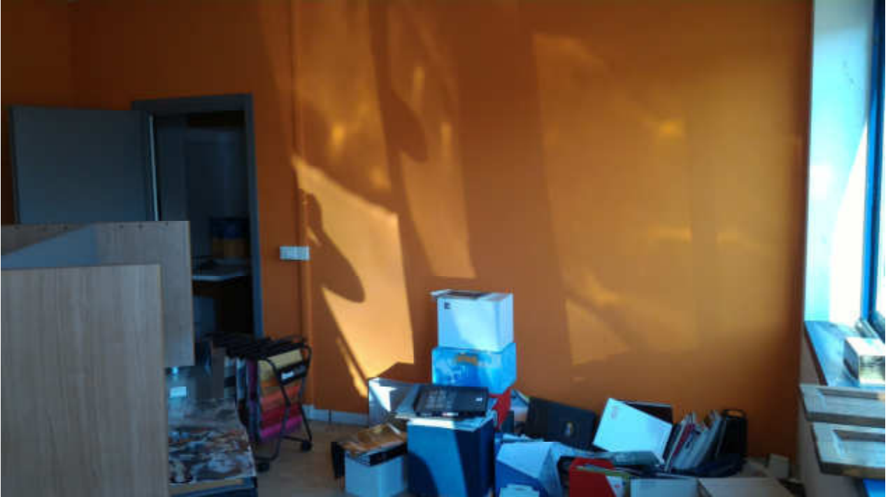
FOTO N.06 FOGLIO 15, MAPPALE 629 COMUNE DI FOSSALTA DI PORTOGRUARO (VE)