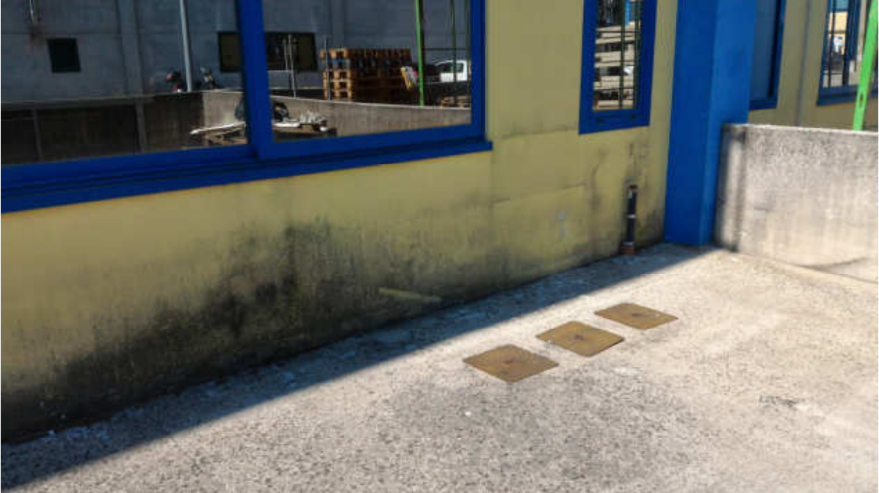
FOTO N.18 FOGLIO 15, MAPPALE 629 COMUNE DI FOSSALTA DI PORTOGRUARO (VE)