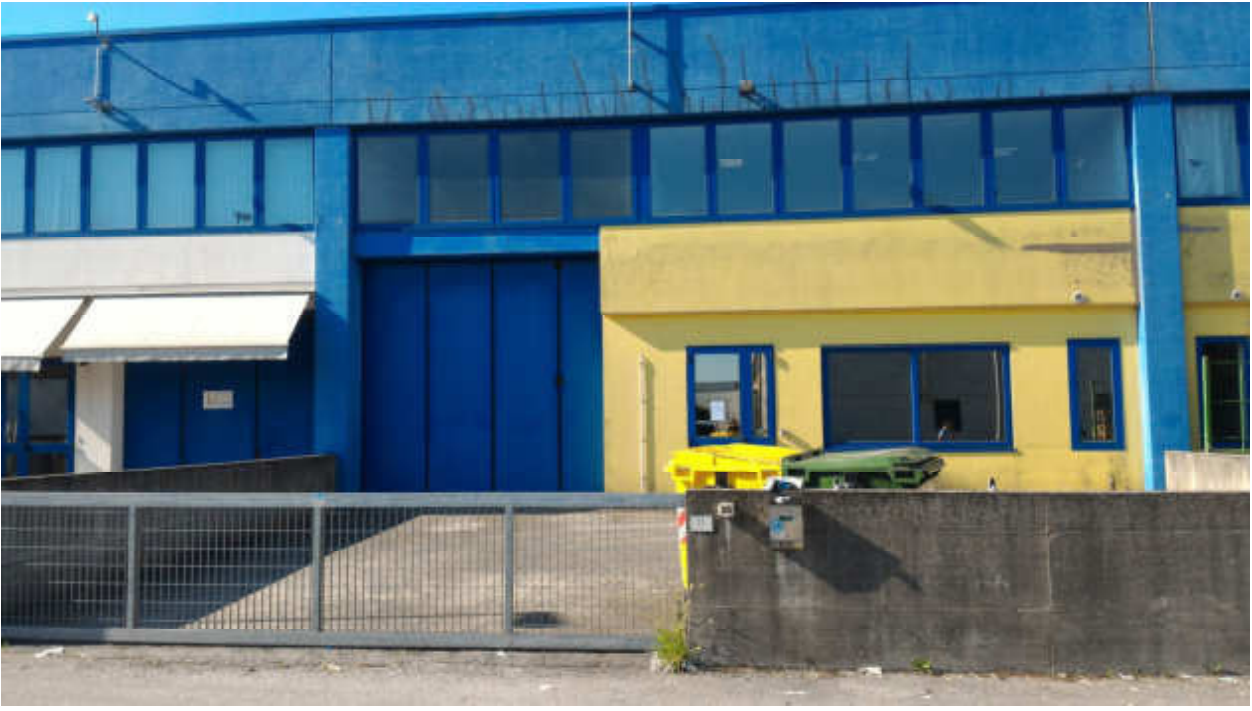
FOTO N.02 FOGLIO 15, MAPPALE 629 COMUNE DI FOSSALTA DI PORTOGRUARO (VE)