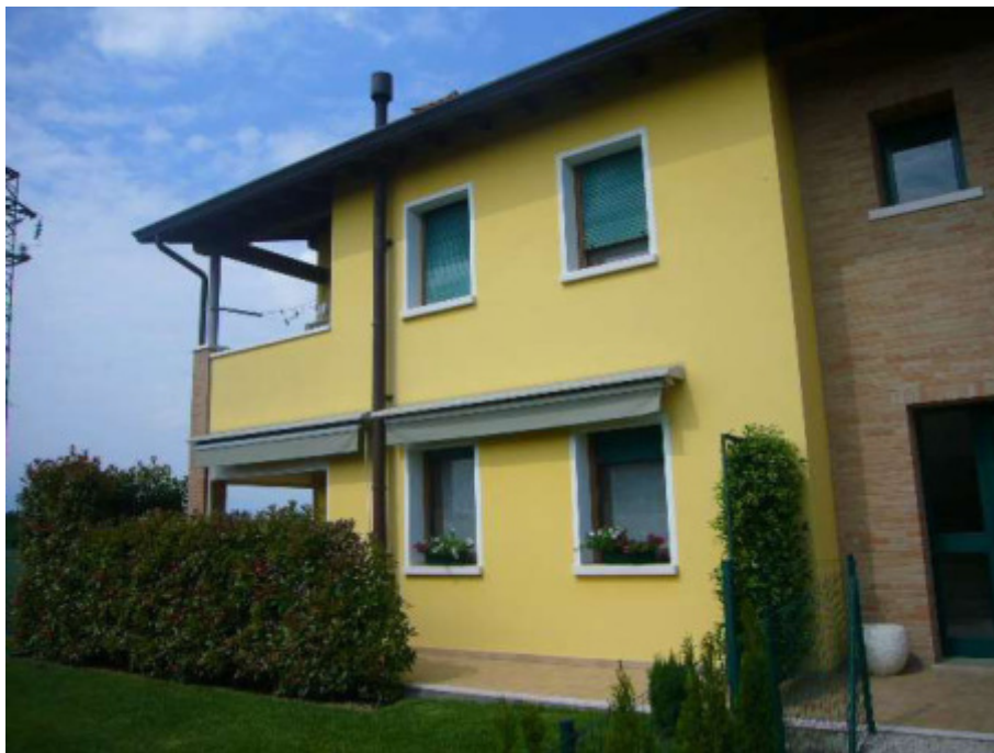
APPARTAMENTO LATO SUD OVEST