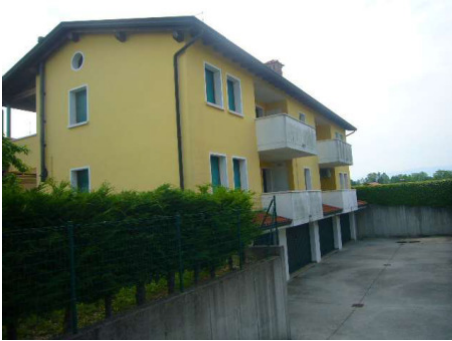
LATO NORD EST