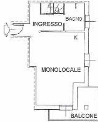
PIANTA PIANO PRIMO H.=2,70 m.