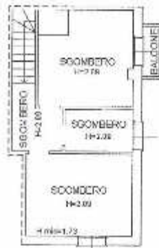
PIANTA PIANO SECONDO SOTTOTETTO H. MEDIA = 2,07 m.