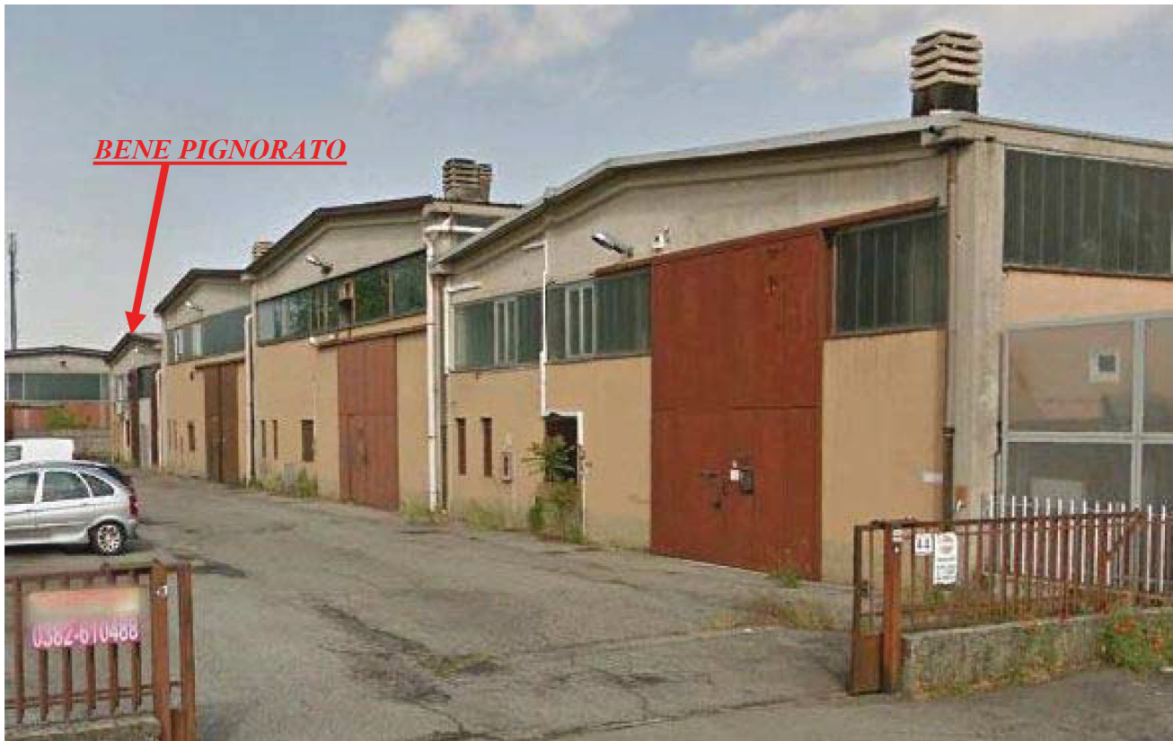
Foto n. 1 – Cortile comune ed indicazione del luogo ove si trova il capannone oggetto di perizia