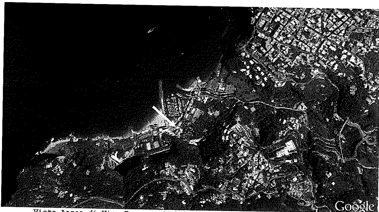
Vista Aerea di Vico Ecquense (Na) con l'individuazione dell'immobile

Di seguito si riportano le foto satellitari al fine dell'esatta individuazione dell'immobile oggetto di stima.