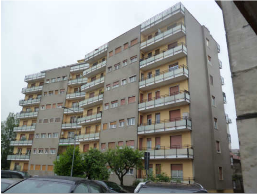
FOTO 1 – Edificio di Via Paolo Goglio 1/B, all'ultimo piano si trova l'unità pignorata