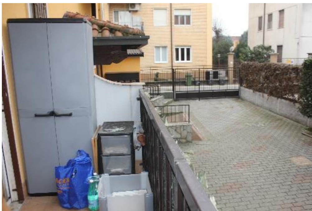
FOTO 8: BAREGGIO (MI), VIA G. CESARE 2, balcone con accesso dalla cucina