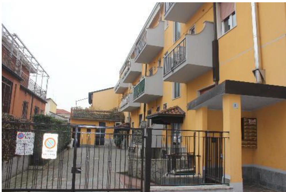
FOTO 1: BAREGGIO (MI), VIA G. CESARE 2, vista fabbricato da via G. Cesare