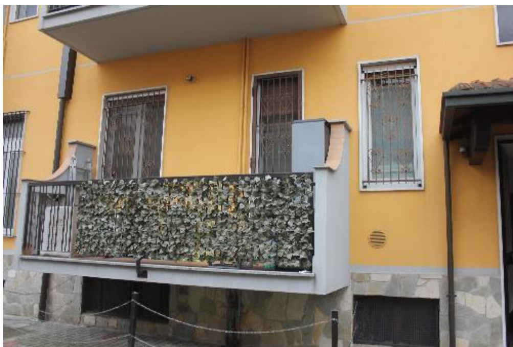
FOTO 2: BAREGGIO (MI), VIA G. CESARE 2, vista appartamento dal cortile condominiale