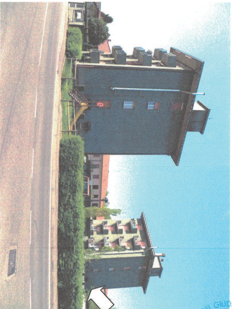
Foto 2 - Condominio e localizzazione unità immobiliare