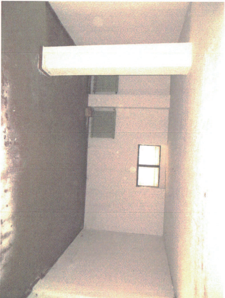
Foto 16- magazzino unico locale; i termosifoni facevano parte dell'impianto condominiale ora dimesso. Il locale è sprovvisto di impianto di riscaldamento