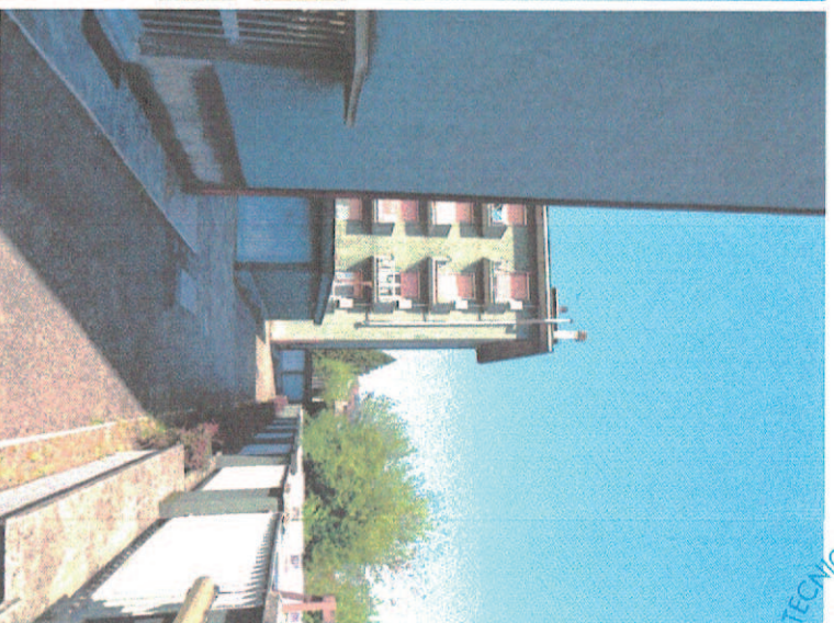
Foto 5 - parti comuni, cortile