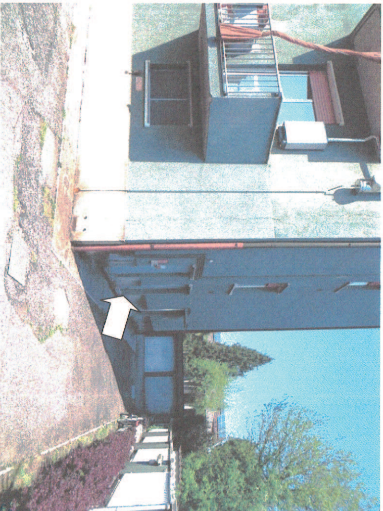
Foto 8 - parti comuni e localizzazione unità immobiliare