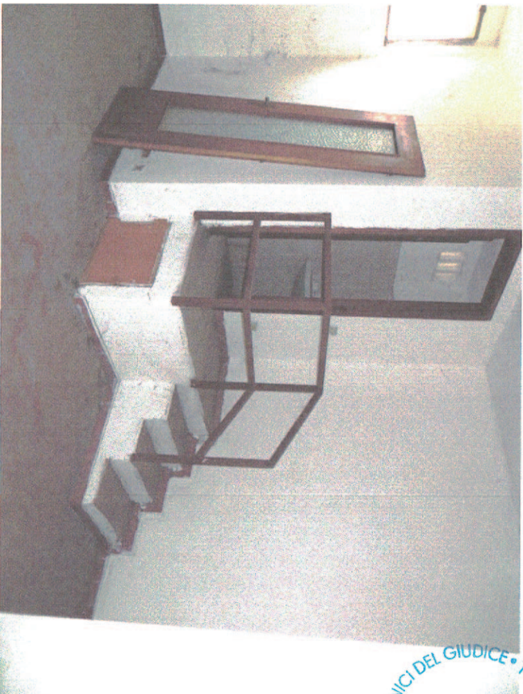
Foto 17 - scaletta di accesso al servizio igienico