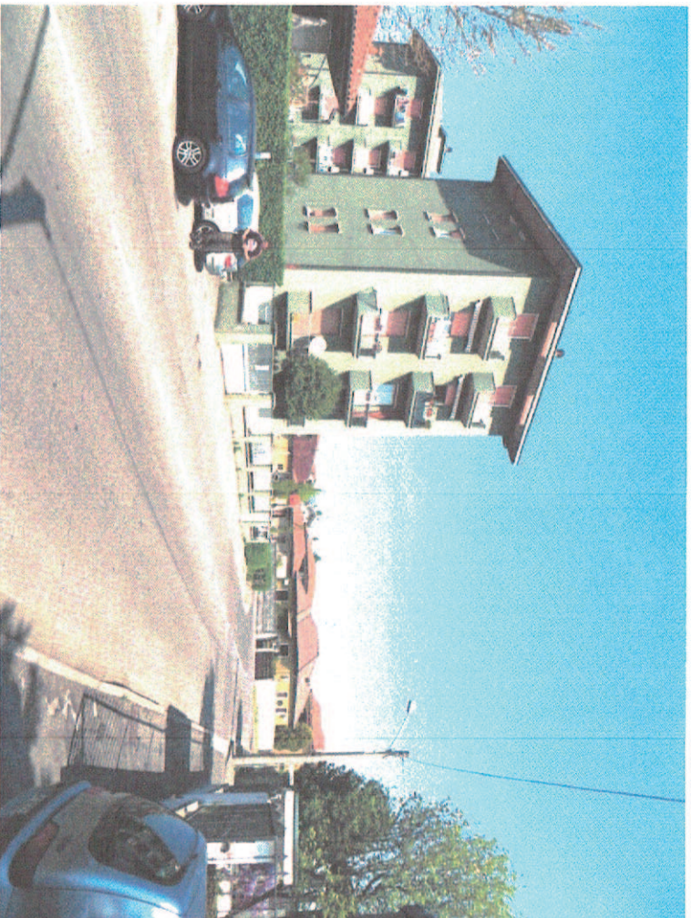
Foto 1 - Via San Martino della Battaglia