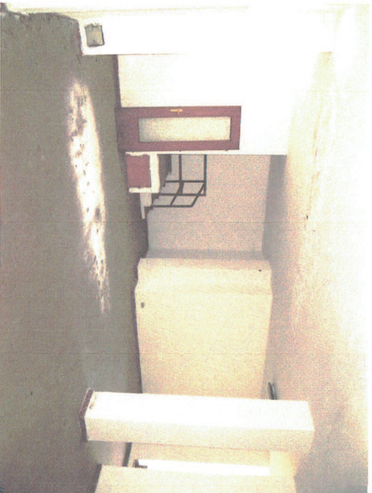
Foto 14- magazzino unico locale; scaletta di accesso al servizio igienico