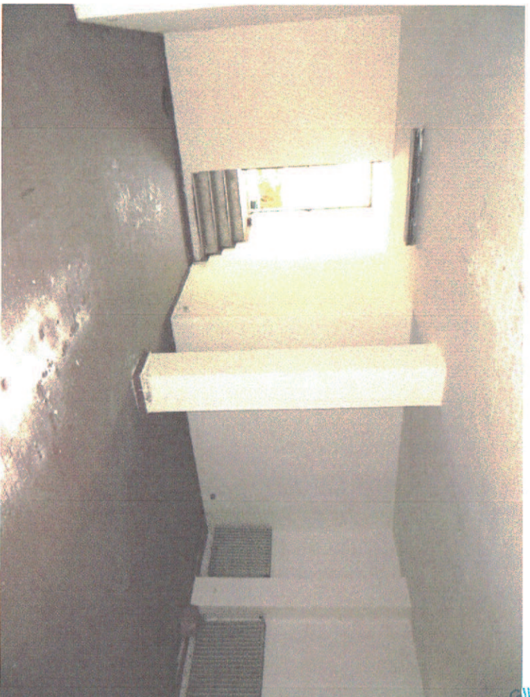
Foto 15- magazzino unico locale; scaletta di ingresso dal cortile - i termosifoni facevano parte dell'impianto condominiale ora dimesso.