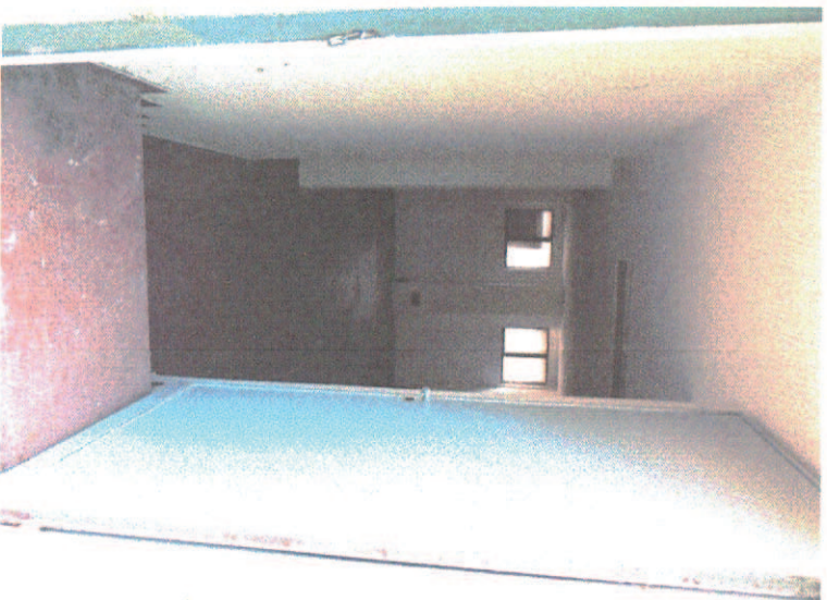
Foto 11 - ingresso all'unità immobiliare