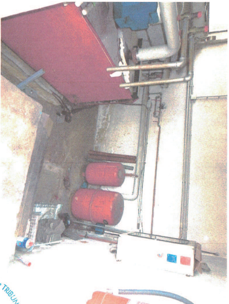
Foto 10 - locale caldaia condominiale, impianto dismesso.