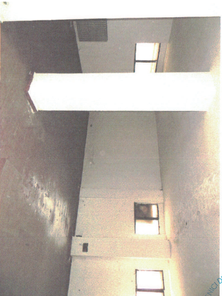
Foto 13 - magazzino unico locale