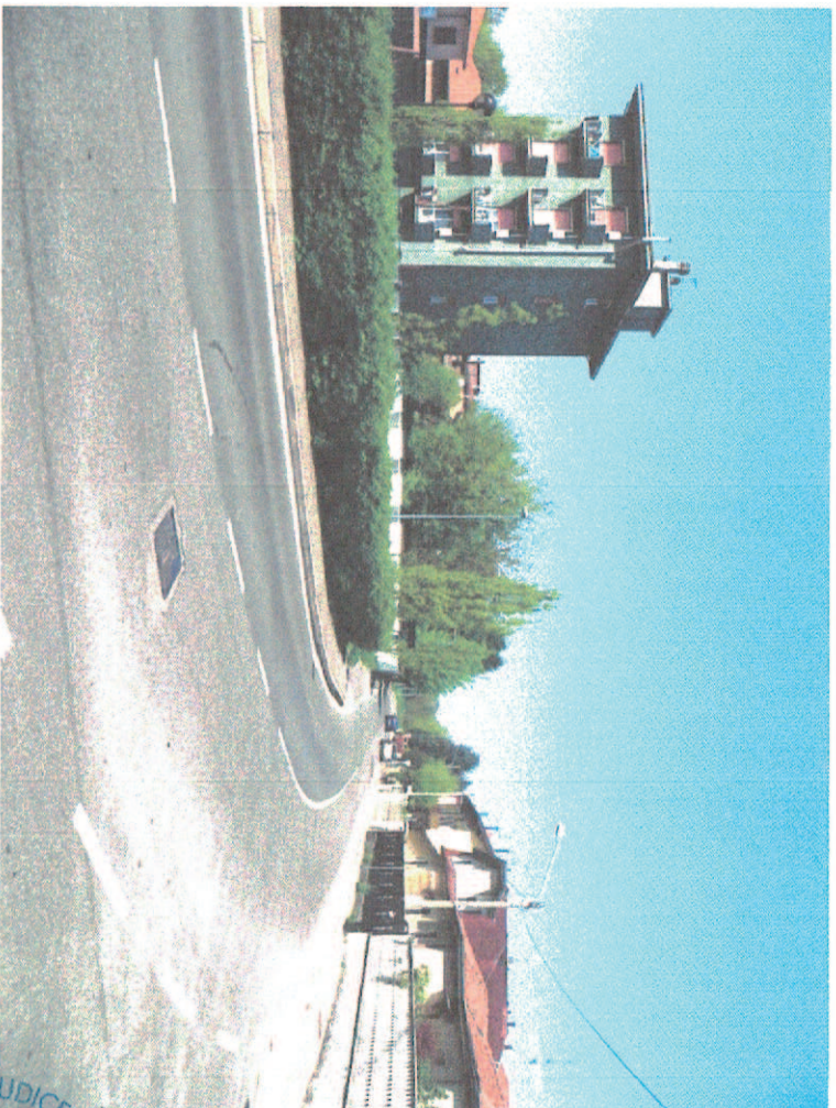
Foto 3 - Via san Martino della Battaglia