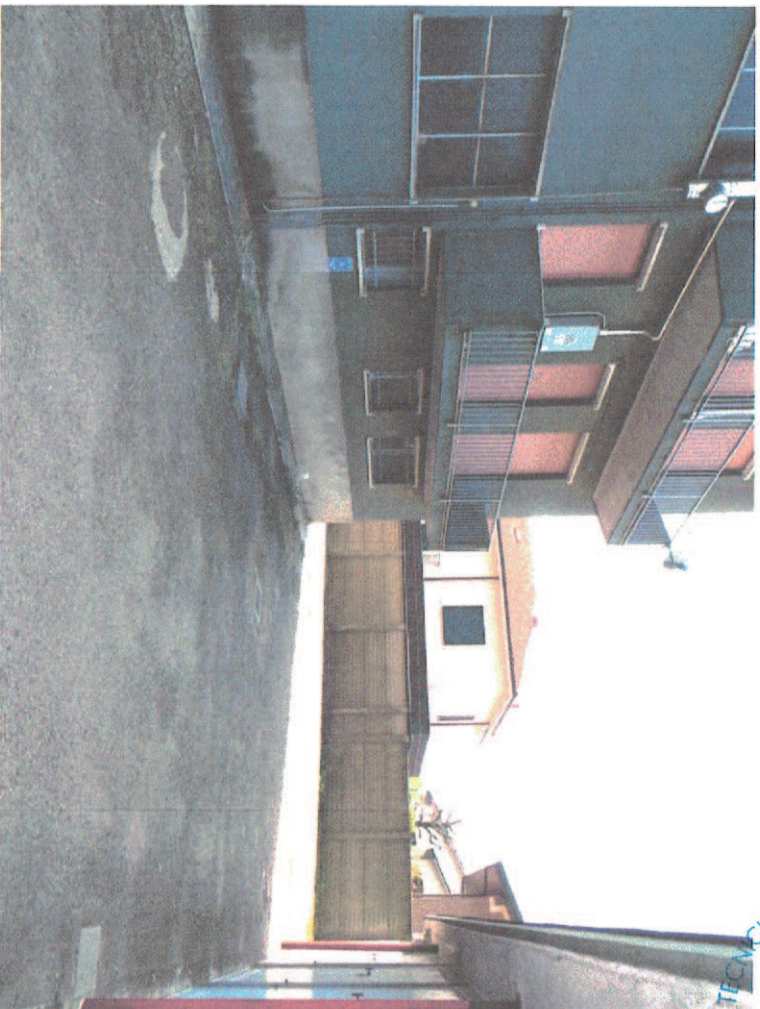
Foto 7 - parti comuni cortile