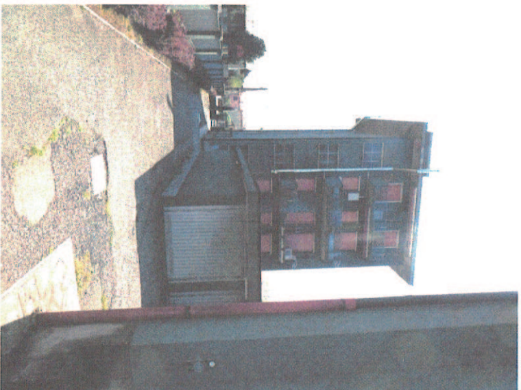
Foto 6- parti comuni , cortile