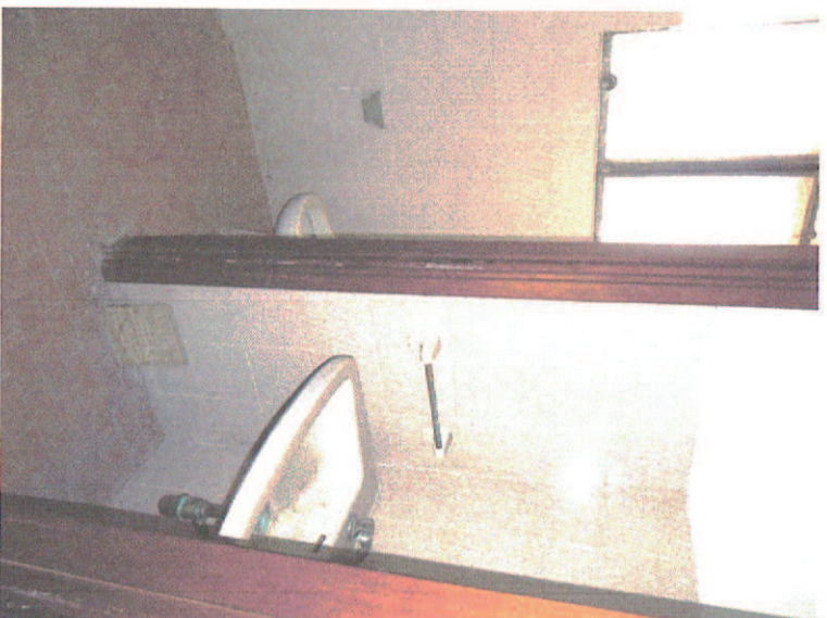
Foto 18 - servizio igienico io igienico