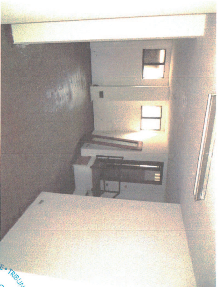
Foto 12 - unico locale magazzino