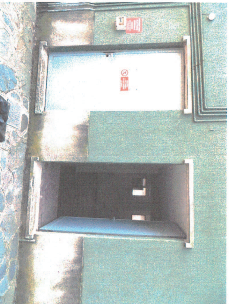
Foto 9 - ingresso al locale caldaia (dismessa) e ingresso all'unità immobiliare