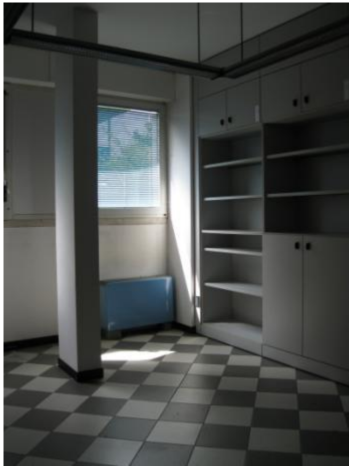
Foto 11 Locale creato da parete attrezzata