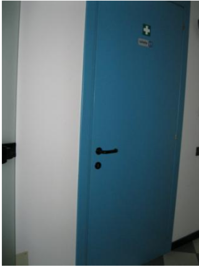
Foto 17 Porta del bagno