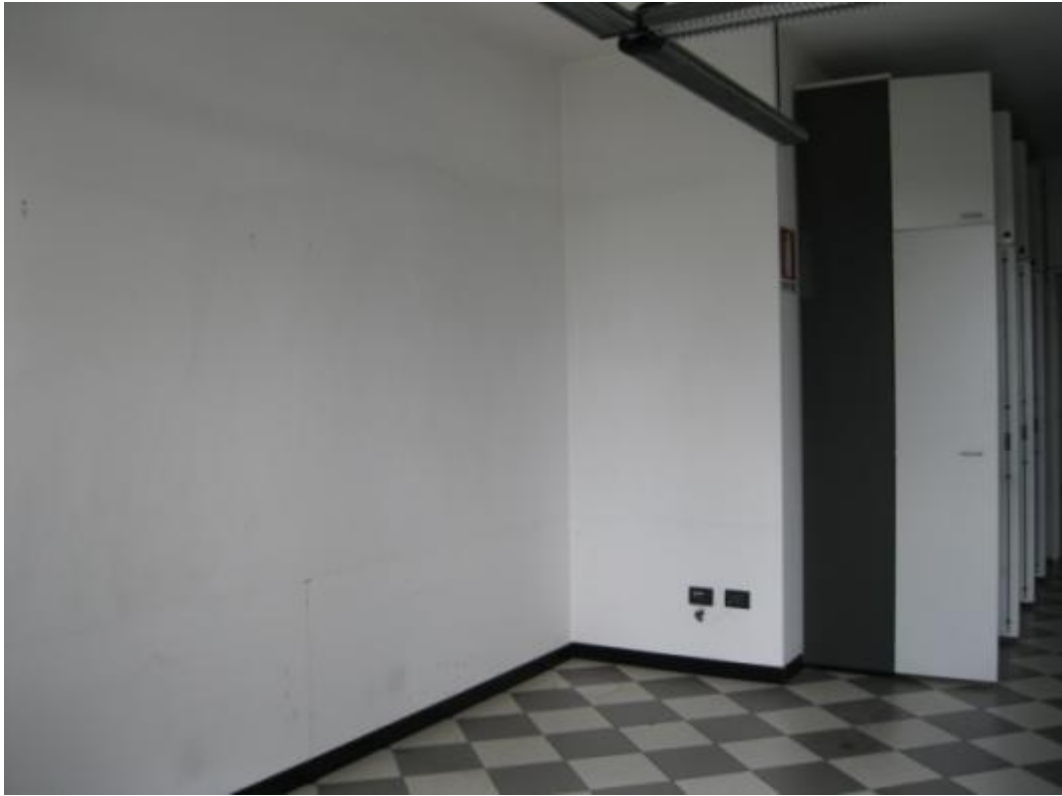
Foto 7 Locale di ingresso