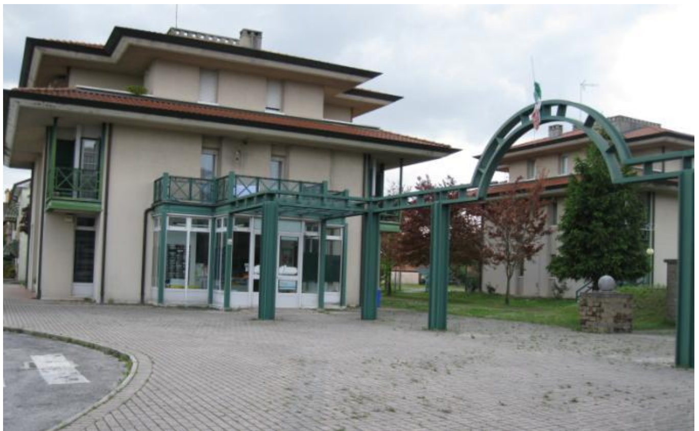
Foto 6 Ingresso al complesso residenziale e vista su palazzina gemella