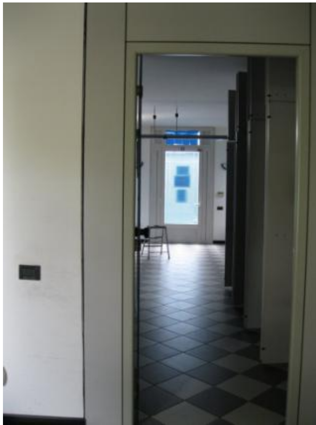
Foto 14 Vista locali con in fondo portone d'ingresso