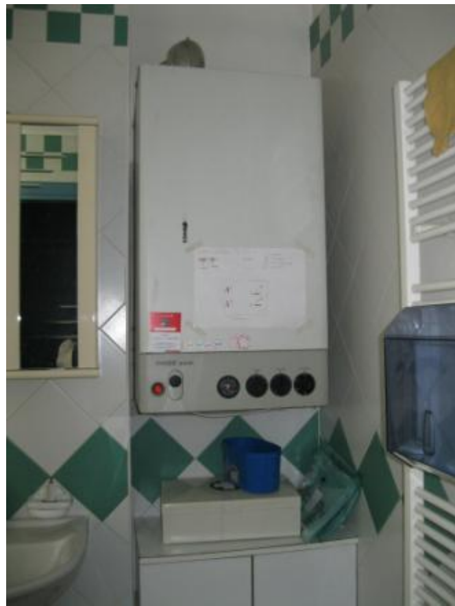
Foto 16 Particolari bagno