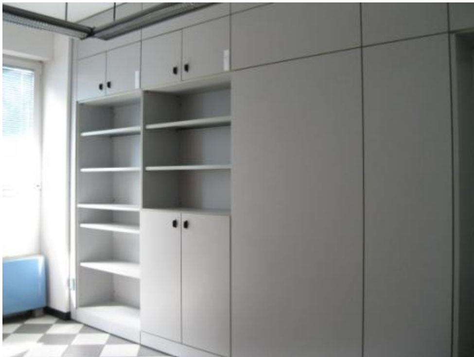
Foto 12 Parete attrezzata che funge da divisorio