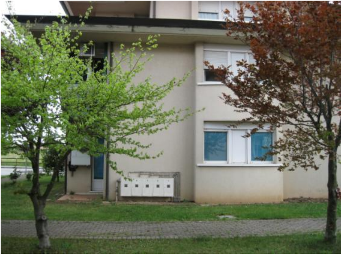
Foto 3 Vista laterale da Via Vittorio Cadel