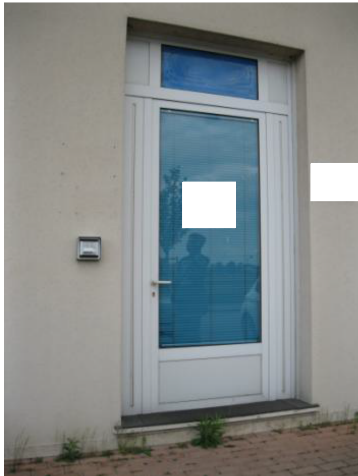
Foto 4 Portone d'ingresso da Via Dogana