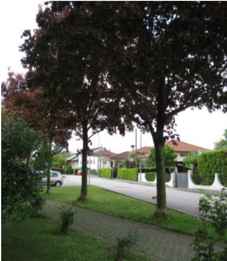
Foto 5 Area verde del complesso residenziale