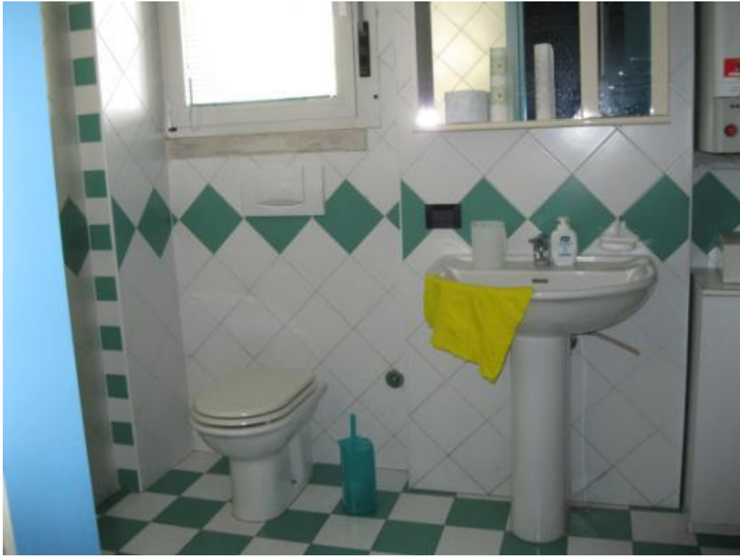
Foto 15 Bagno