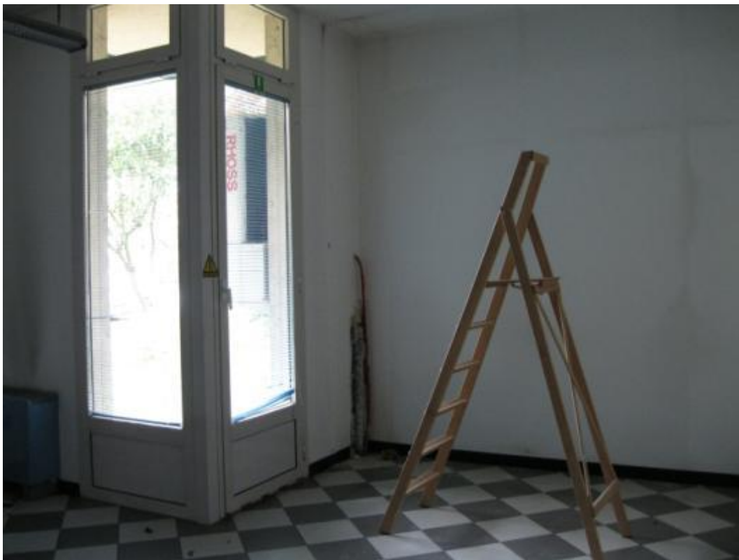
Foto 10 Locale creato da parete attrezzata