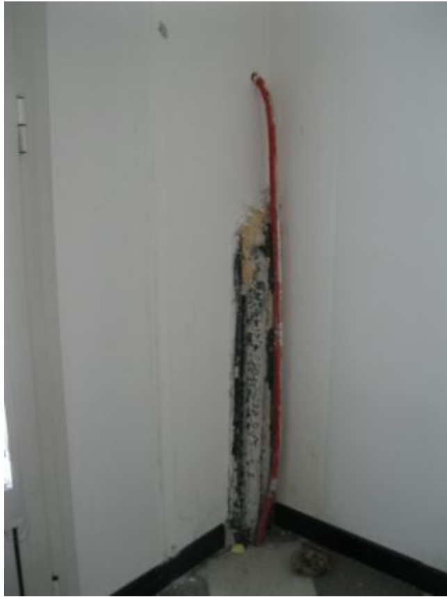
Foto 13 Dettaglio tubatura esposta