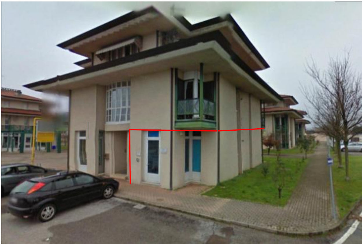
Foto 2 Vista esterna con evidenziata porzione oggetto di esecuzione