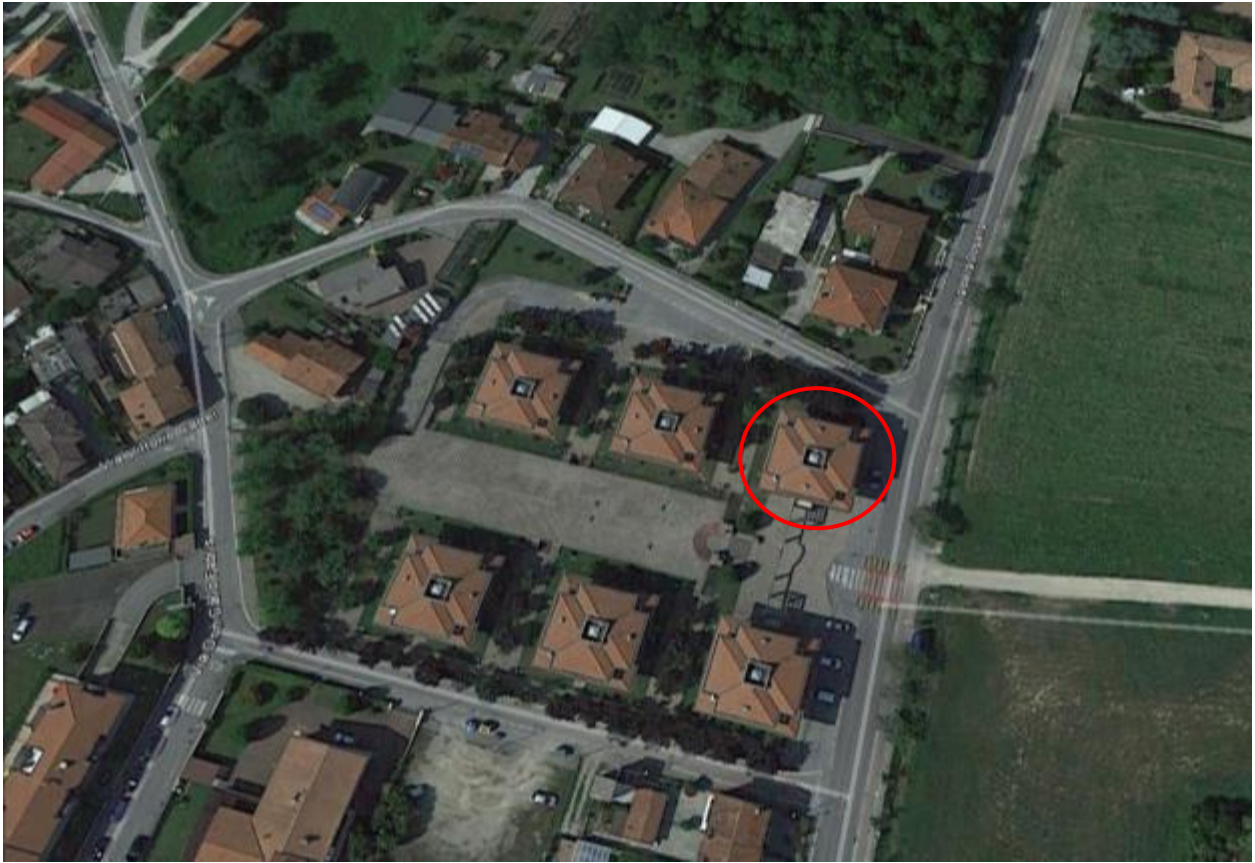
Foto 1 Localizzazione su ortofoto