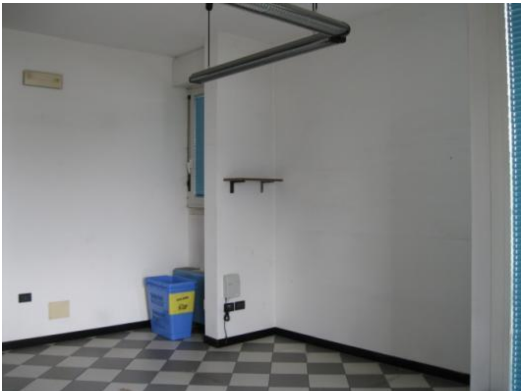
Foto 8 Locale di ingresso