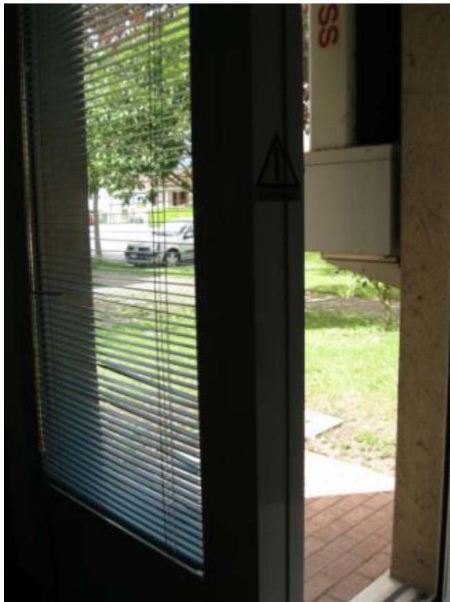
Foto 18 Dettaglio porta finestra