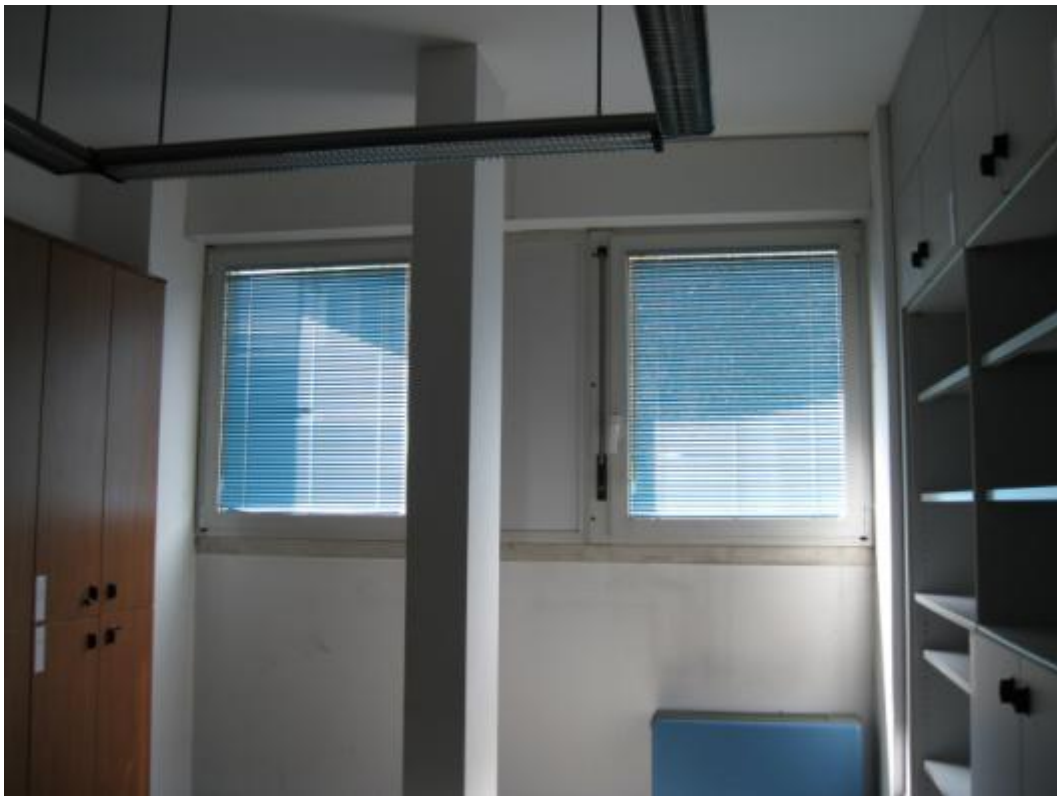
Foto 9 Locale creato da parete attrezzata