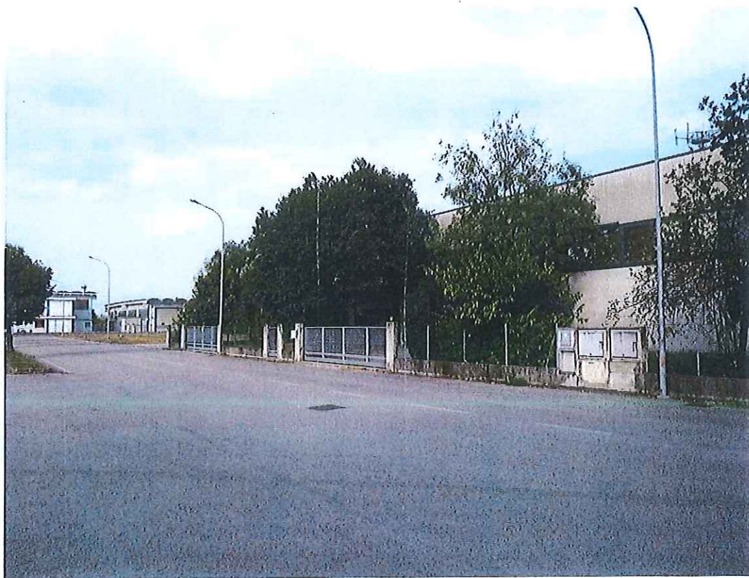
Foto n° 16 : Vista dell'immobile produttivo e dei relativi accessi carrai.