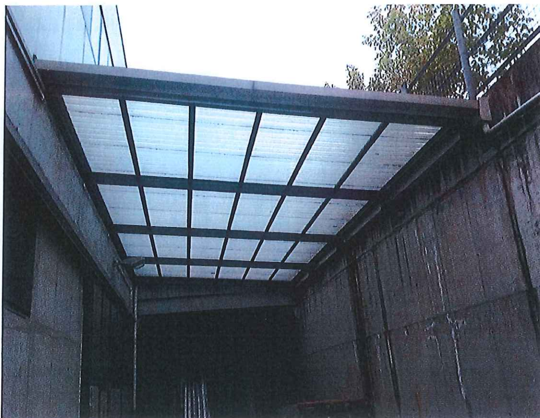
Foto n° 23 : Tettoia metallica nel fronte Est del complesso produttivo.