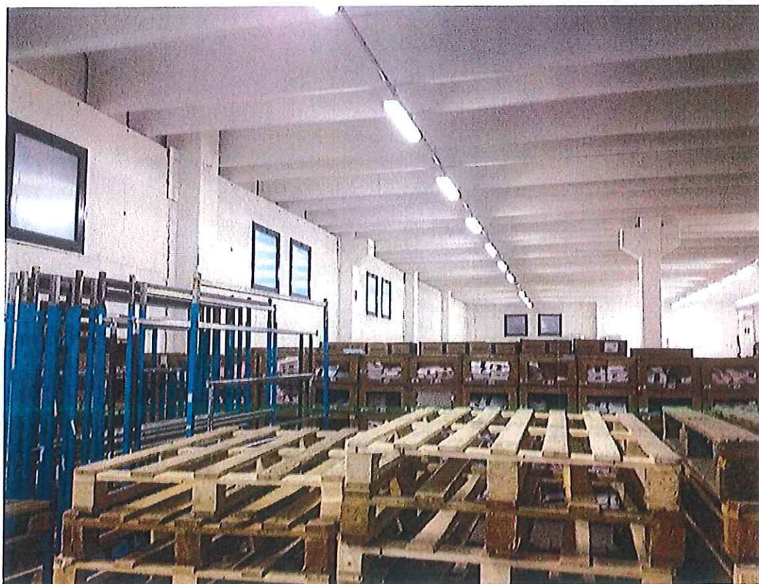
Foto n° 22 : Immobile di via Quarena – vista del piano interrato.