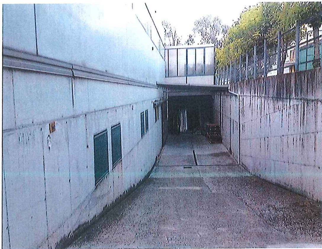
Foto n° 14 : Rampa per l'accesso al piano interrato del fabbricato in via Quarena.