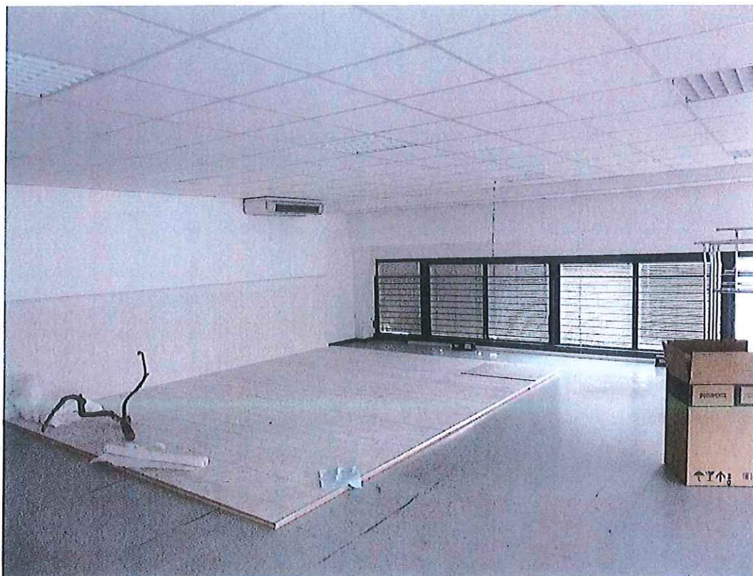
Foto n° 18 : Vano ubicato al di sopra dell'annesso adibito ad uffici.