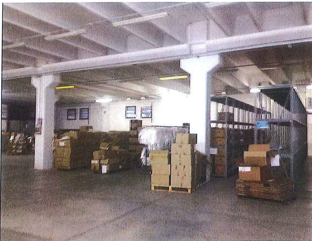
Foto n° 21 : Immobile di via Quarena – vista del piano interrato.