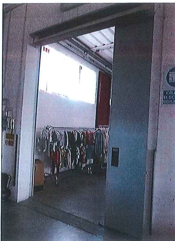
Foto n° 9 : Foro porta fra il fabbricato produttivo e quello adibito ad outlet.