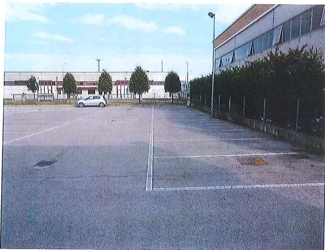
Foto n° 5 : Stato di fatto del mappale 920, attualmente adibito a parcheggio per la clientela.