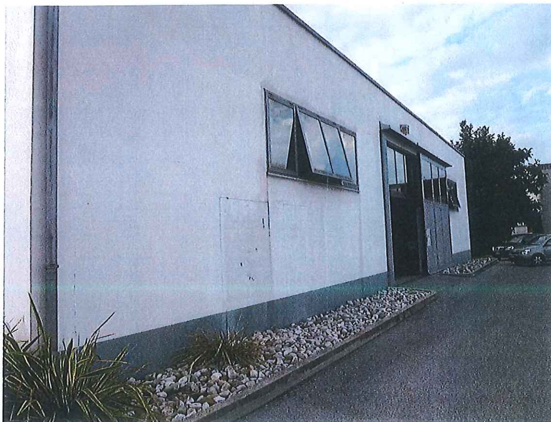
Foto n° 10 : Immobile adibito ad outlet insistente sul mappale n° 191.