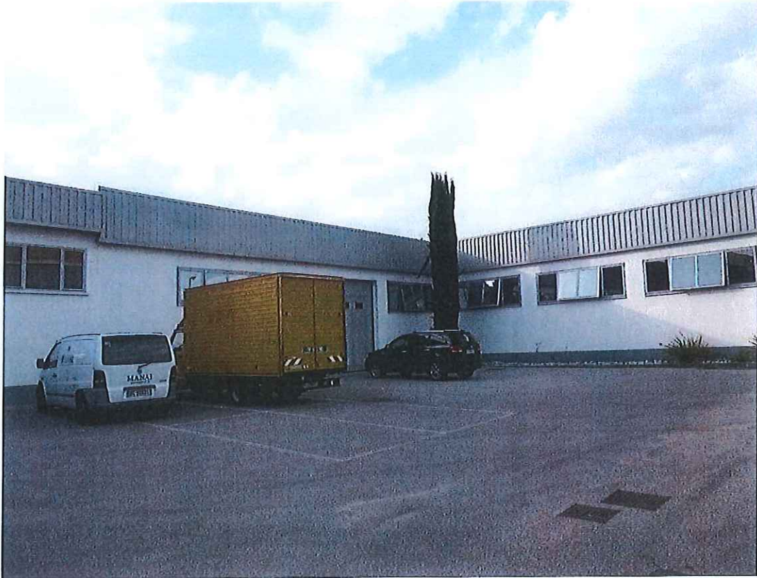
Foto n° 3 : Stato di fatto dell'area pertinenziale al fabbricato insistente sulla particella 200.