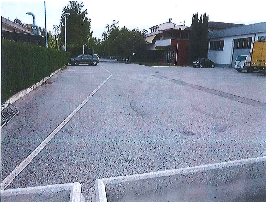
Foto n° 4 : Stato di fatto delle aree pertinenziali verso via Dolomiti.