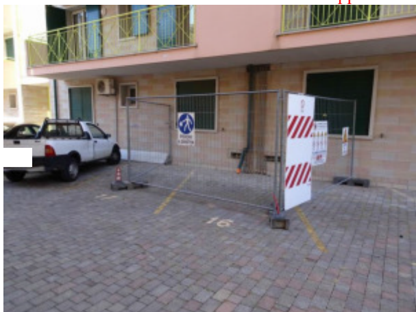
Particolare uso esclusivo posti macchina "P16" e "P17"