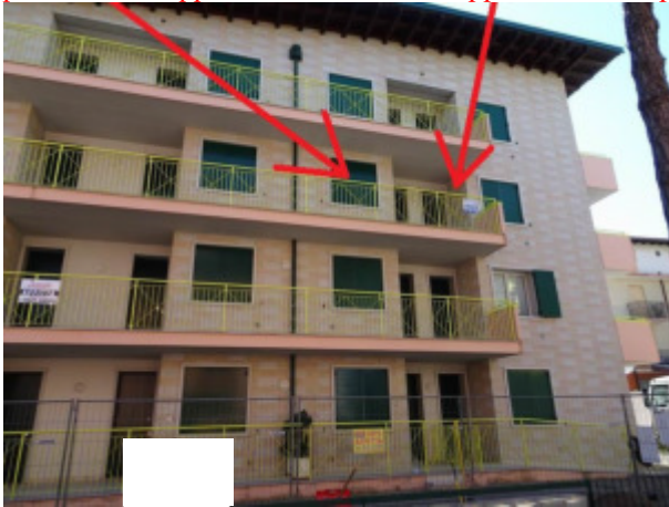
ulteriore particolare lato Nord