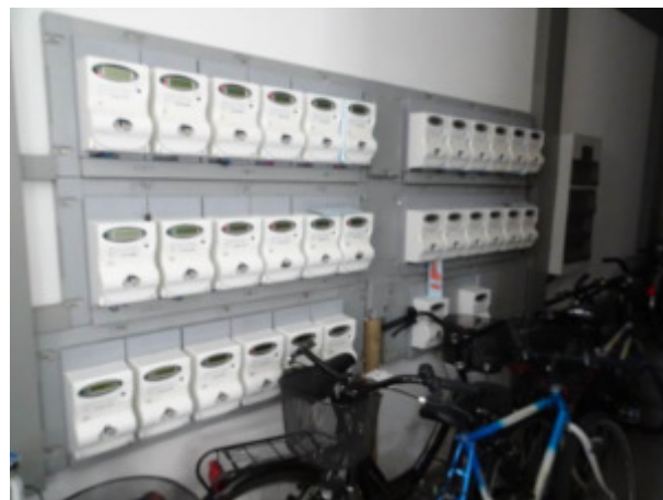
ulteriore particolare interno della stanza contatori -sub. 9-