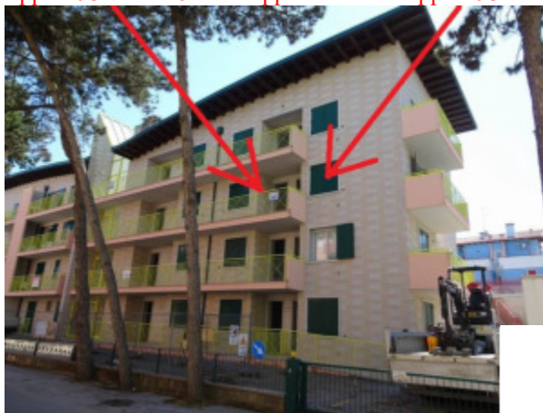
particolare del prospetto lato Nord-Ovest