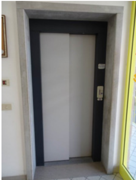
particolare vano ascensore piano terra