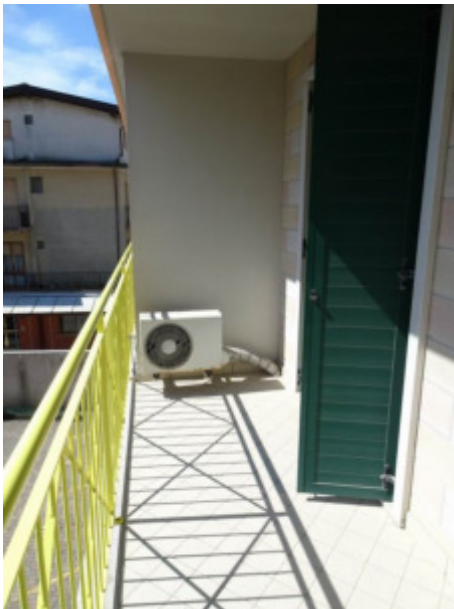
ulteriore particolare esterno poggiolo lato Sud