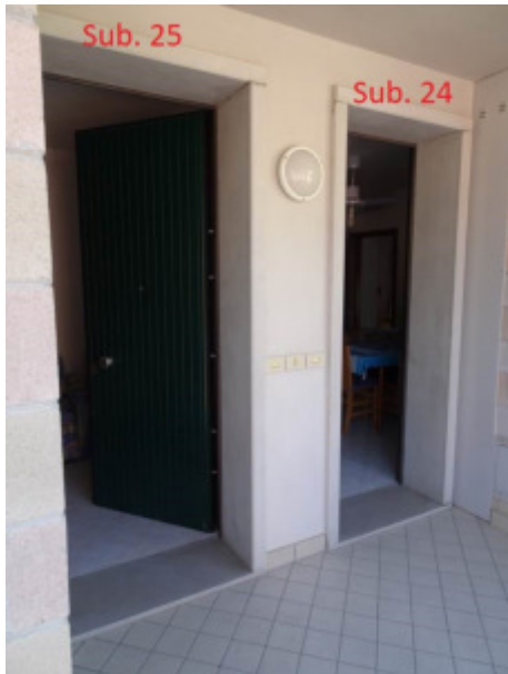
particolare ingresso appartamenti -mappale sub. 25 e sub. 24-