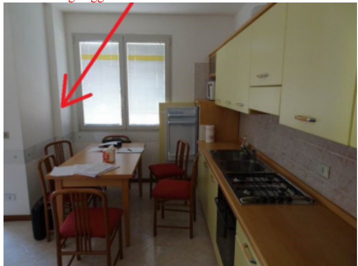
particolare risega oggetto di difformità catastale ed edilizia nel locale pranzo