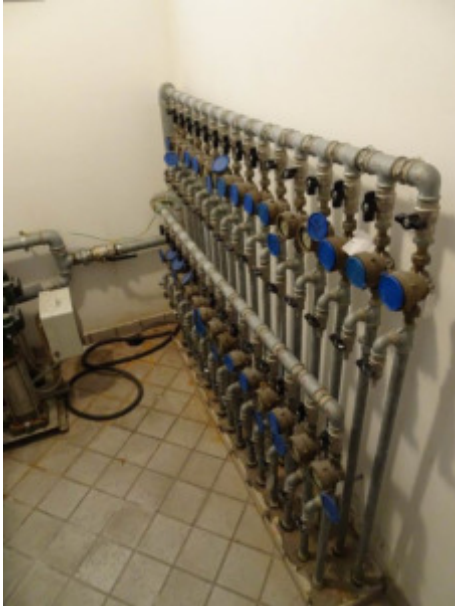
ulteriore particolare del locale contatori e autoclave -sub. 9-