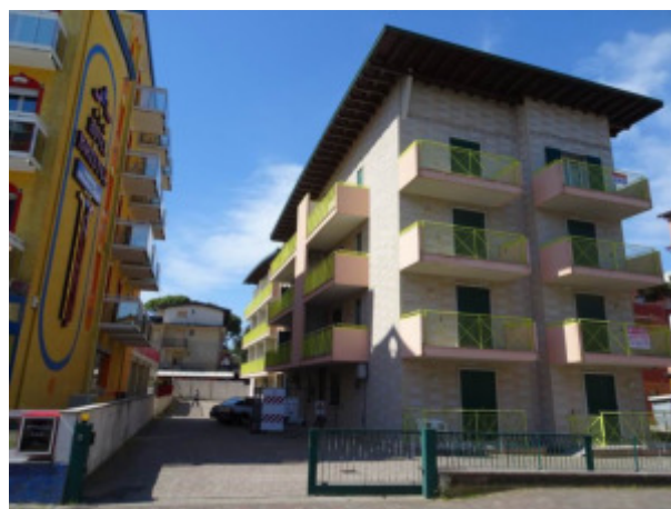
ulteriore particolare del prospetto condominiale lato Est-Sud