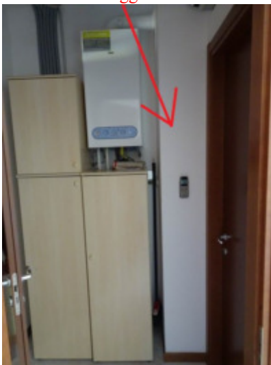
particolare canna fumaria oggetto di difformità catastale ed edilizia nel locale disimpegno