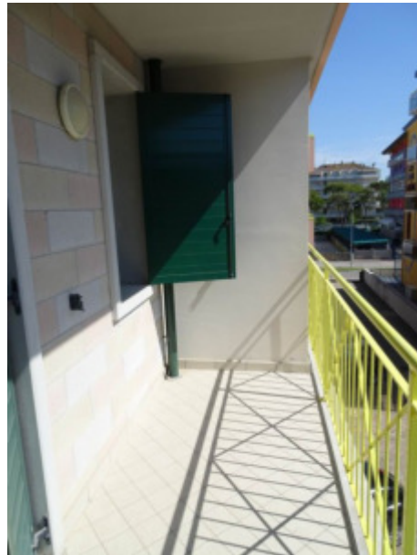
particolare esterno poggiolo lato Sud