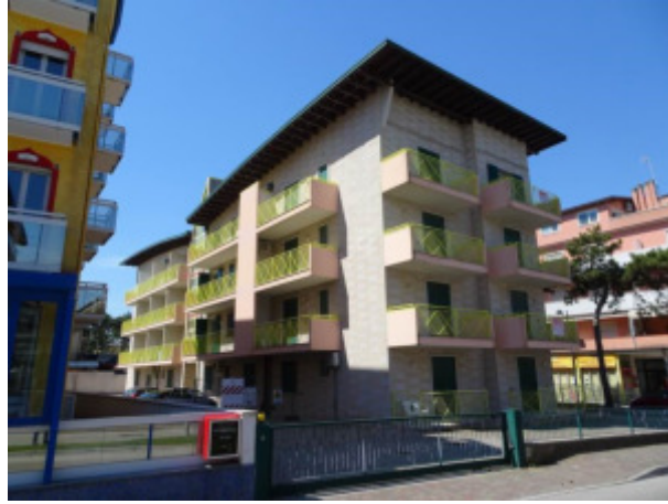
ulteriore particolare prospetto lato Sud-Est