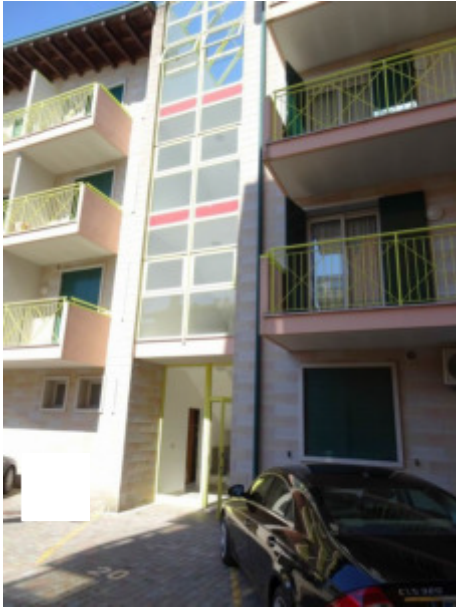
particolare ingresso lato Sud