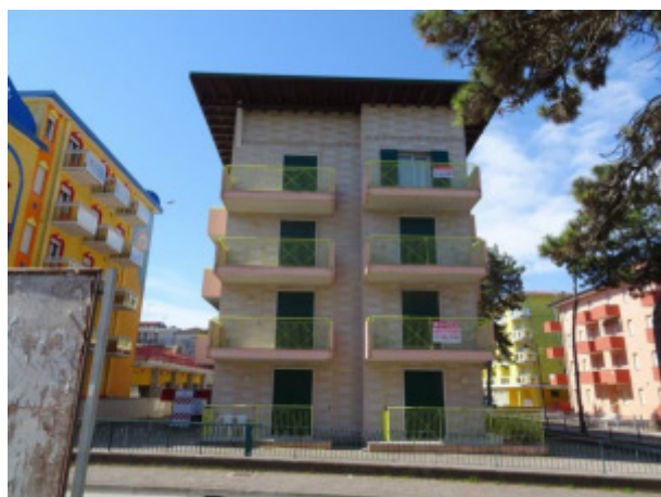
particolare prospetto condominiale lato Est