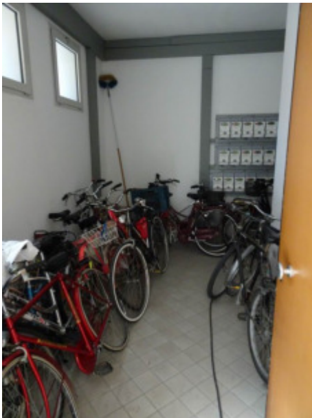
particolare stanza contatori e sala motori ascensore -sub. 9-