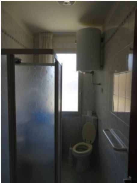
particolare interno del locale bagno