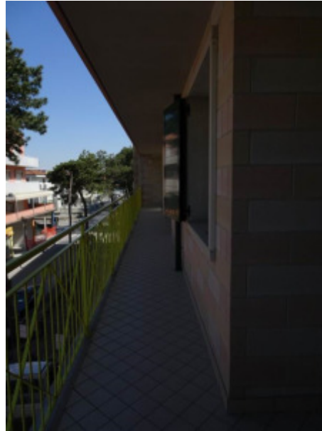
particolare ballatoio di distribuzione comune – sub. 28-