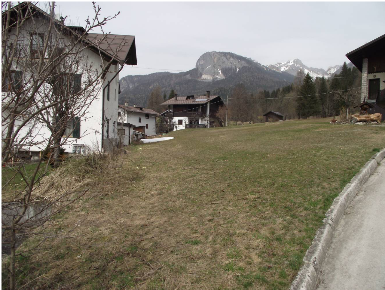
Foto 2 – striscia di accesso all'area (mapp. 711 – 725 – 727 – 763)