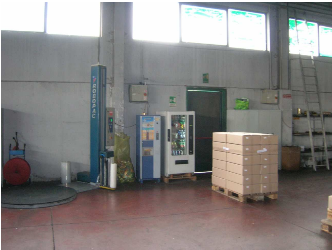
Foto n°35: interno del Capannone Industriale – porta 2 lato ovest .