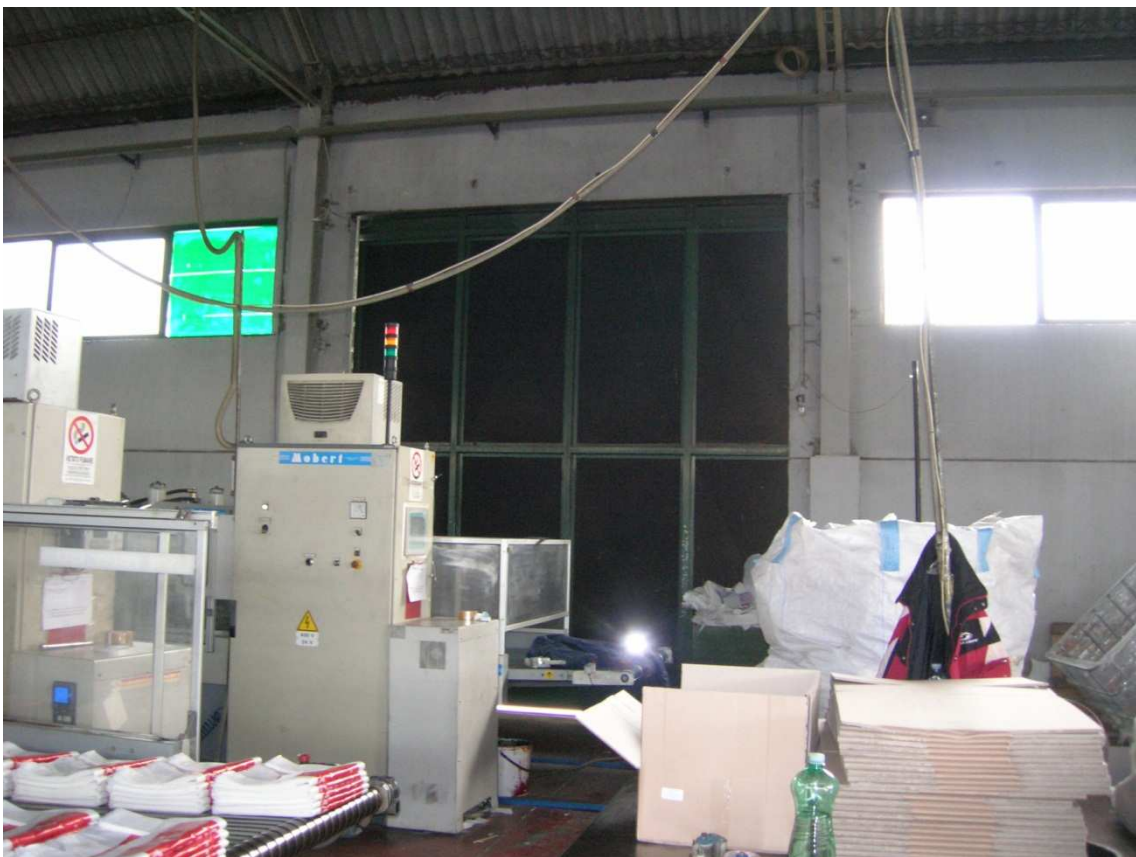
Foto n°33: interno del Capannone Industriale – porta scorrevole 2 lato est.