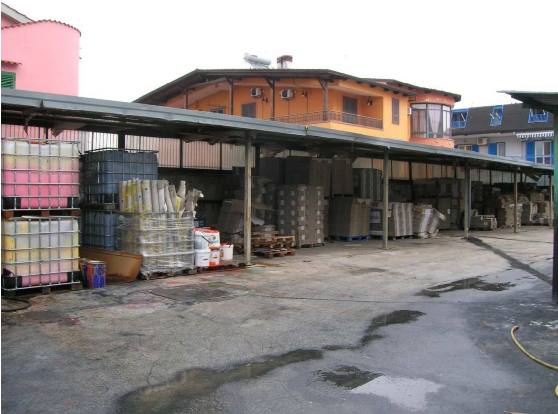
Foto n°8: visuale retrostante al Capannone Industriale dell'area coperta da tettoia.