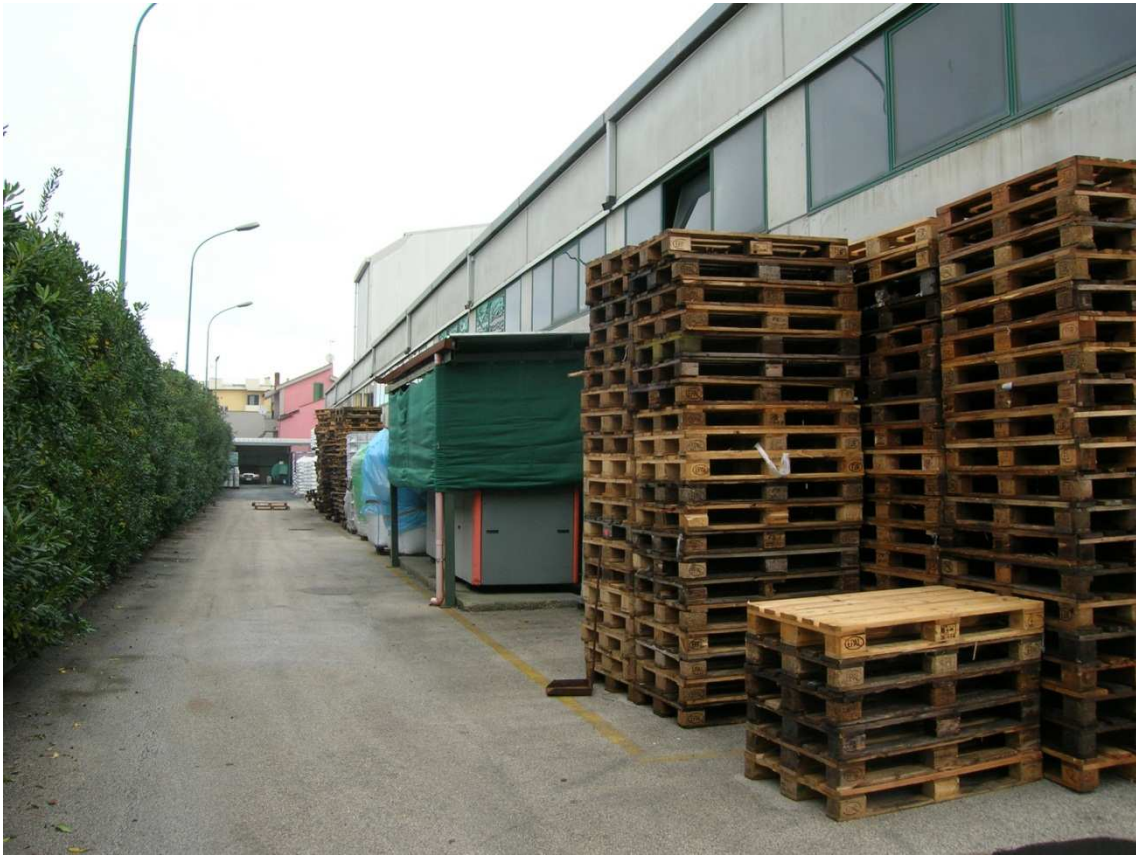
Foto n°6: visuale laterale del Capannone Industriale a sinistra dell'ingresso principale.