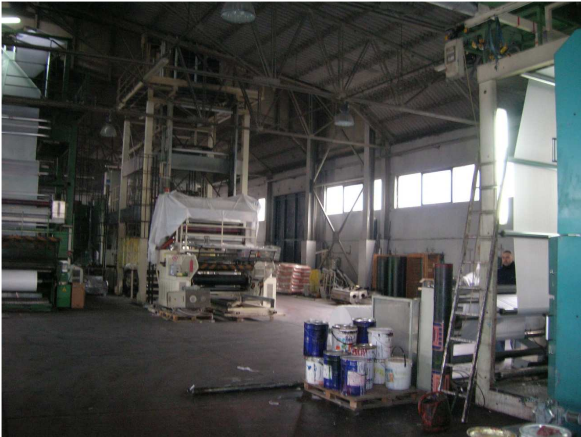
Foto n°32: interno del Capannone Industriale – porta scorrevole 1 lato est.