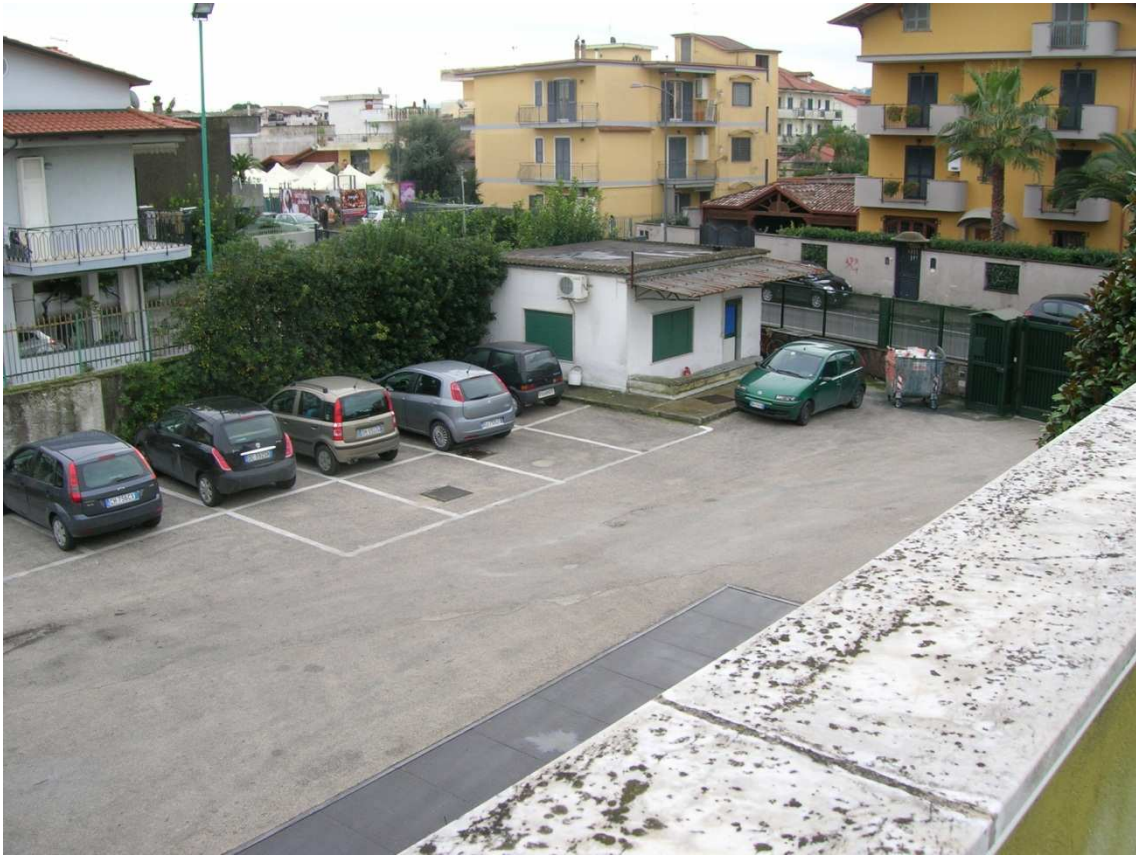
Foto n°3: visuale del parcheggio e Guardiola Custode dall' Edificio Uffici.