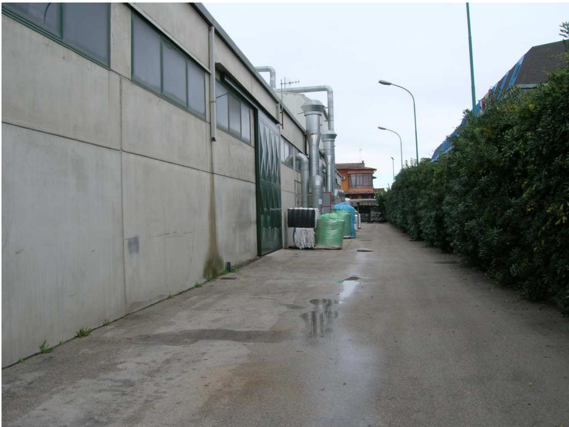
Foto n°7: visuale laterale del Capannone Industriale a destra dell'ingresso principale.