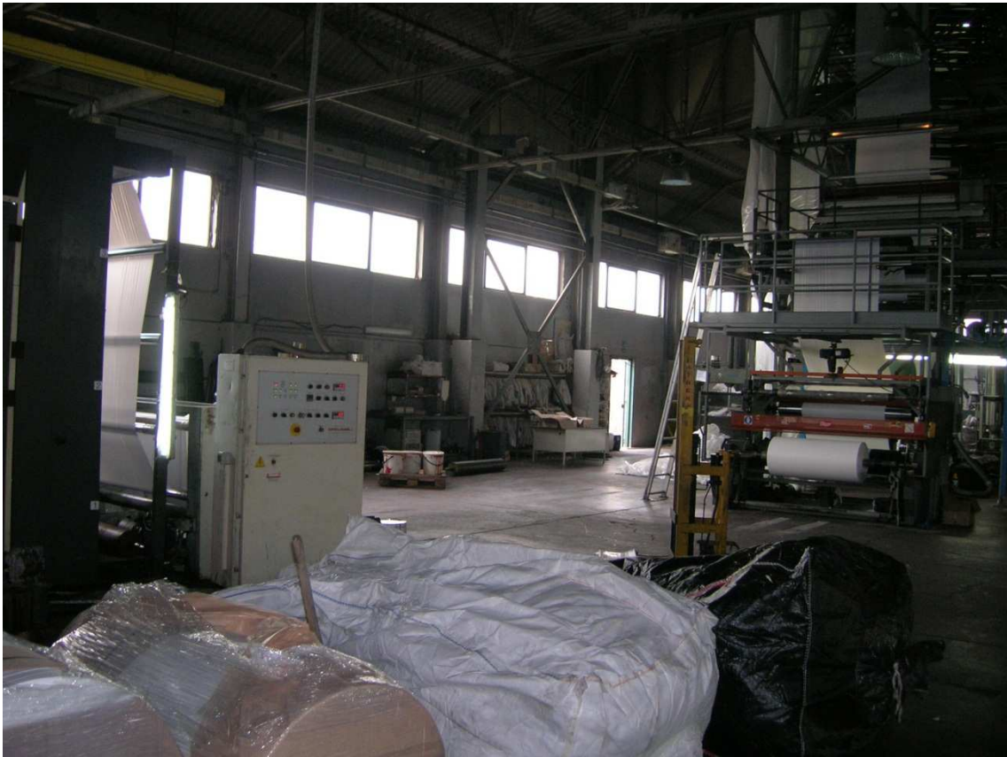
Foto n°34: interno del Capannone Industriale – porta 1 lato ovest .