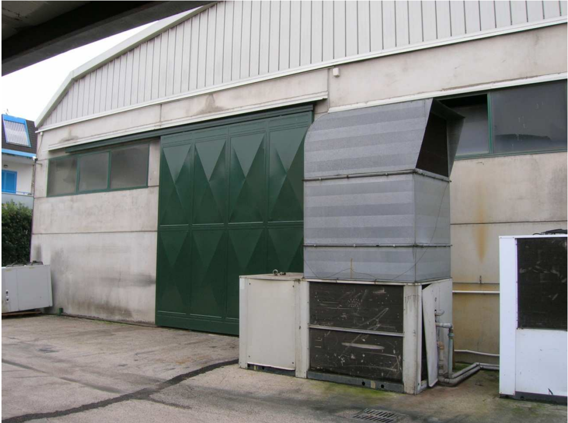
Foto n°37: esterno del retro Capannone Industriale – porta scorrevole 3 lato nord.