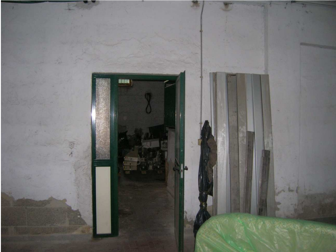
Foto n°25: Porta che separa le due stanze deposito del seminterrato.