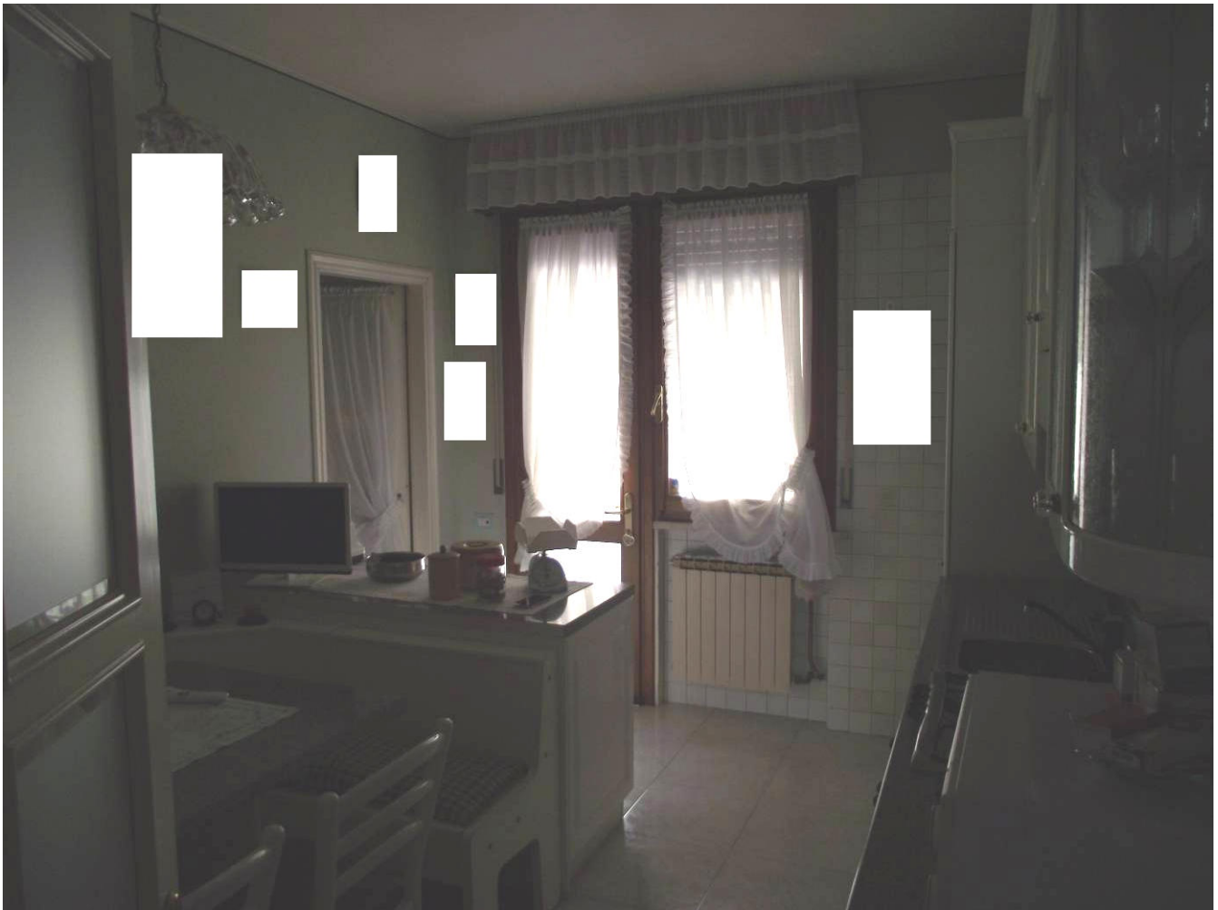
Foto 19 - cucina