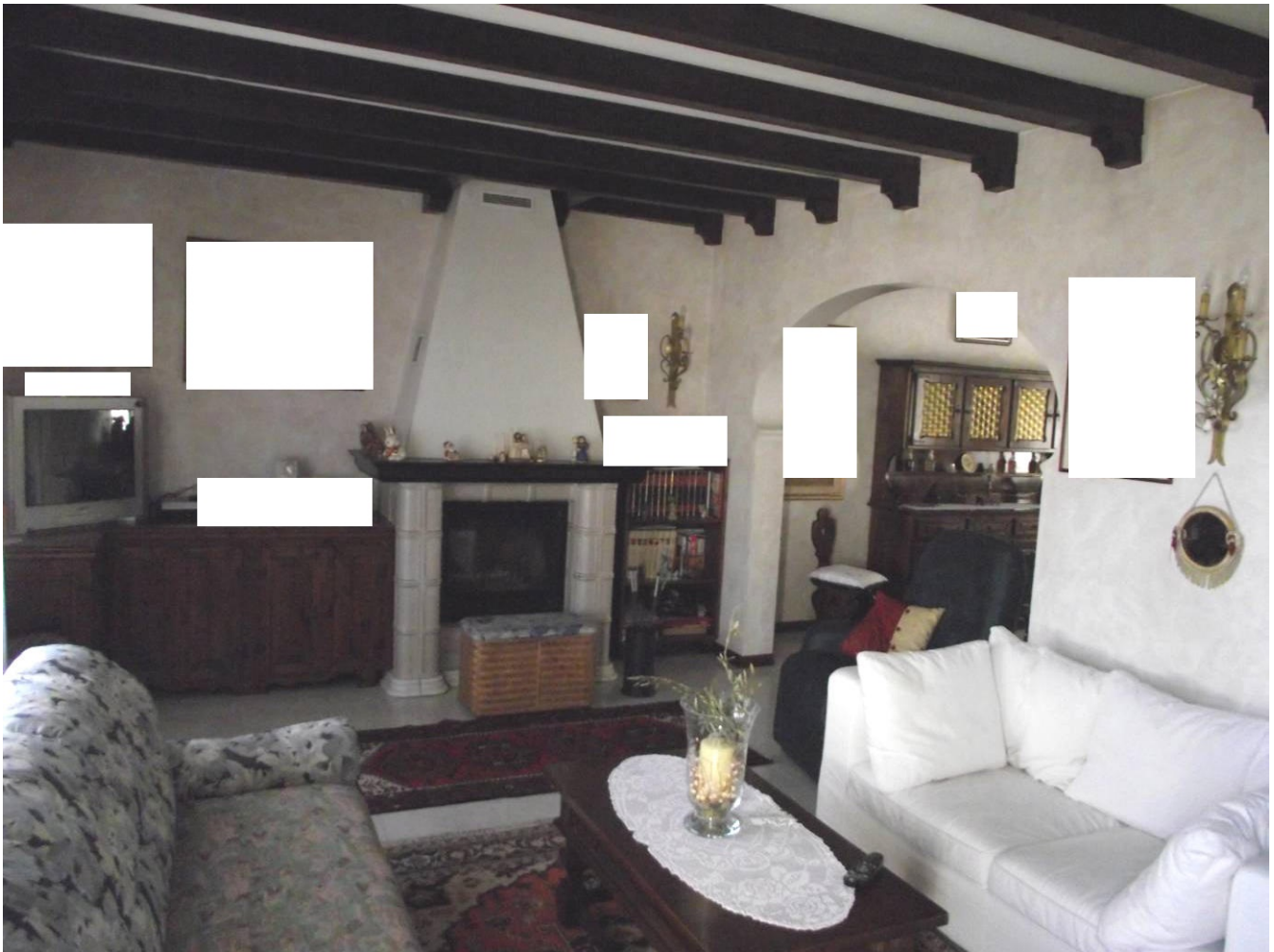
Foto 21 - soggiorno