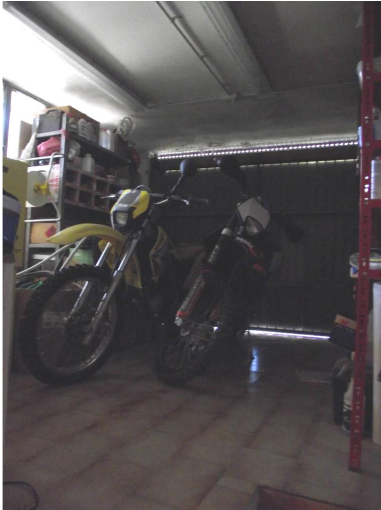
Foto 17 - garage