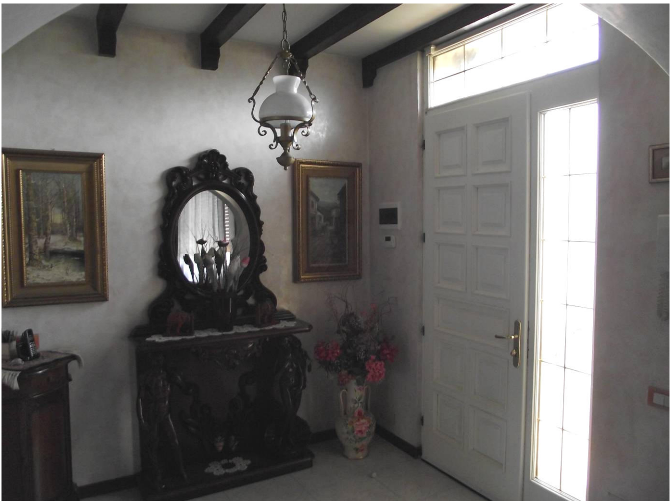
Foto 22 - ingresso