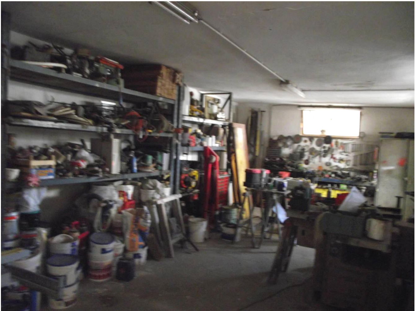
Foto 36 - magazzino