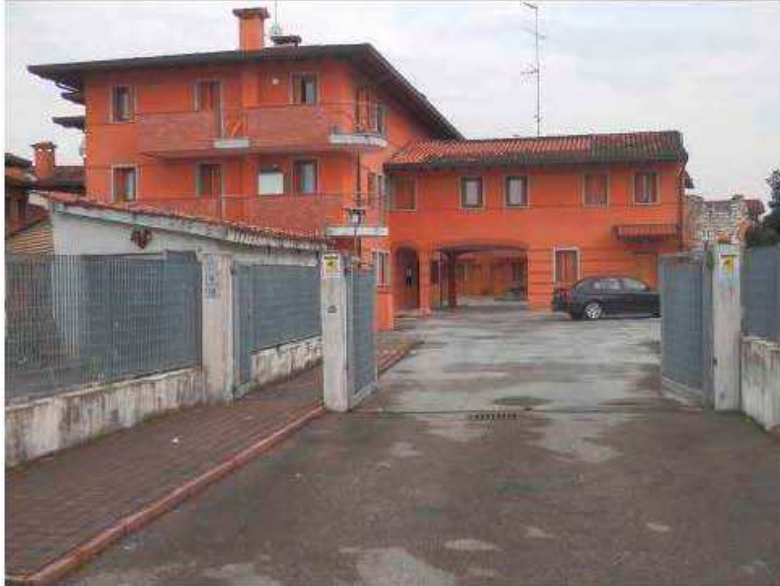
Foto 1-2: Complesso residenziale e palazzina ove è ubicato l'appartamento sub. 16 foto Smf.