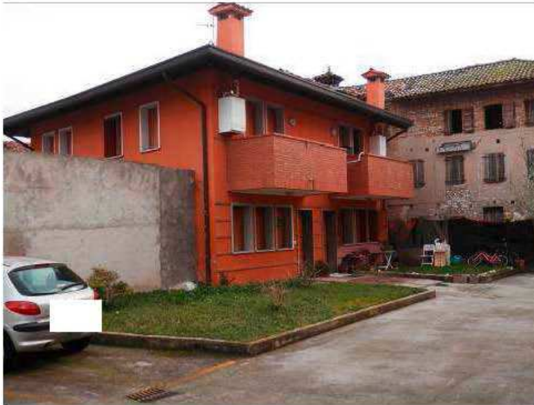
Foto 3-4: Palazzina abitazione appartamento sub. 16 lato Sud-Ovest e posto macchina n°11.