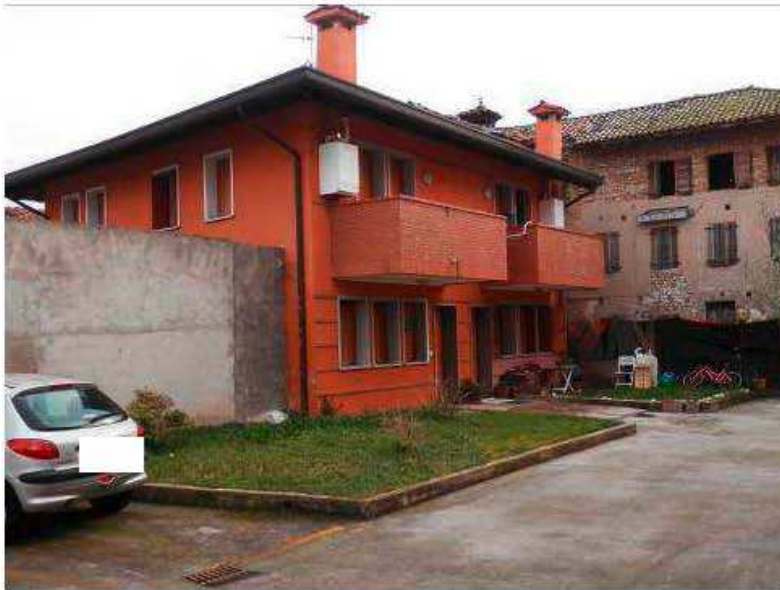
Foto 5-6: Complesso residenziale lato Nord e ubicazione appartamento piano terra.