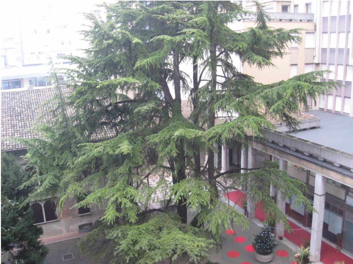
La vista dal terrazzino su Piazza Ottoboni