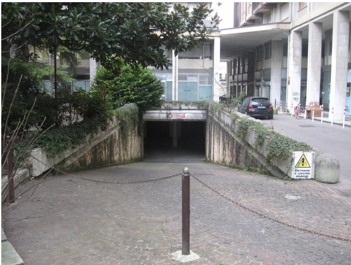
Vista dei portici e dell'accesso alle autorimesse