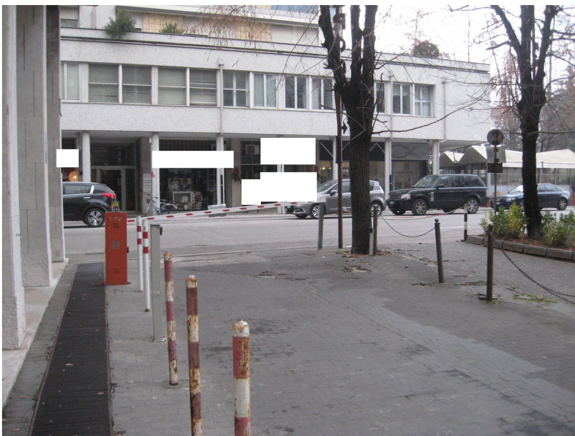
L'accesso carraio su Via XXX Aprile