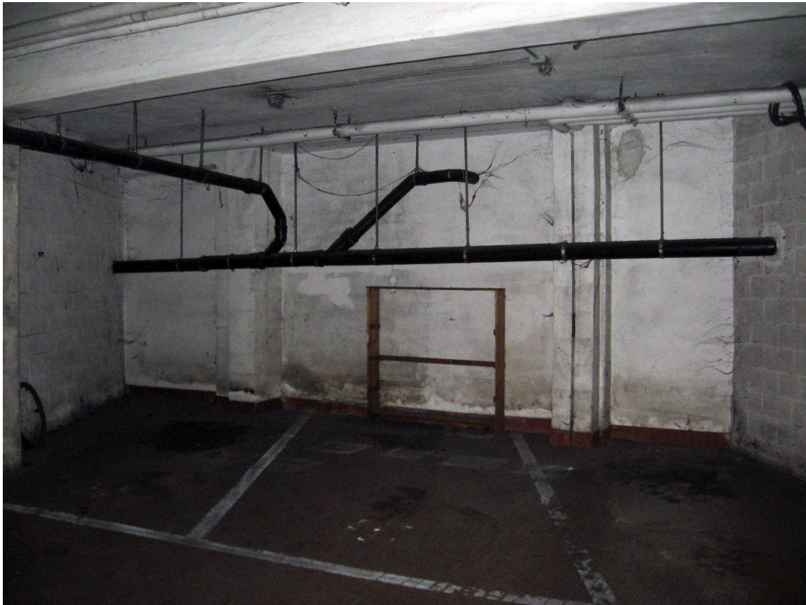
Posto auto della proprietà staggiata