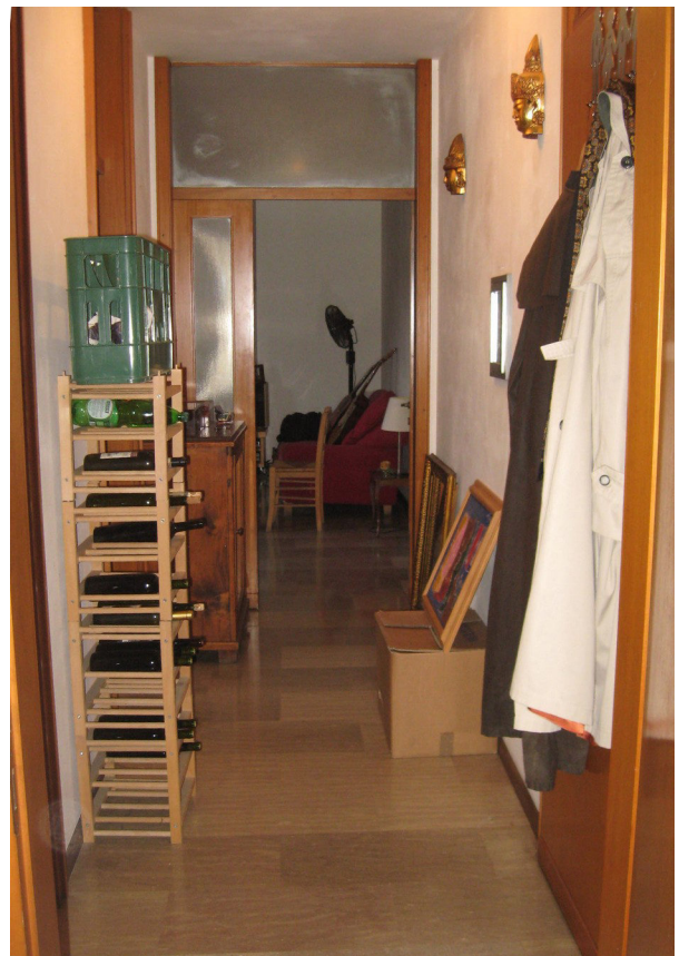
L'ingresso e il corridoio di distribuzione