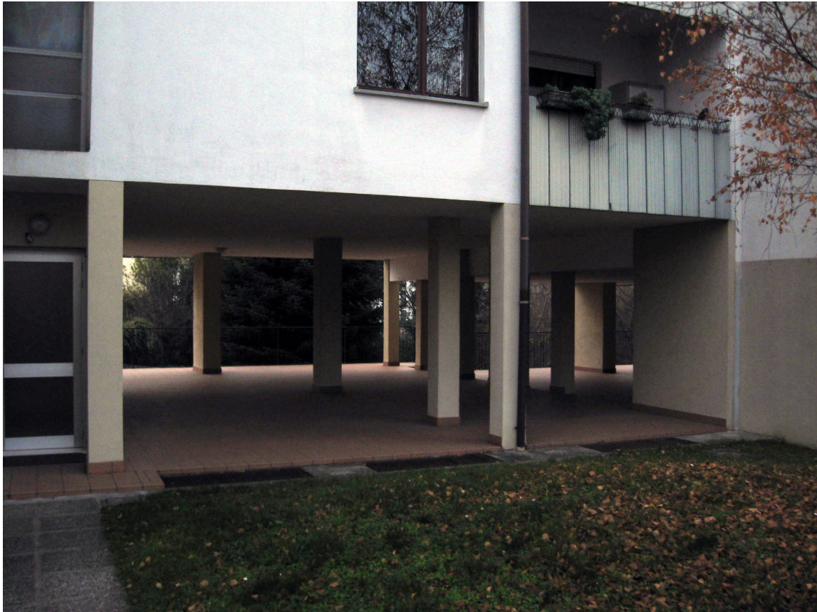
Aree comuni al piano terra