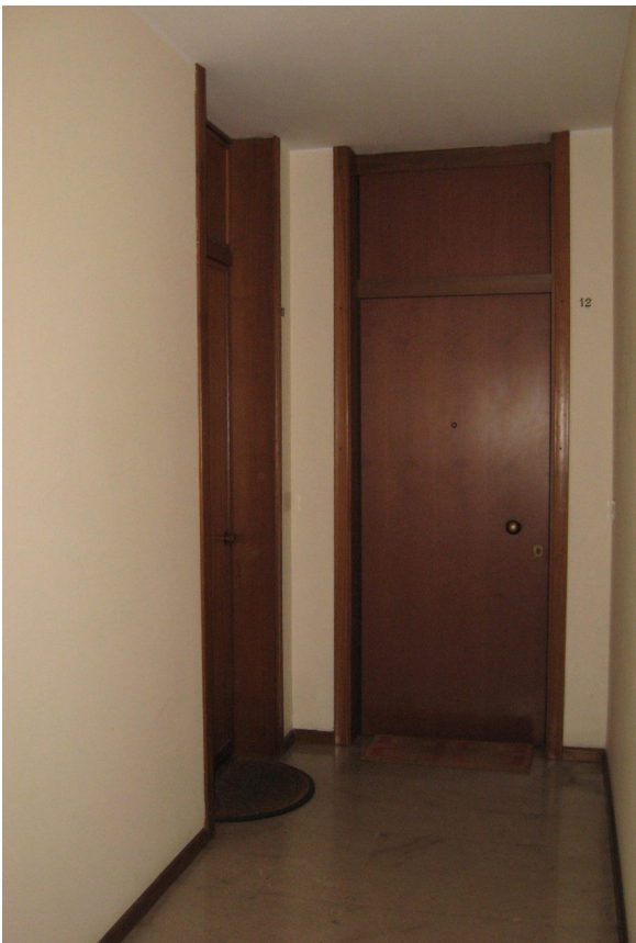
Sulla sinistra, la porta di ingresso