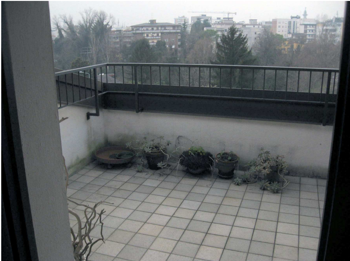
Il terrazzino posto a sud-ovest