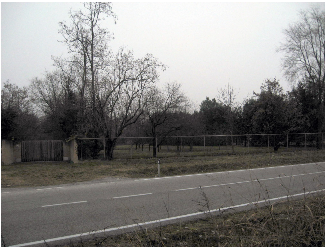
L'ingresso carraio e la recinzione su Via Pionieri dell'Aria