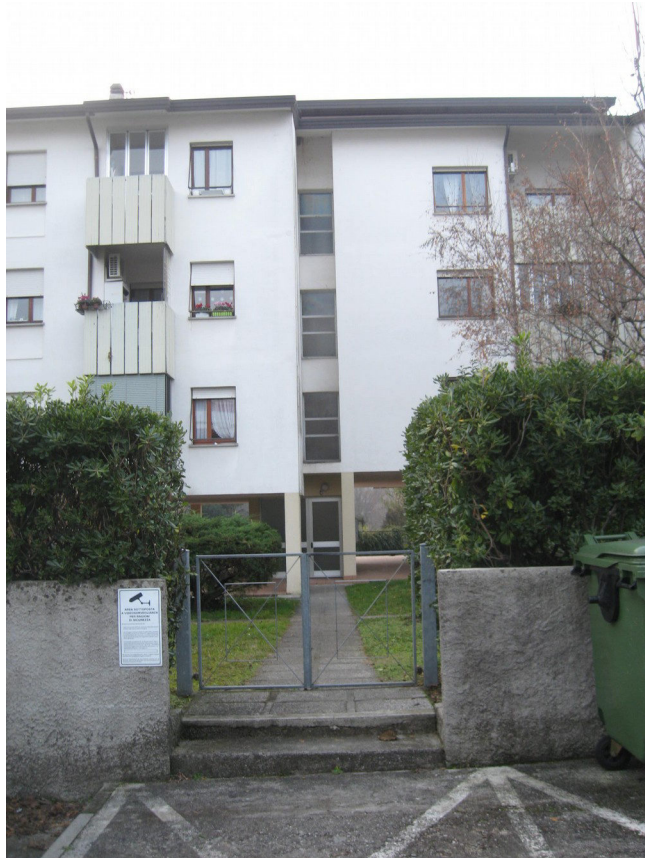
L'accesso pedonale posto su Via E. Toti