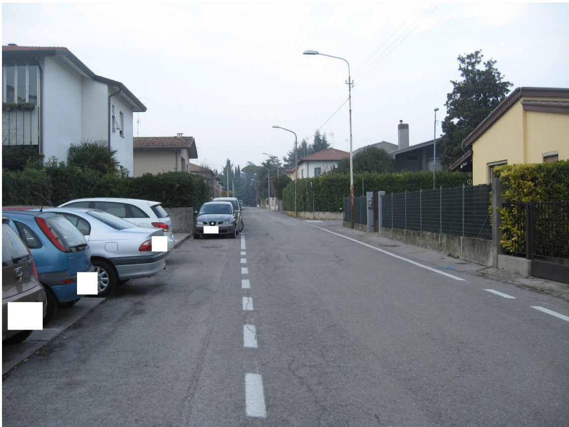
Via E. Toti