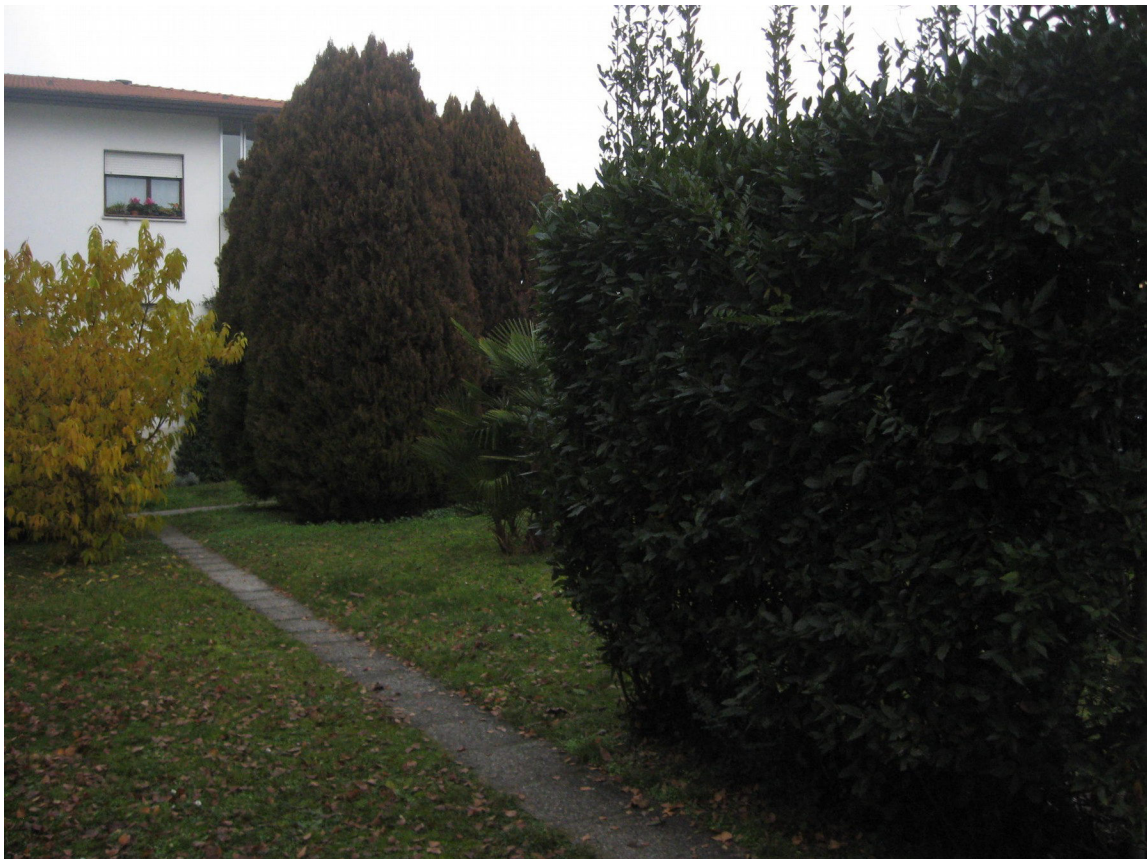
Il giardino con i vialetti pedonali