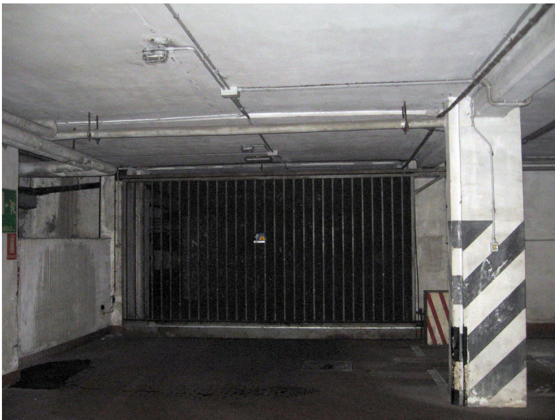
Il cancello ad apertura con mando a distanza posto nel piano interrato