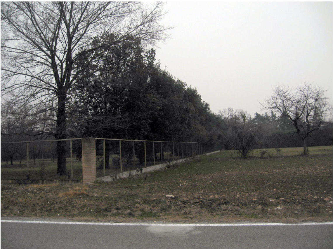
Il confine post a est