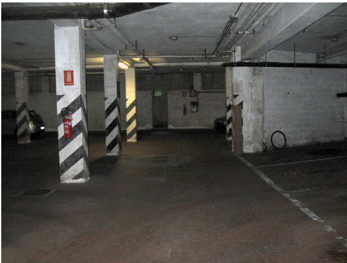
Spazi di manovra