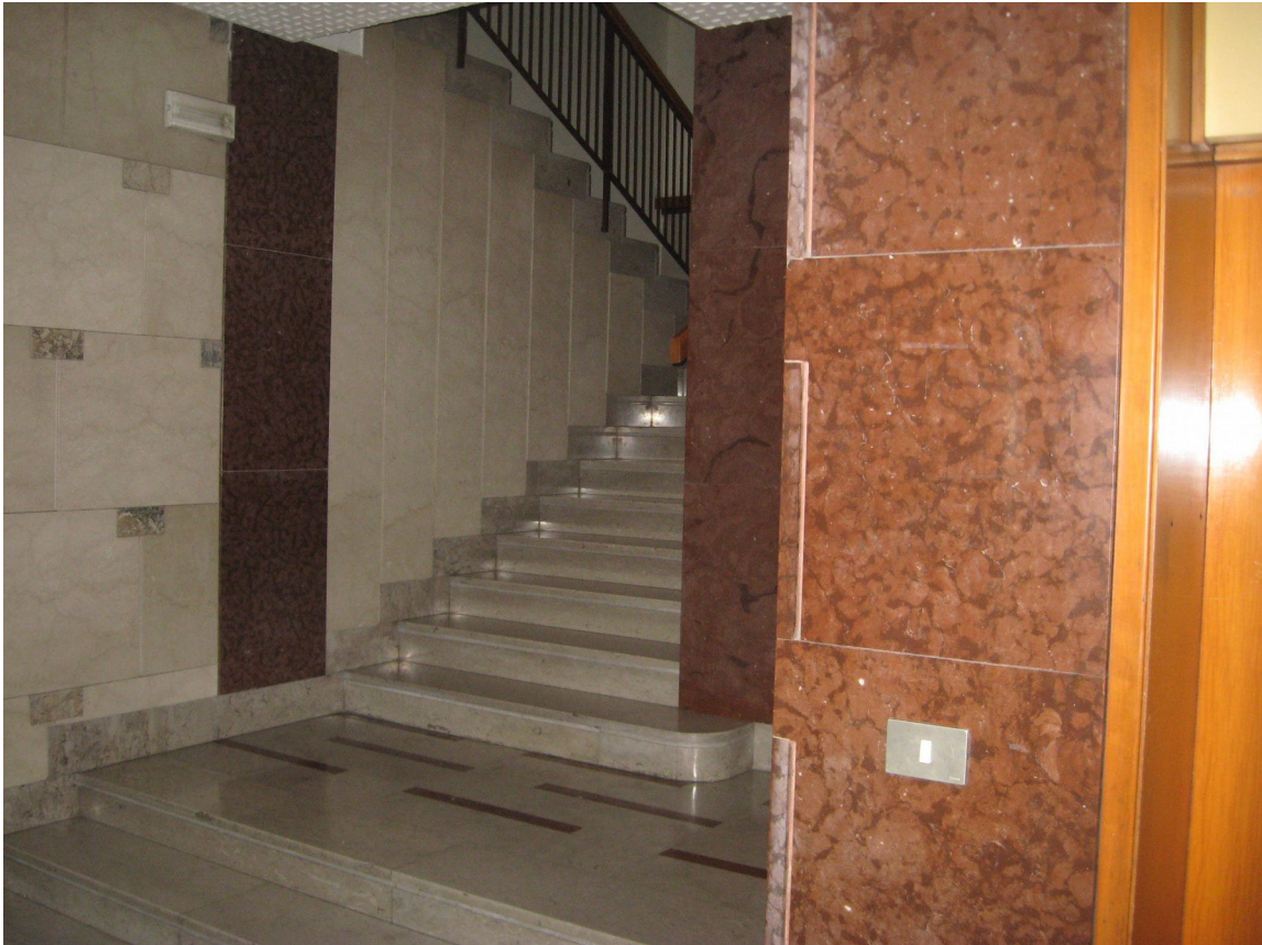
L'atrio di ingresso