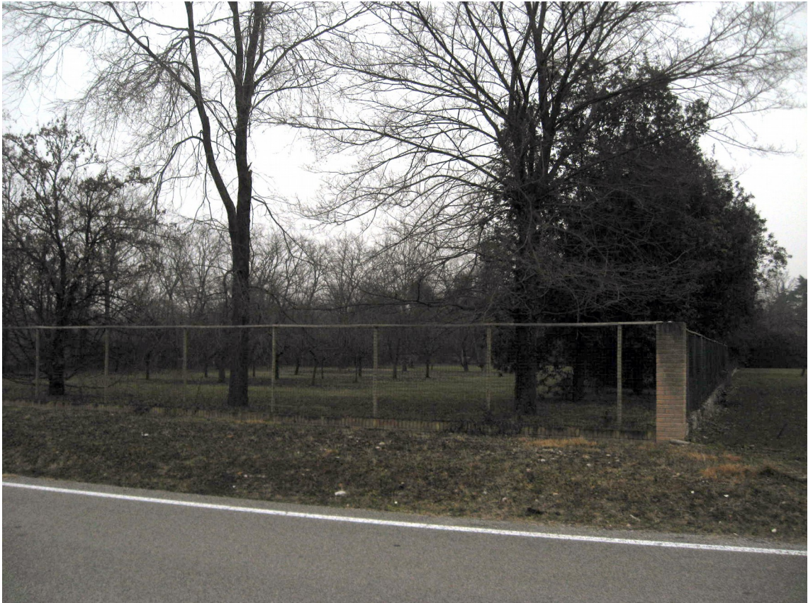
La recinzione sul lato sud