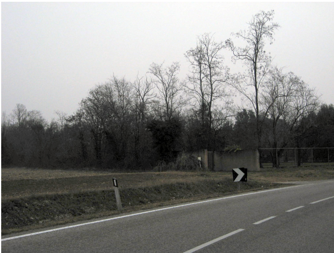
La proprietà vista da sud-ovest