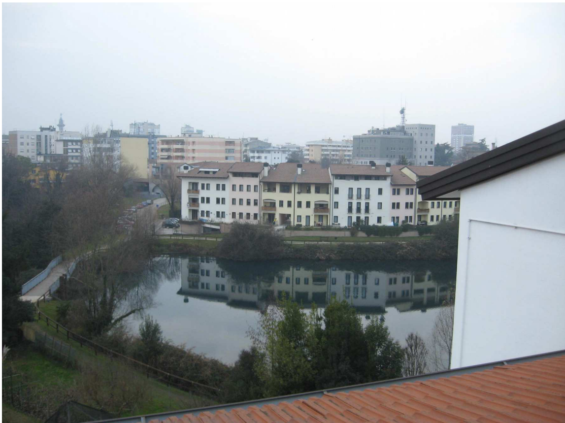
La vista dal terrazzino sul parco pubblico denominato "San Carlo"