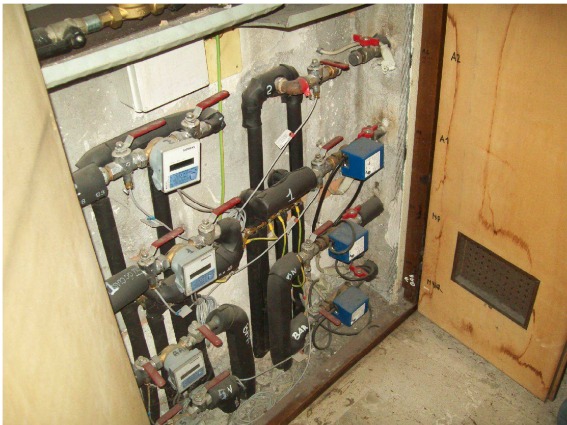
Foto 24: Interno apparecchiature di misura consumi nel vano scale comune