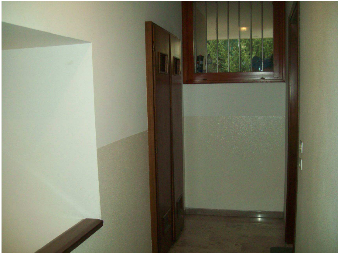
Foto 23: Esterno apparecchiature di misurazione consumi nel vano scale