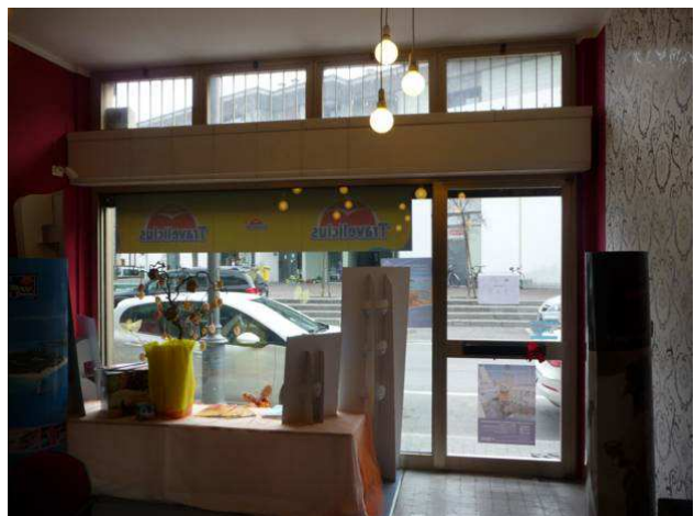
interno negozio – locale principale