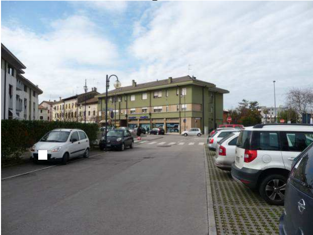
veduta condominio da parcheggio pubblico