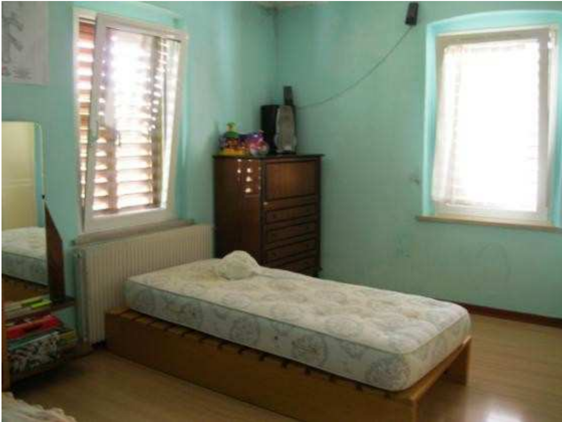
Foto 19 Camera