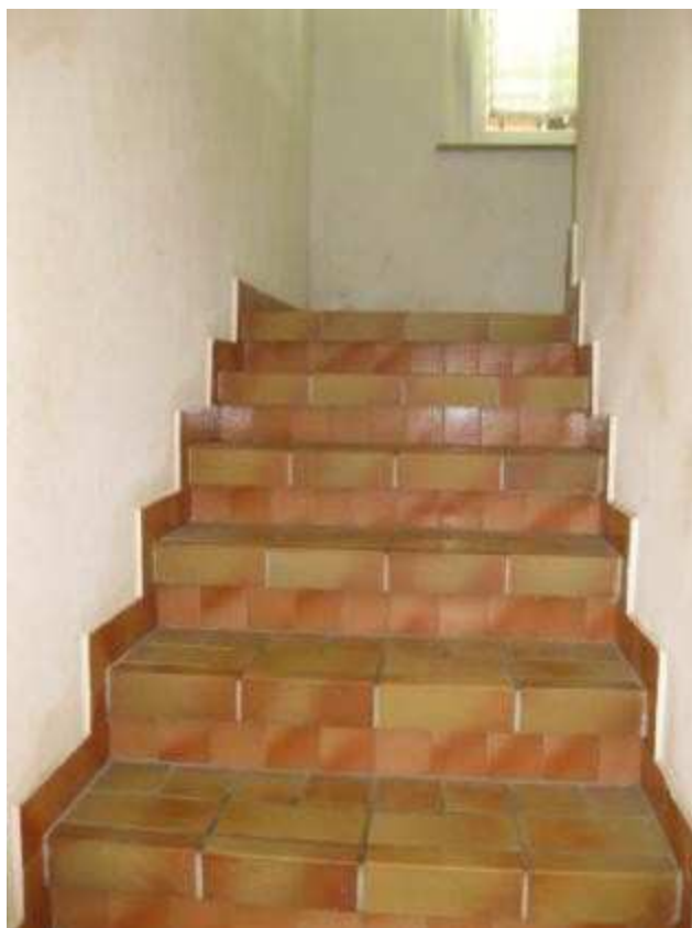
Foto 15 Scala da piano terra a primo piano