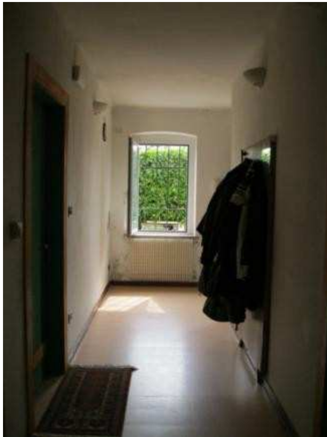
Foto 7 Corridoio d'accesso