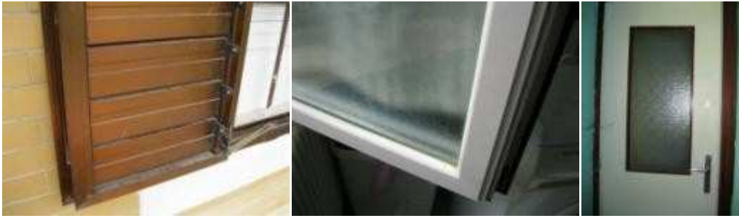
Foto 26-27-28 Dettaglio serramenti