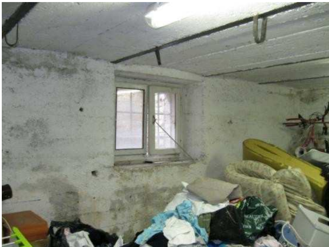
Foto 14 Cantina