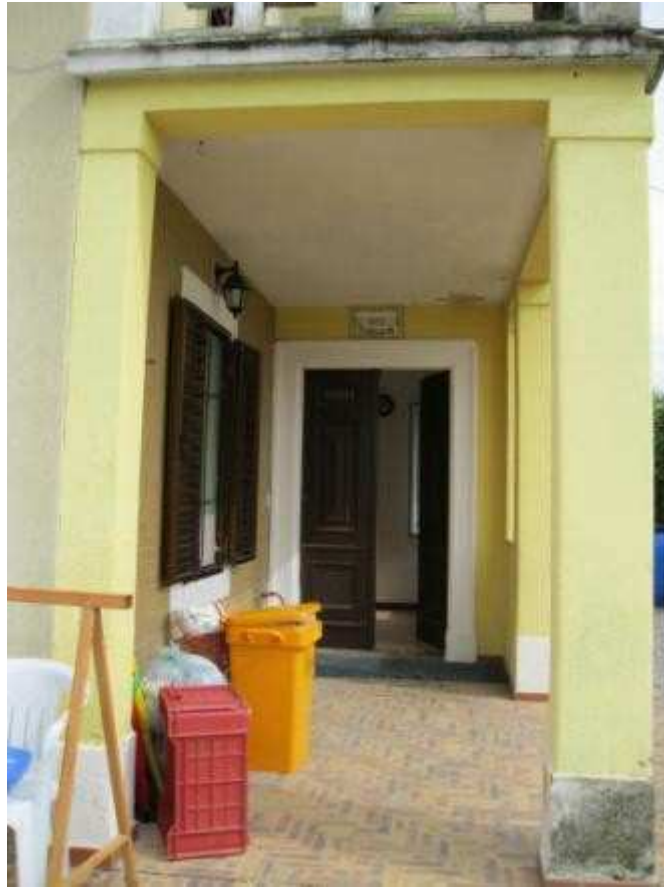
Foto 5 Portico d'ingresso