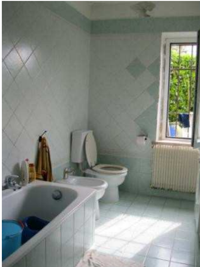
Foto 11 Bagno