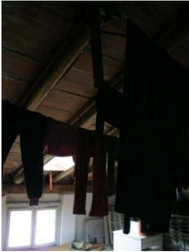
Foto 25 Soffitta