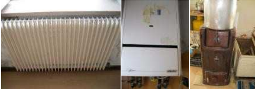
Foto 29-30-31 Dettaglio sistemi di riscaldamento