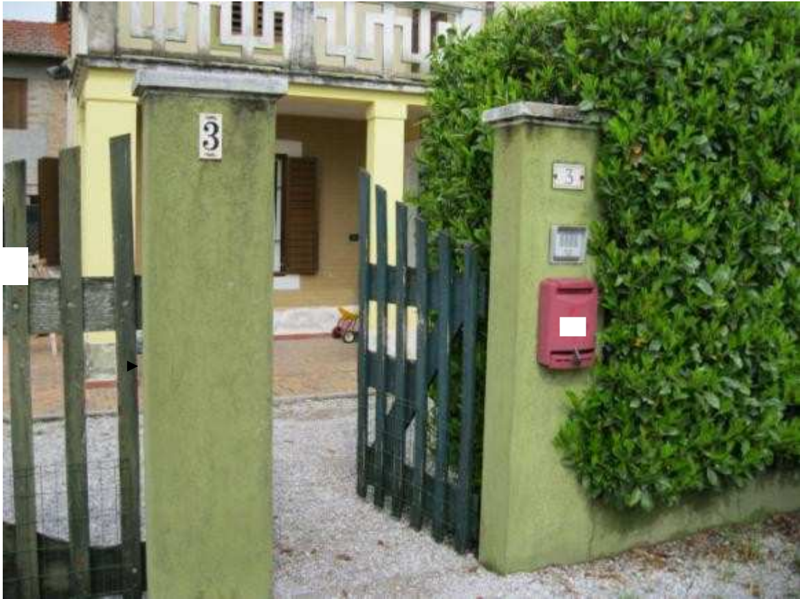
Foto 3 Ingresso pedonale