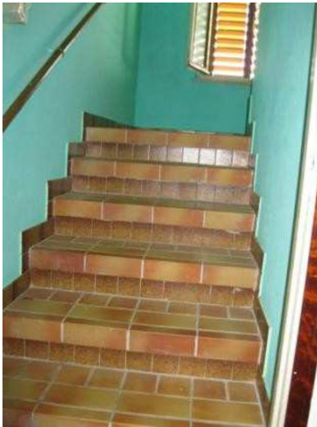
Foto 21 Scala di collegamento primo piano a secondo piano