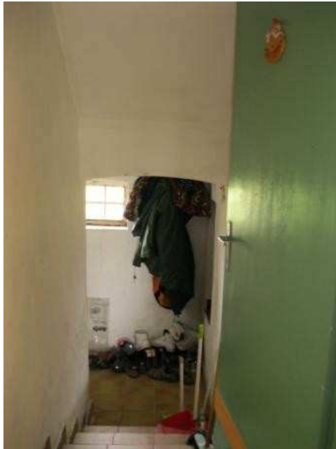
Foto 13 Scala che conduce alla cantina