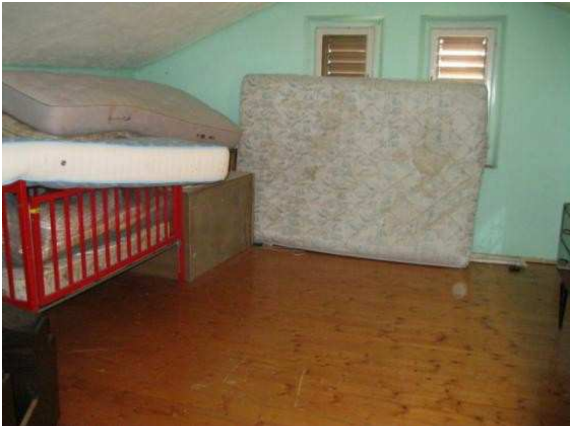
Foto 23 Camera secondo piano