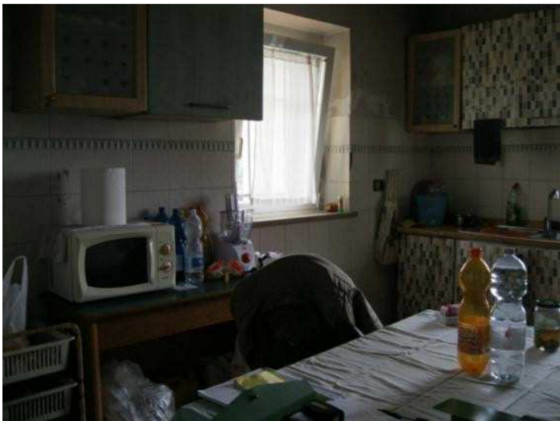
Foto 8 Cucina 6