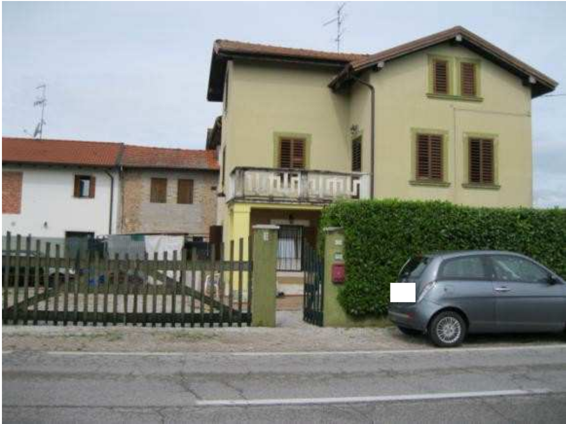
Foto 1 Vista esterna frontale