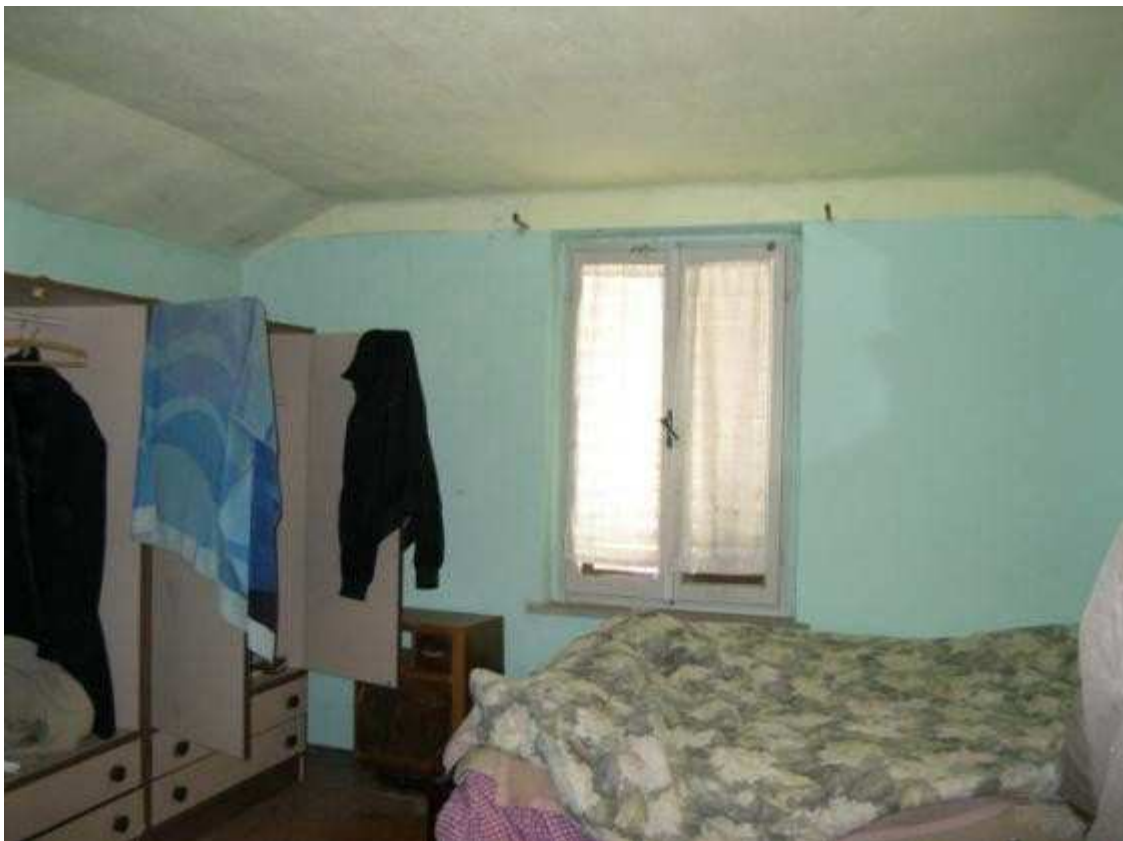
Foto 24 Camera secondo piano