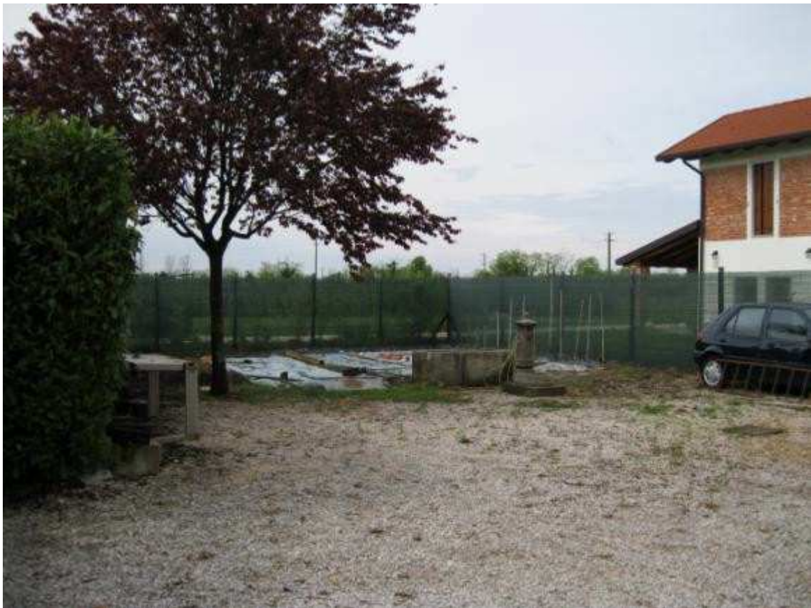
Foto 4 Corte