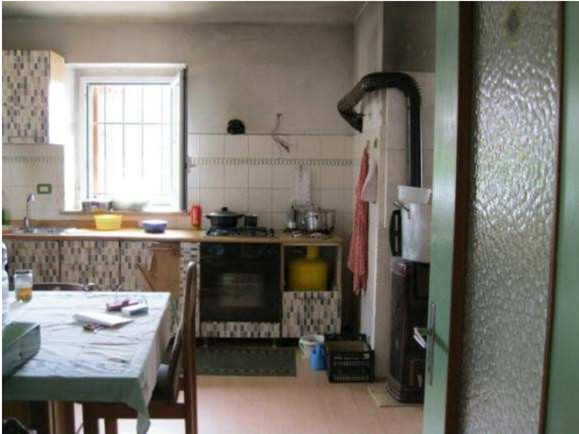
Foto 9 Cucina