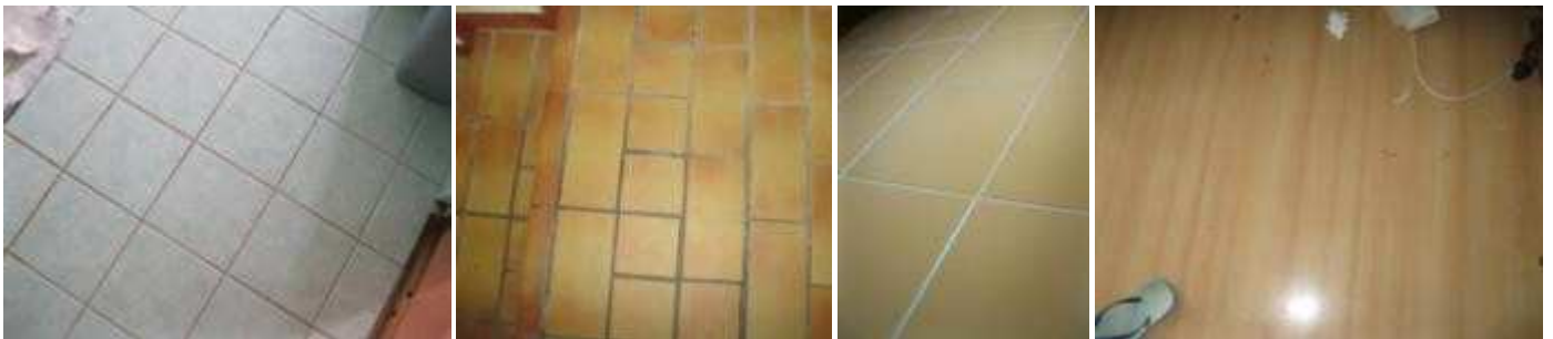
Foto 32-33-34-35 Dettaglio pavimentazioni