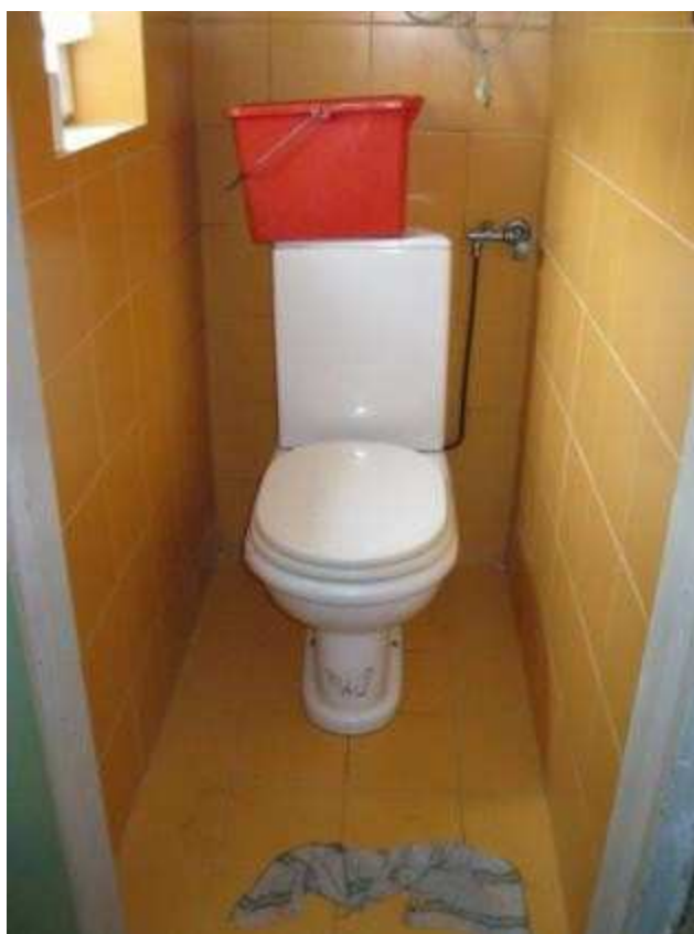
Foto 16 WC