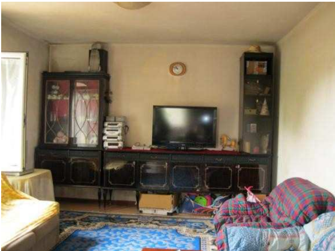
Foto 10 Soggiorno