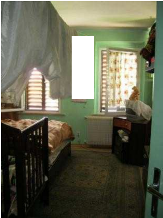
Foto 17 Camera