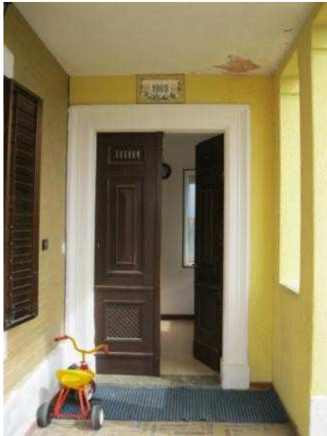
Foto 6 Porta accesso immobile esecutato