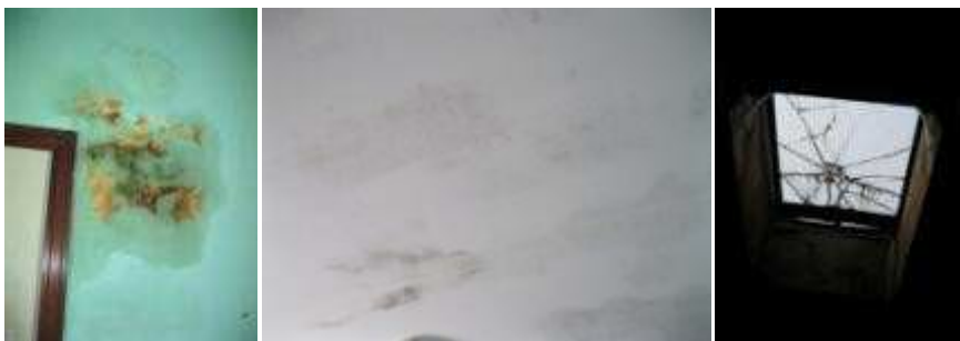
Foto 36-37-38 Interventi di manutenzione urgenti