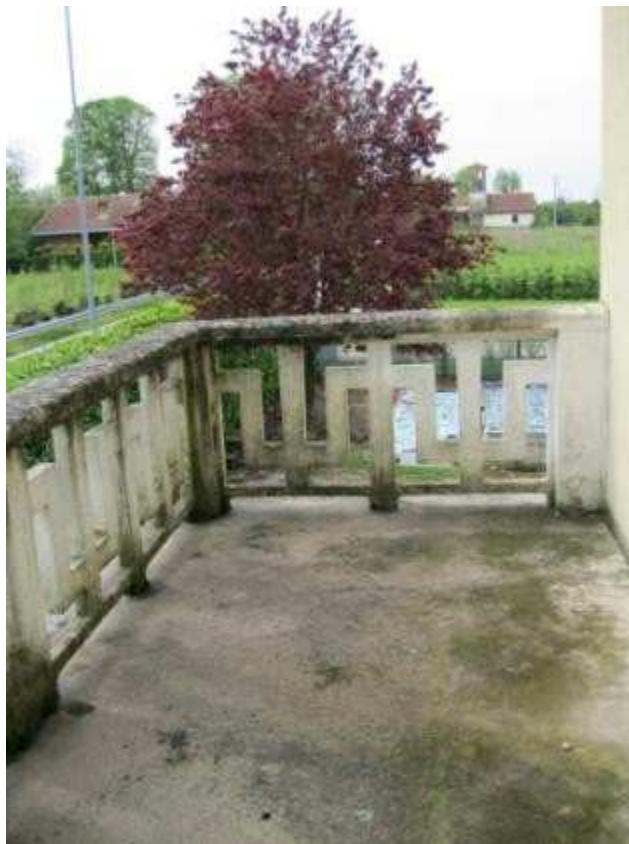
Foto 18 Terrazzo