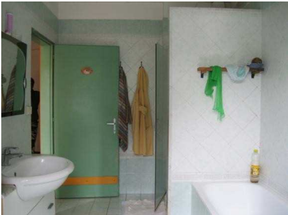
Foto 12 Bagno