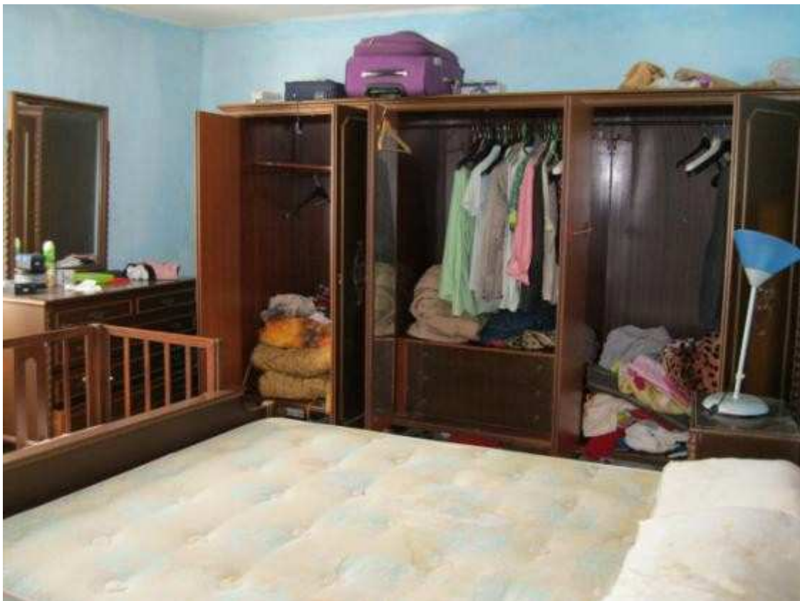
Foto 20 Camera