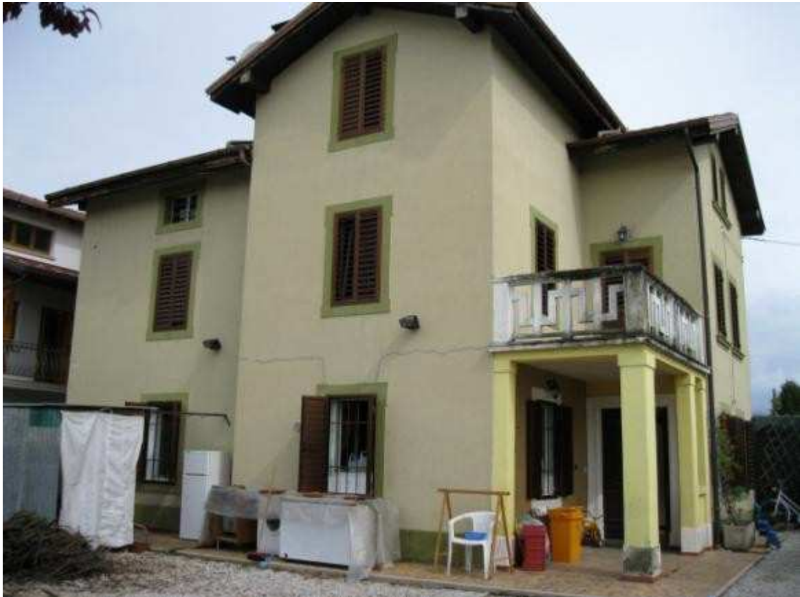
Foto 2 Vista esterna laterale