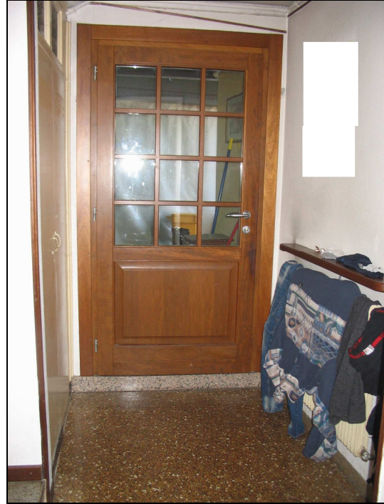
Fig.13: disimpegno vano scale