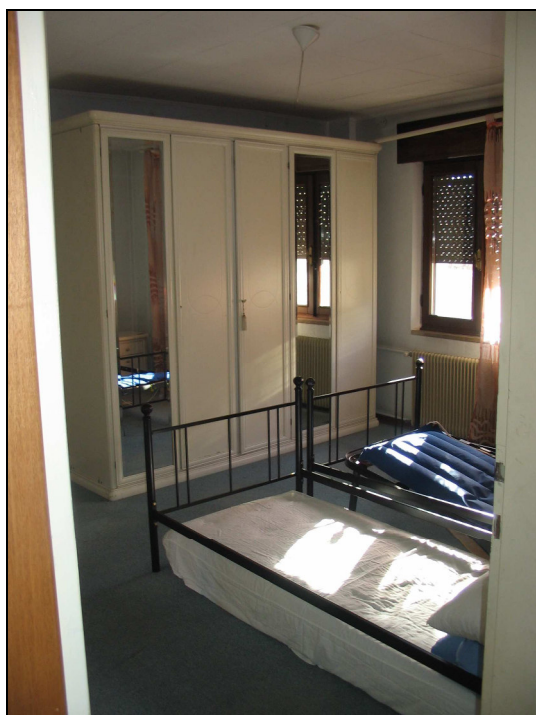
Fig.27: camera matrimoniale sud - est