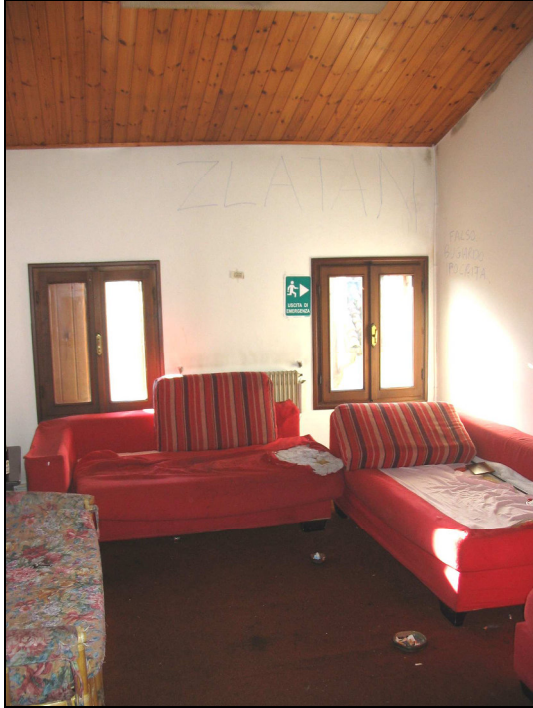
Fig.39: locale soffitta ovest