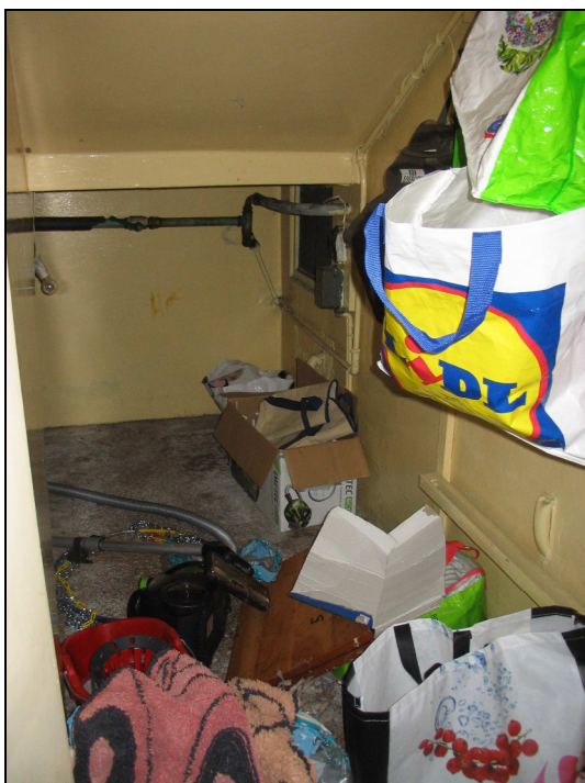
Fig.23: sottoscala piano terra