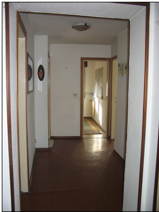
Fig.25: disimpegno piano primo