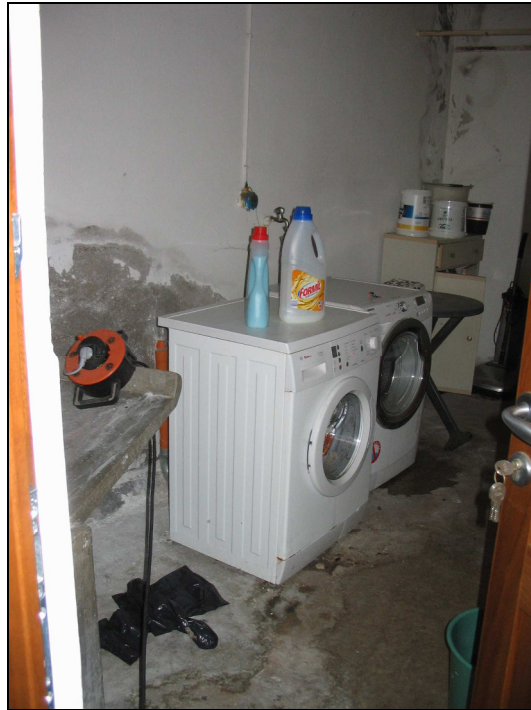
Fig.20: vista lavanderia