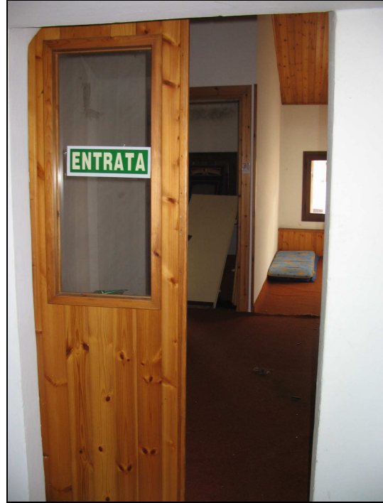
Fig.37: entrata piano secondo