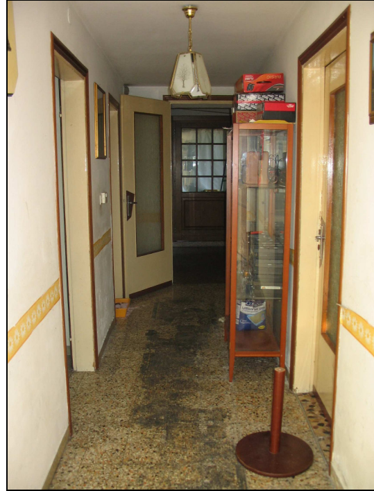
Fig.6: vista corridoio piano terra dall'entrata principale