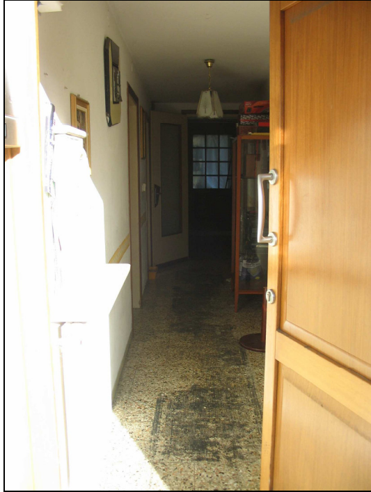
Fig.5: vista entrata principale dall'esterno