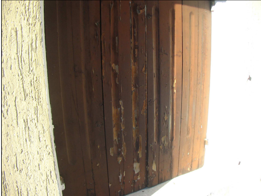
Fig.45: finestra e davanzale in marmo lato sud