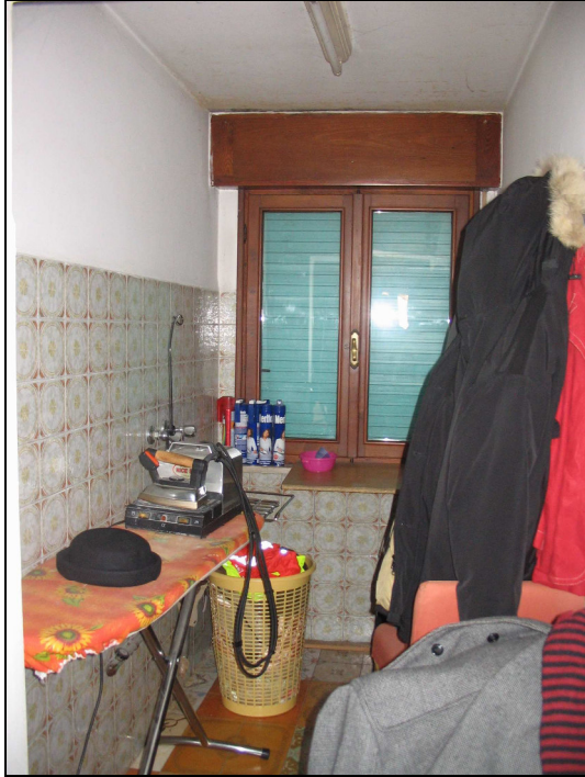
Fig.12: cucinotto, ora ripostiglio