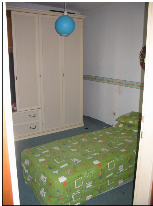
Fig.26: camera nord - est