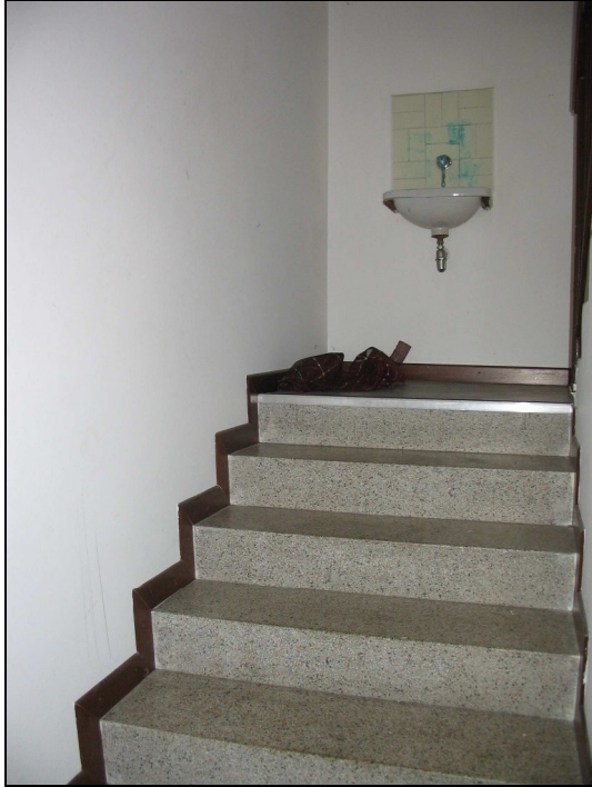
Fig.36: rampa scale da piano primo a piano secondo