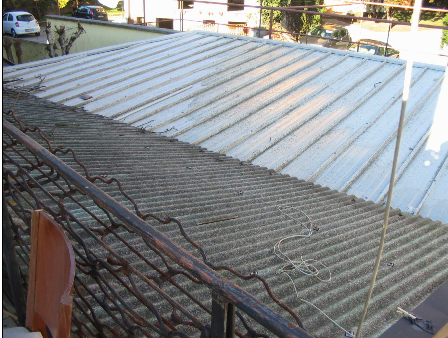
Fig.35: copertura terrazzo piano primo da sanare