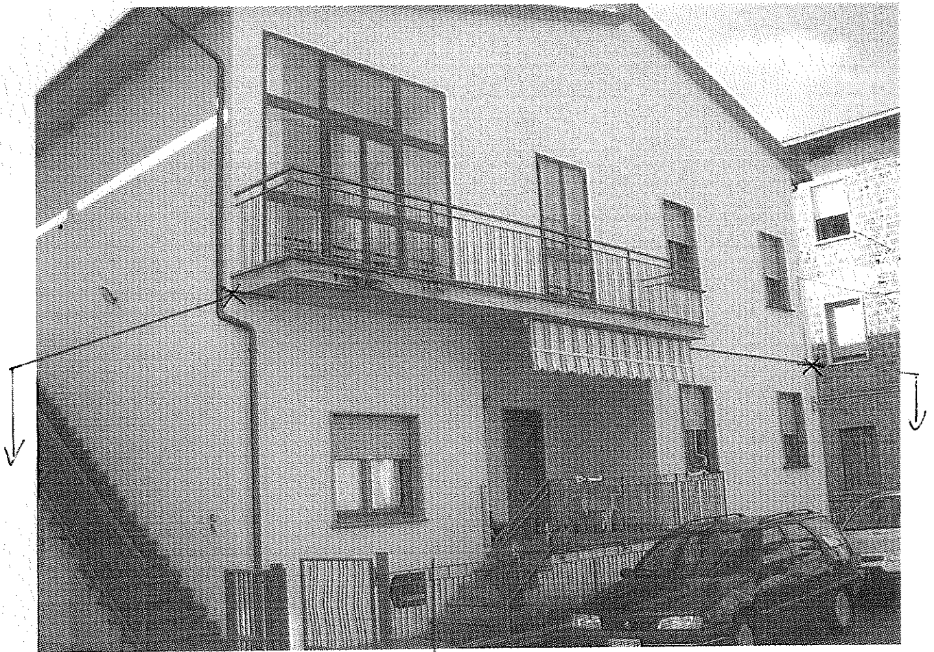
sub 9 (PIANOTERRA)