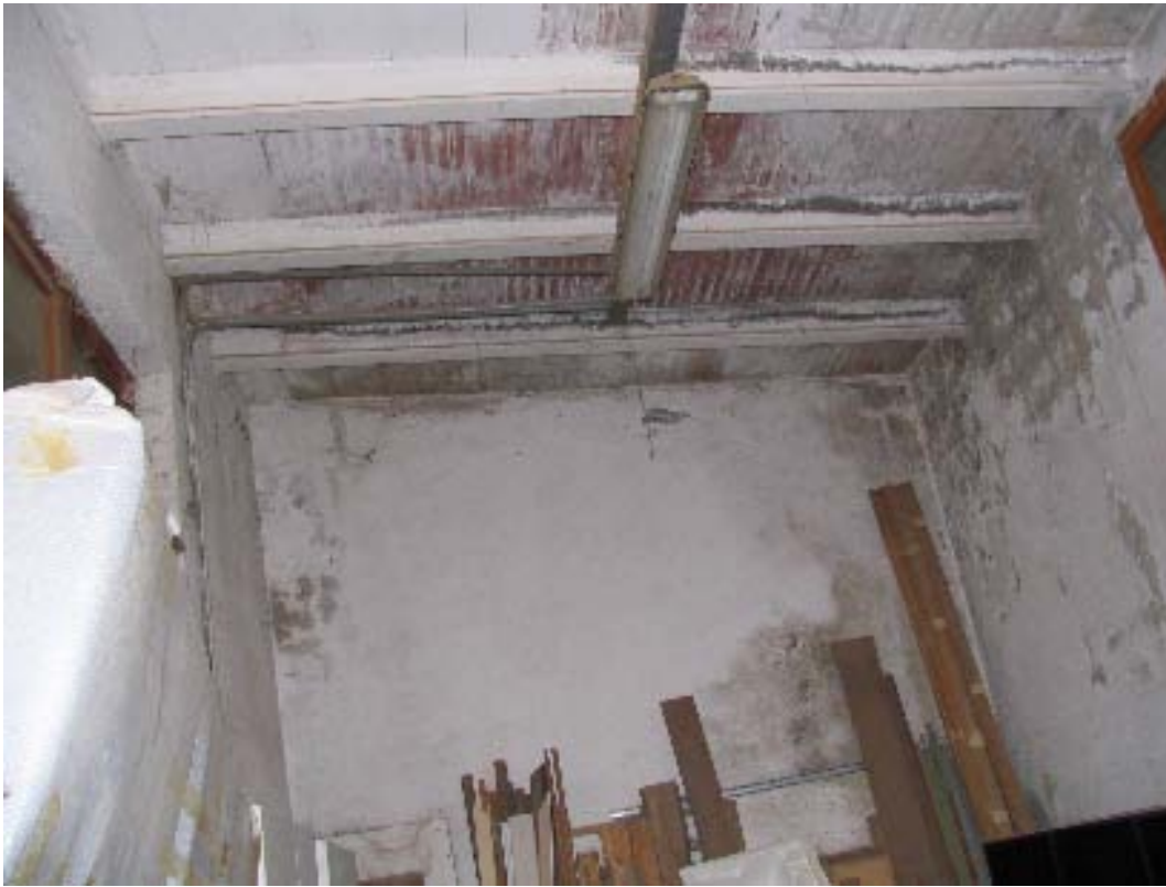
interno falegneria particella 135 sub 9