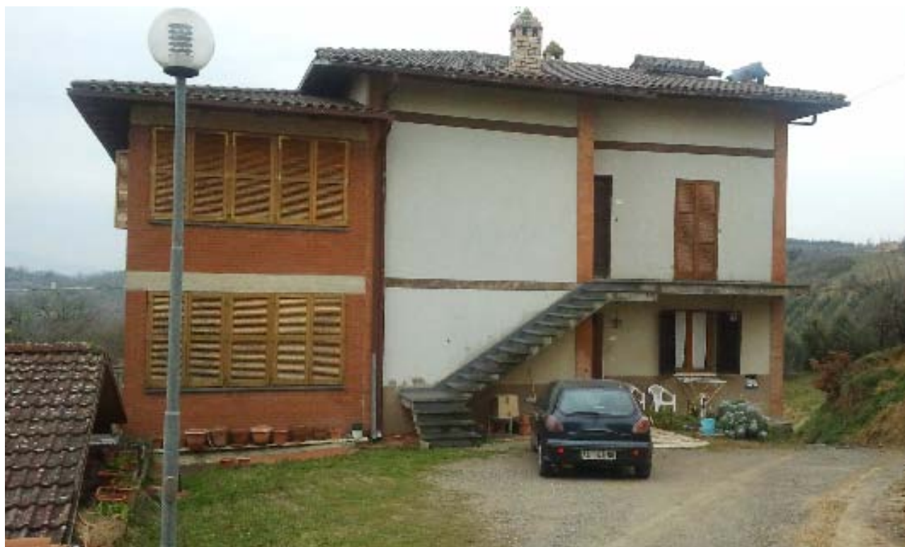
Abitazione particella 135 sub 6 e 7