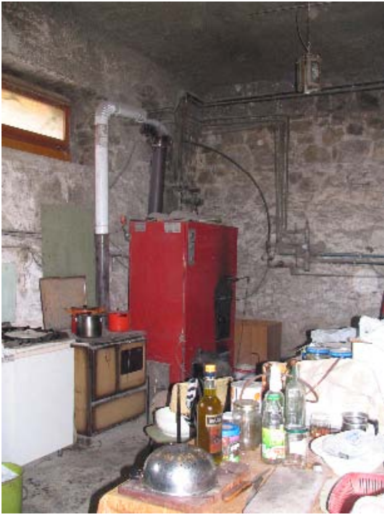
interno falegnameria particella 135 sub 8