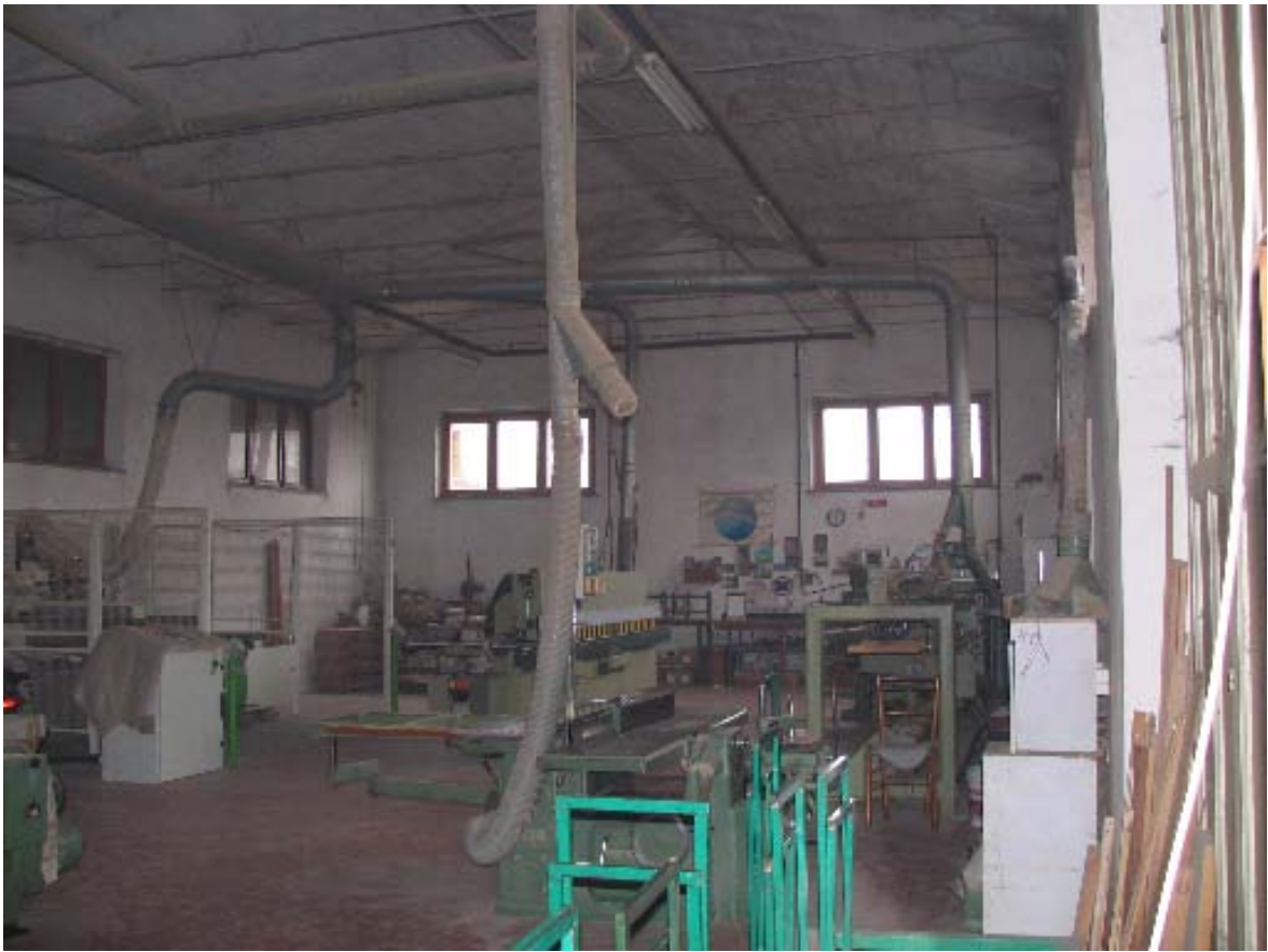
interno falegnameria particella 135 sub 9