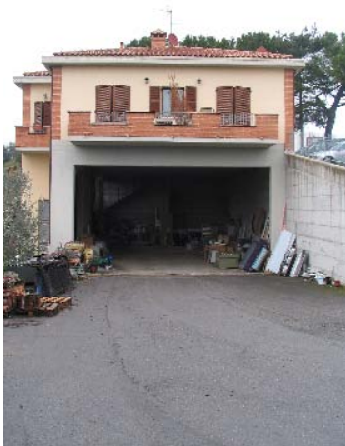
Terrazza sul retro