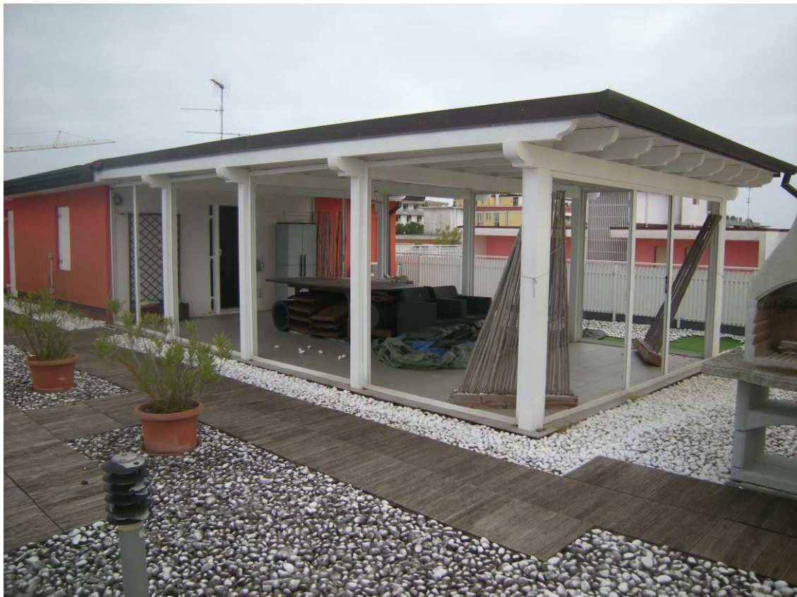
Bibione, via Atlante n. 38 – La terrazza ed il pergolato.