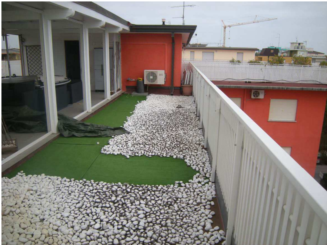
Bibione, via Atlante n. 38 – La terrazza ed il pergolato.