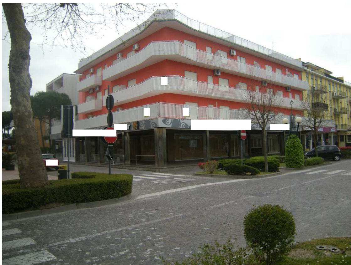
Bibione, via Atlante n. 38 - Il prospetto a nord ed ad est della palazzina.