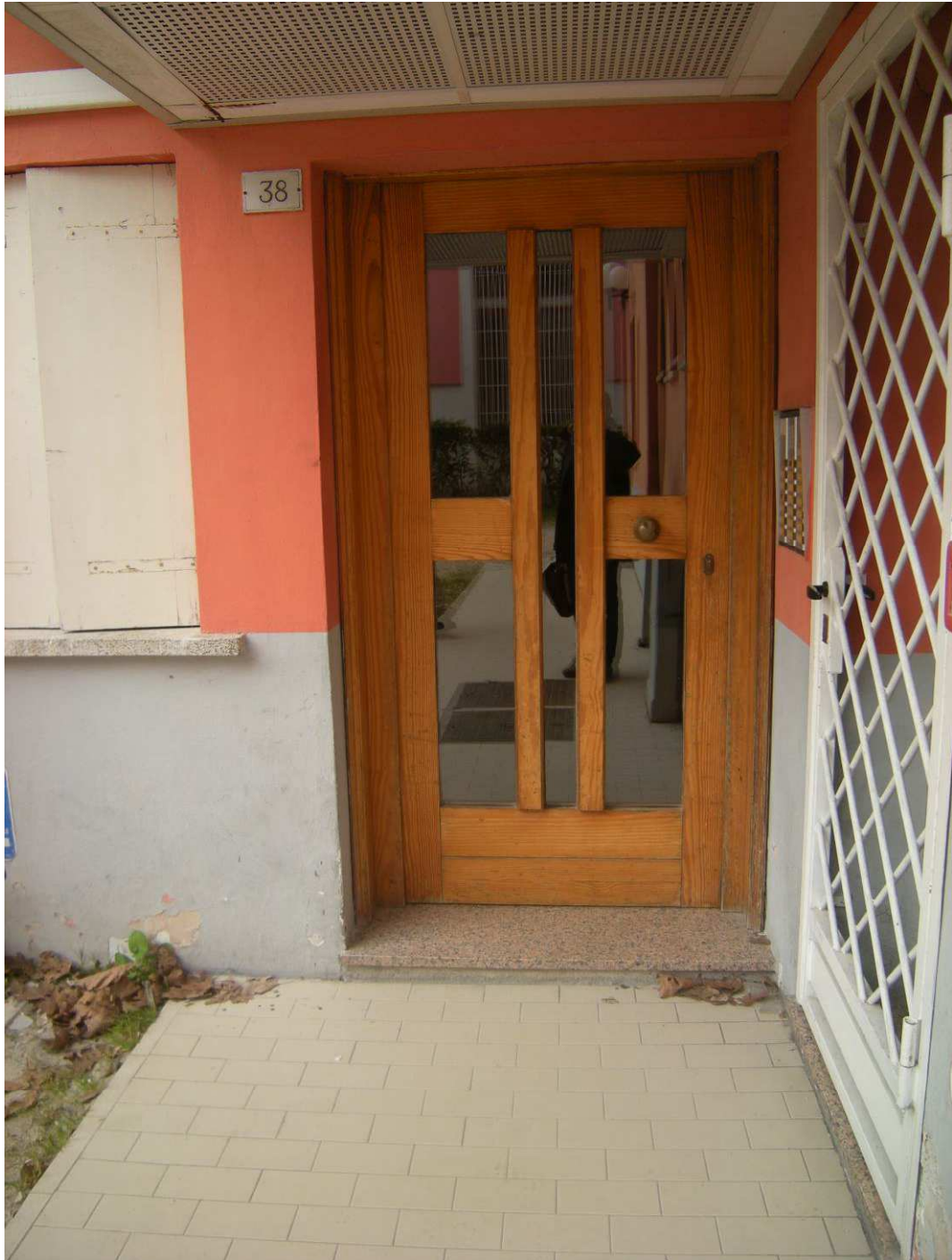
Bibione, via Atlante n. 38 – L'ingresso della palazzina.