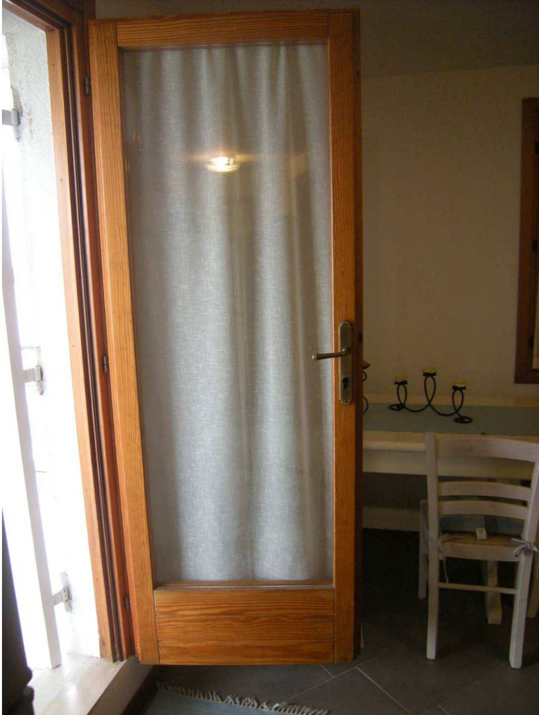
Bibione, via Atlante n. 38 – Particolare dell'infisso.