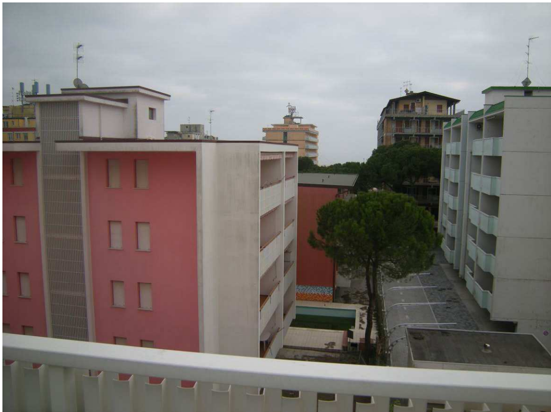
Bibione, via Atlante n. 38 – Il Panorama dalla terrazza dell'immobile.