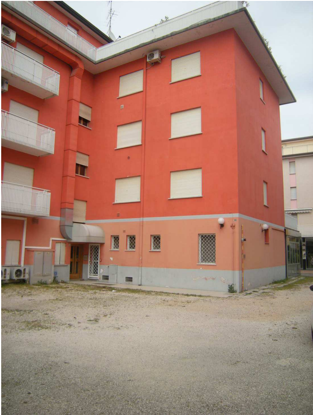
Bibione, via Atlante n. 38 - Il prospetto a sud e ad ovest della palazzina.