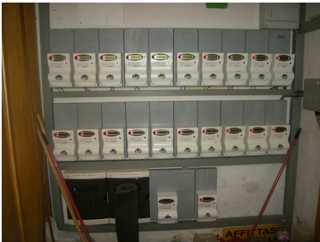
Bibione, via Atlante n. 38 – In alto un particolare dell'impianto elettrico dell'appartamento, in basso i contatori elettrici del condominio ubicati al piano terra.