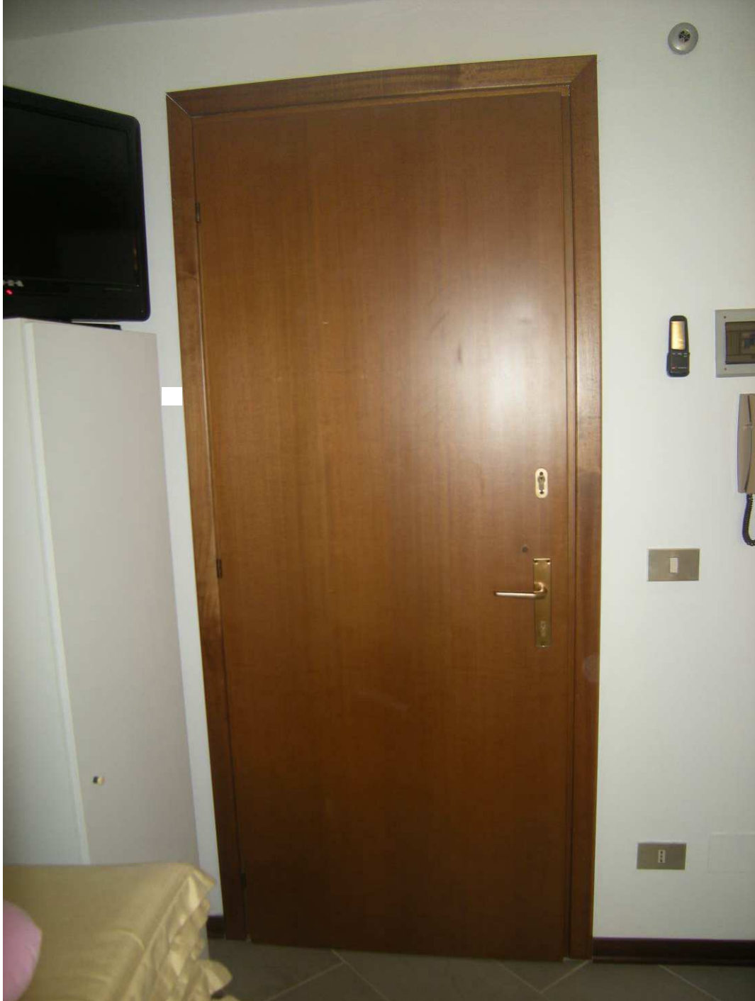
Bibione, via Atlante n. 38 – L'ingresso all'appartamento.