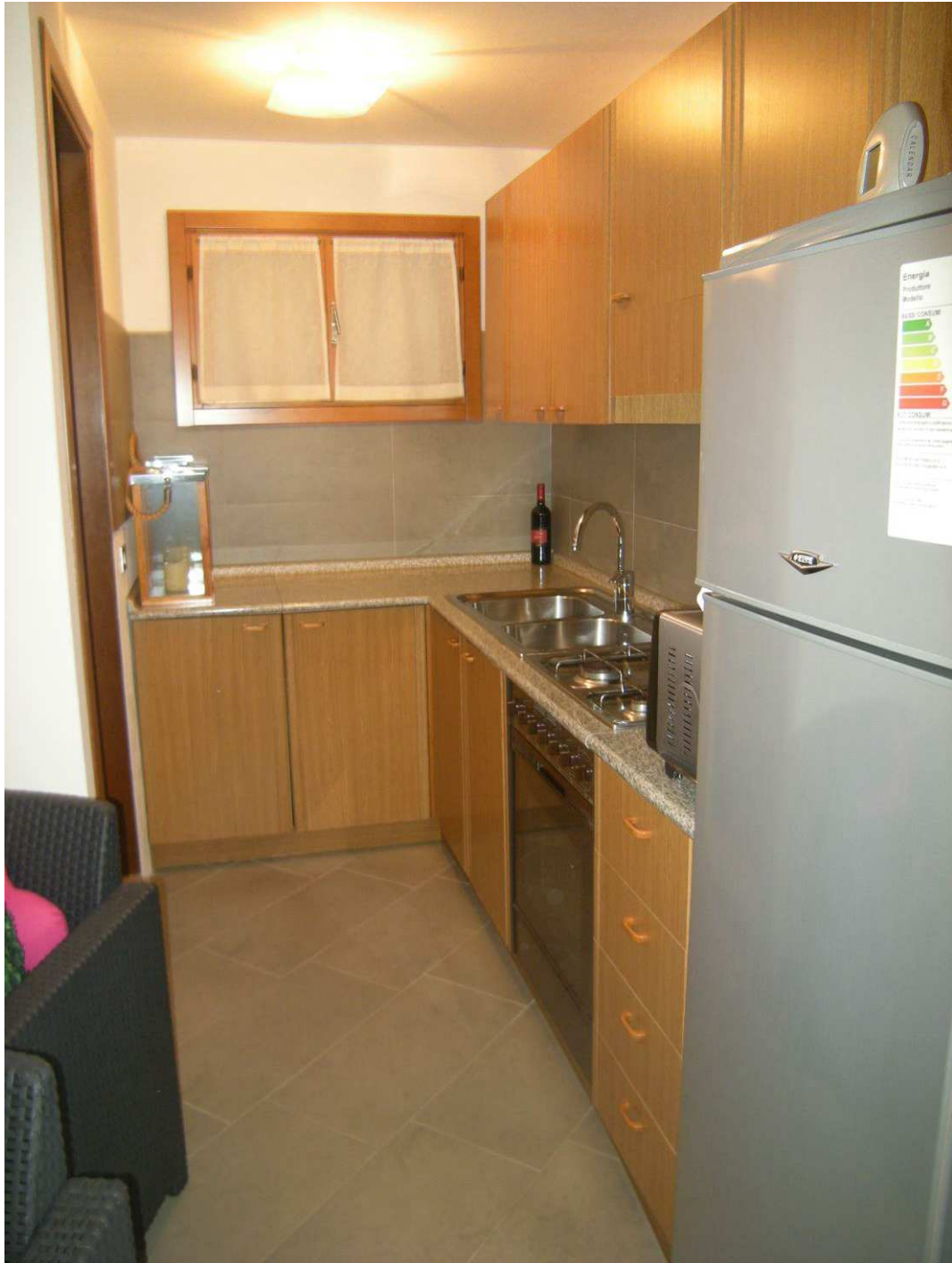
Bibione, via Atlante n. 38 – L'angolo cottura.