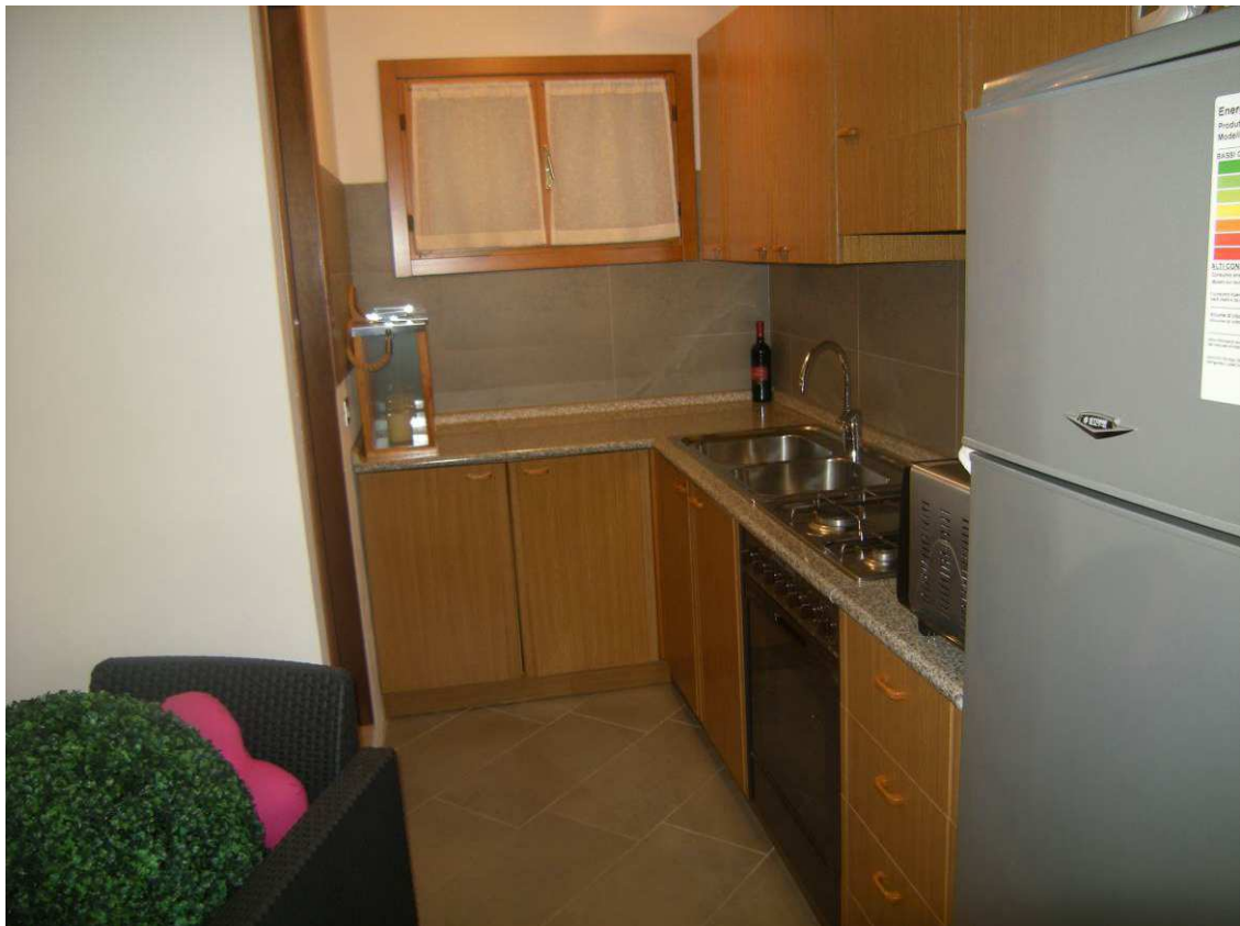
Bibione, via Atlante n. 38 – Il vano 1.