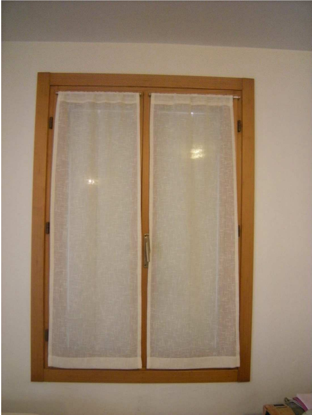
Bibione, via Atlante n. 38 – Particolare dell'infisso.