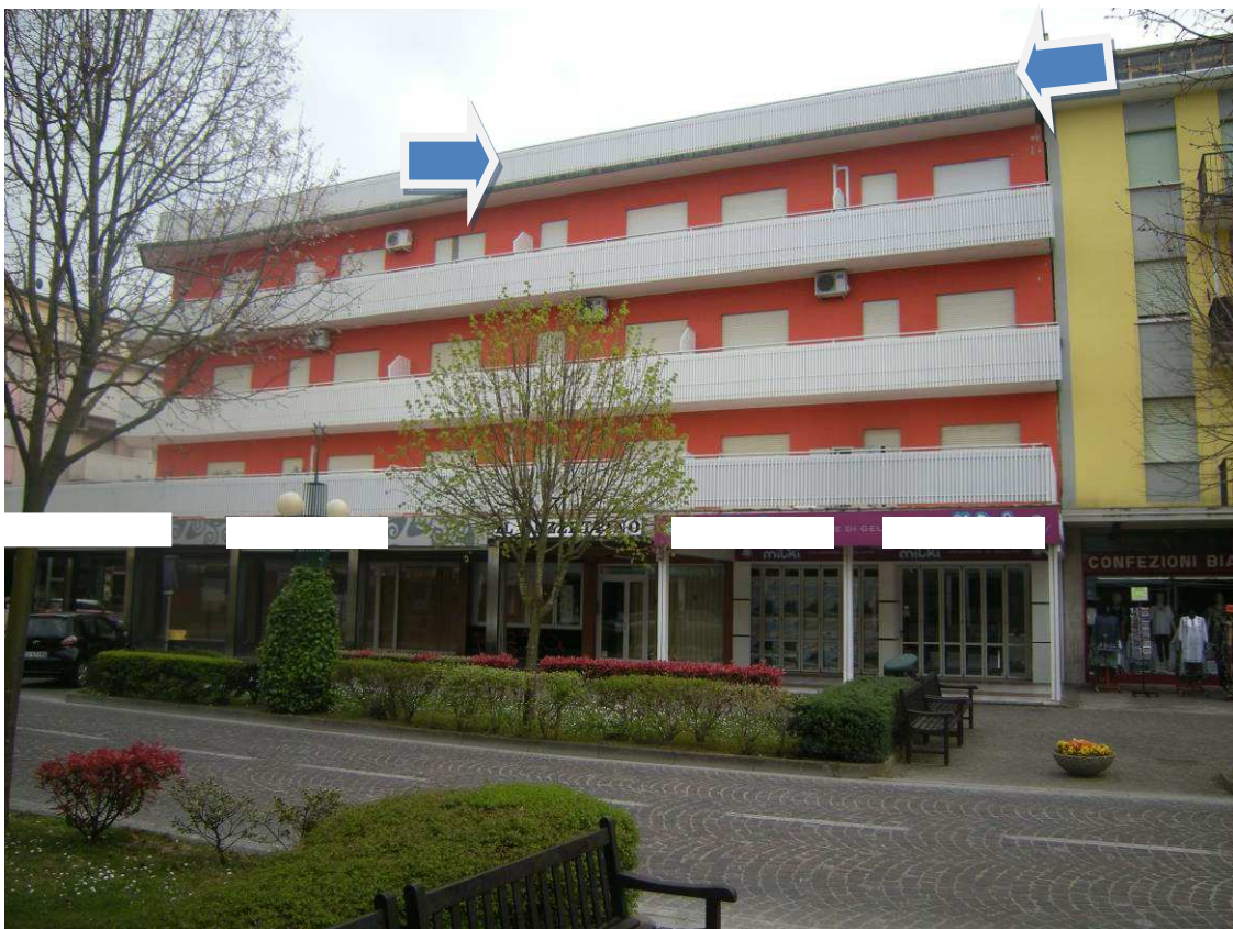
Bibione, via Atlante – viale aurora – Sopra il prospetto sud dell'immobile, sotto quello a nord.