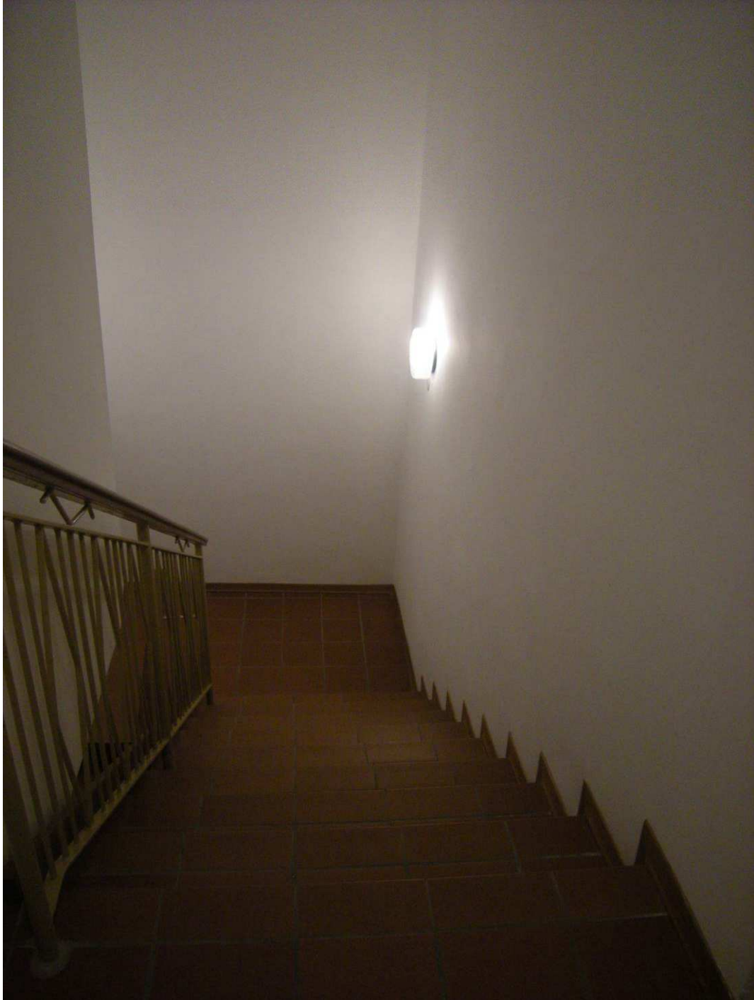
Bibione, via Atlante n. 38 – Il vano scala.