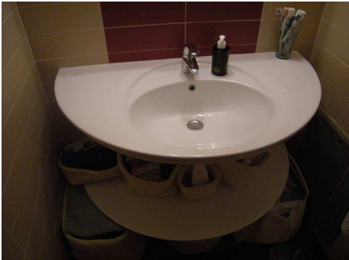
Bibione, via Atlante n. 38 – Il bagno.