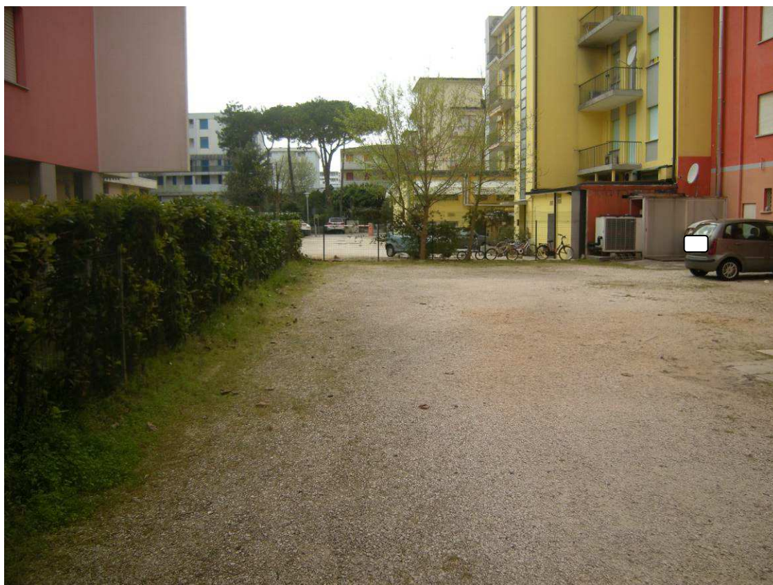
Bibione, via Atlante n. 38 - L'ingresso alla palazzina ed all'area privata antistante.