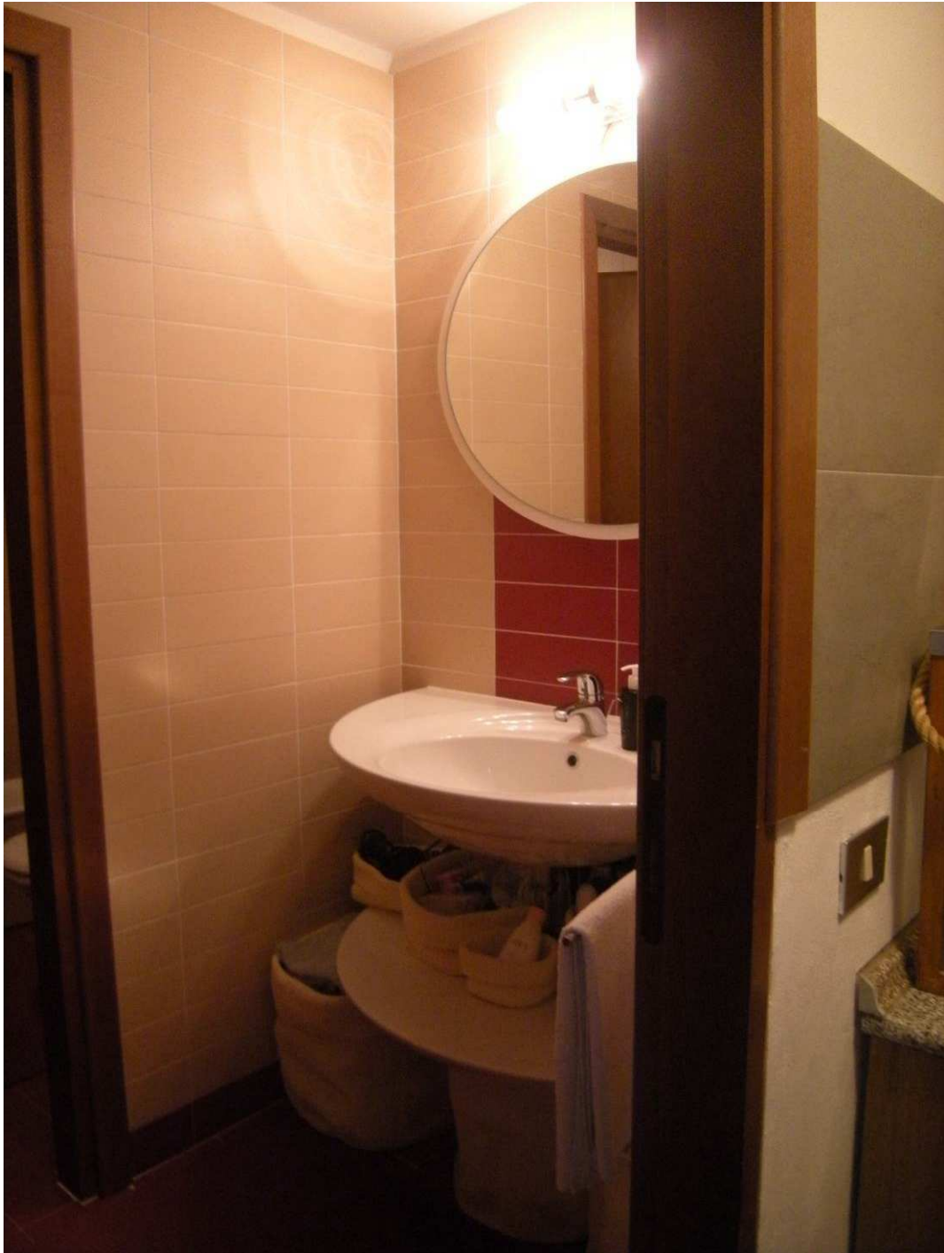
Bibione, via Atlante n. 38 – Il bagno .