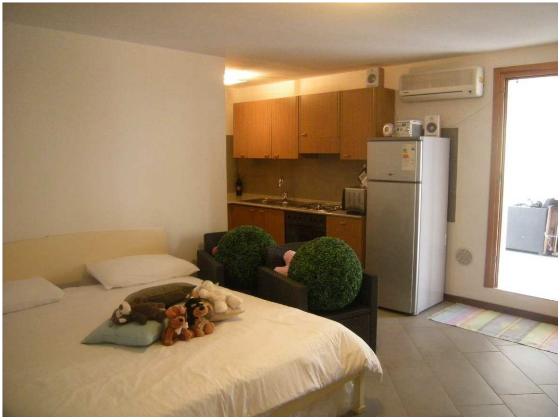
Bibione, via Atlante n. 38 – Il vano 1.