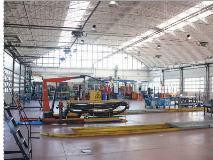
9) compendio di Pordenone - centrale termica 11) compendio di Pordenone - impianto lavaggio