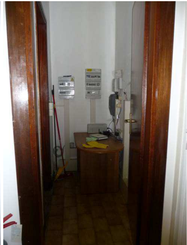
interno negozio – locale antibagno