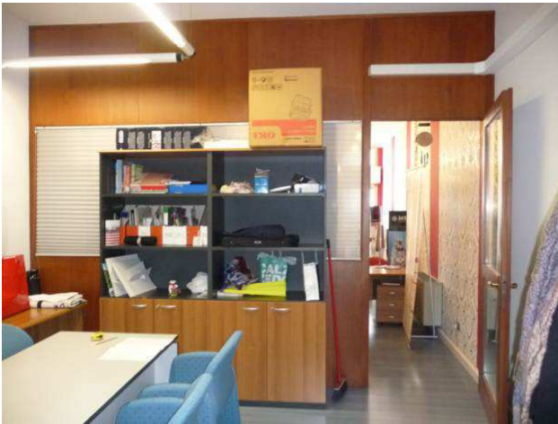
interno negozio – locale secondario