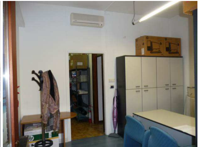
interno negozio – locale secondario