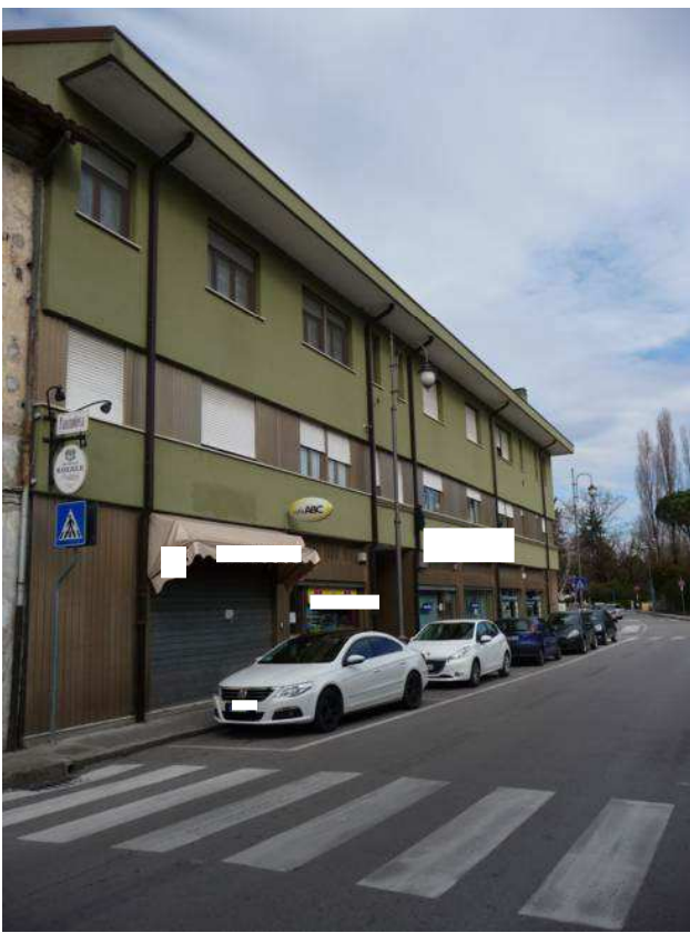
veduta condominio da Piazza del Grano