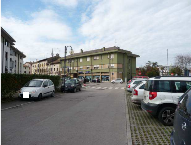
veduta condominio da parcheggio pubblico