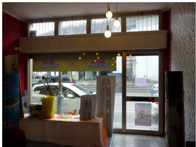
interno negozio – locale principale