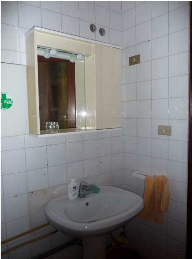
interno negozio – locale bagno