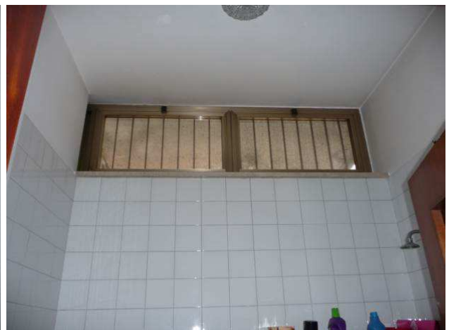
interno negozio – locale fuori bagno