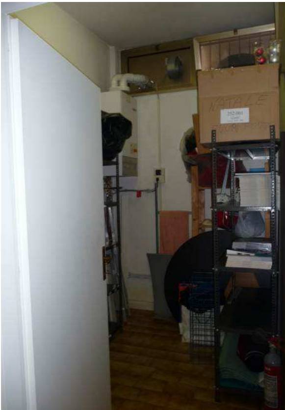
interno negozio – locale ripostiglio