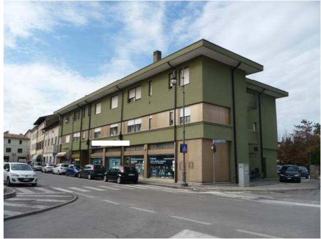
veduta condominio da Piazza del Grano