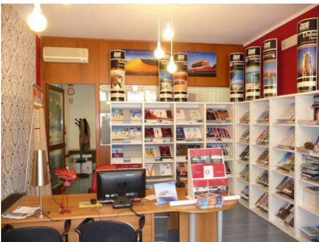
interno negozio – locale principale