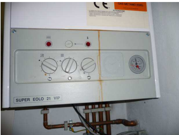
interno negozio – caldaia (ripostiglio)