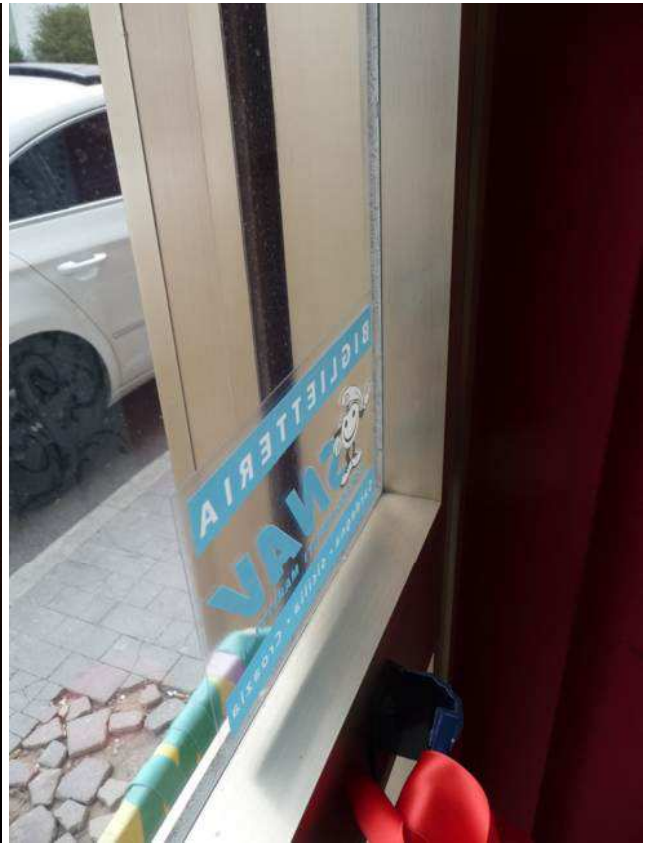
interno negozio – dettaglio serramento