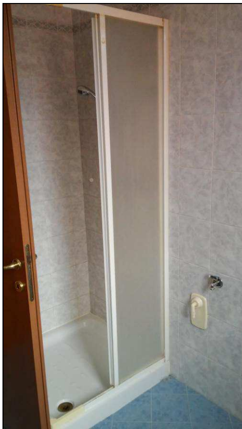
Fig.23: particolare doccia