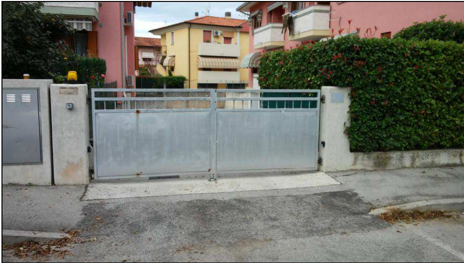
Fig.34: vista esterna garage con accesso da ampio spazio di manovra