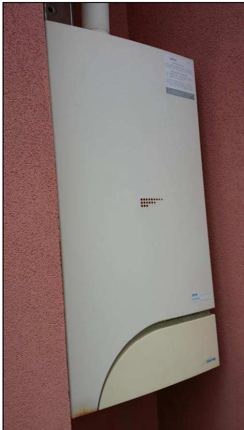
Fig.17: caldaia autonoma in nicchia del terrazzo