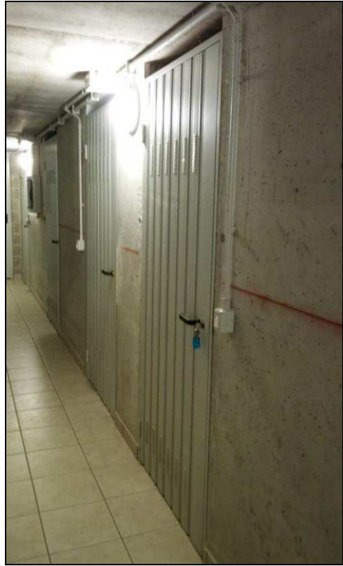
Fig.30: vista entrata cantina piano interrato