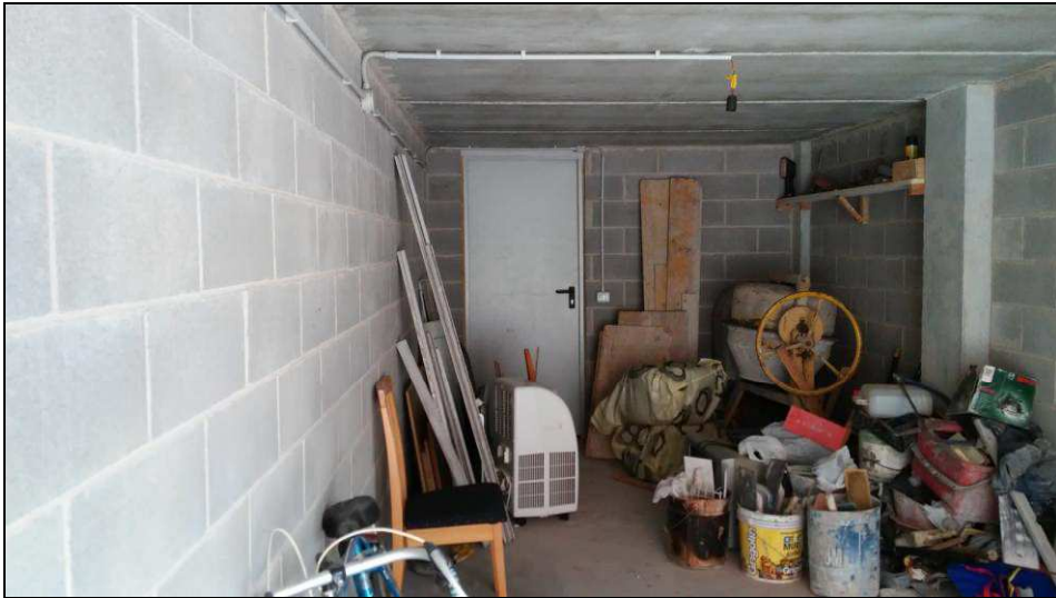
Fig.35: vista interna garage

P.I. : 01447310937 - C.F.: FLP MRZ 72A21 G888Q