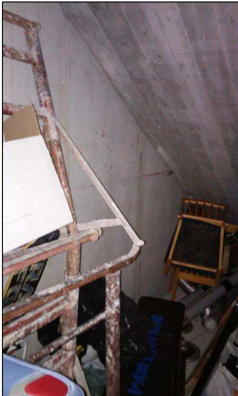
Fig.31: vista interno cantina