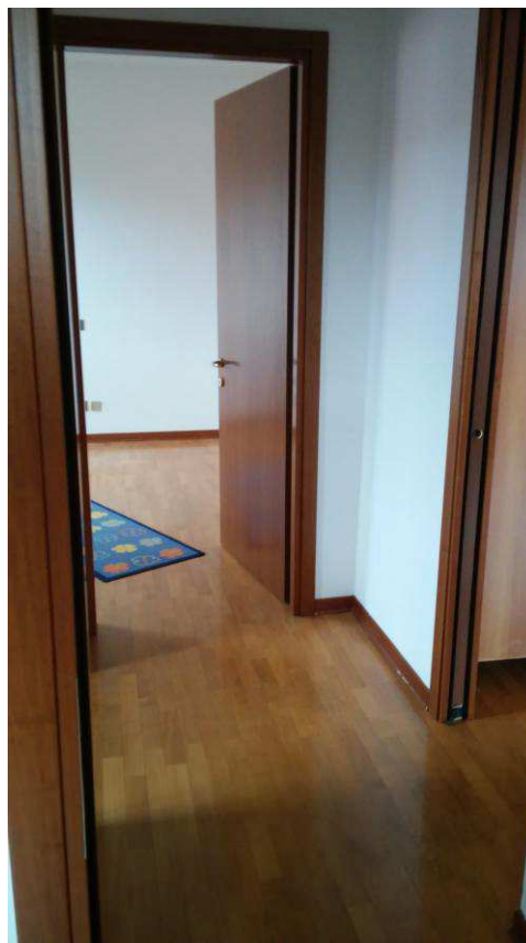
Fig.18: disimpegno zona notte