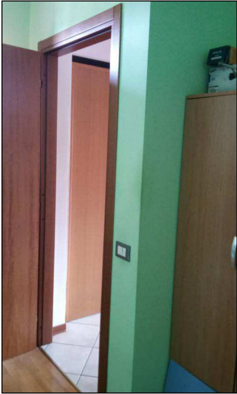
Fig.29: vista ingresso da lavanderia - ripostiglio