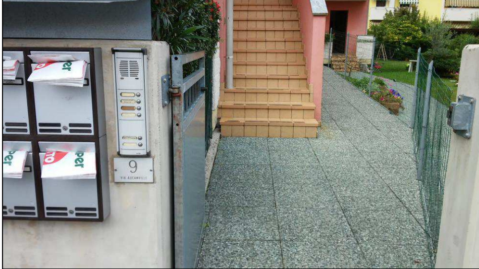
Fig.4: vista scalinata d'ingresso comune