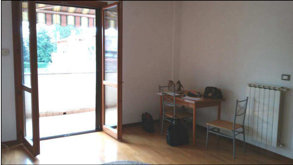
Fig.10: vista unico termostato ambiente in cucina - soggiorno