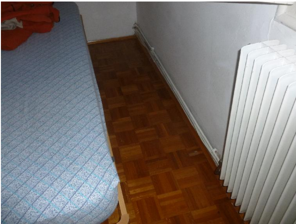
Foto n. 9 – Interni camera n. 1 con pavimentazione in parquette di legno, termosifoni in acciaio ed impianto termico fuori traccia.