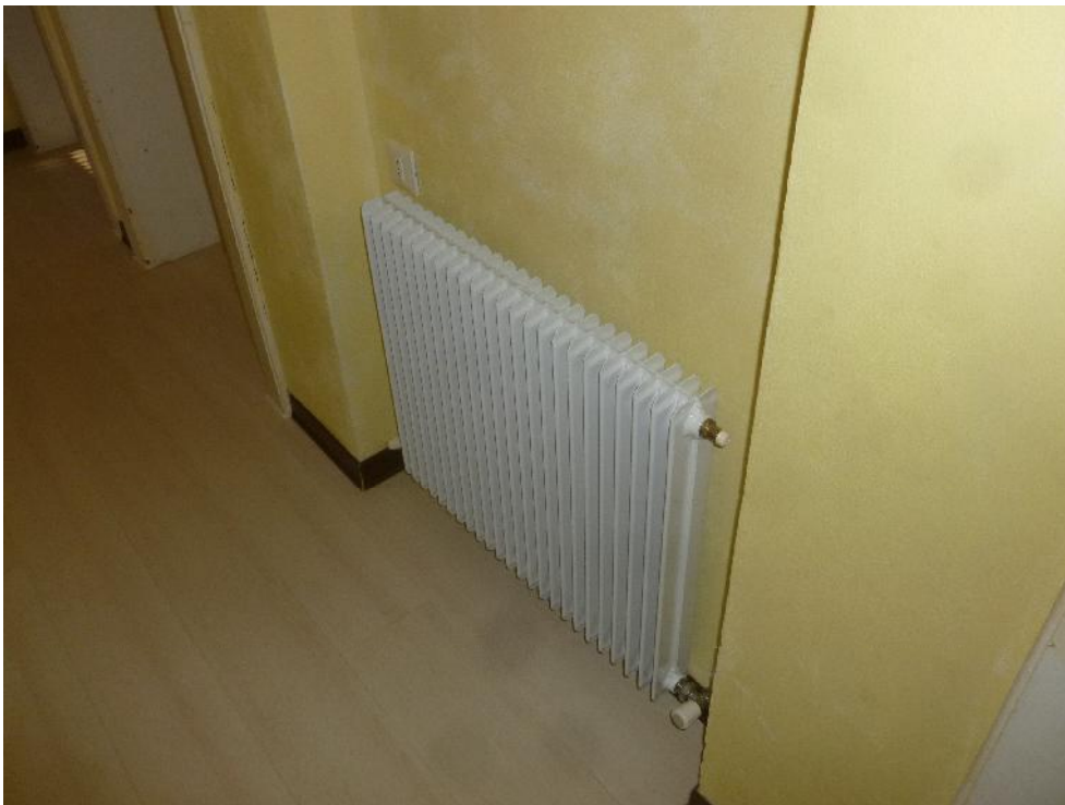
Foto n. 7 – Corridoio con dettaglio della pavimentazione e dell’impianto termico.