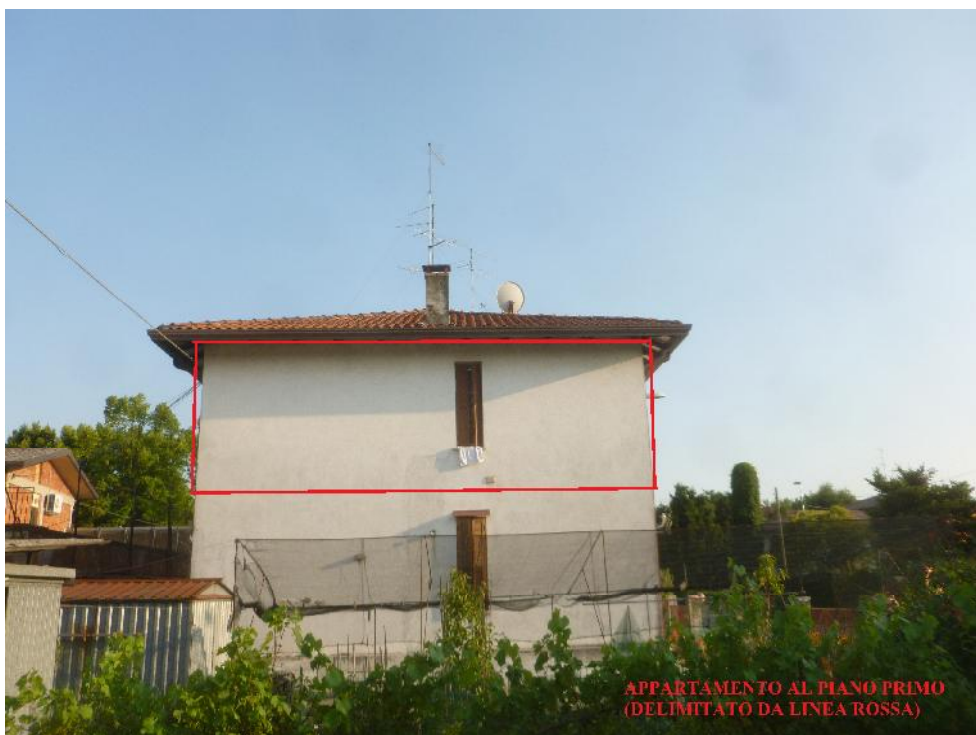
Foto n. 4 Facciata della palazzina lato nord fotografata da fondo privato. L'appartamento è al piano primo, delimitato da linea rossa.