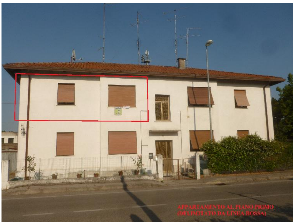
Foto n. 3 – Facciata della palazzina da via San Vito ( lato ovest ). L'appartamento è al piano primo, delimitato da linea rossa.